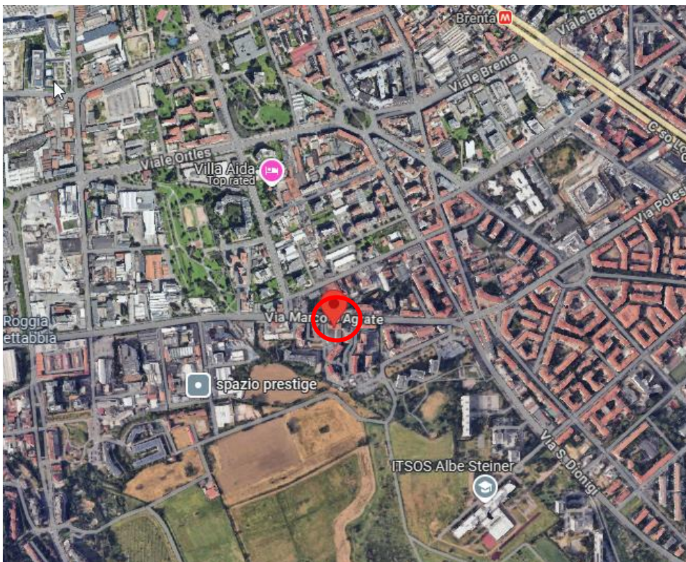
vista dall'alto da google maps

Servizi offerti dalla zona: media/buona presenza di servizi, scuola materna, supermercati e negozi al dettaglio.