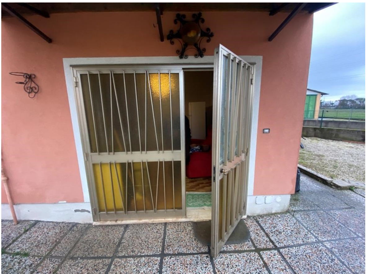
Ingresso garage e pensilina