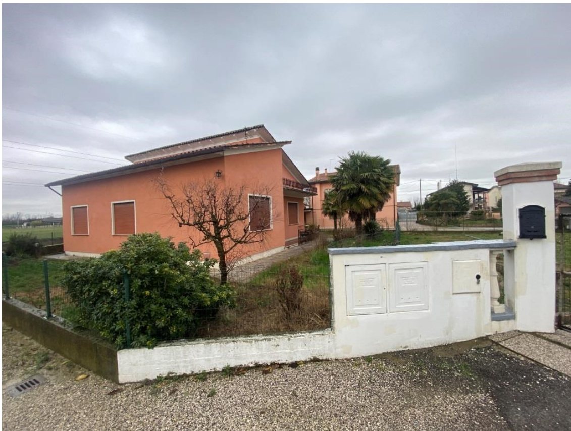
Esterno via Olmo Spinea 5/A