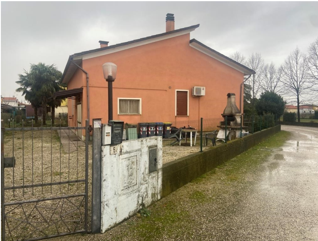
Esterni via Olmo Spinea 5/A