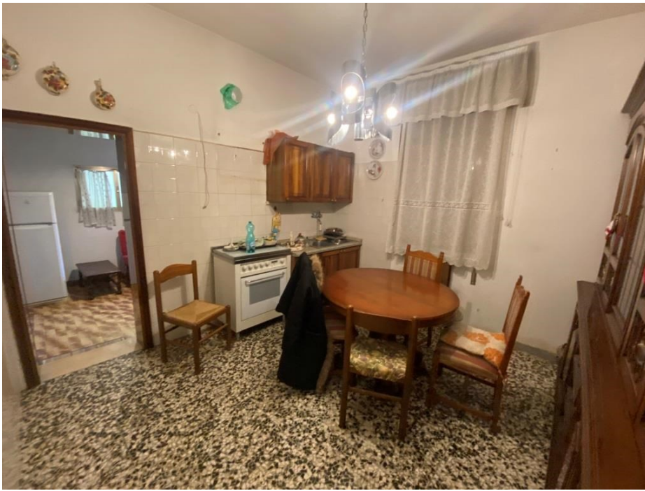
Cucina e porta di comunicazione con garage (sub 4)