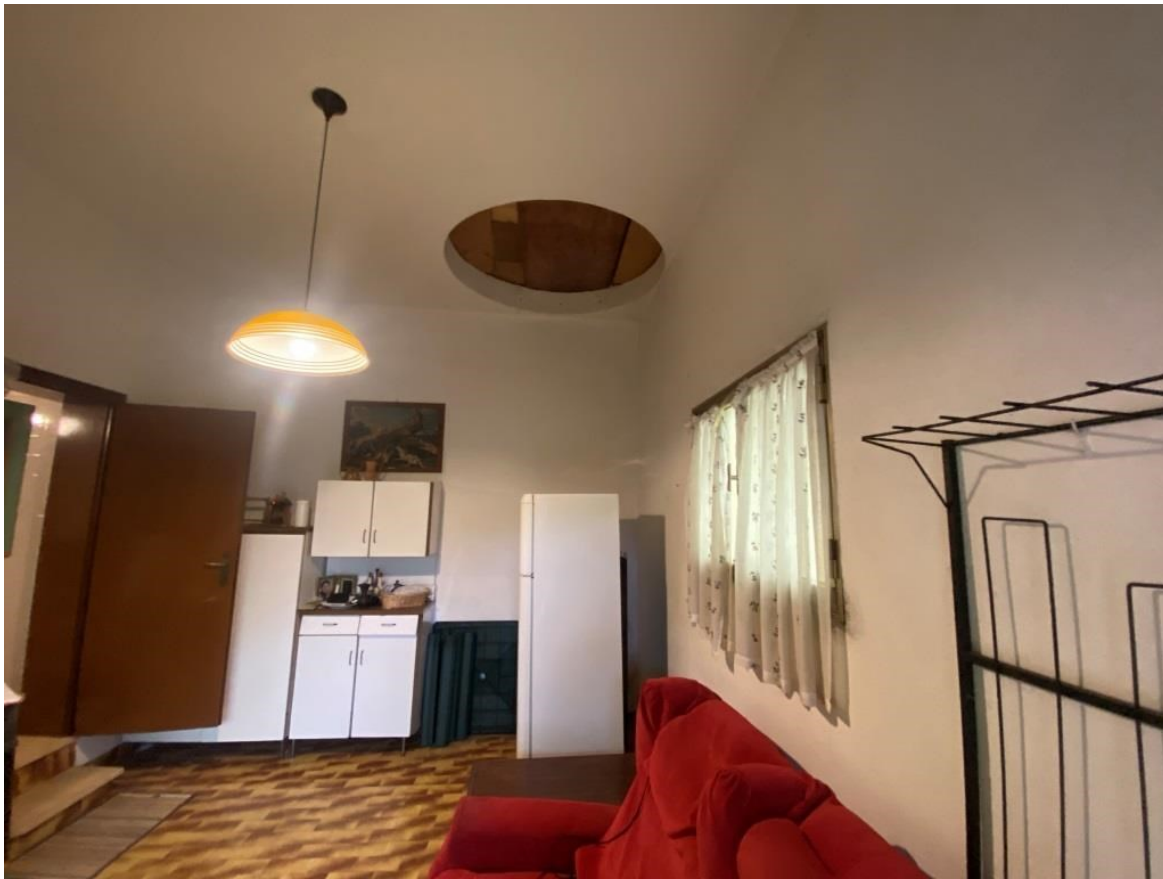
Garage sub 4