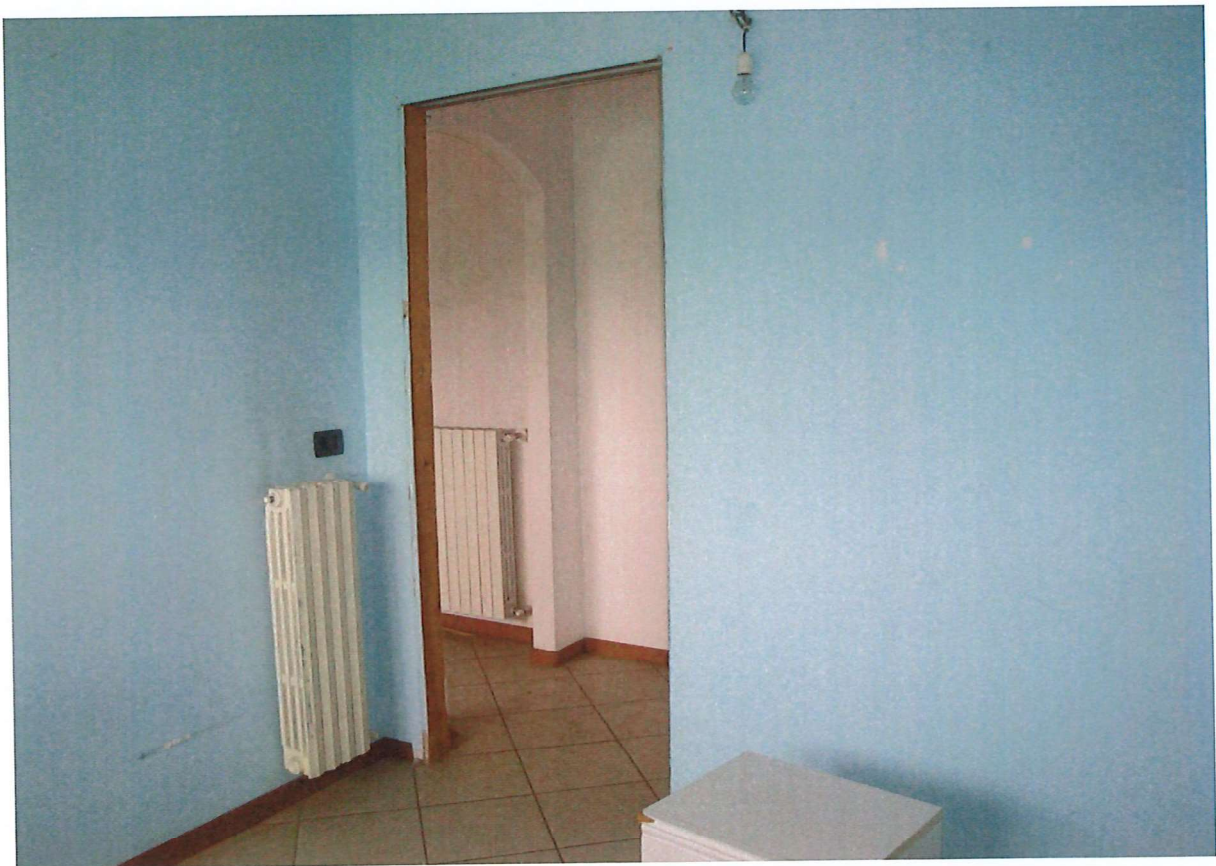
R.G.E. 85/2024 G. E. Dott.ssa M. Galioto Pozzo D' Adda, Via XXV Aprile n.°8-10, piano S1, Foglio 2, mapp. 435, sub. 15 Prospetti interni: il corridoio disimpegno e la seconda camera da letto