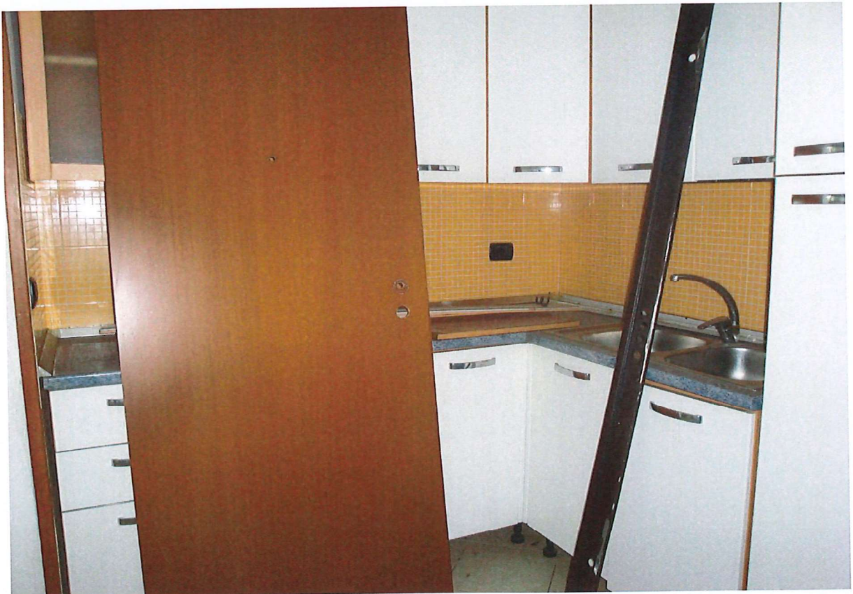
R.G.E. 85/2024 G. E. Dott.ssa M. Galioto Pozzo D' Adda, Via XXV Aprile n.°8-10, piano S1, Foglio 2, mapp. 435, sub. 15 Prospetti interni: il soggiorno e la cucina