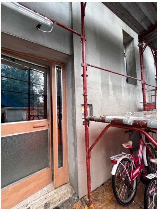
Immagine 6. L'ingresso alla scala A.