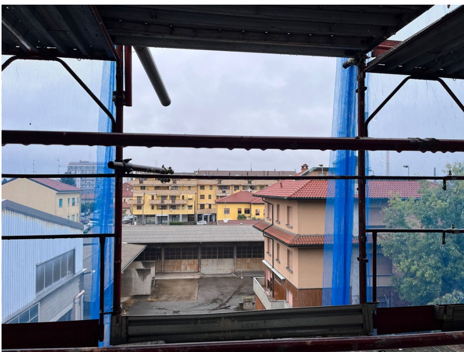
Immagine 14. Vista del cortile dalla finestra della cucina, attraverso il ponteggio.