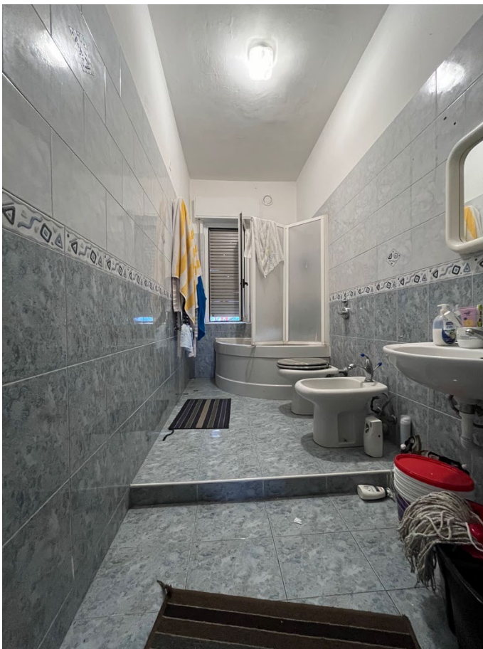
Immagini 18. Il bagno; si nota la presenza di un gradino .