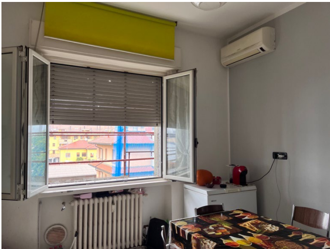
Immagini 11 e 12. La cucina che si affaccia sul cortile. Si nota l'unità interna dell'impianto di condizionamento.