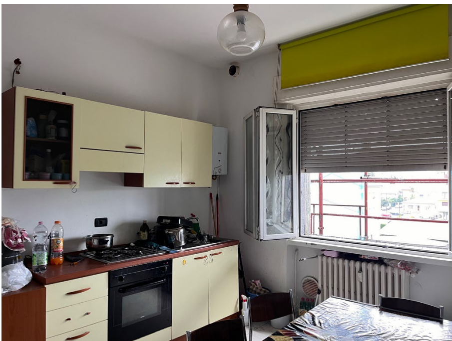
Immagine 10. La cucina. Si nota la presenza verso la parete esterna dello scaldacqua.

Sull'ingresso si apre anche un ripostiglio ove è posizionata con allacciamenti artigianali la lavatrice.