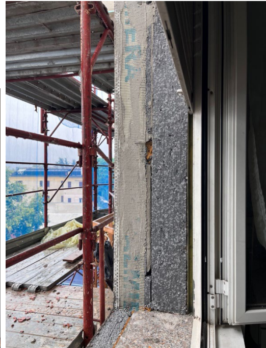
Immagine 13. Dettaglio del rivestimento a cappotto.