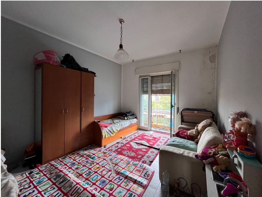
Immagine 17. Lq seconda camera. Si notano alcune infiltrazioni nello spigolo a destra rispetto alla porta finestra. La porta finestra conduce ad un balconcino diviso mediante un divisorio rispetto alla proprietà confinante.