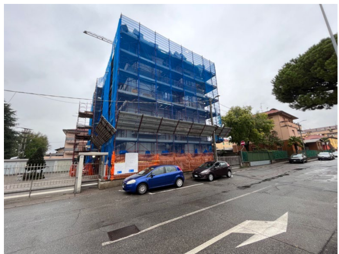
Immagini 1 e 2. Il fabbricato visto dall'esterno; il ponteggio è relativo a lavori di efficientamento energetico mediante la realizzazione di un cappotto esterno.