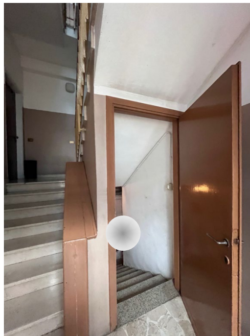
Immagine 7. L'ingresso, con la partenza della scala che conduce ai piani superiori e quella che porta al piano delle cantine.