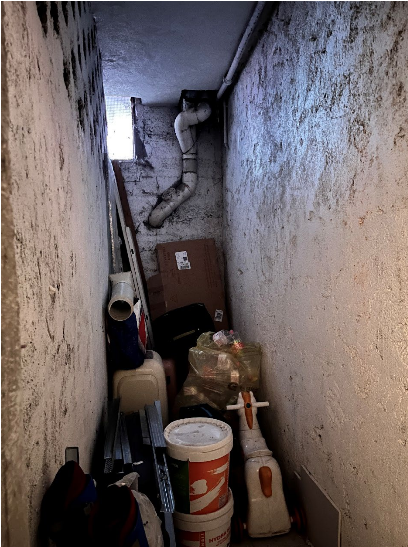
Immagine 19.a. La cantina.