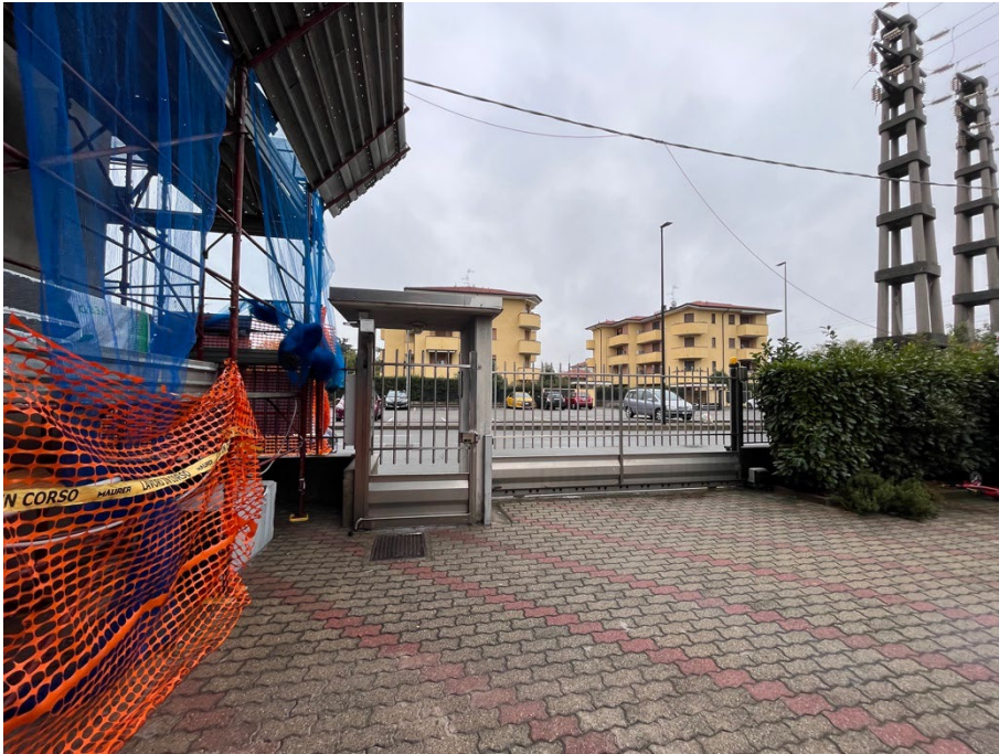
Immagine 5. Vista dell'ingresso al cortile dall'interno.