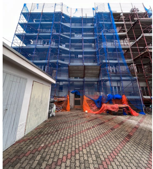
Immagini 3 e 4. Il fabbricato. Fronte di accesso dal cortile; il fabbricato si compone di due scale. Nell'immagine 5 è inquadrata la scala A.