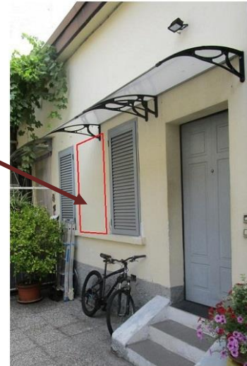
Fotografia stato di fatto rilevato. sopralluogo 3/7/2023

Estratto tavola 2 – stato di progetto piano terra – alloggio 11 - DIA 312455/2006