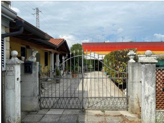
vista ingresso carroia dell'immobile oggetto di E.I.