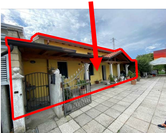
vista cortile e prospetto est dell'abitazione