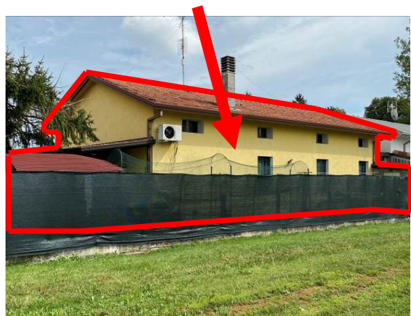
vista prospetto lato ovest abitazione