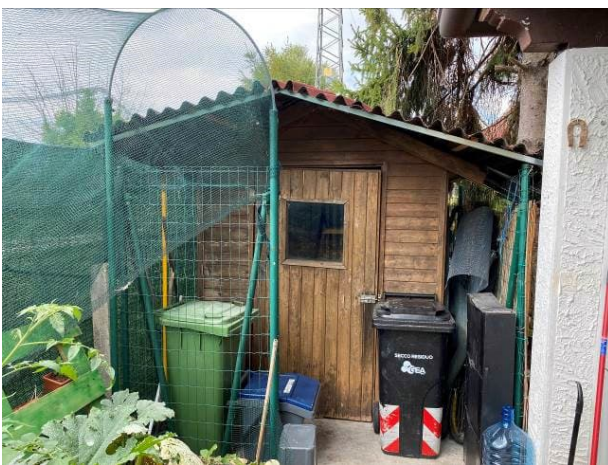
vista casetta in legno (considerata arredo da giardino)