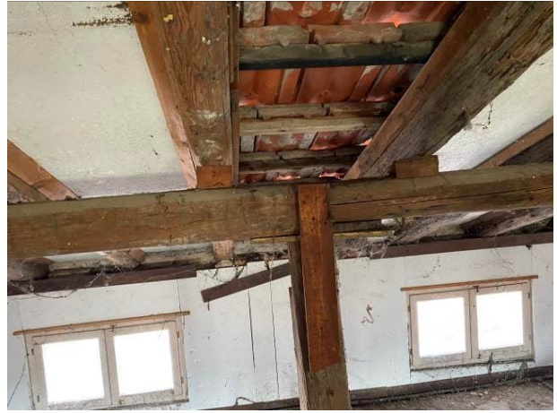
viste degrado della copertura