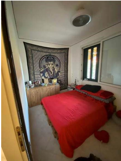
vista prima cameretta