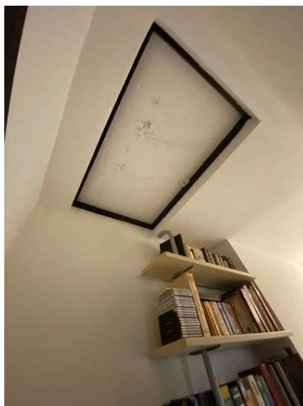
vista botola di accesso alla soffitta collocata nel corridoio