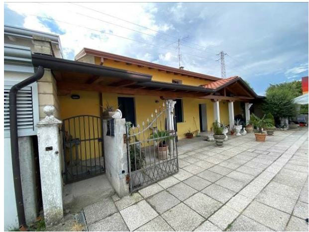
vista portico abusivo