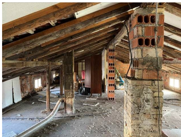
viste interne soffitta esistente