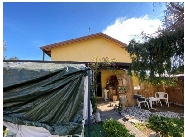
vista prospetto lato nord