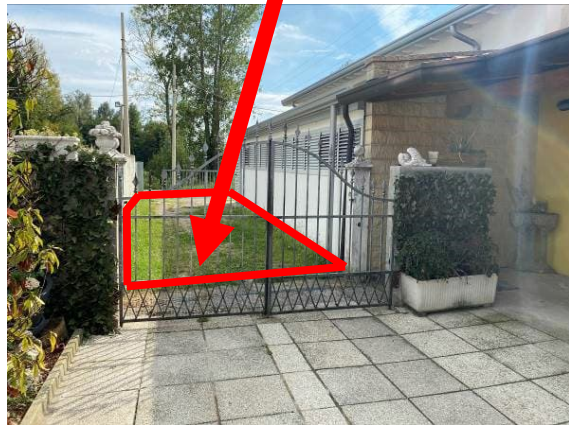
particolare servitù attiva di transito attraverso il mappale 387 del foglio 26 di Pordenone di proprietà terzi per accedere al fabbricato d'abitazione