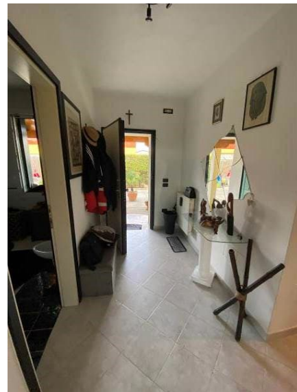
viste interne ingresso