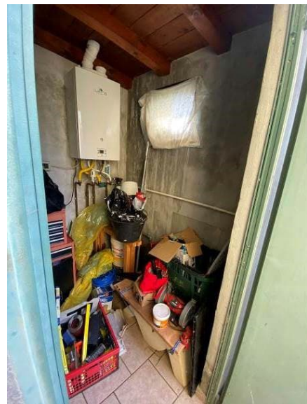
vista interna ripostiglio/centrale termica