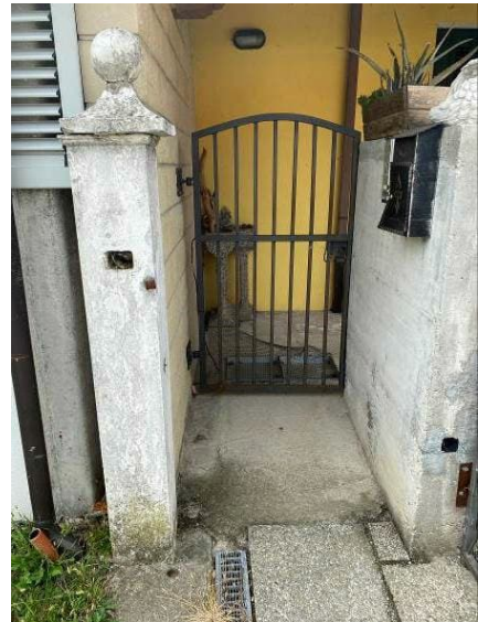
vista ingresso pedonale dell'immobile oggetto di E.I.