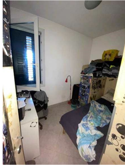
vista seconda cameretta