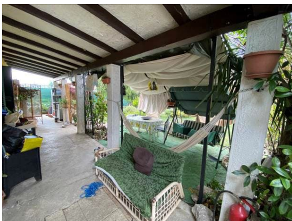
vista tettoia esterna lato nord