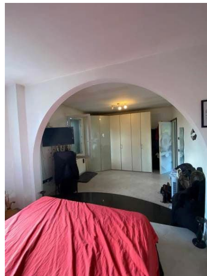
viste camera matrimoniale