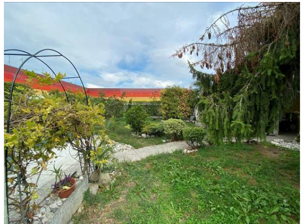
viste interne giardino lato nord senza l'autorimessa crollata/inesistente