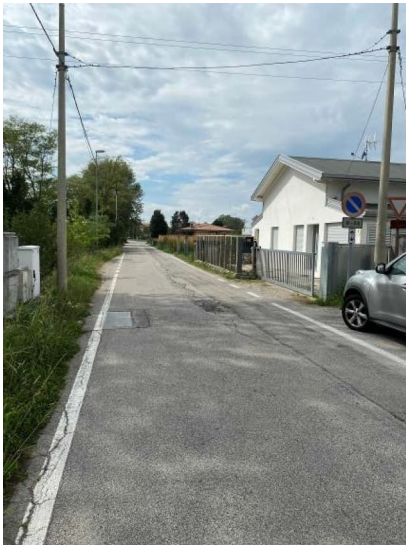
vista esterna fronte strada di via Fornace

servitù di transito sul mappale 387 del foglio 26 di Pordenone di proprietà terzi