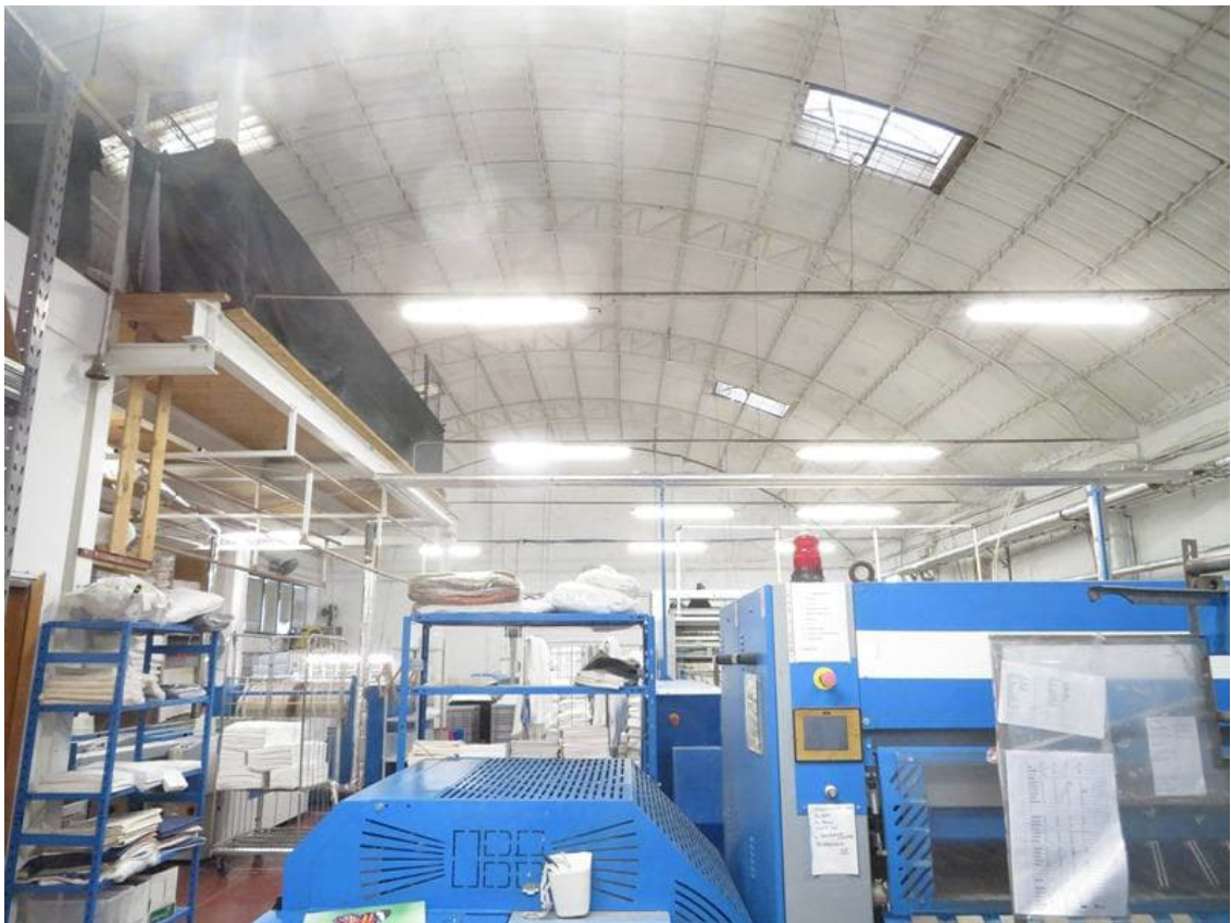
Vista interna da sud verso nord