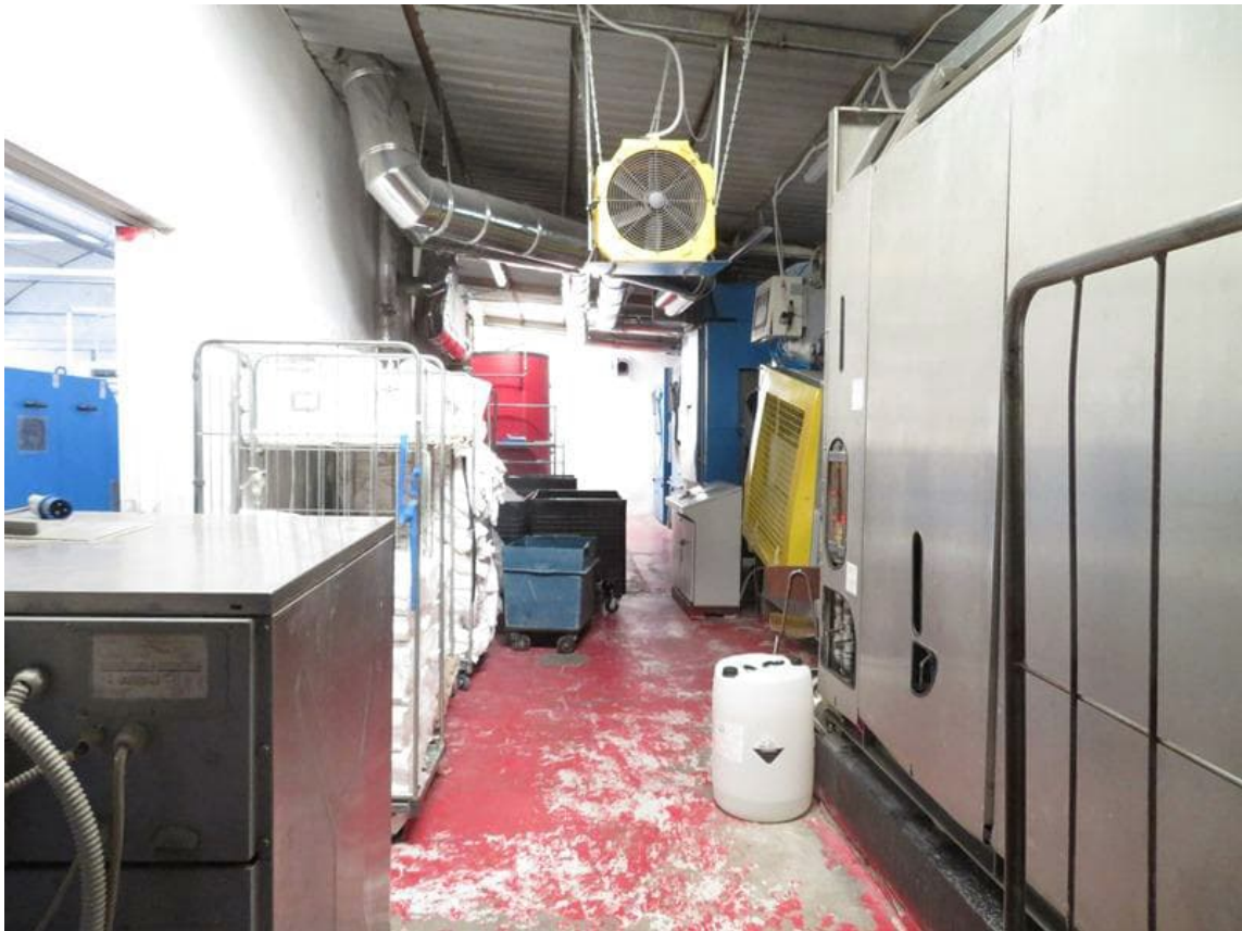
Vista interna da sud verso nord