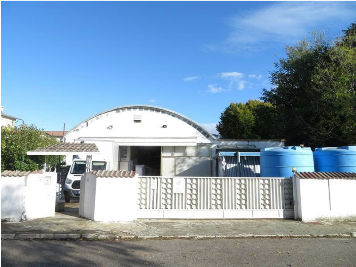
Vista del fabbricato