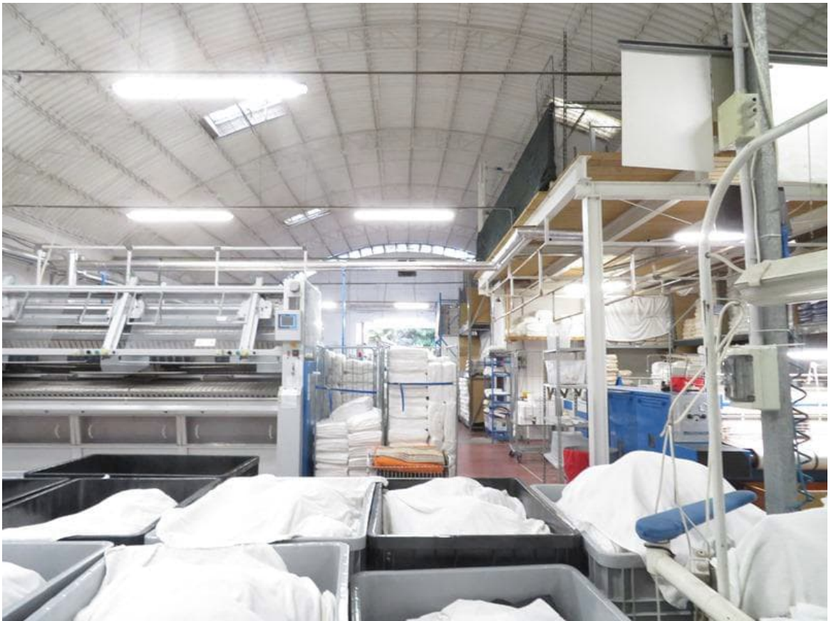
Vista interna da nord verso sud