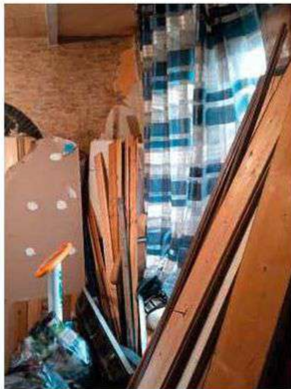
Interno - Foto 14 e 15_Soggiomo