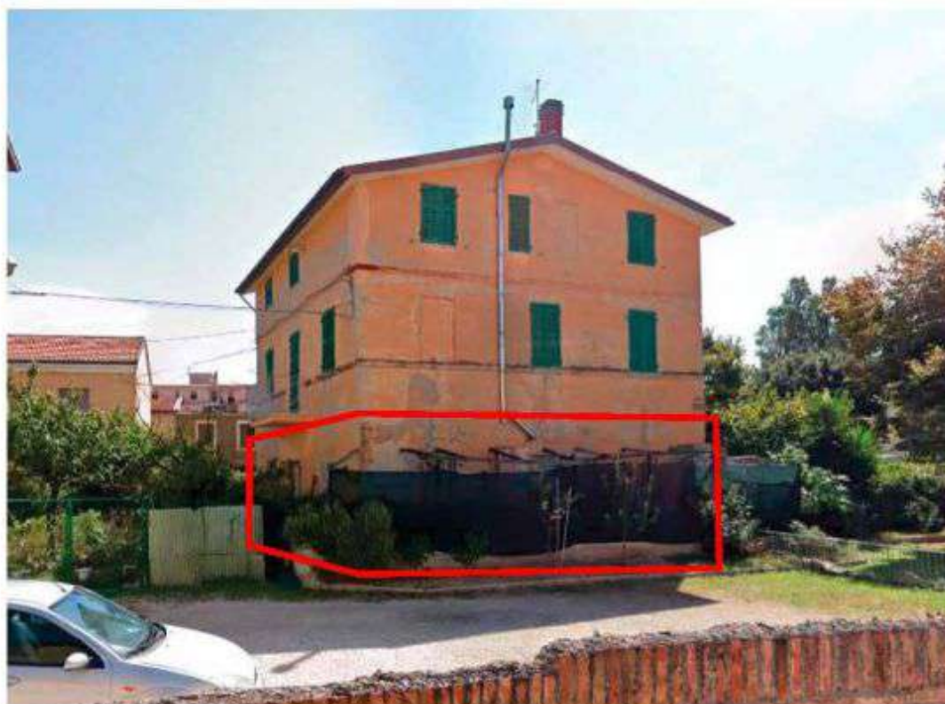
Esterno - Foto 2_vista lato Nord