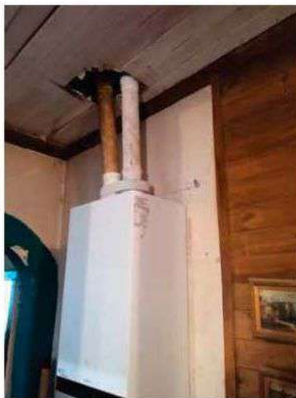
Interno - Foto 19_Caldaia