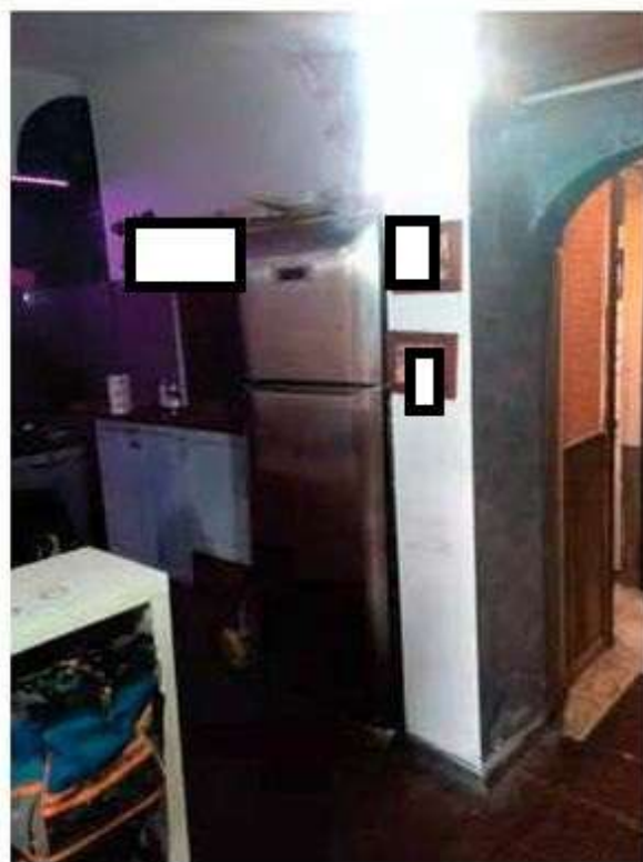
Interno - Foto 12 e 13_Cucina