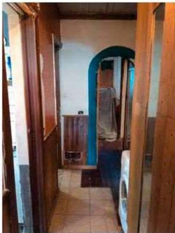
Interno - Foto 10 e 11_Ingresso e disimpegno