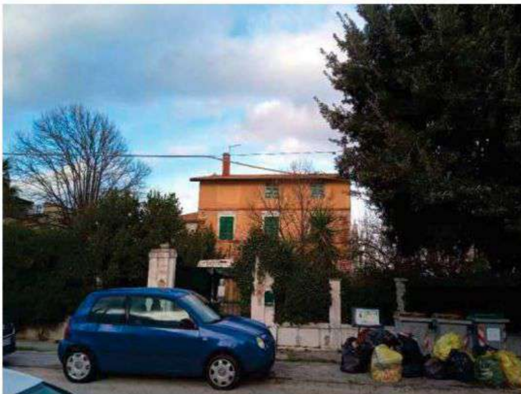
Esterno - Foto 1_Fronte su via Flaminia