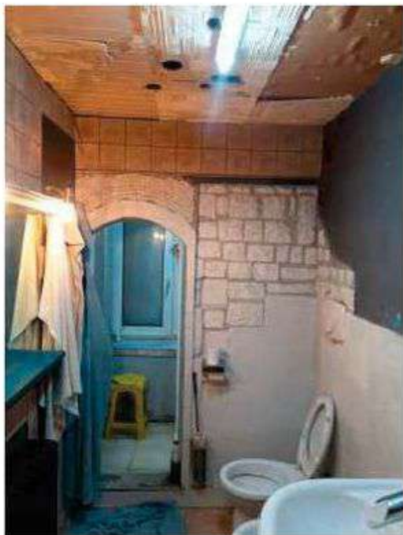
Interno - Foto 18_Bagno