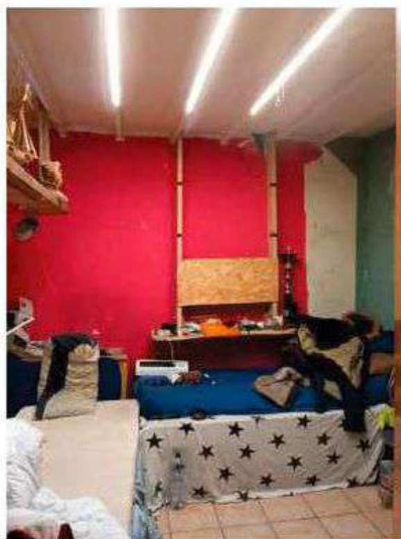
Interno - Foto 17_Camera 2