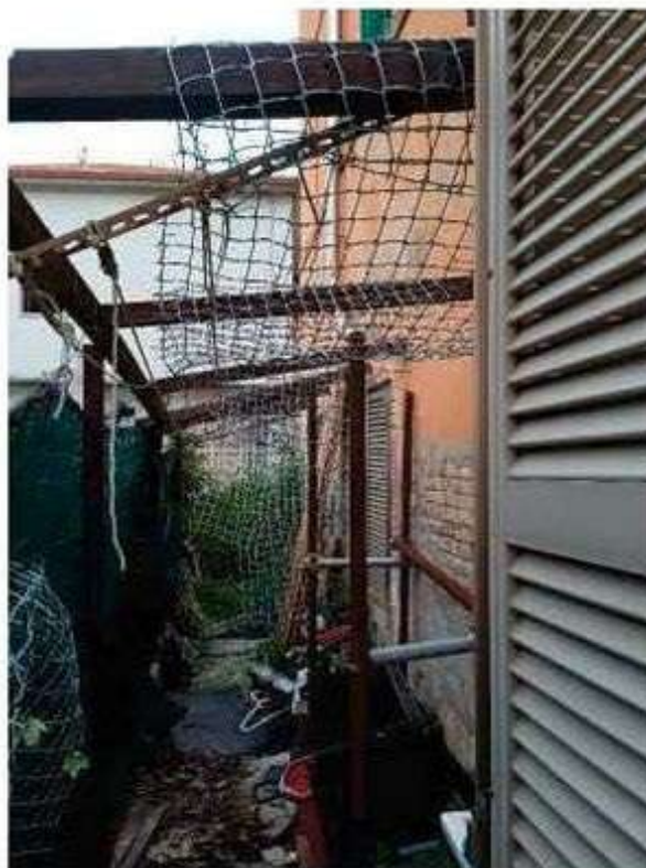
Esterno – Foto 5, 6, 7 e 8_Corte di proprietà