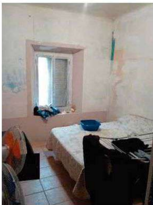
Interno - Foto 16_Camera 1