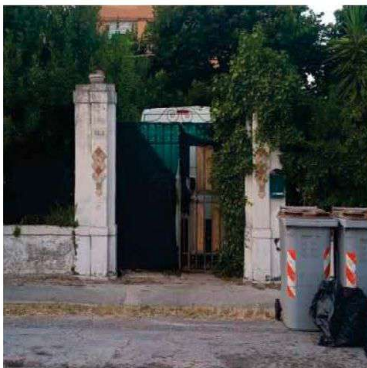
Esterno - Foto 4_Accesso carrabile da via Flaminia