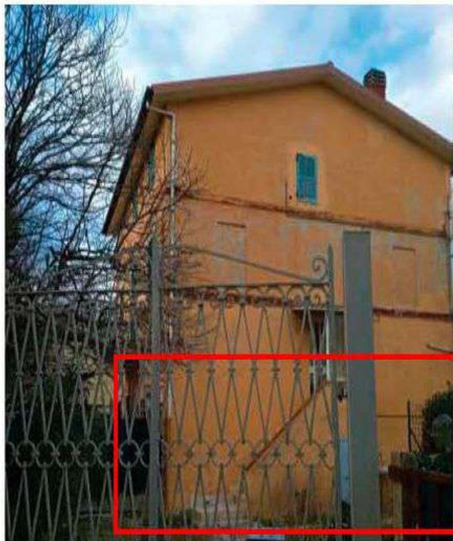
Esterno - Foto 3_vista lato Sud-Est