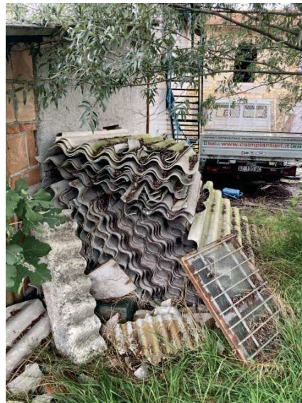
particolare eternit a terra da smaltire