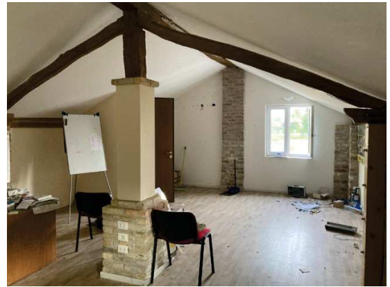
viste interne locale deposito ristrutturato per il "ricavo di un ufficio" privo di requisiti di agibilità