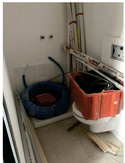
viste interne bagno con lavori di costruzione sospesi