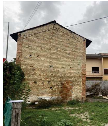
prospetto lato Ovest