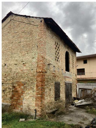
prospetto lato Sud