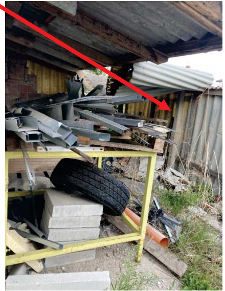
prospetto lato Sud del deposito esistente compresa la porzione di fabbricato abusivo da demolire e tetto in eternit da rimuovere e smaltire