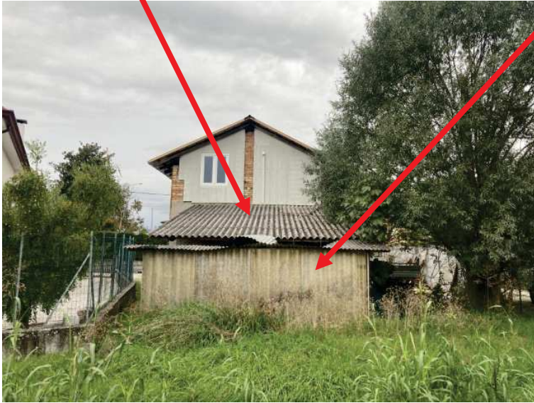
porzione di fabbricato abusivo da demolire e smaltire