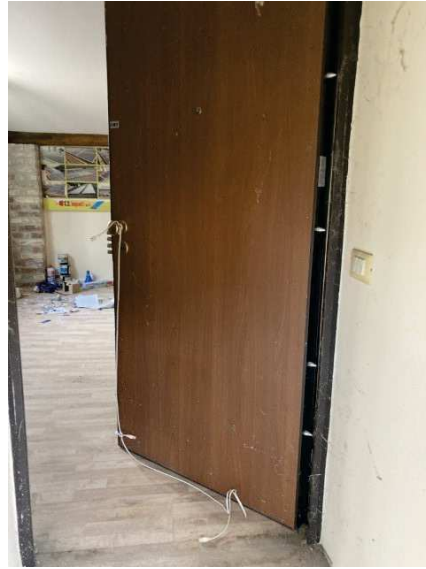
viste ingresso deposito al primo piano