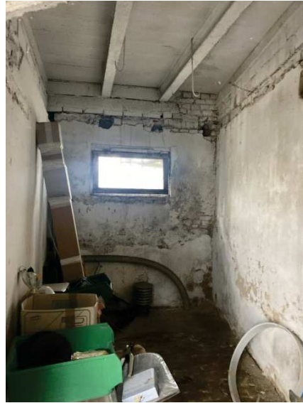
viste interne depositi al piano terra