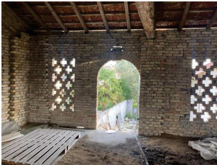
viste interne deposito al primo piano