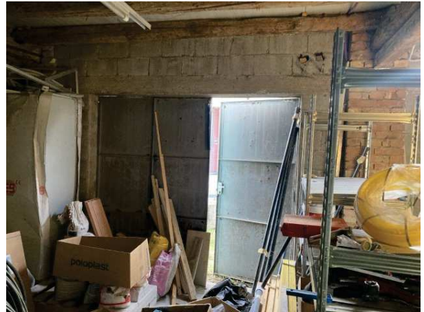
viste interne del deposito al piano terra