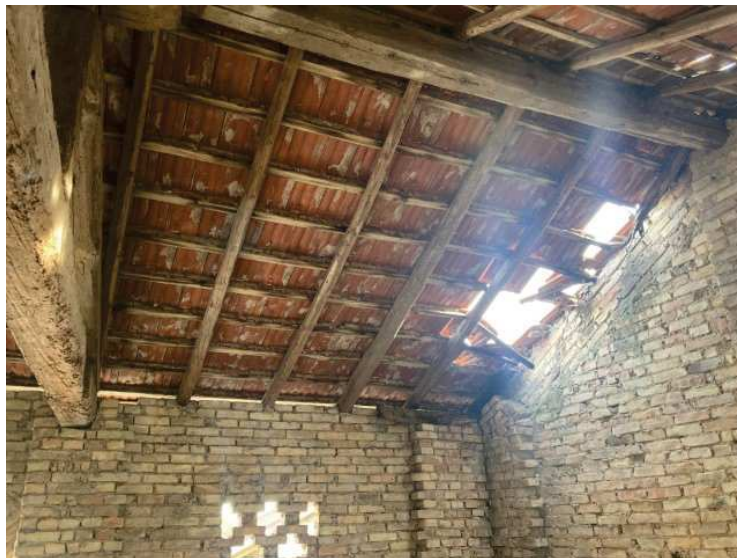
particolare parte di tetto crollato nel deposito al primo piano