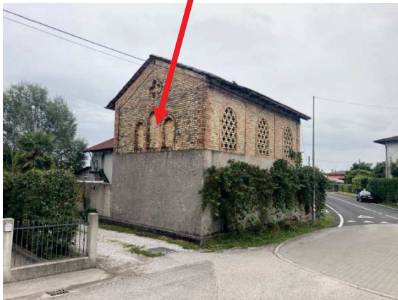
prospetto lato Nord-Est locali di deposito “quali accessori d’abitazione” sito in prossimità di Via Policreta

fabbricato oggetto di esecuzione immobiliare