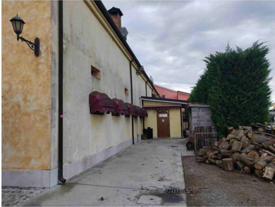
foto 17: veduta esterna dell'edificio ove visibili il volume esterno di ampliamento della cucina