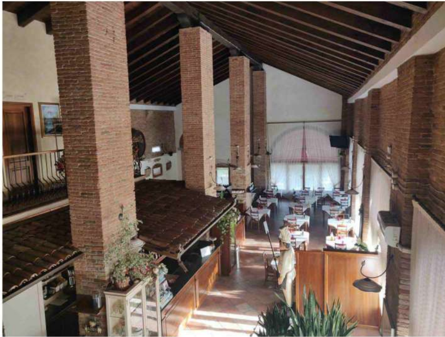
foto 7: veduta della sala principale al piano terra, vista dall'affaccio al piano primo