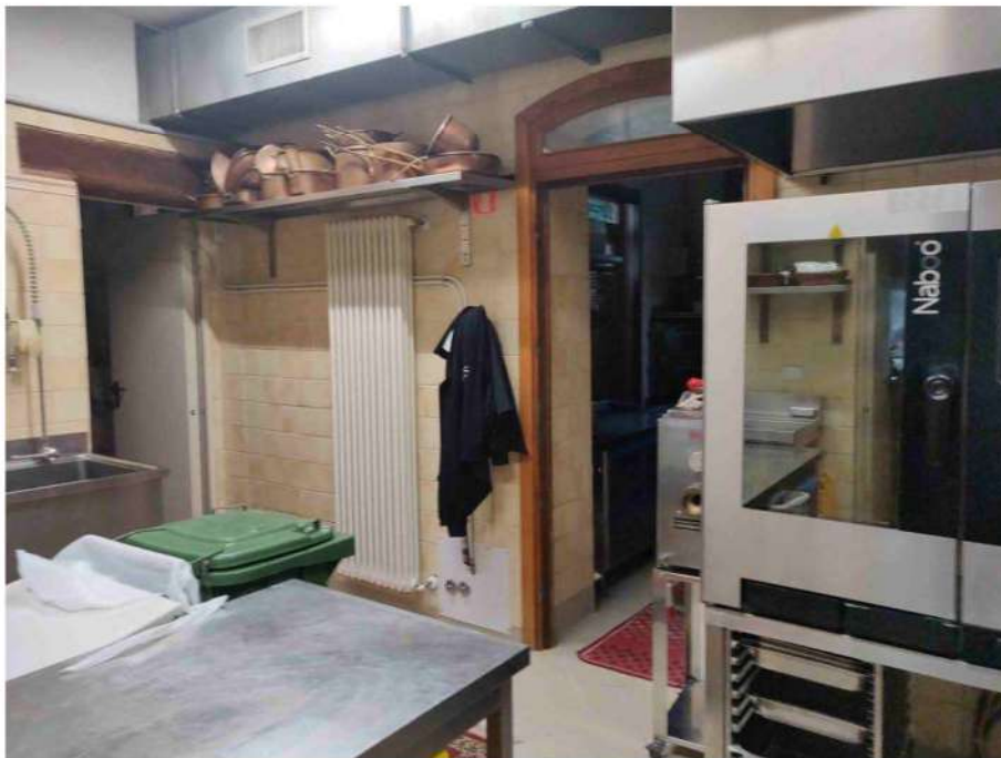
foto 14: veduta della cucina, ove visibile dall'interno l'ampliamento della stessa