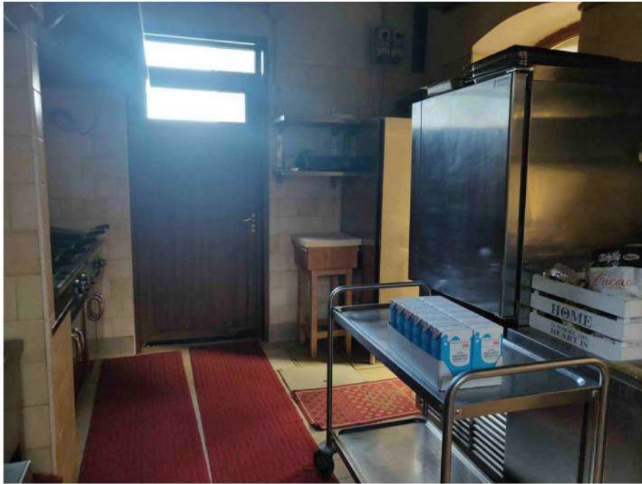
foto 15: veduta dall'interno della zona di ampliamento della cucina