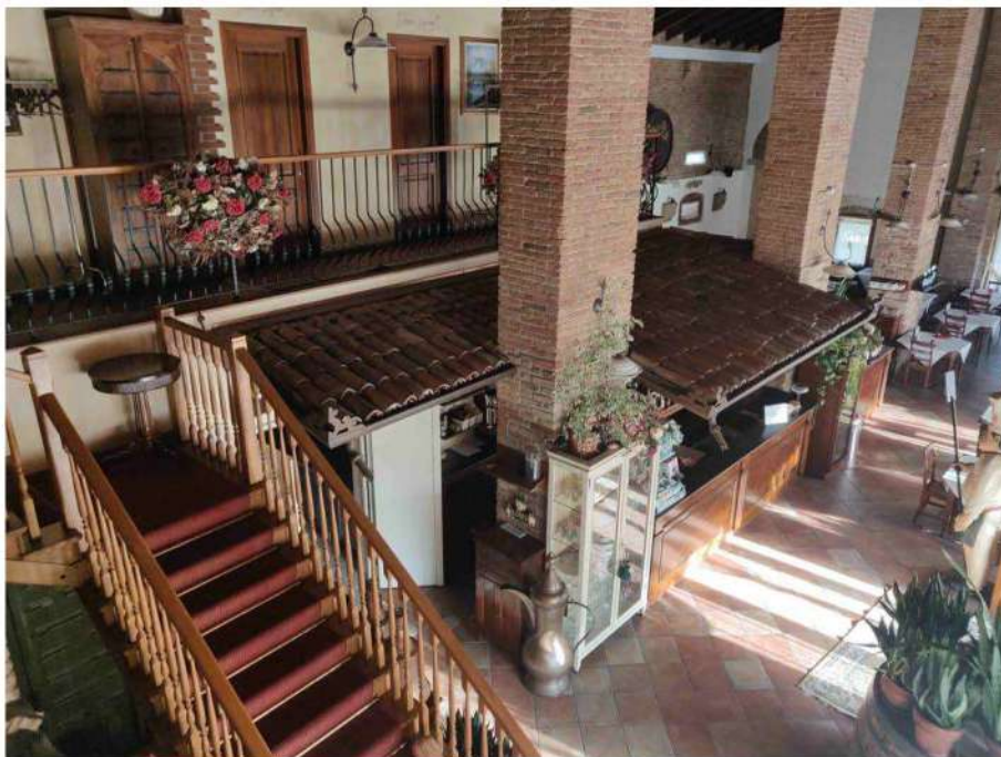
foto 8: veduta della sala principale al piano terra, zona bar, scala interna e zona servizi al piano primo, visti dall'affaccio al piano primo