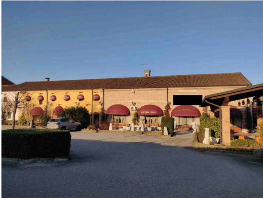
foto 1: veduta dell'edificio adibito a ristorante e relativo spazio esterno