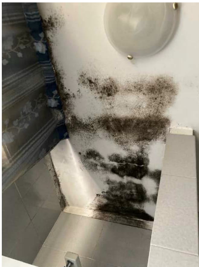
Foto n. 12: Particolare macchia umidità nel soffitto della zona doccia