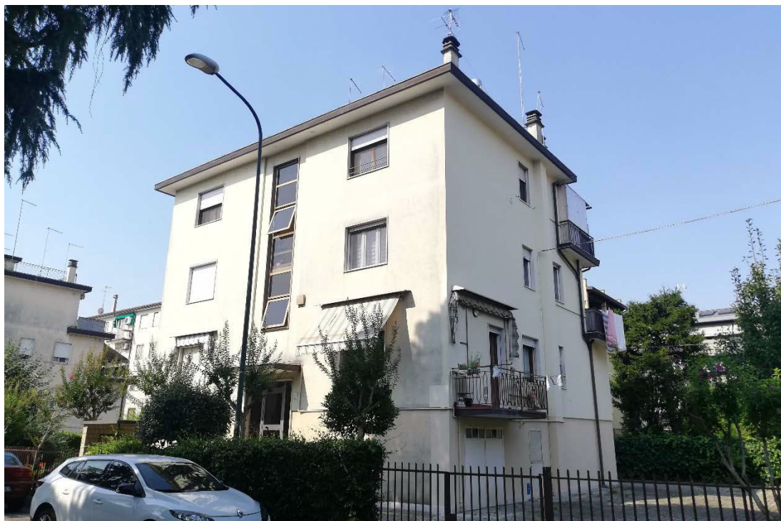
Foto n. 1 Vista del fabbricato da nord-est