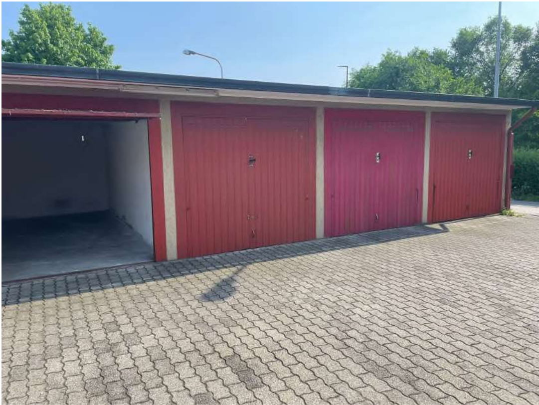
Sulla sinistra il box pignorato