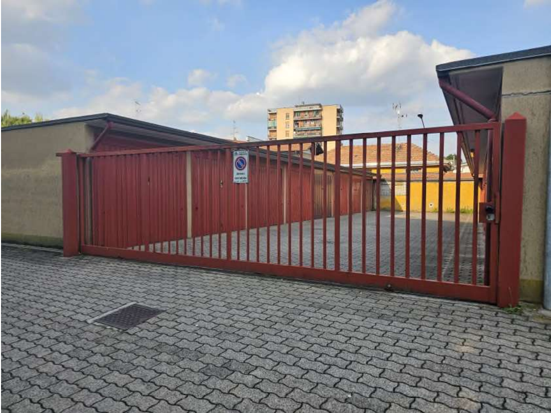
Cancello di accesso al fabbricato box