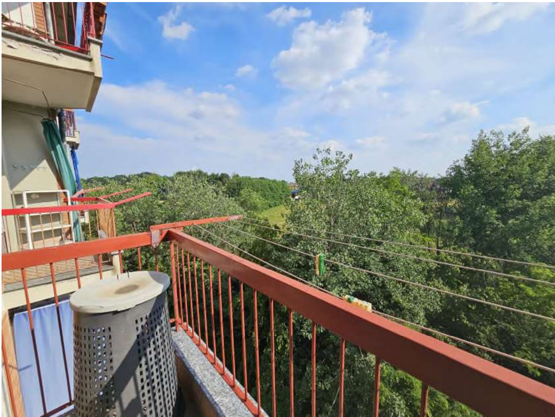
Balcone lato soggiorno