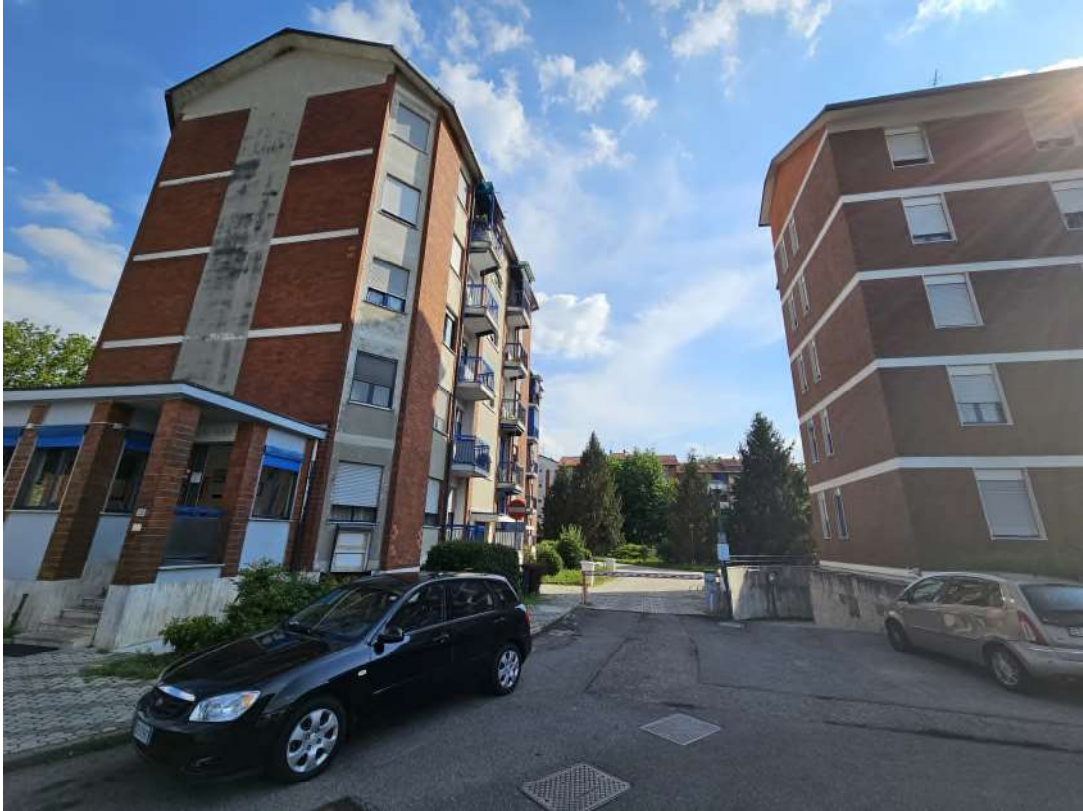
Ingresso da strada al complesso supercondominiale. A sinistra portineria