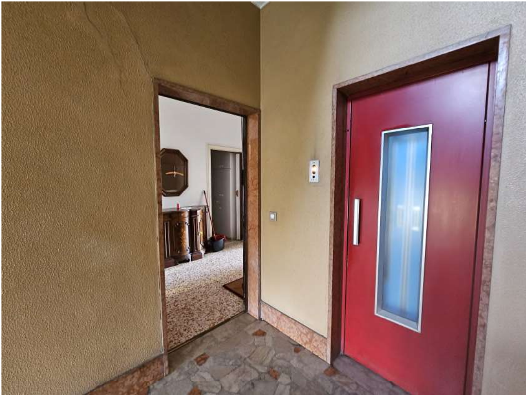
Pianerottolo di ingresso