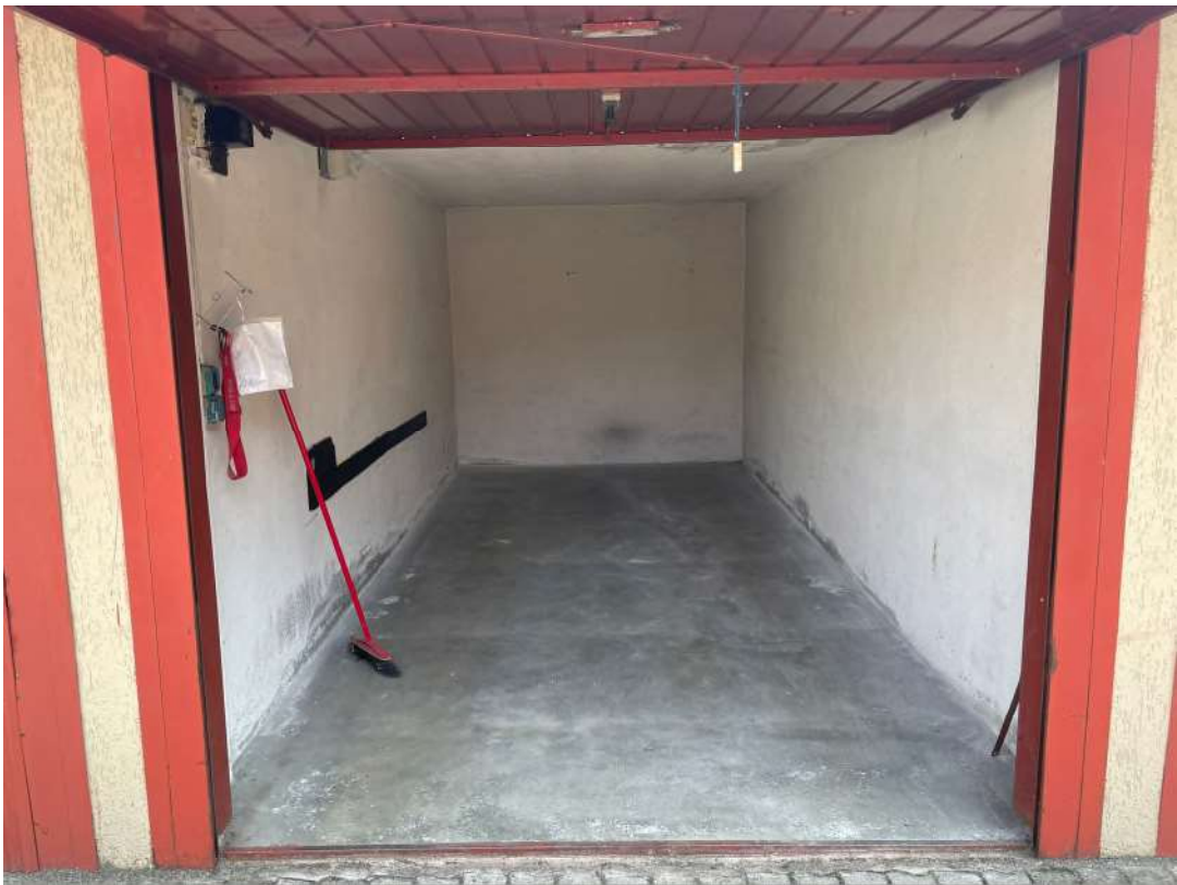
Interno del box