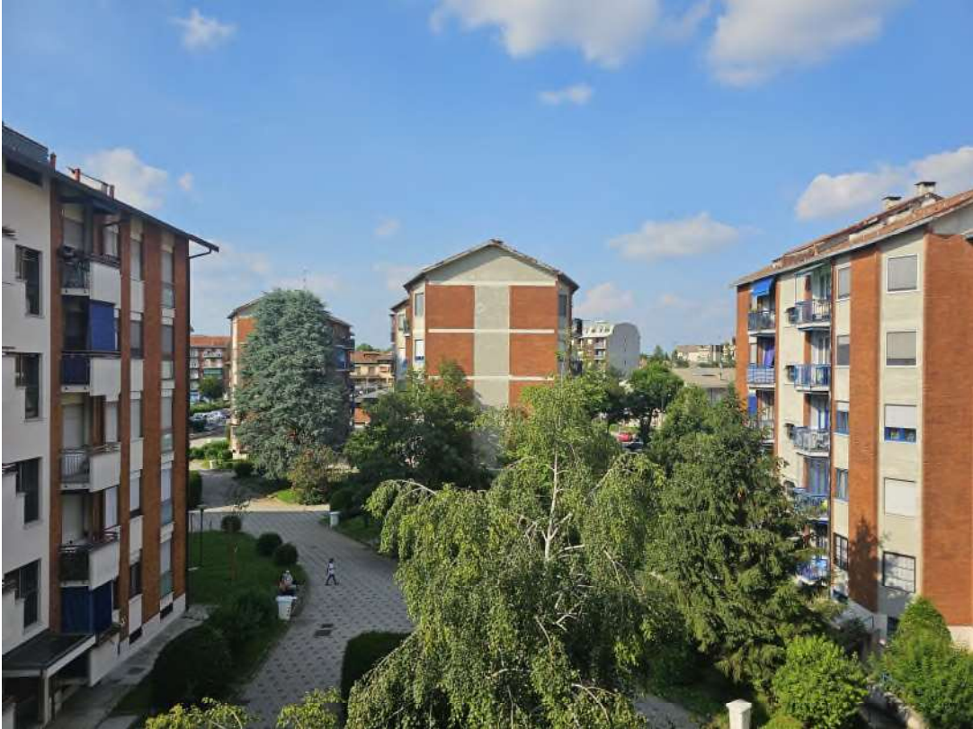
Vista dal balcone lato cucina