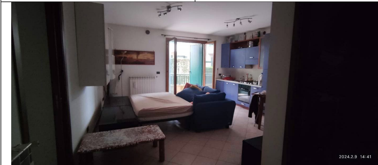
FOTO 5_PRANZO SOGGIORNO