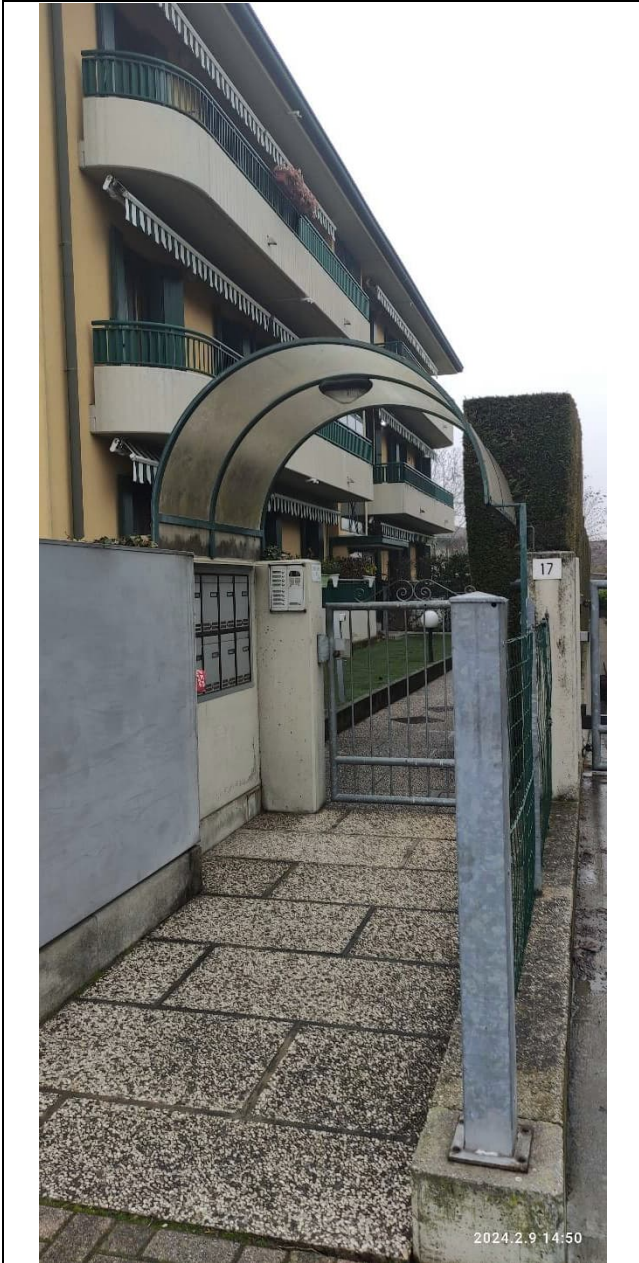
FOTO 3_INGRESSO PEDONALE CIV. 17_PROSPETTO SUD