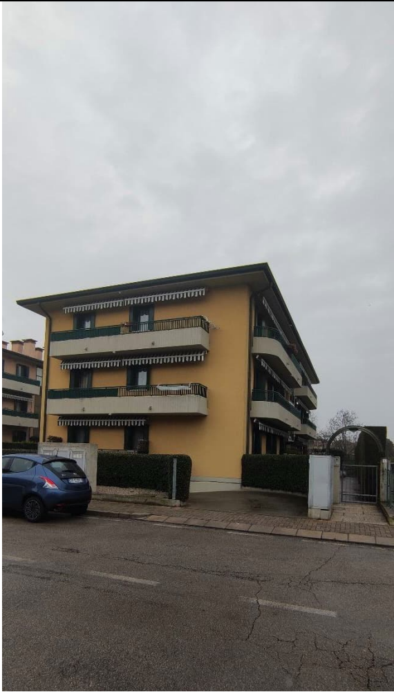
FOTO 1_AFFACCIO SU STRADA DEL CONDOMINIO TULIPANO CIV. 17