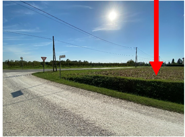
viste terreno in prossimit  della Strada dei Vini