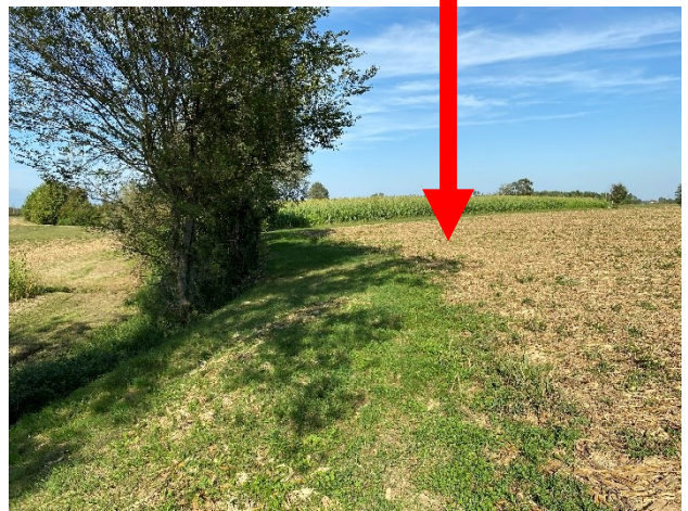
viste terreno in prossimità del fosso alberato