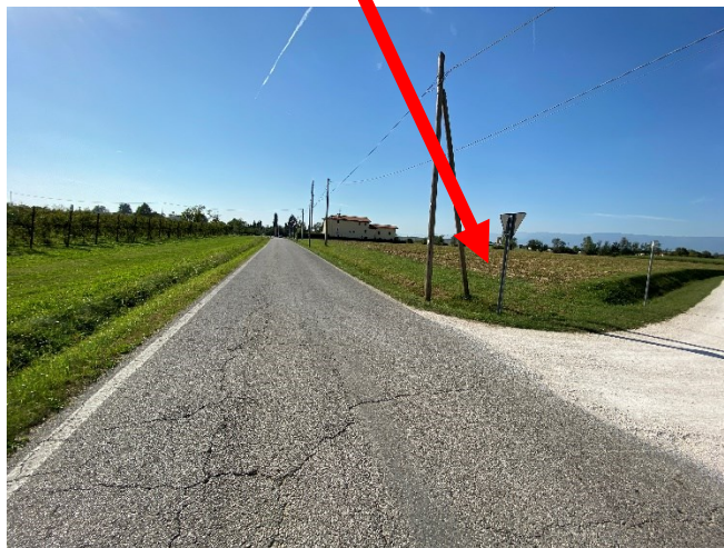
vista terreno dalla strada di via Pescarate (lato sud-ovest)