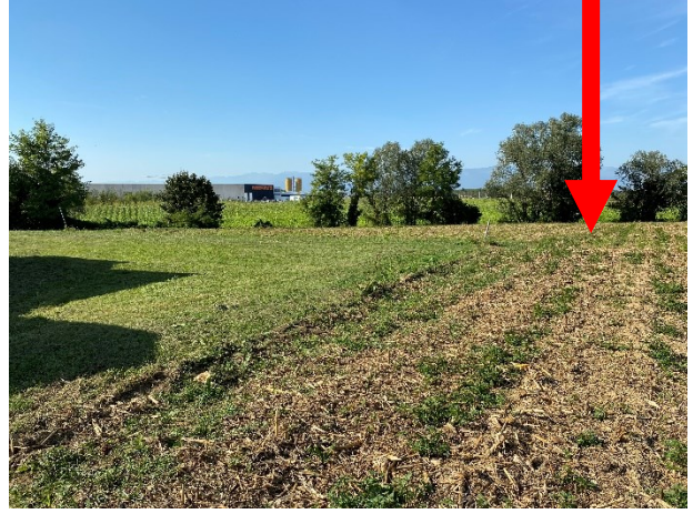
viste terreno in prossimità al cimitero