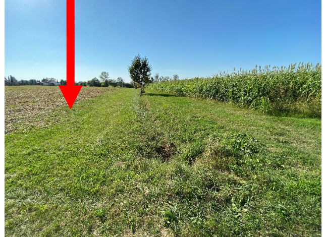
viste terreno in prossimità del canale