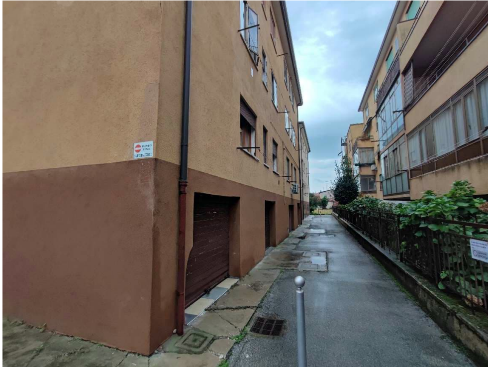
FOTO N. 5- prospetto sud, stradina di accesso al garage