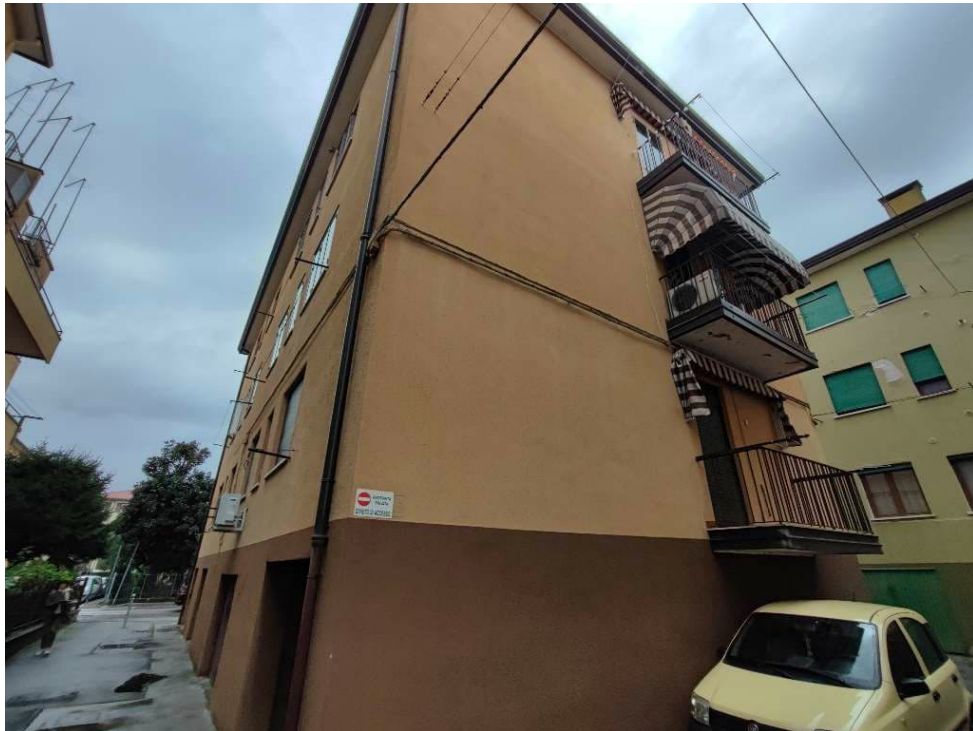
FOTO N. 4- prospetto est , stradina di accesso al garage