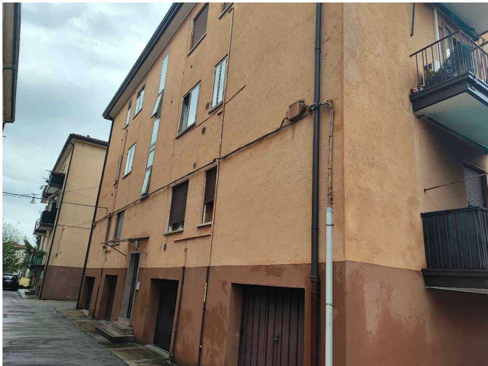
FOTO N. 2 - prospetto nord del condominio