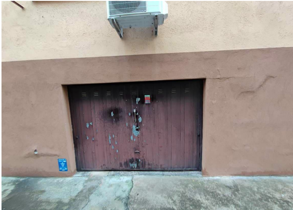
FOTO N. 11 - garage