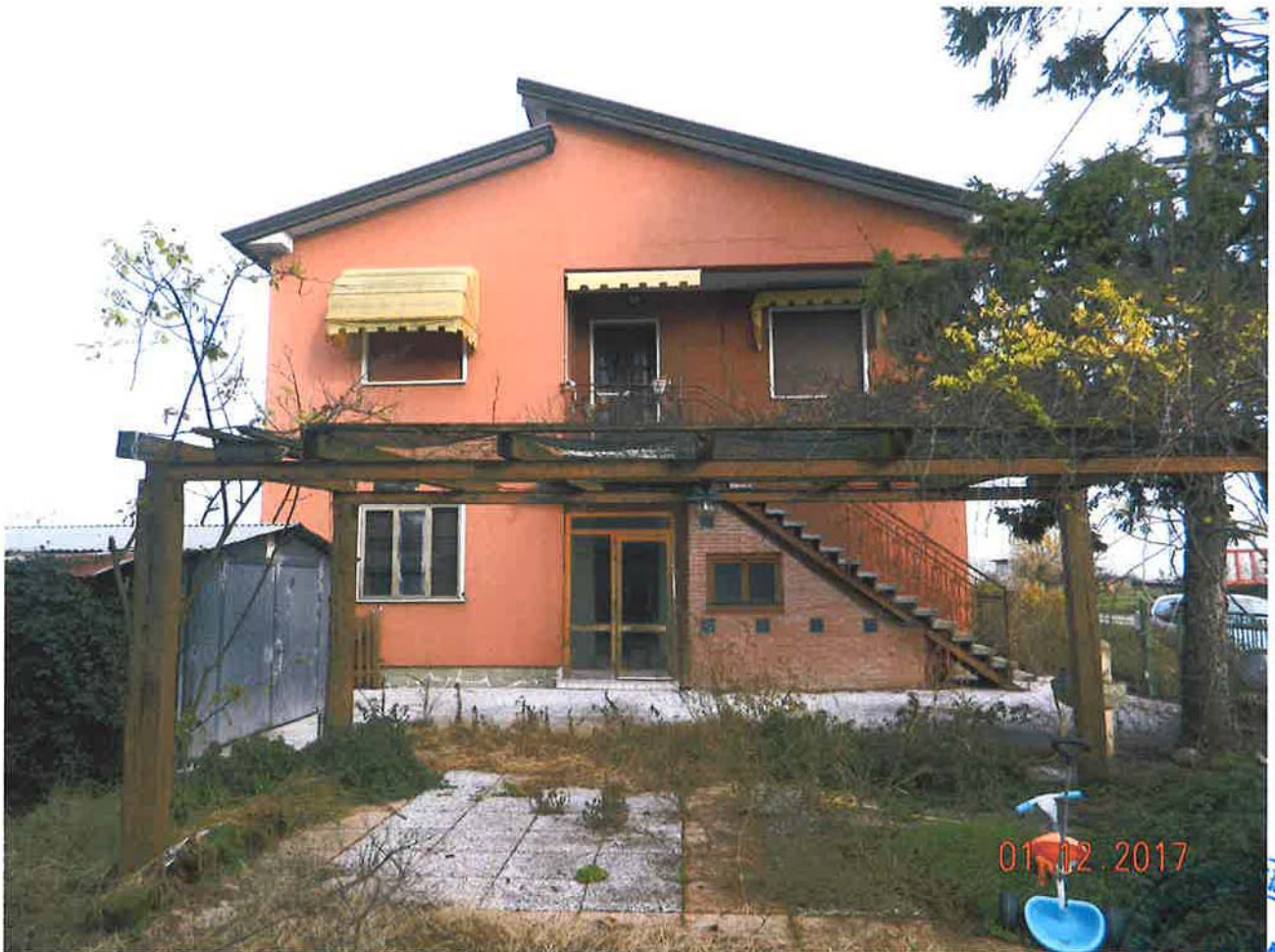
LOTTO 2 – Abitazione piano terra (sub. 2) e Abitazione piano primo (sub. 4) - ingressi