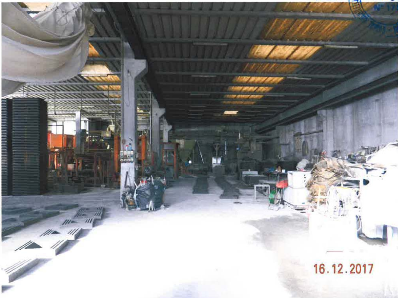
LOTTO 1 – Capannone ad uso artigianale (particella 46, sub. 5) – interno