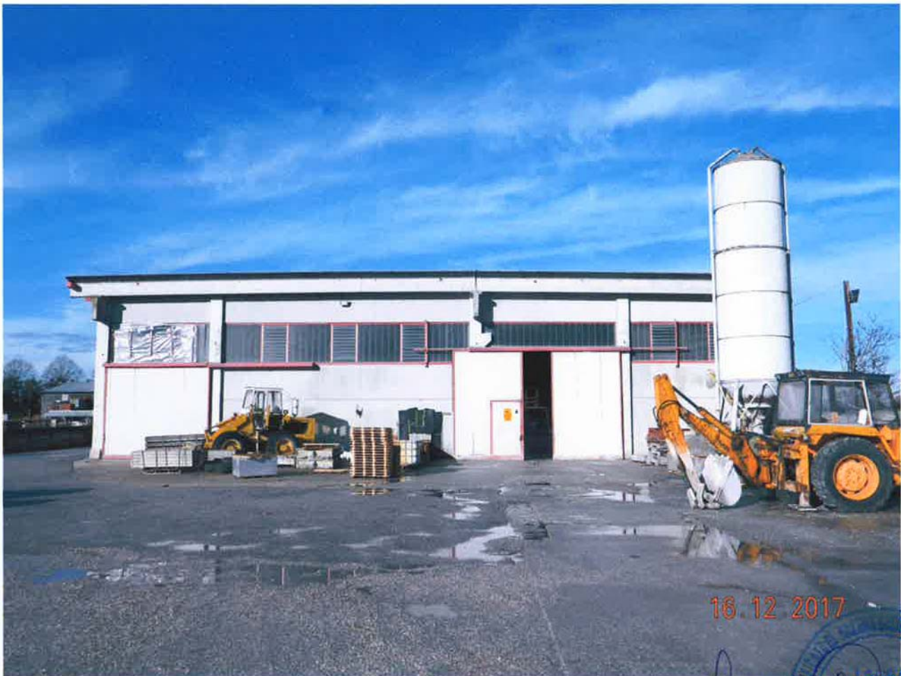
LOTTO 1 – Capannone ad uso artigianale (particella 46, sub. 5)