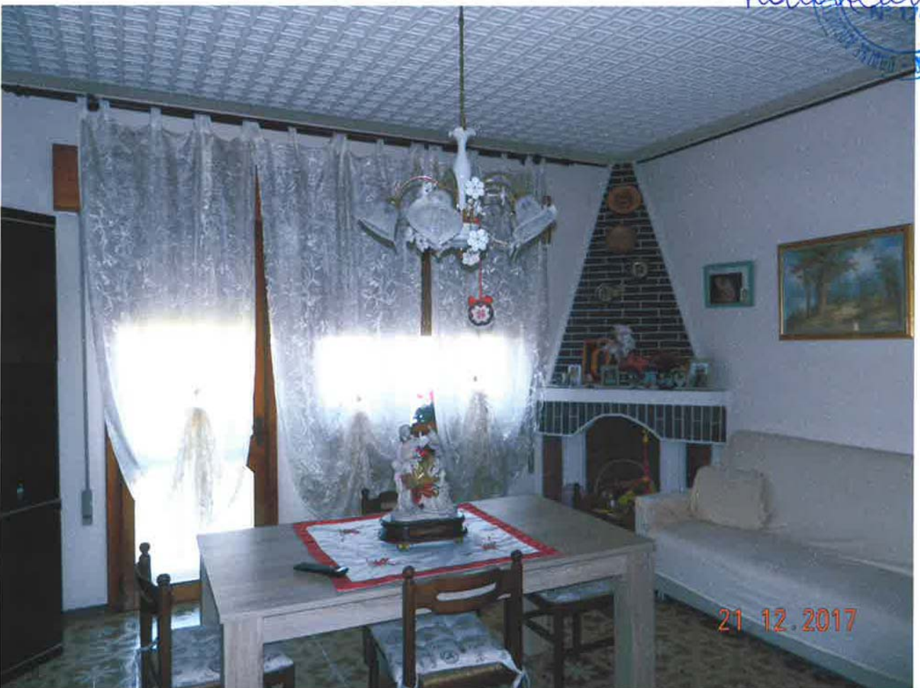
LOTTO 1 – Abitazione (particella 32, sub. 3) – piano primo, interno

21 12. 2017 RA GUEZZI 41 CANTIERI PUBBLICITÀ PUBBLICITÀ