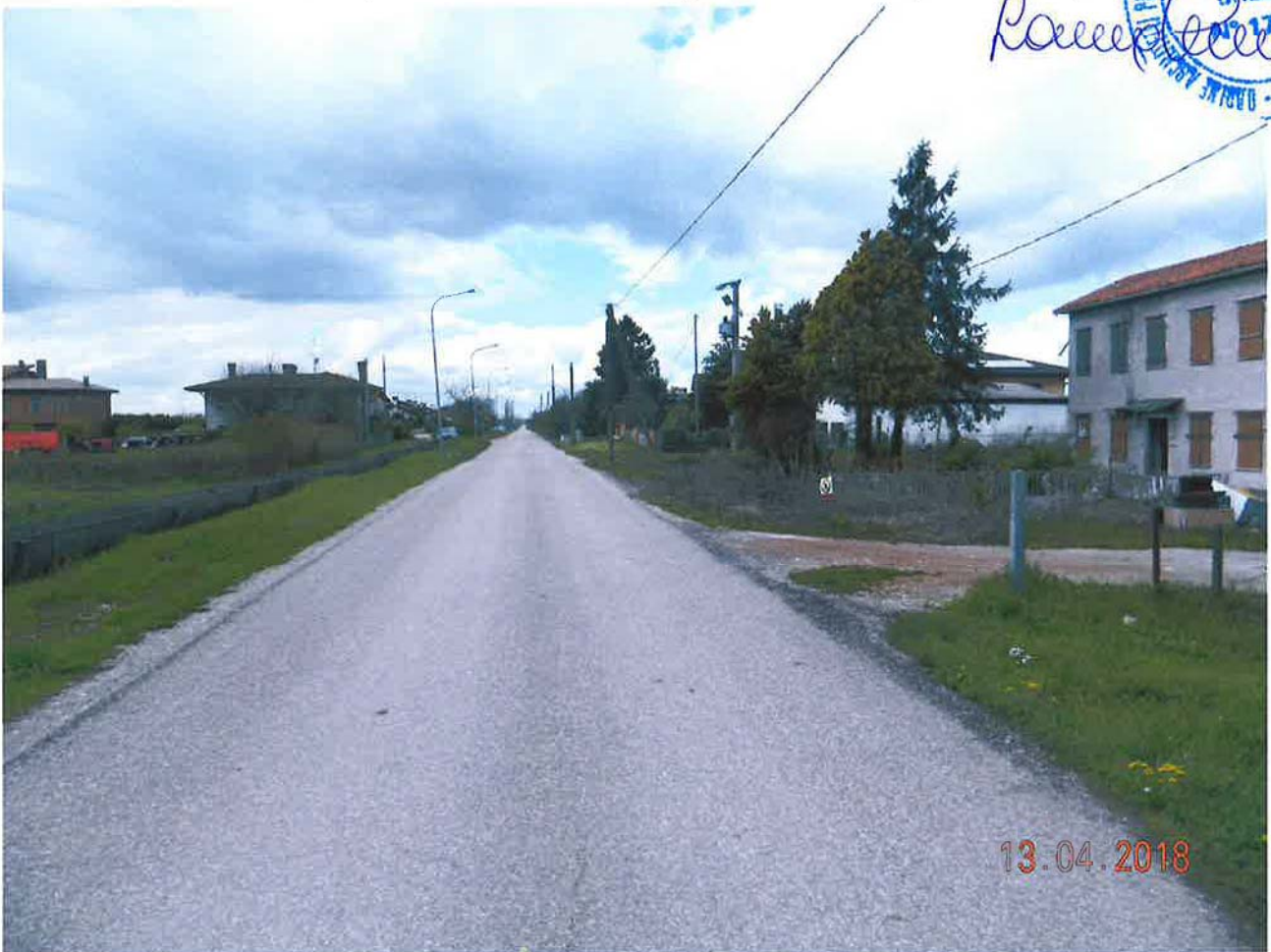
LOTTO 7 – Via Mutilati in prossimità dei terreni agricoli interclusi (lato destro)