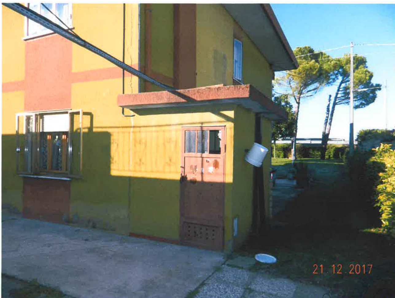
LOTTO 1 – Centrale termica (particella 32, sub. 4) – piano terra