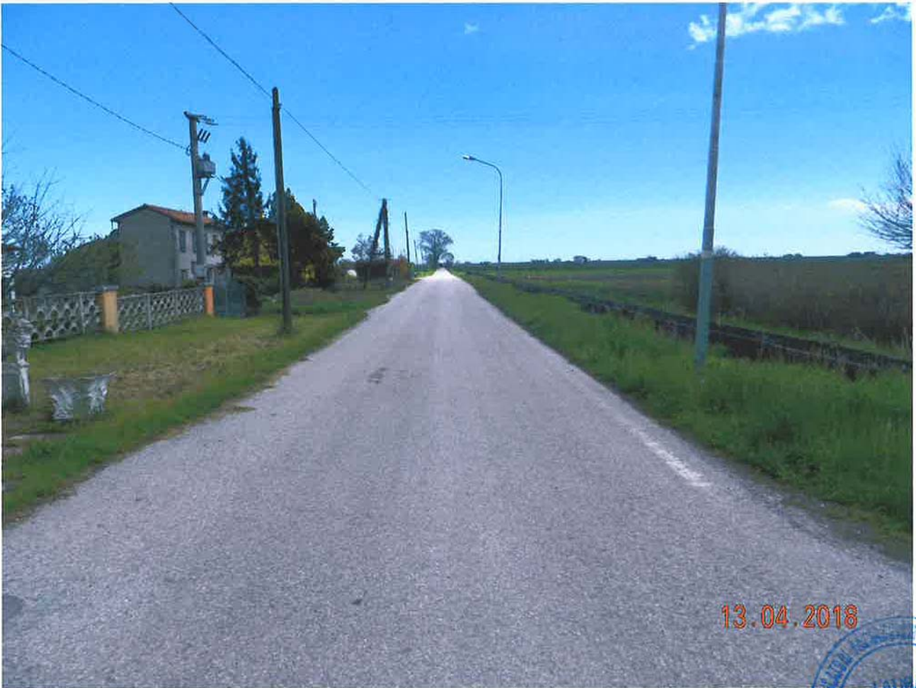
LOTTO 7 – Via Mutilati in prossimità dei terreni agricoli interclusi (lato sinistro)