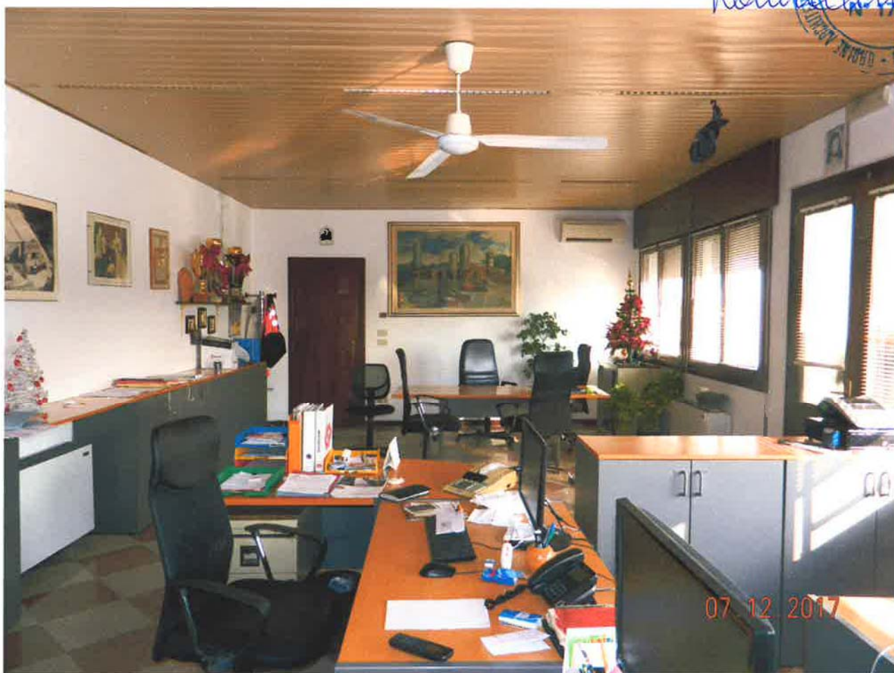
LOTTO 1 – Ufficio (particella 46, sub. 8) – piano terra, interno