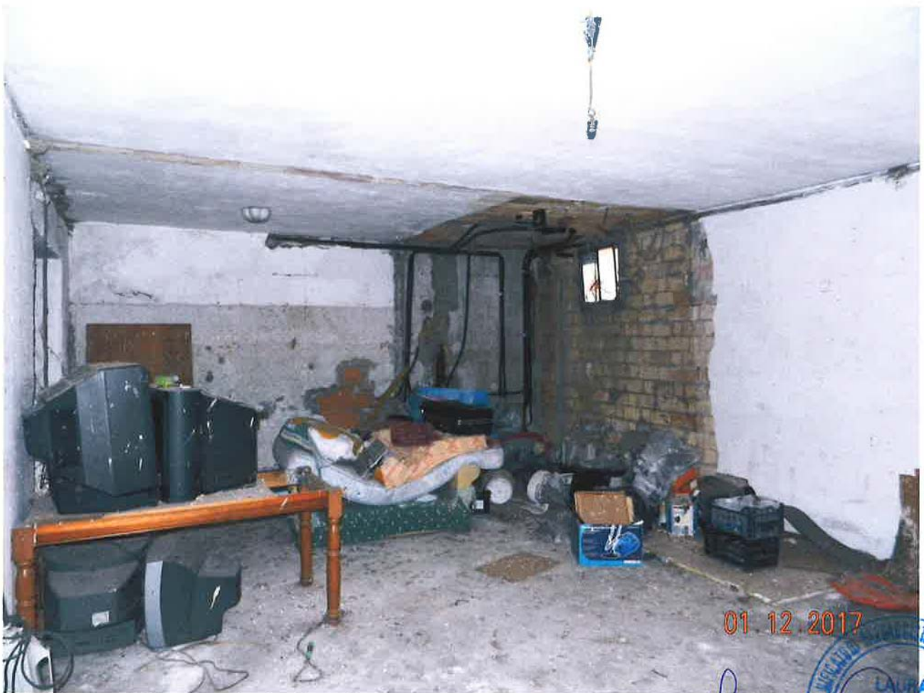
LOTTO 2 – Abitazione (sub. 3) – piano terra, interno

01.12.2017 Rosella Grezi CANTIERI GENERALI L. 1741 CANTIERI GENERALI