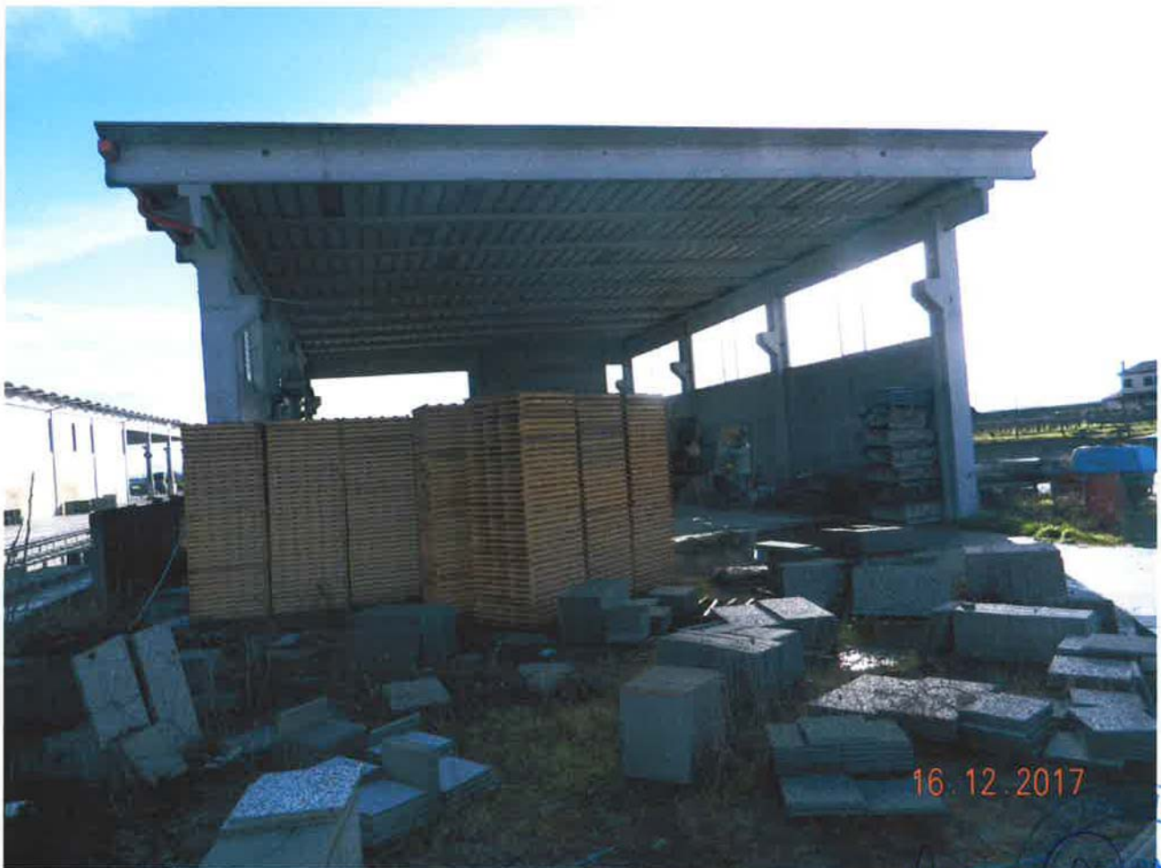
LOTTO 1 – Capannone ad uso artigianale (particella 46, sub. 6)