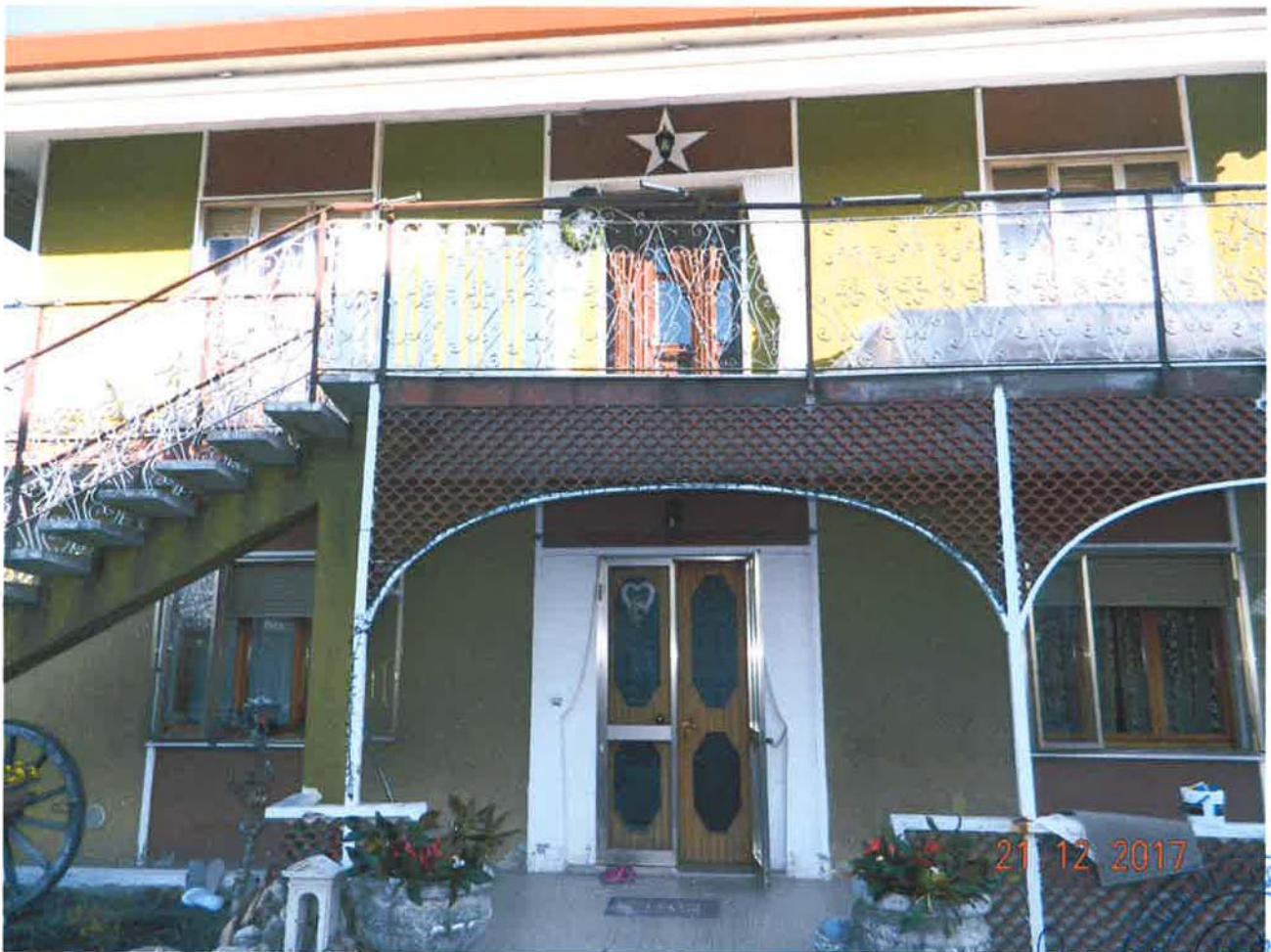
LOTTO 1 – Abitazione piano terra (particella 32, sub. 2) - ingresso

21 12 2017 KARIMULLAH N° 1741 CANTIERI GENERALI