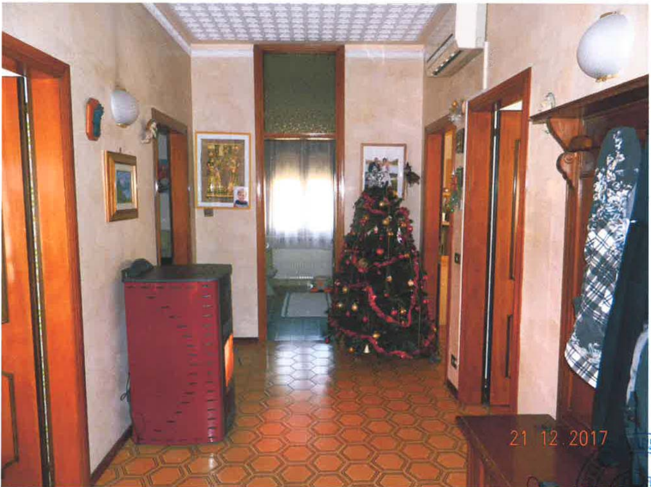
LOTTO 1 – Abitazione (particella 32, sub. 3) – piano primo, interno

21 12. 2017 RA GUEZZI 41 CANTIERI PUBBLICITÀ PUBBLICITÀ