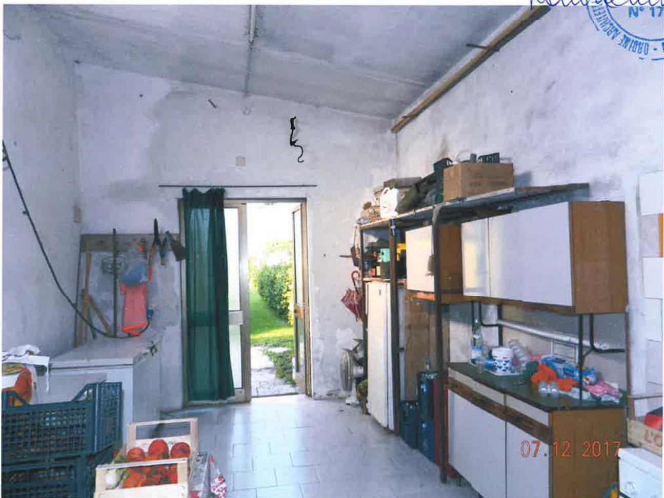
LOTTO 1 – Magazzino (particella 46, sub. 7) – Piano terra, interno