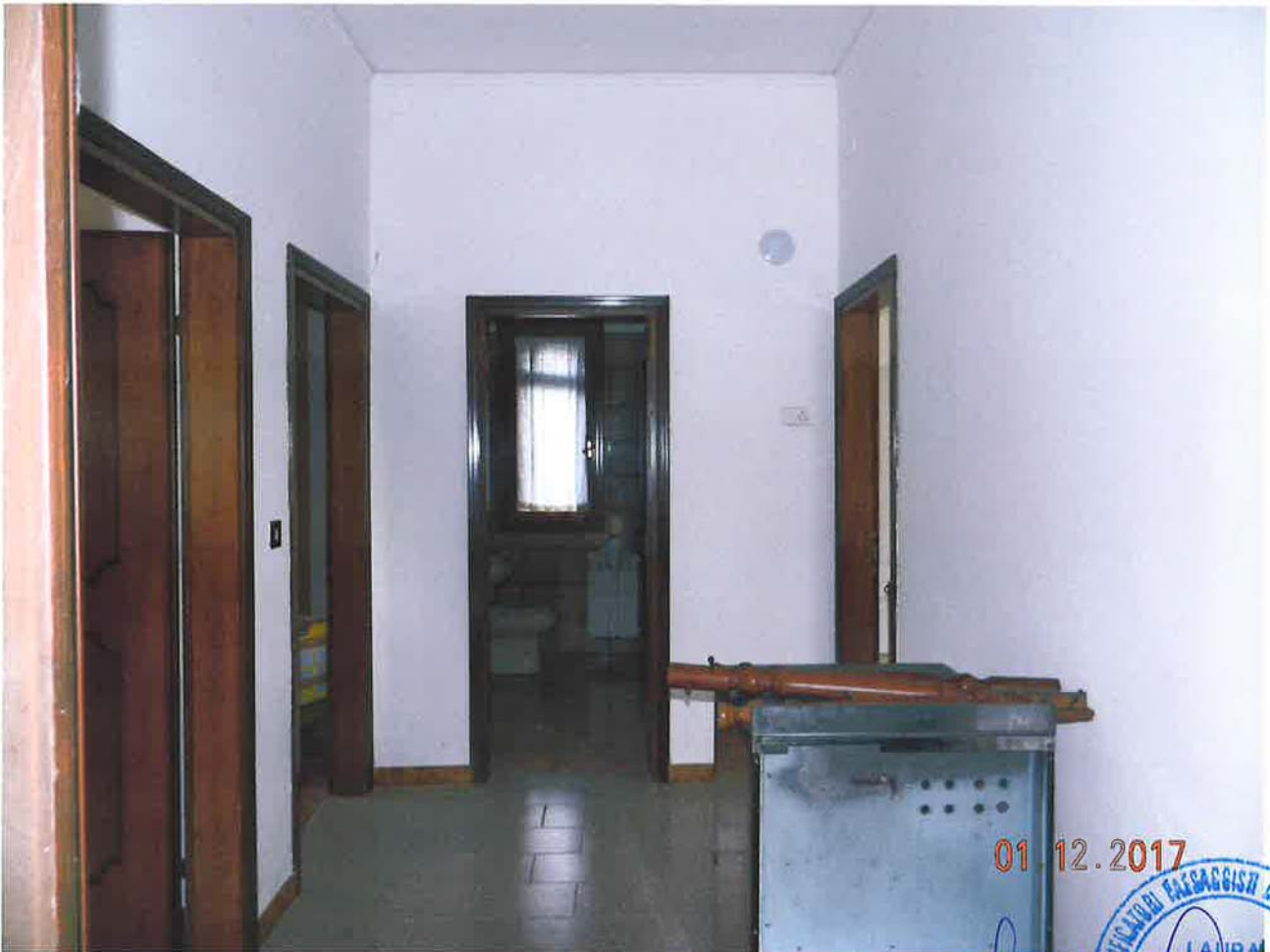
LOTTO 2 – Abitazione (sub. 2) – piano terra, interno

01.12.2017 LAURA N° 1741 CANTIERI EDILIZI AGENZIA DI SERVIZI E PROGETTI