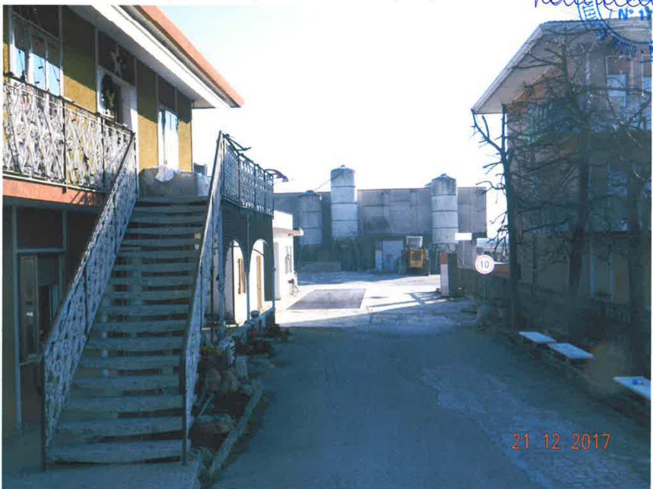
LOTTO 1 – Abitazione piano primo (particella 32, sub. 3) - ingresso

21 12 2017 KARIMULLAH N° 1741 CANTIERI GENERALI