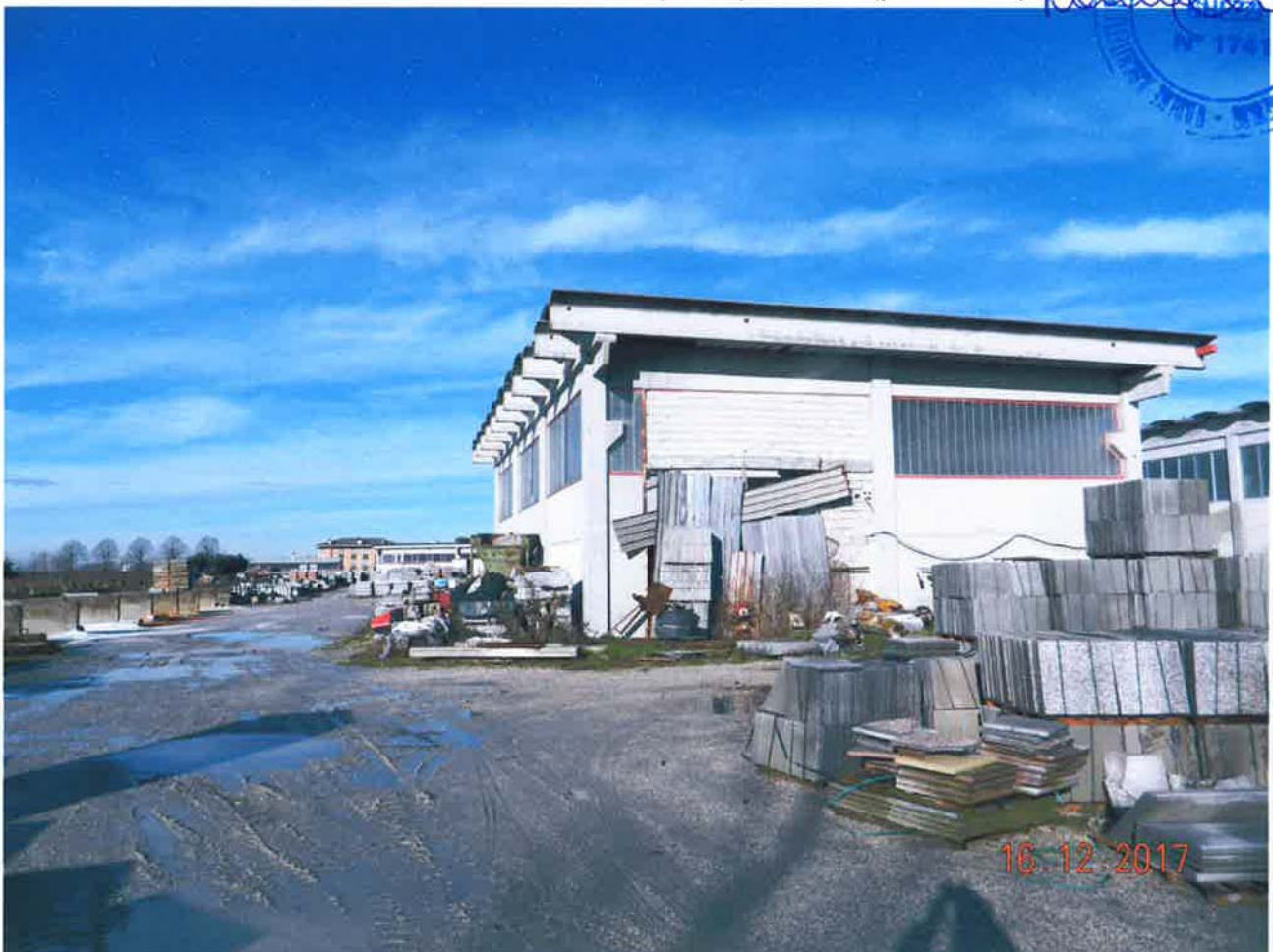
LOTTO 1 – Area scoperta (particella 46, sub. 1) e capannone (deposito)