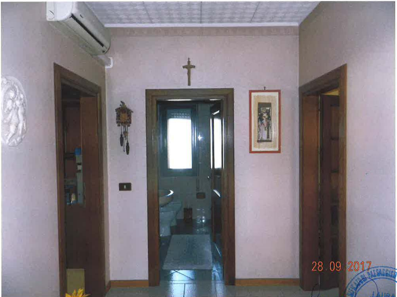
LOTTO 2 – Abitazione (sub. 4) – piano primo, interno