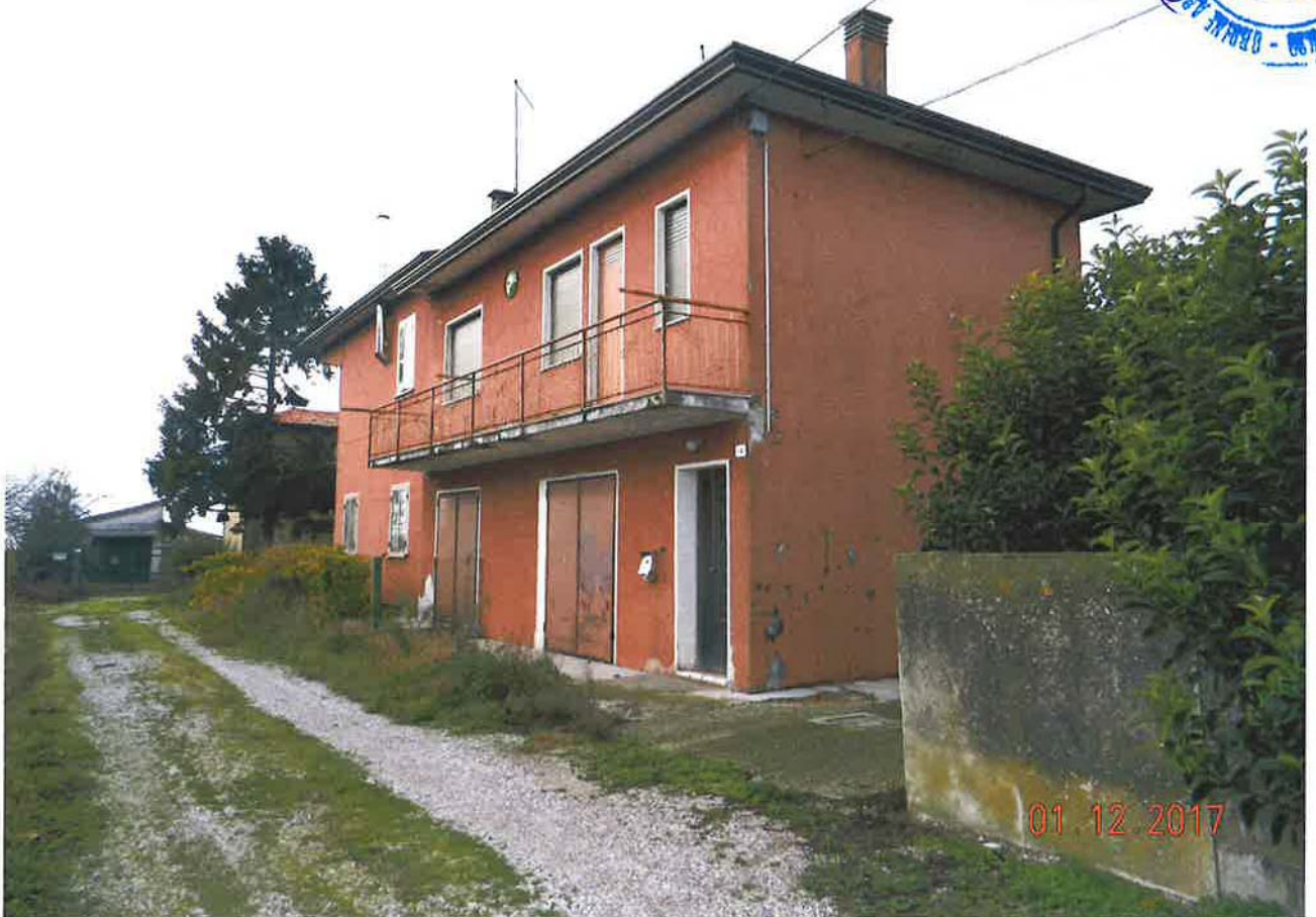
LOTTO 2 – Abitazione piani terra e primo (sub. 3) – ingresso