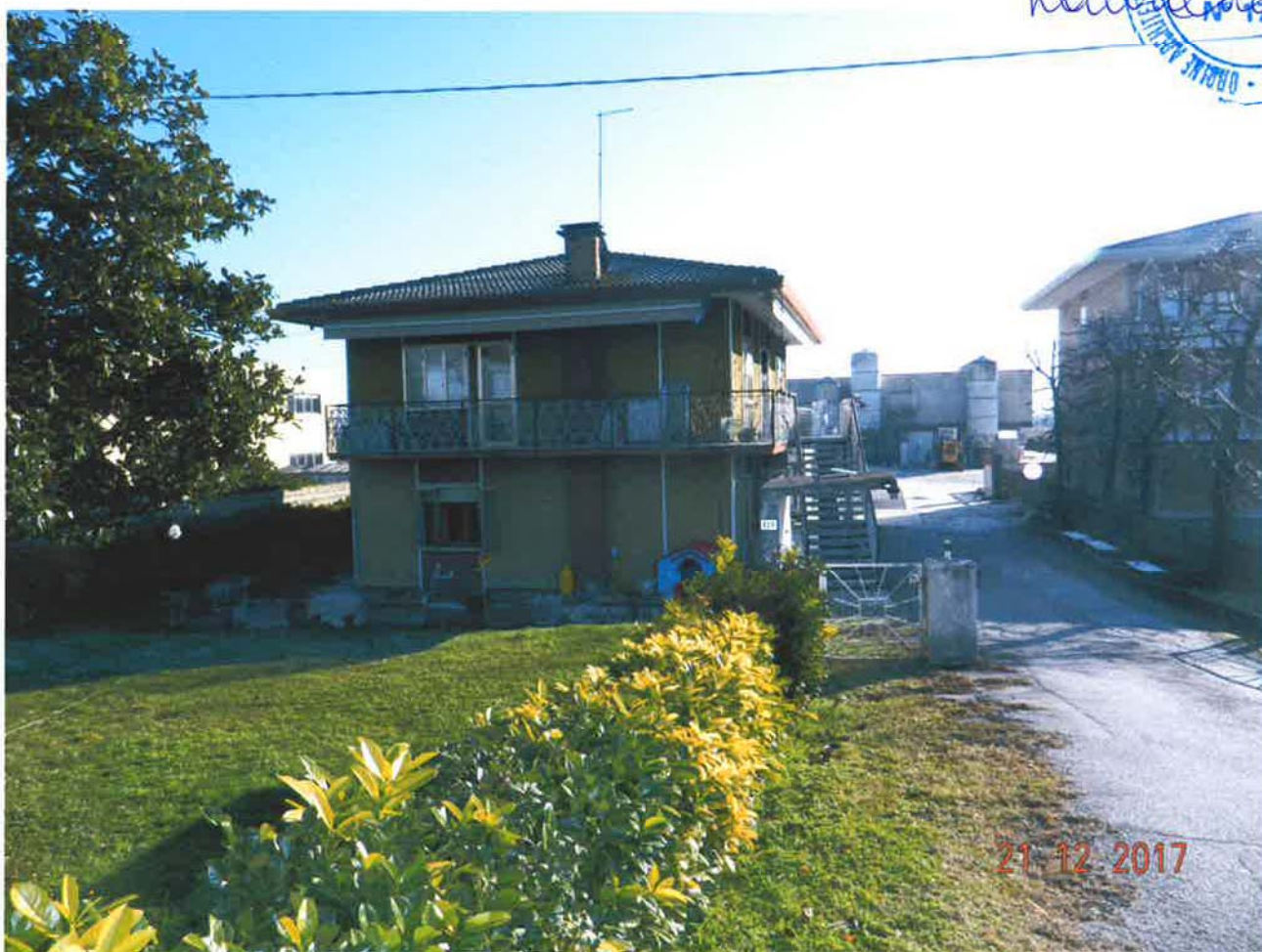
LOTTO 1 – Area scoperta (particella 32, sub. 1)