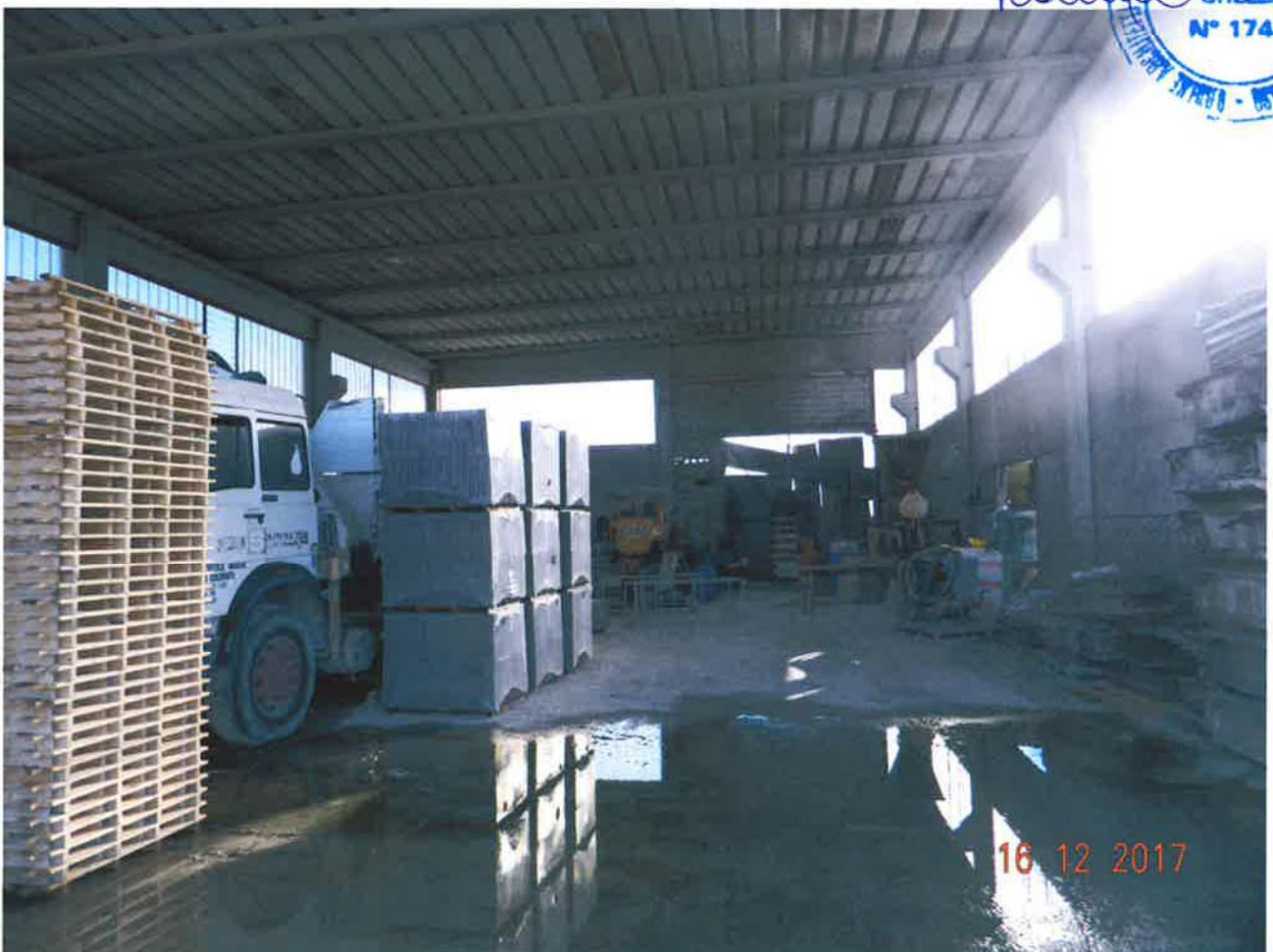
LOTTO 1 – Capannone ad uso artigianale (particella 46, sub. 6) – interno