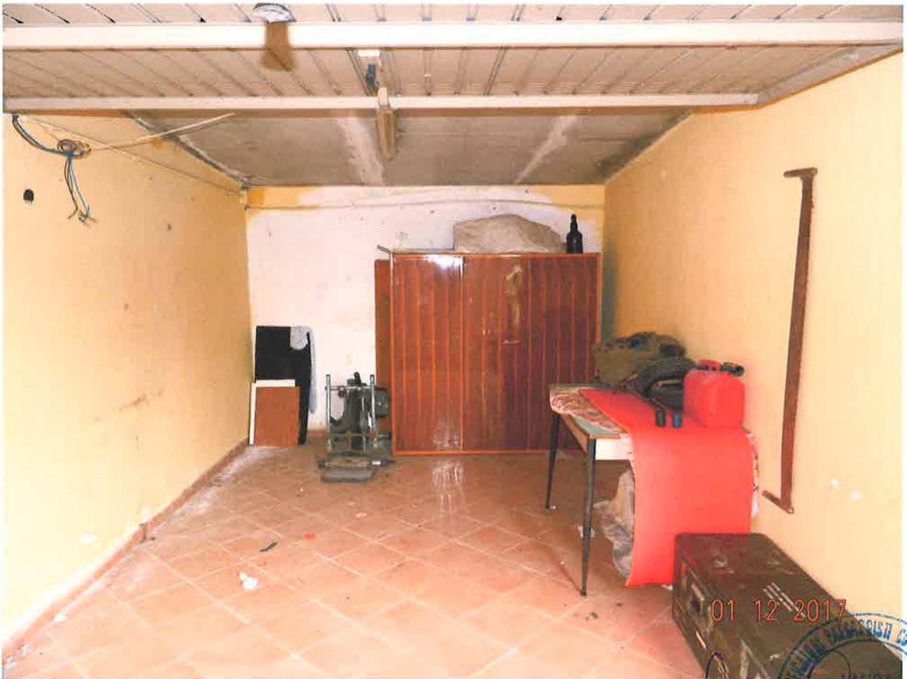
LOTTO 2 – Garage (sub. 6) – piano terra, interno

01 12 2017 CANTIERE DI RESTAURO E RISTRUTTURAZIONE Della Chiesa di Santa Maria di Caserta - Campania