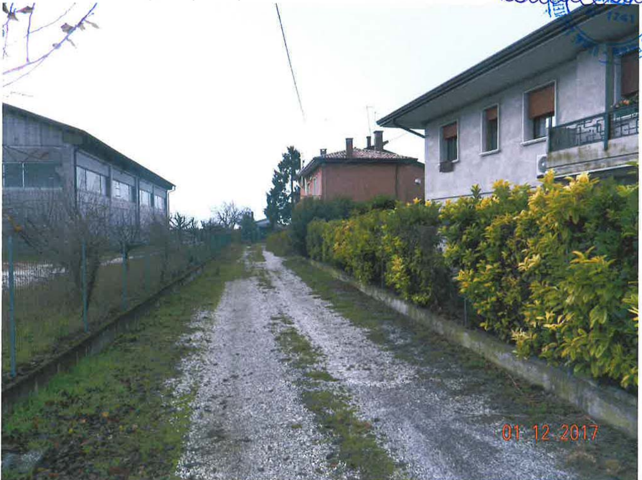
LOTTO 2 – Fascia di terreno gravata da servitù di passaggio

01.12.2017 CANTIERE PROVVISORIO DEL COMUNE DI... Rovato 1254