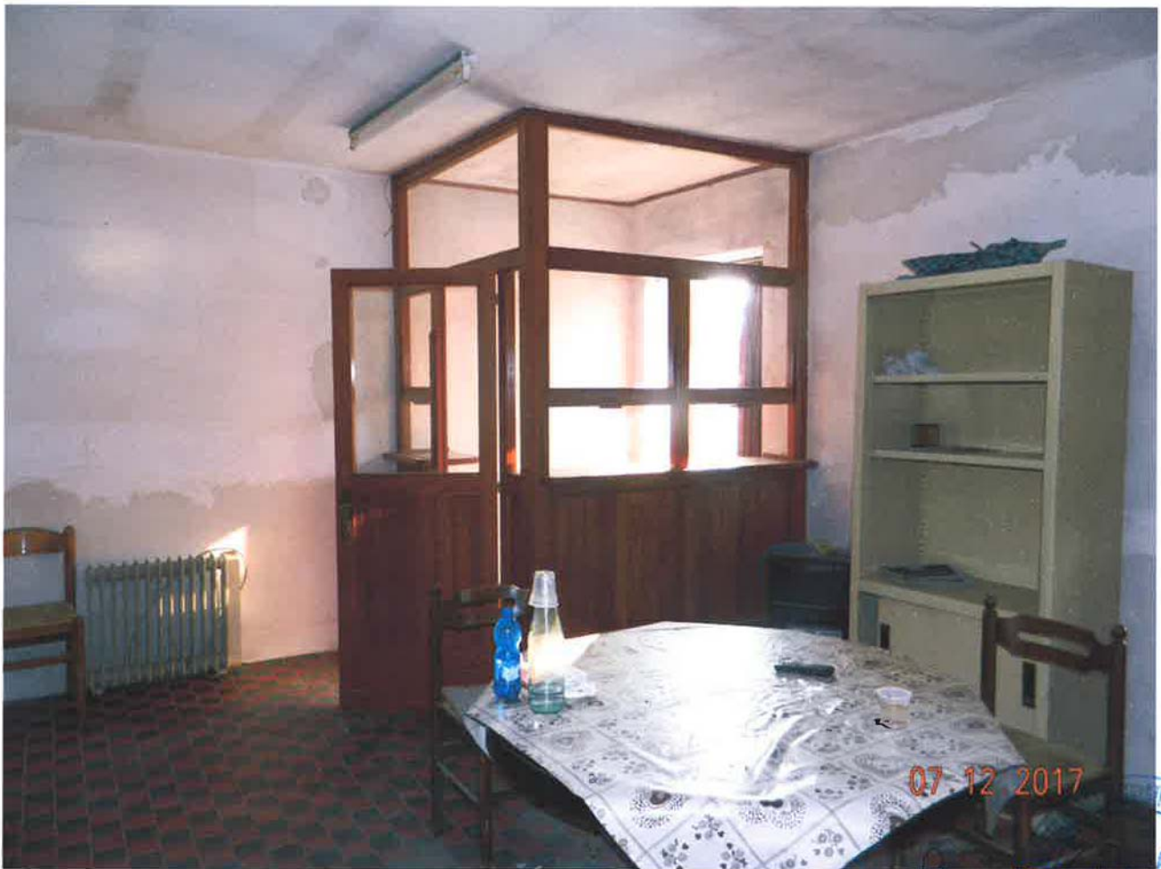
LOTTO 1 – Magazzino (particella 46, sub. 7) – piano terra, interno