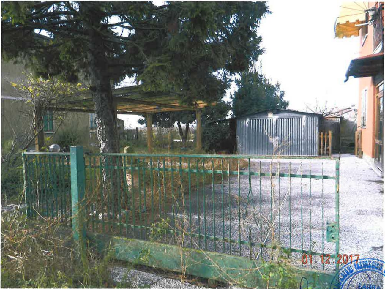
LOTTO 2 – Area scoperta (sub. 1)

01.12.2017 CANTIERE PROVVISORIO DEL COMUNE DI... Rovato 1254