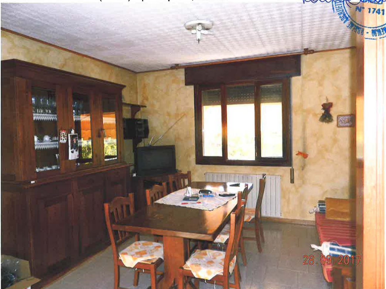
LOTTO 2 – Abitazione (sub. 4) – piano primo, interno