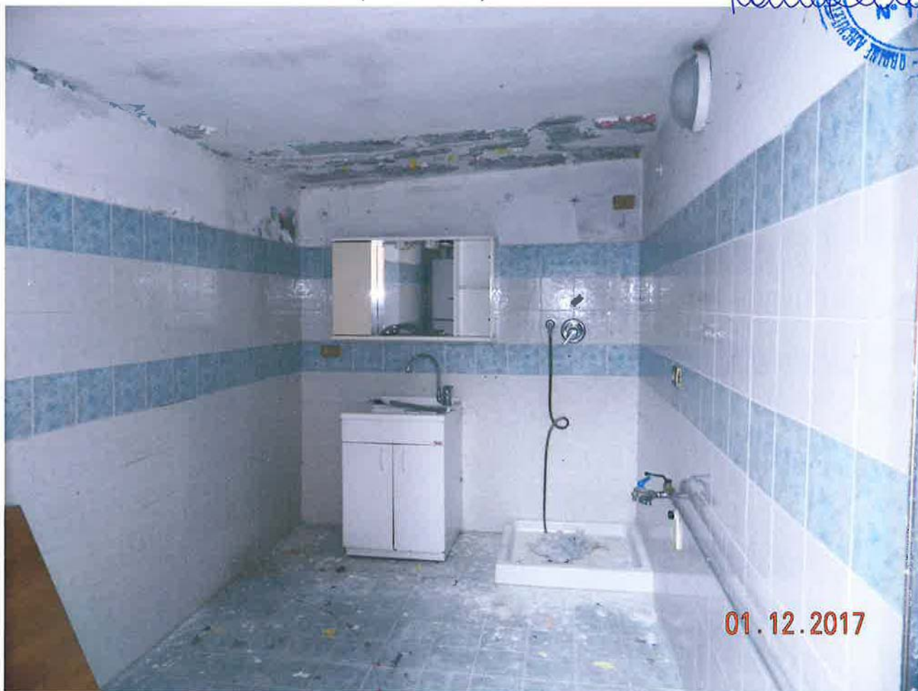
LOTTO 2 – Locale lavanderia/c.t. (sub. 2) – piano terra, interno

Raffaele... CANTIERI N° 1741 GRUPPO ASSOCIATO CANTIERI IN PUGLIA