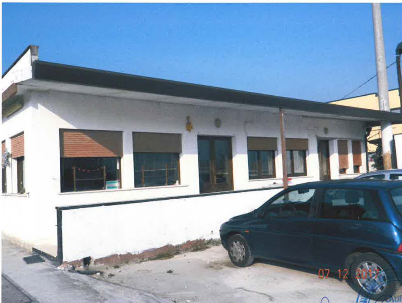
LOTTO 1 – Ufficio (particella 46, sub. 8) – piano terra, ingresso