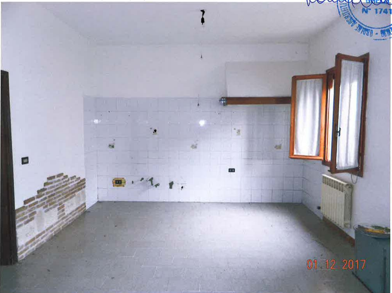
LOTTO 2 – Abitazione (sub. 2) – piano terra, interno

01.12.2017 LAURA N° 1741 CANTIERI EDILIZI AGENZIA DI SERVIZI E PROGETTI