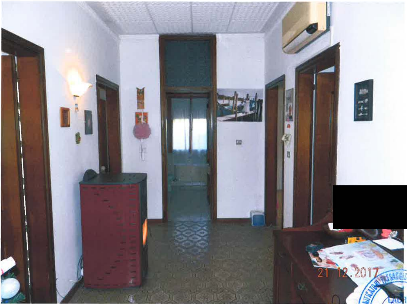
LOTTO 1 – Abitazione (particella 32, sub. 2) – piano terra, interno