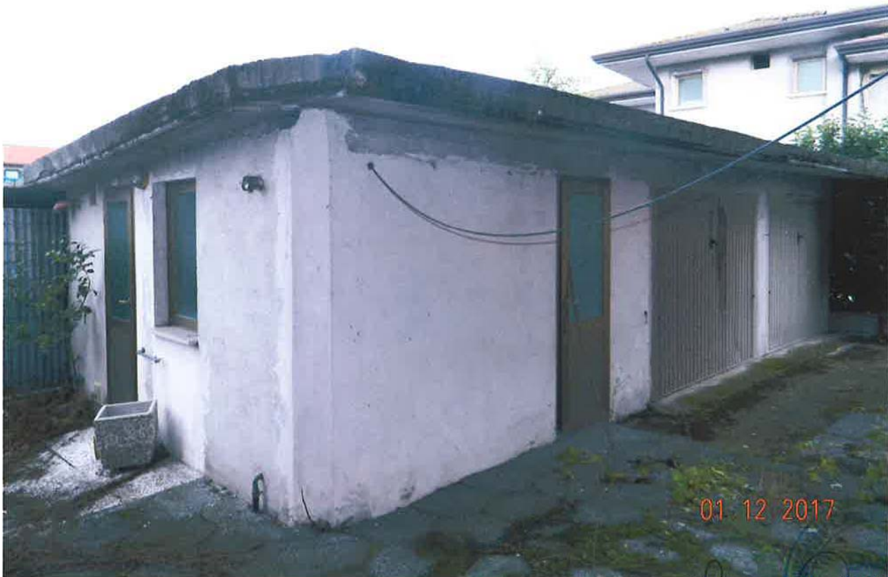
LOTTO 2 – Fabbricato accessorio (in muratura)