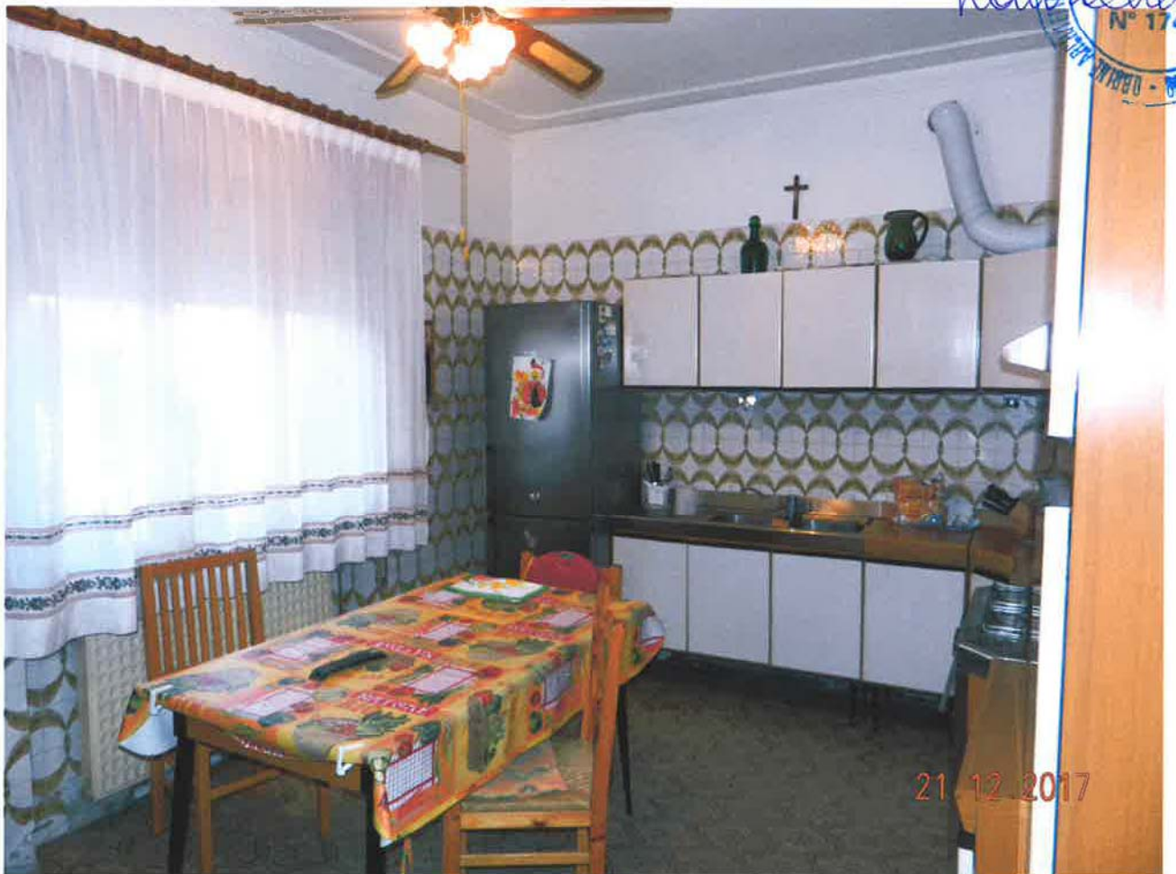
LOTTO 1 – Abitazione (particella 32, sub. 2) – piano terra, interno

21.12.2017 Laura N° 1741 CANTIERI E SERVIZI S.p.A. - VIA S. GIUSEPPE 10 - 00187 ROMA - TEL. 06/4781111