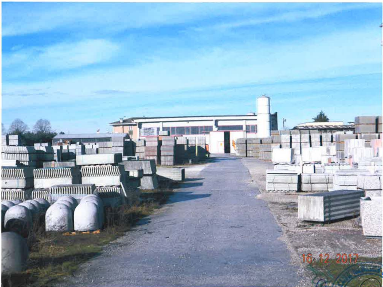
LOTTO 1 – Area scoperta (particella 46, sub. 1) e capannone (produttivo)