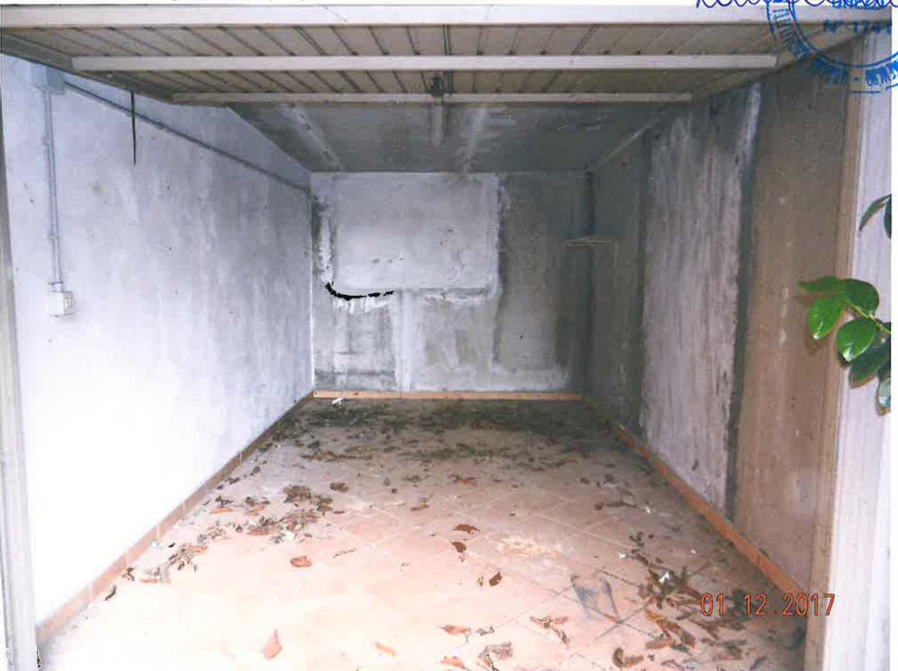
LOTTO 2 – Garage (sub. 7) – piano terra, interno

01 12 2017 CANTIERE DI RESTAURO E RISTRUTTURAZIONE Della Chiesa di Santa Maria di Caserta - Campania