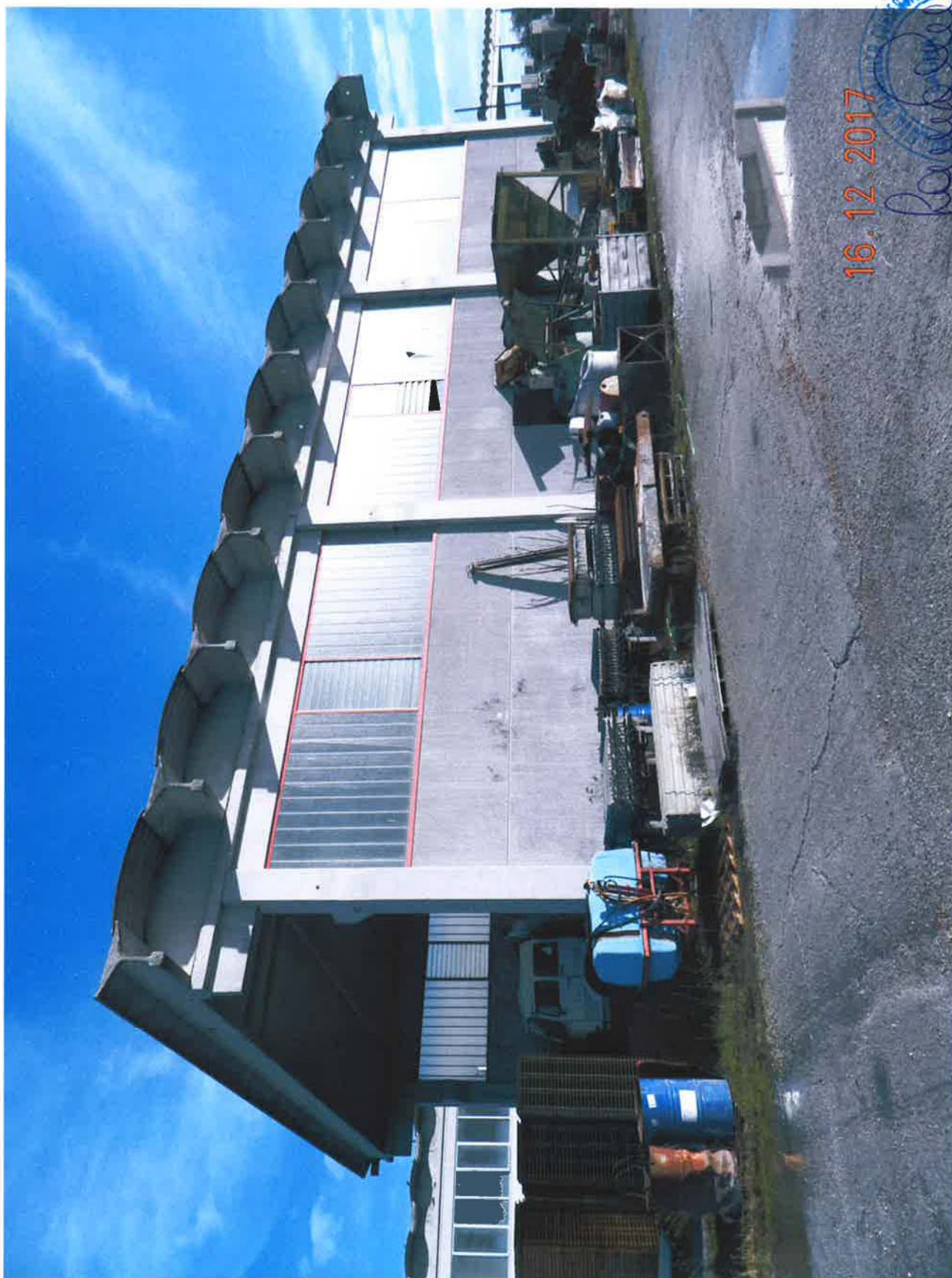
LOTTO 1 – Capannone ad uso artigianale (deposito)