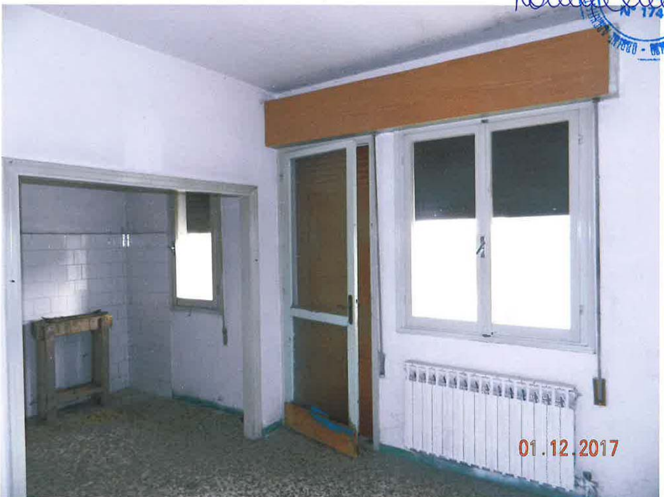
LOTTO 2 – Abitazione (sub. 3) – piano primo, interno

01.12.2017 Rosella Grezi CANTIERI GENERALI L. 1741 CANTIERI GENERALI