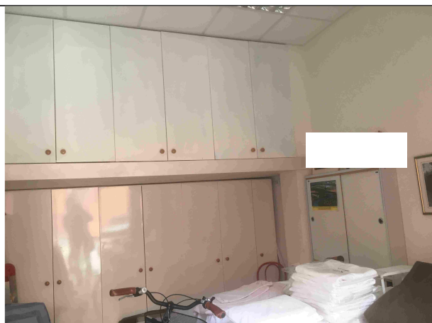
Veduta interna p. T - Sub. 45