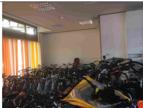
Veduta interna p. T - Sub. 44