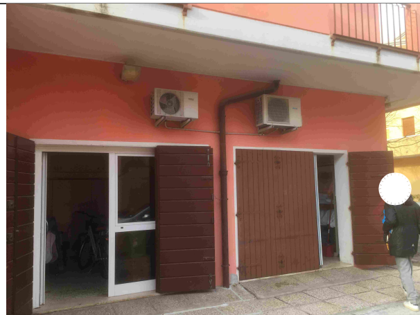
Veduta esterna - Sub. 45