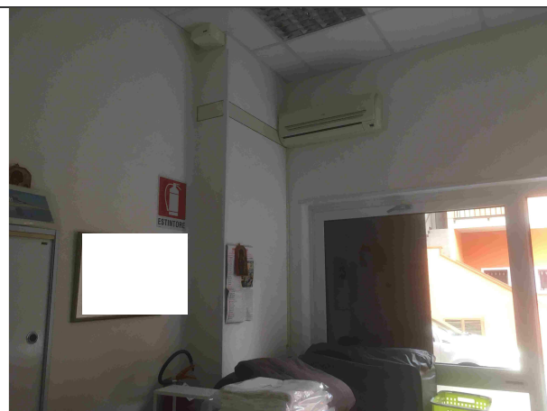
Veduta interna p. T - Sub. 45