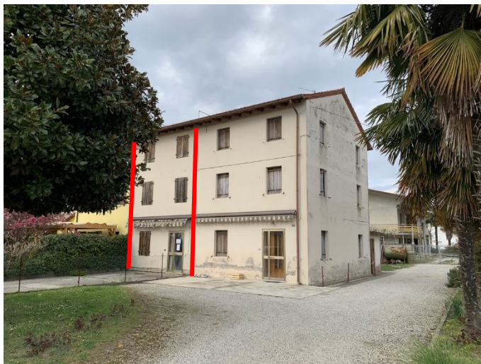
prospetto lato sud-est