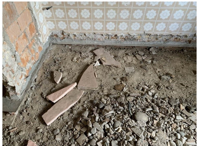
ulteriori particolari del taglio meccanico nelle murature interne