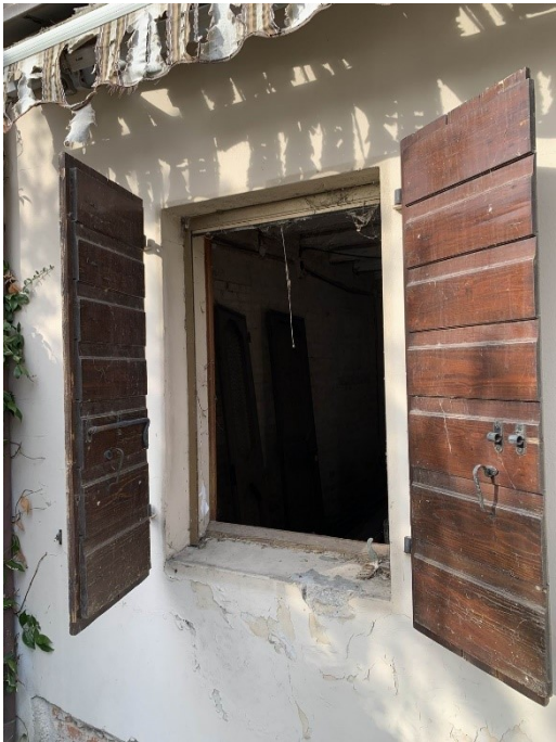
particolare di una vetusta finestra e balcone