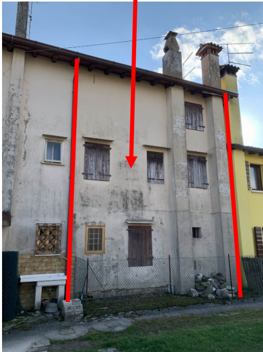
prospetto retro fabbricato (lato nord)