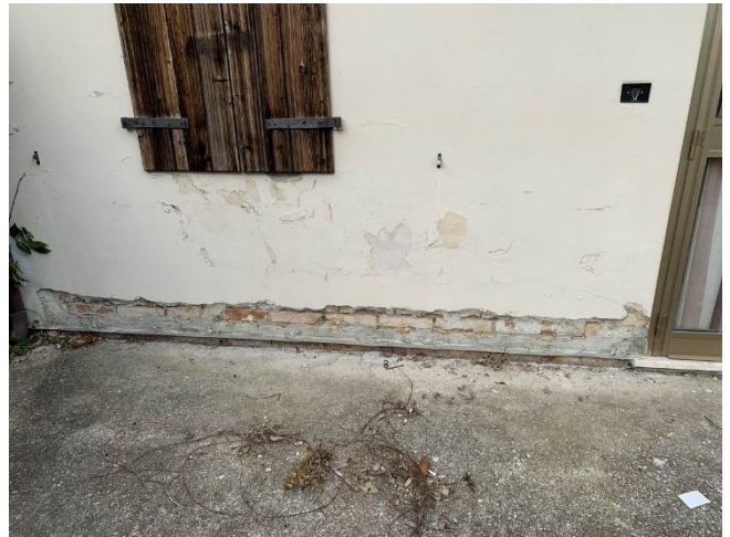
particolare taglio meccanico alla base della muratura per eliminare l'umidità di risalita