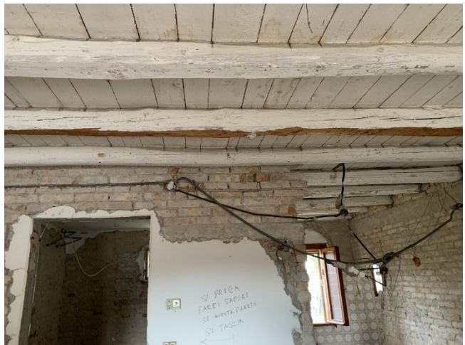
particolare del vetusto impianto elettrico