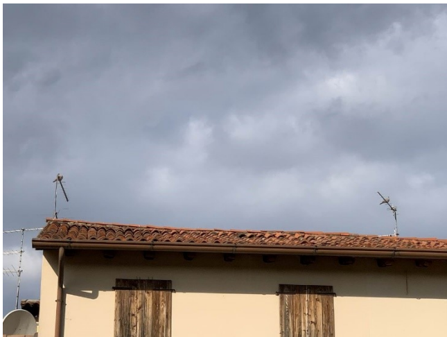
particolare vetusta copertura con cedimenti causa di infiltrazioni d'acqua