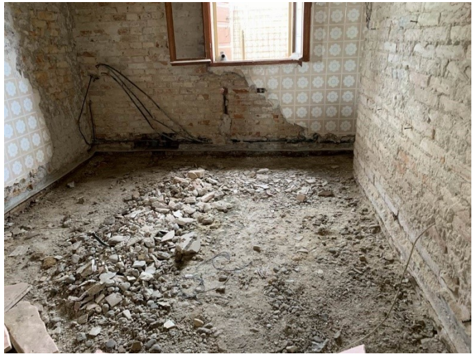
particolare interno del piano terra con pavimento totalmente demolito