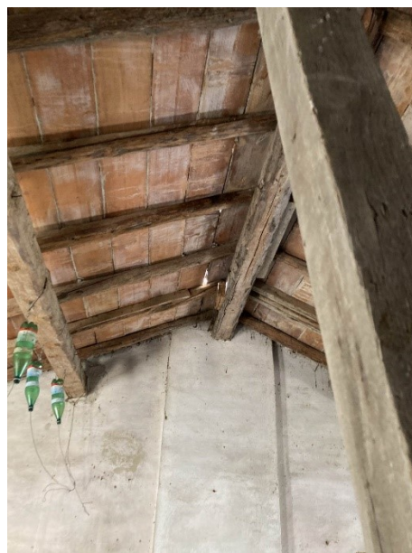
vista del vetusto tetto in legno con cedimenti strutturali e causa di infiltrazioni d'acqua