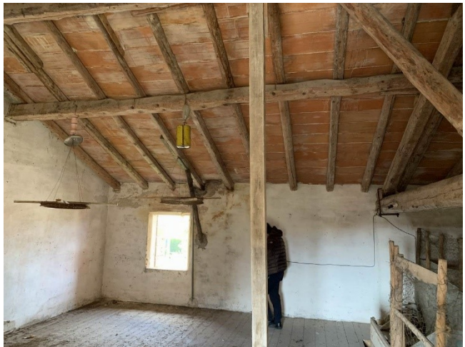
viste interne soffitta