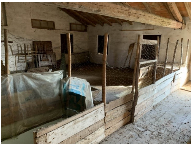
vista interna soffitta non divisa materialmente rispetto alla proprietà terzi