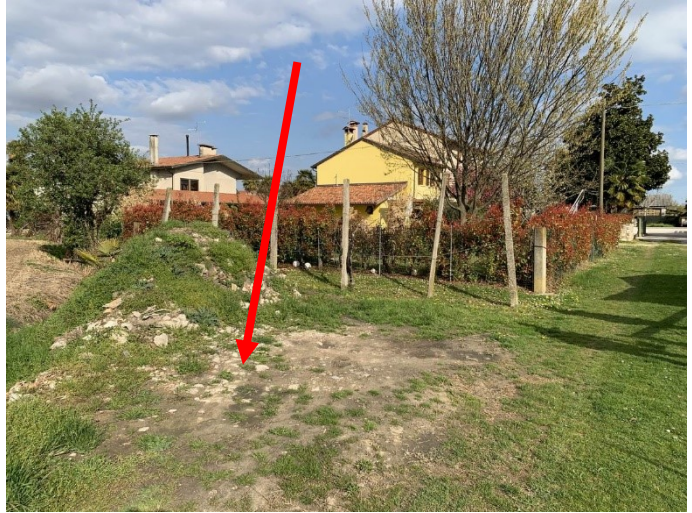
particolare di un'area scoperta esclusiva localizzata confinante con il mappale 99 (lato ovest del mappale 367)