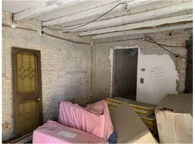
viste interne del locale pranzo