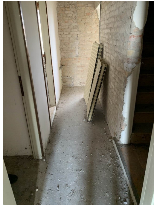
vista corridoio al primo piano