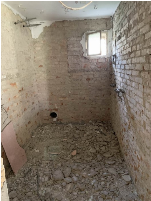
vista della centrale termica/lavanderia