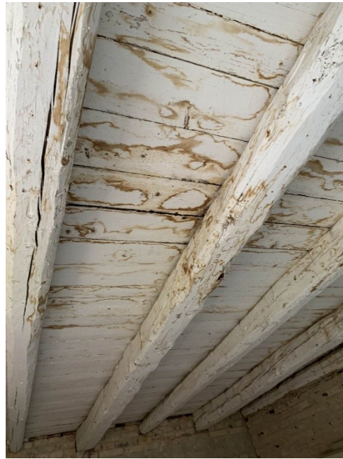
particolare del secondo solaio in legno con tracce di infiltrazioni d'acqua