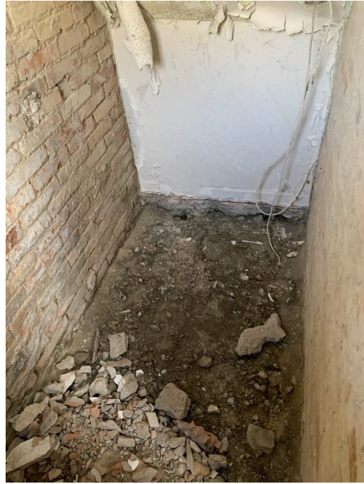
viste del sottoscala/secchiaio