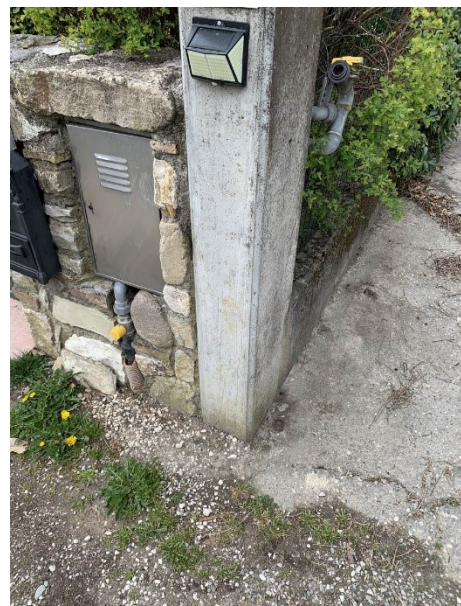
particolare della predisposizione dell'allacciamento alla rete gas metano