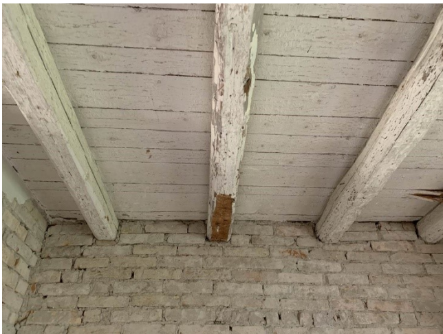
particolare del primo solaio in legno