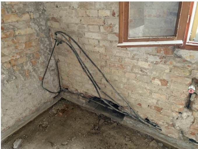
particolare del vetusto impianto termico rimosso