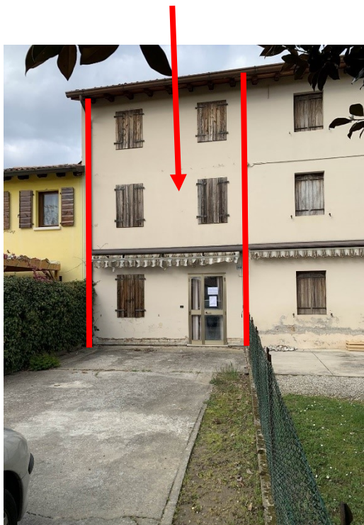
vista esterna del prospetto principale del fabbricato (lato sud con scoperto esclusivo)

fabbricato oggetto di esecuzione immobiliare