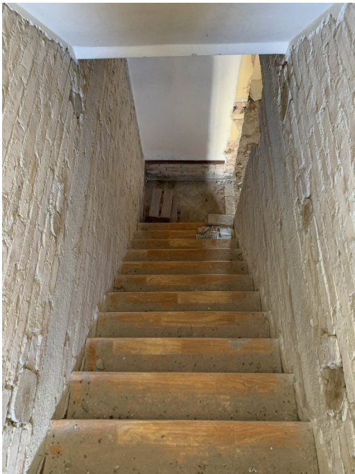
vista scala dal piano terra al primo piano