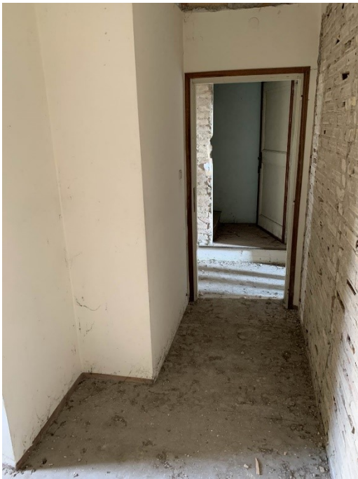
ulteriore vista della cameretta