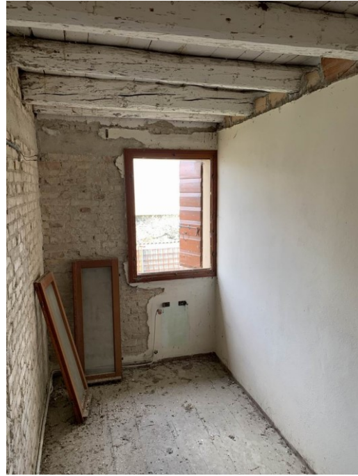
vista della cameretta