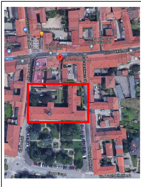
Lotti 001-002-003- Arluno

RELAZIONE DI STIMA IMMOBILIARE N.5 LOTTI – beni in Arluno (MI) ed in Cornaredo (MI)