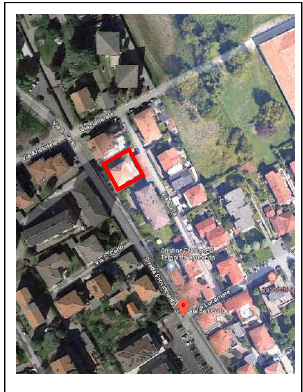
Lotti 004-005 - Cornaredo