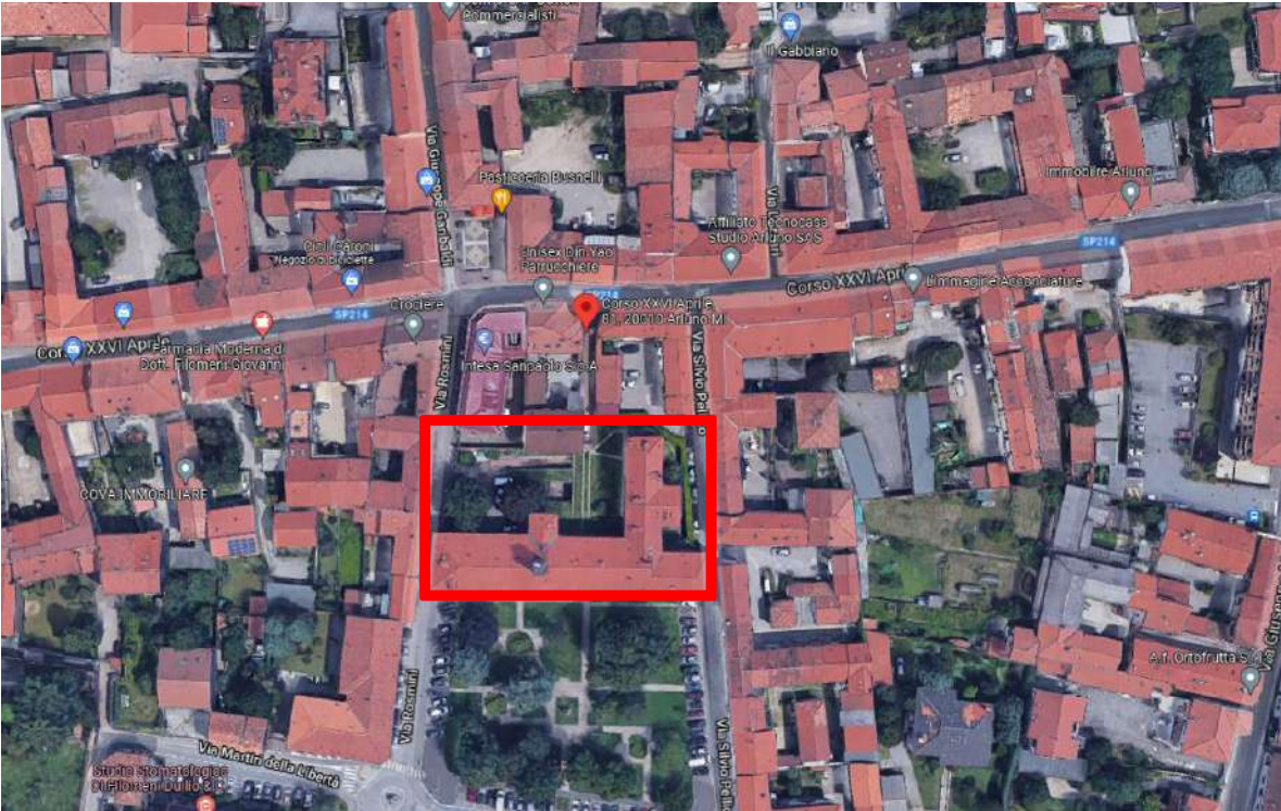
Vista aerea del lotto da Google Maps