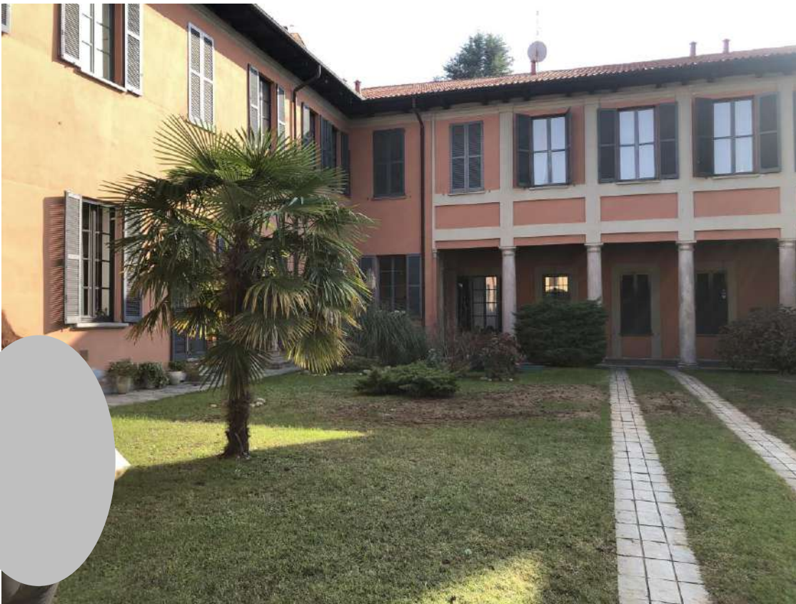
Viste spazi comuni