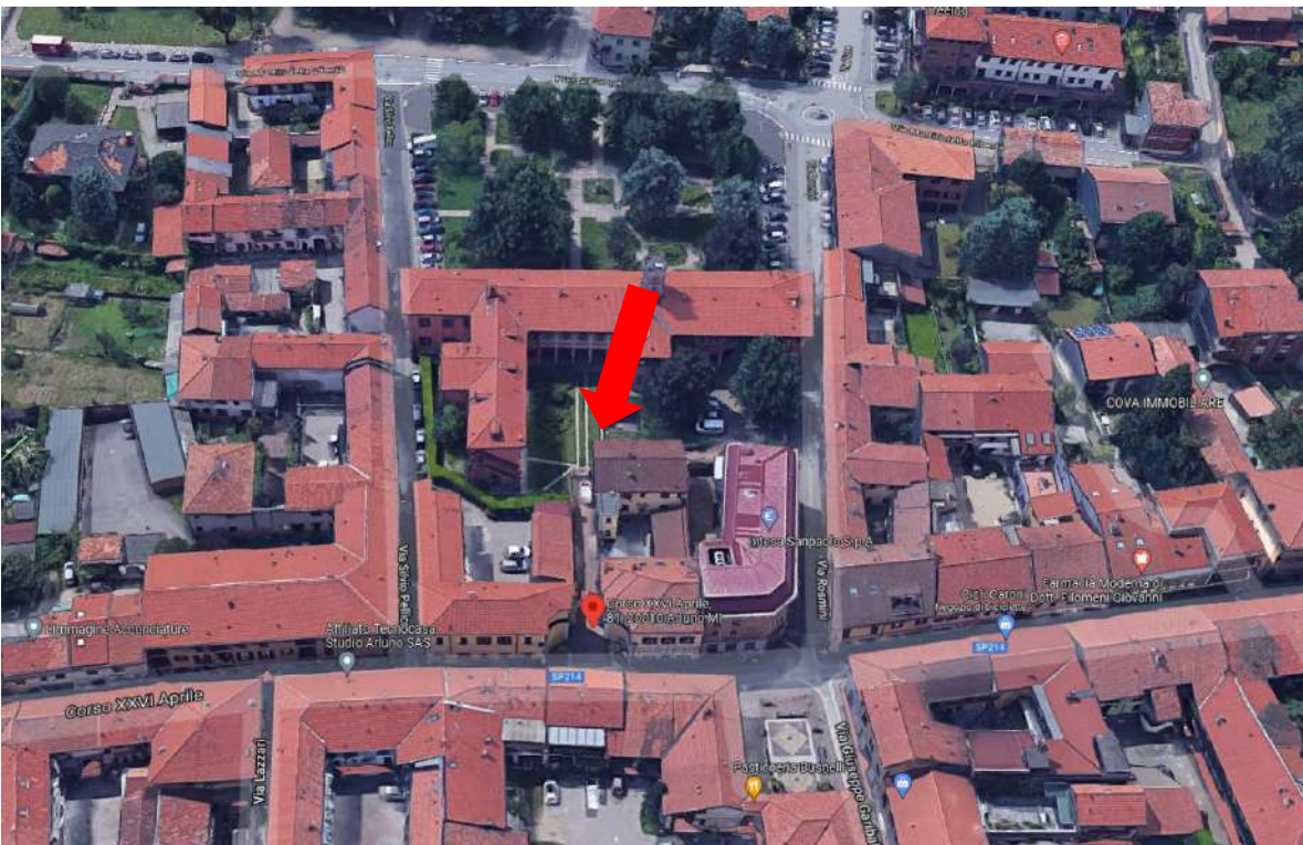
Vista assonometrica del lotto da Google Maps