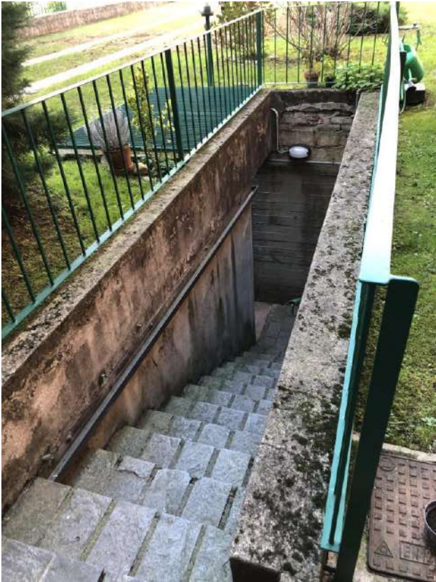
Vista scala esterna accesso ai box