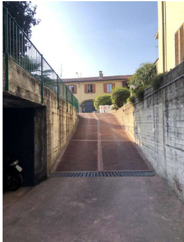
Viste rampa carraia ai boxes