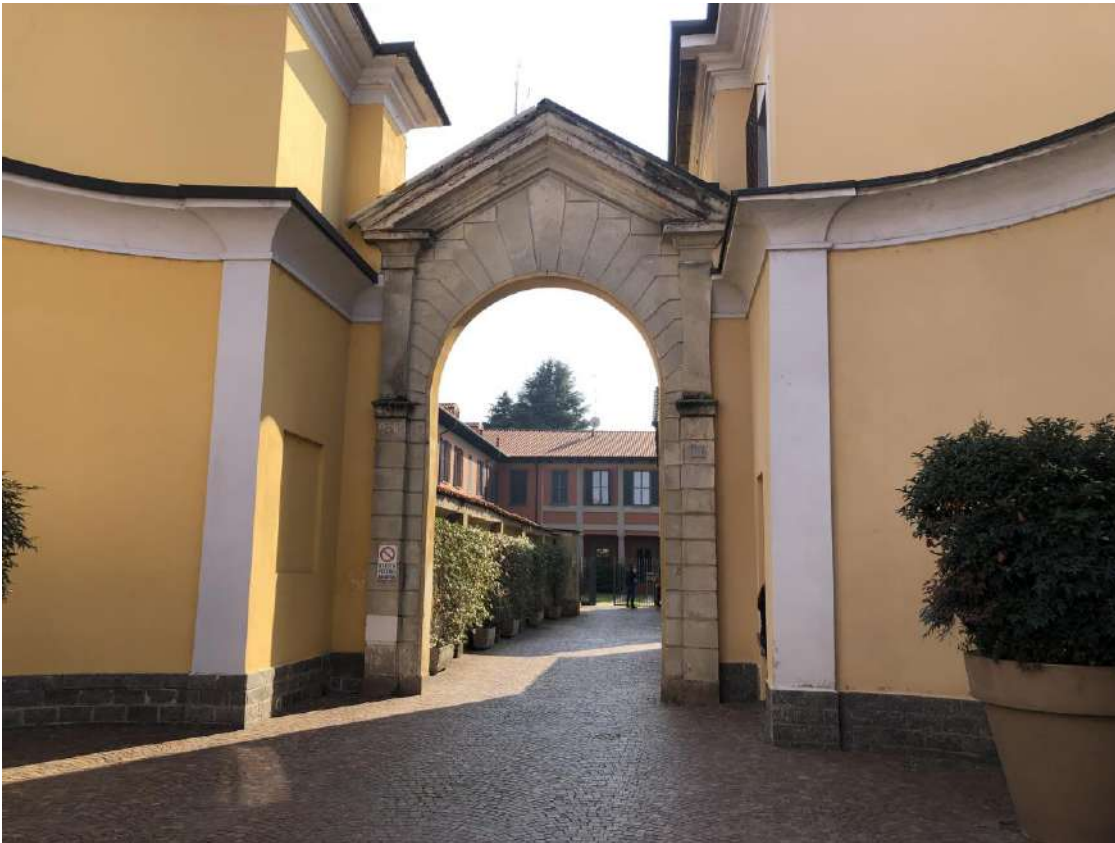
Viste dell'accesso al complesso immobiliare