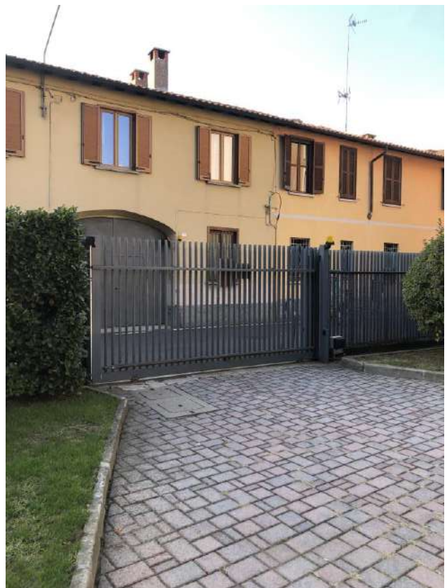
Viste accesso carraio da via Rosmini