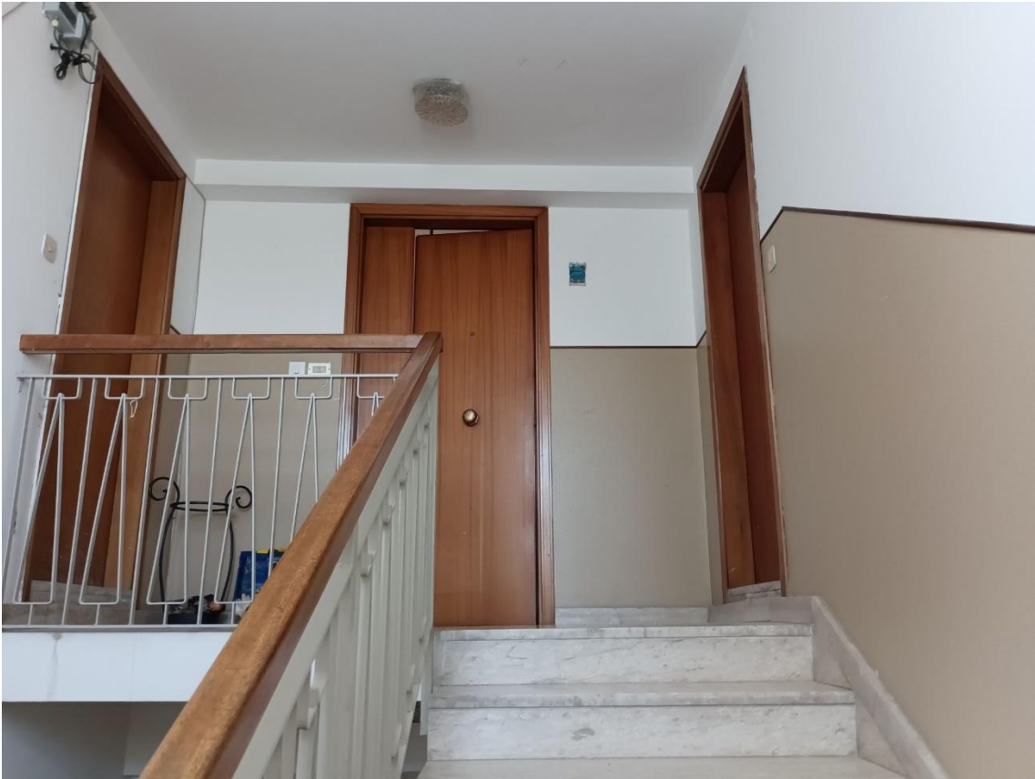
P3 - Ingresso