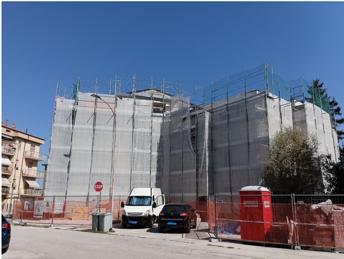
Esterno – Prospetto su via Pieve di Cadore