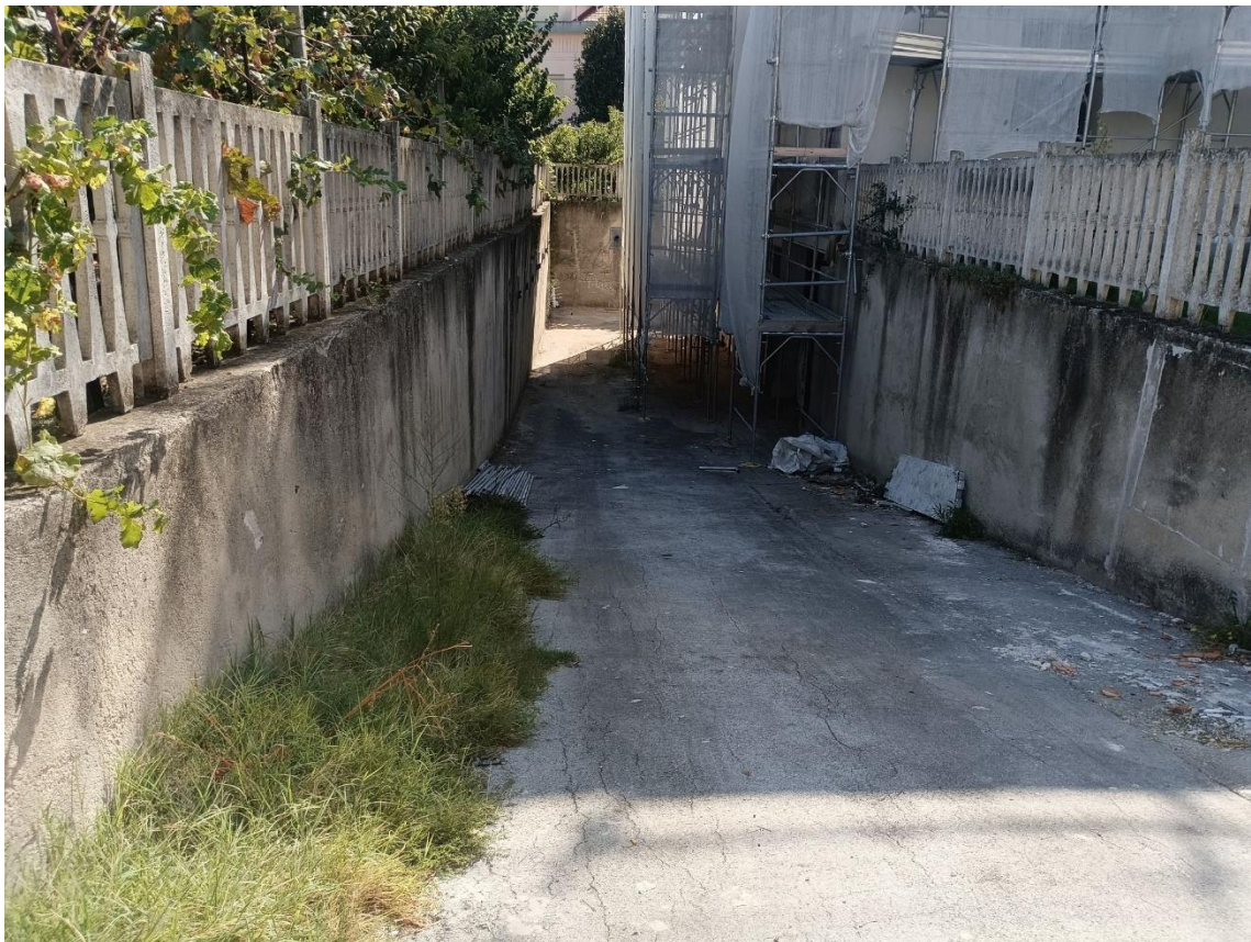
Rampa carrabile di accesso al piano S1 (Via Osoppo)