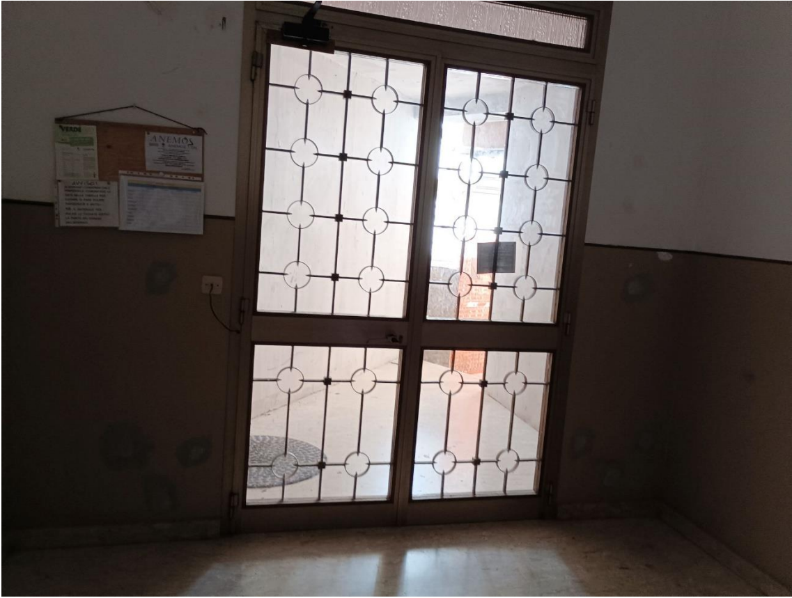
PT – Ingresso comune