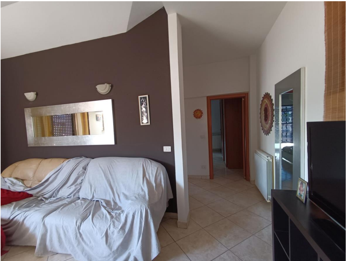
Soggiorno - Disimpegno