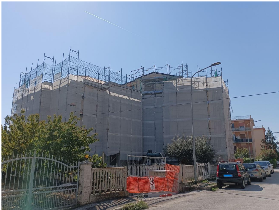
Esterno – Vista da via Osoppo – Prospetti Nord ed Est