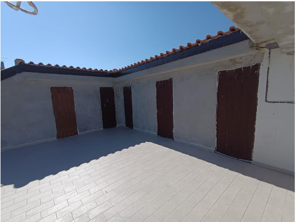
P3 – Soffitte