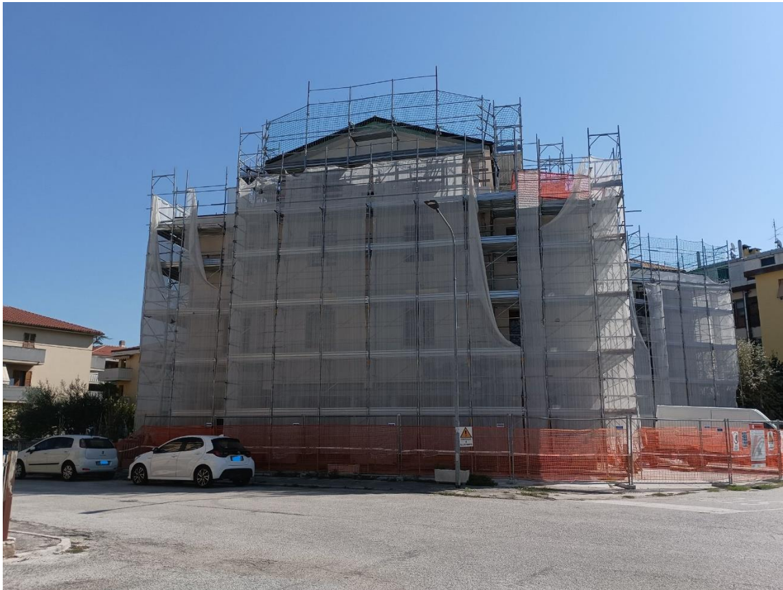
Esterno – Prospetto su via Osoppo