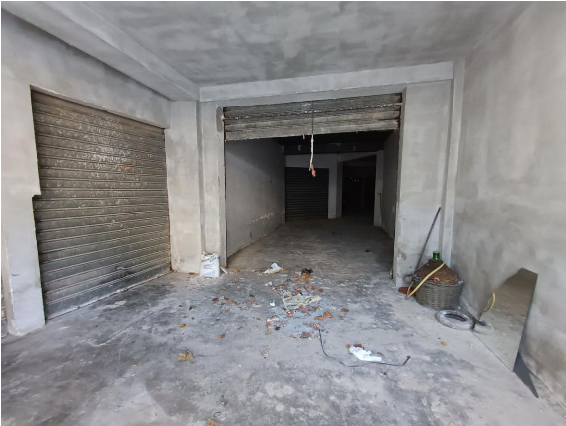
Androne comune di accesso