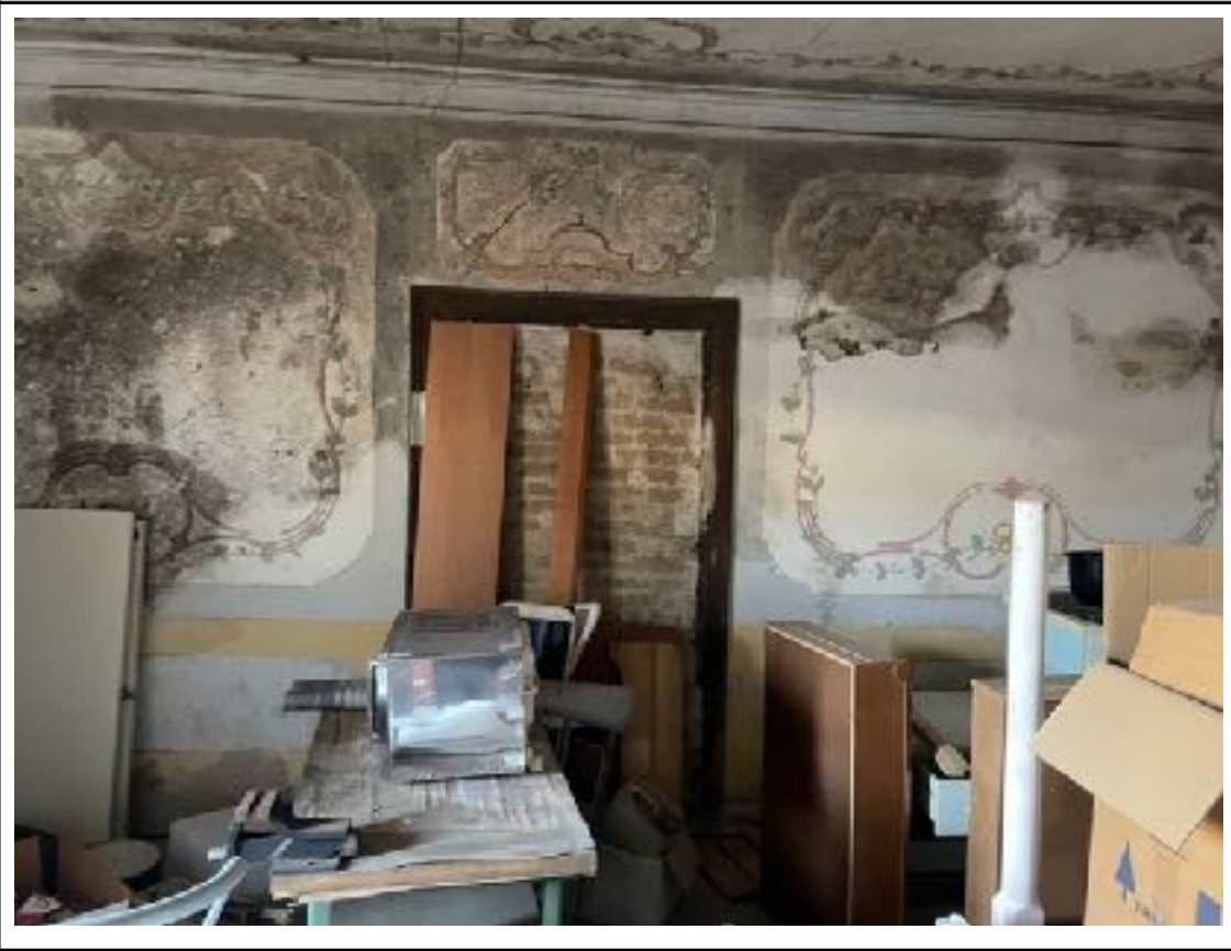
Particolare soffitti piano terra