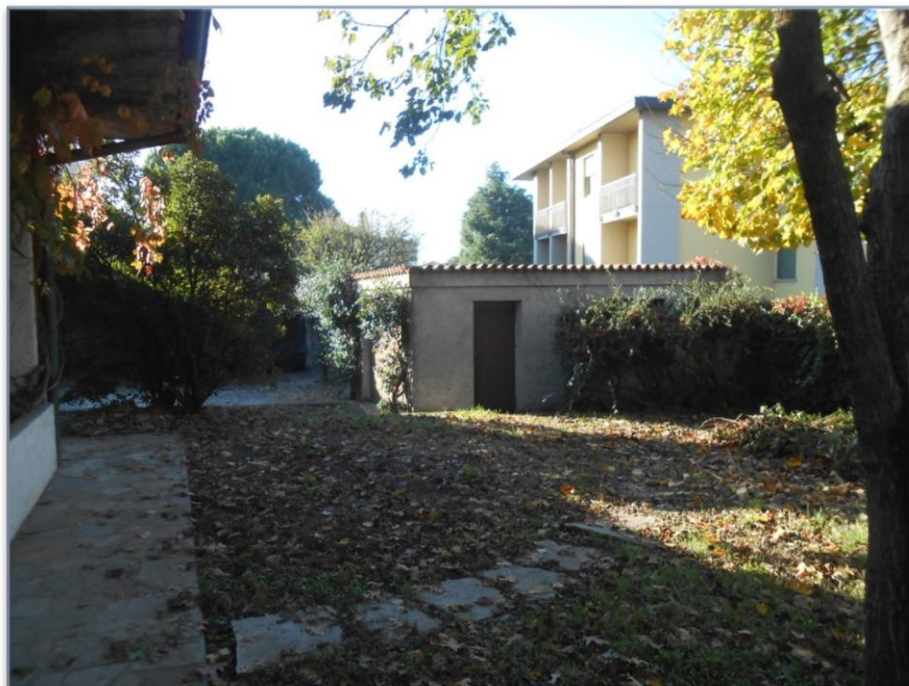
Foto 4 giardino