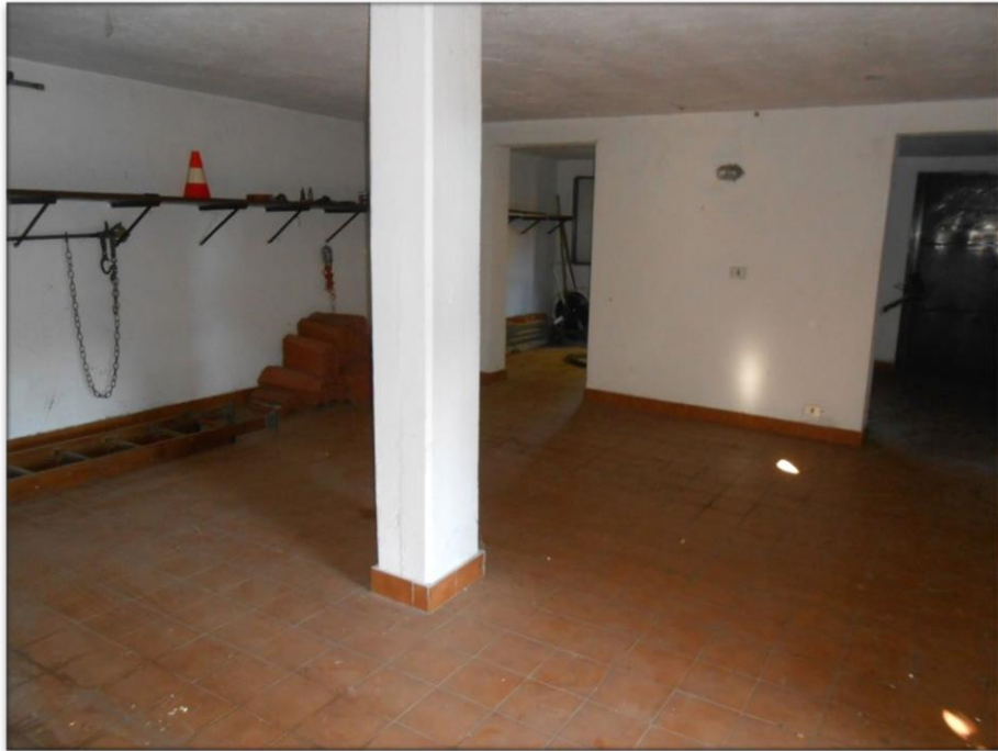
Foto 32 il box