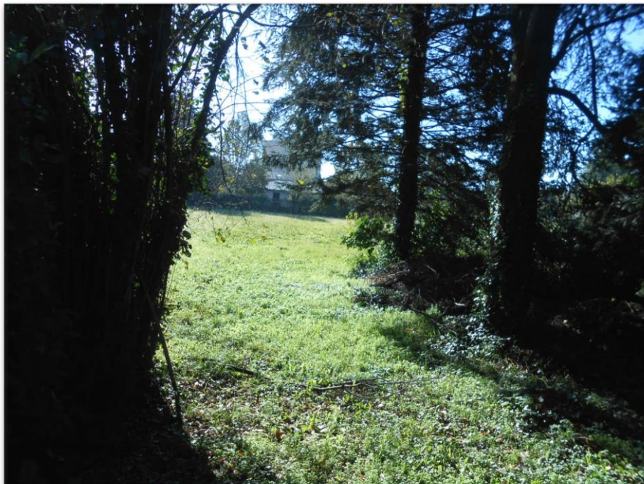
Foto 35 il terreno particella 596