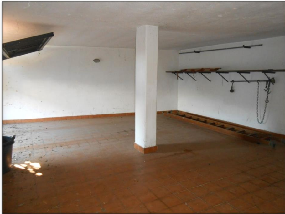
Foto 34 il box