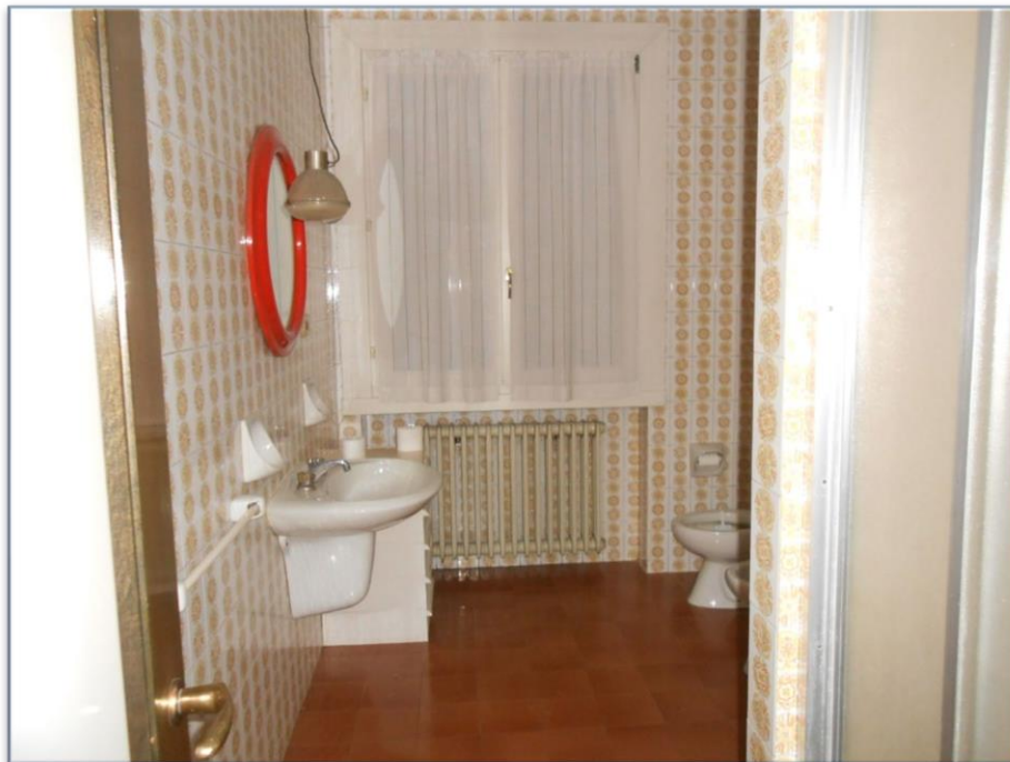
Foto 20 bagno 2