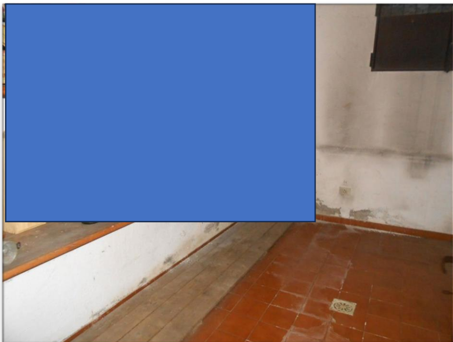
Foto 24 locale cantina