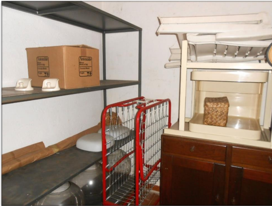
Foto 28 piano interrato