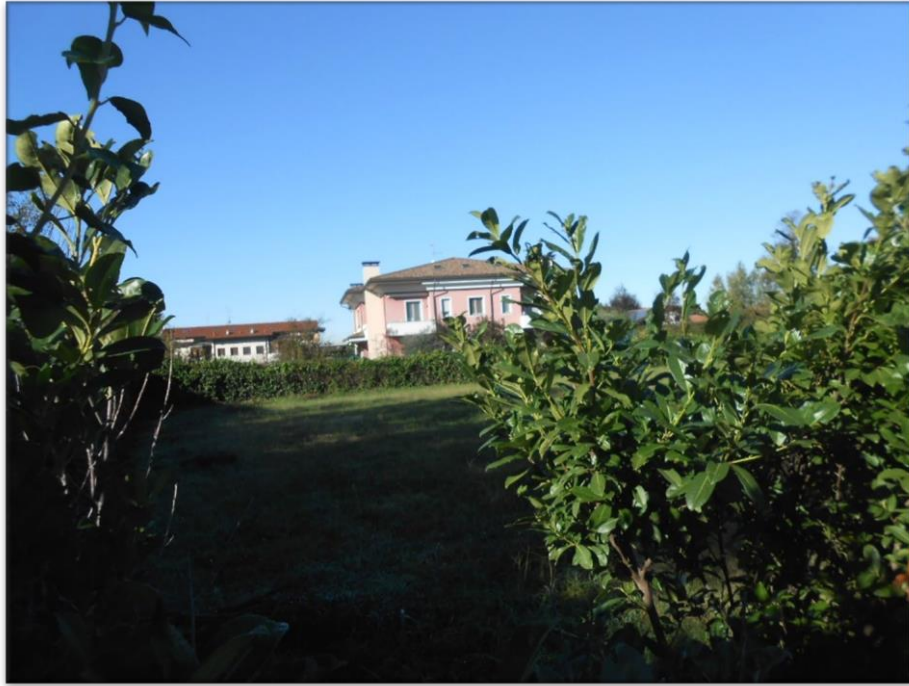
Foto 36 il terreno particella 596