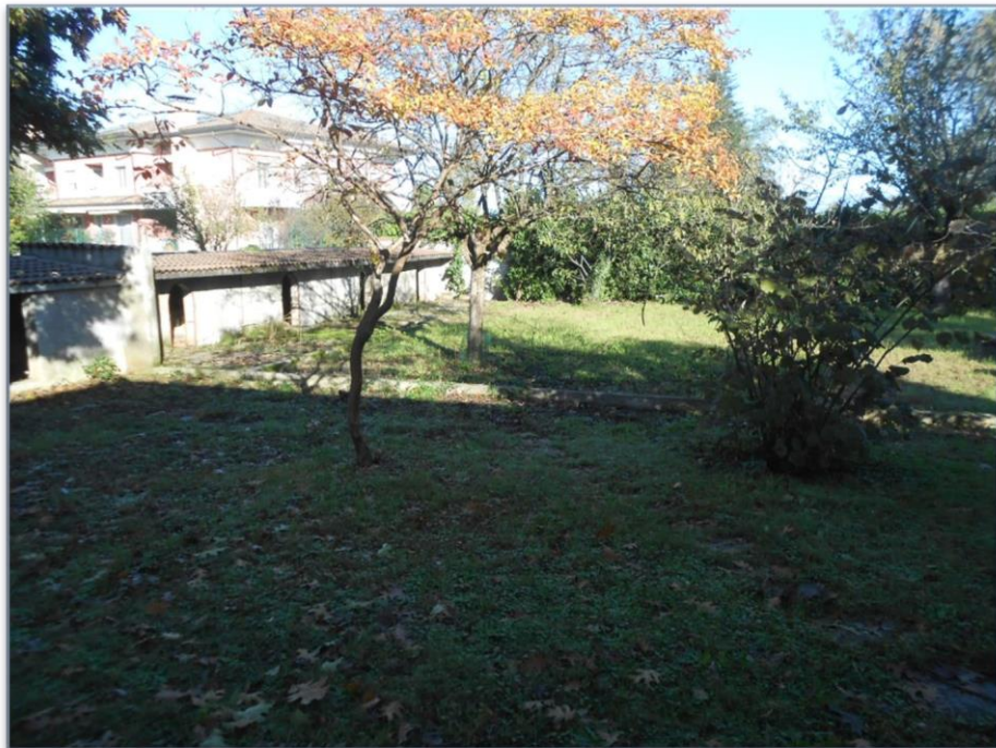
Foto 6 il giardino