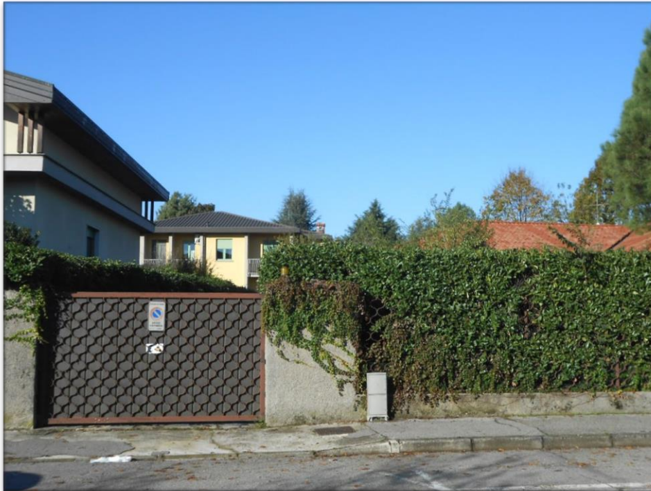
Foto 30 ingresso carrabile