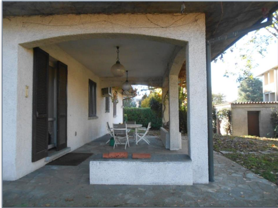
Foto 5 il portico