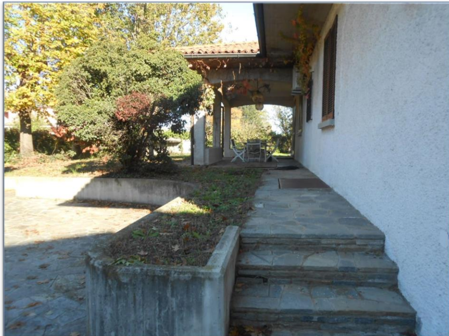
Foto 2 la villa