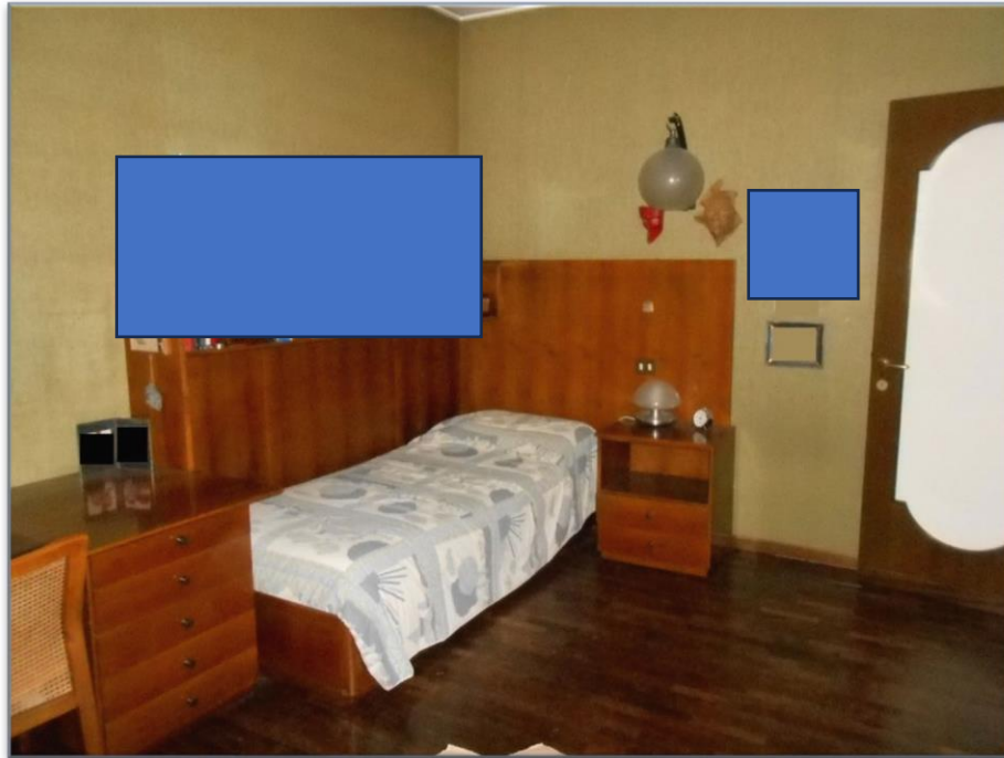
Foto 18 camera 2