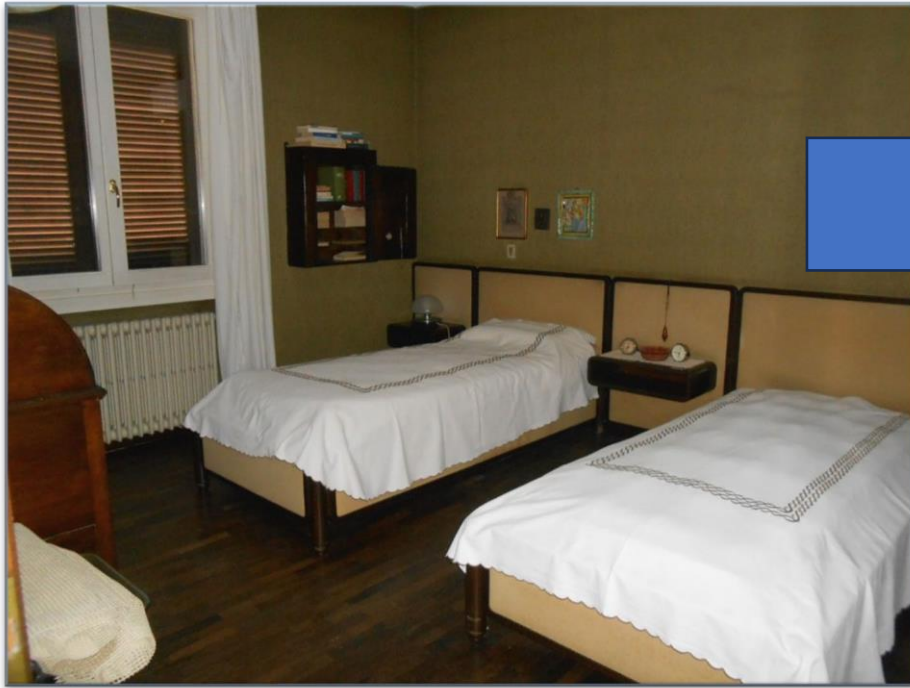
Foto 16 camera doppia