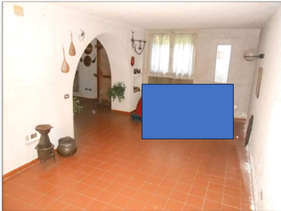
Foto 22 piano interrato