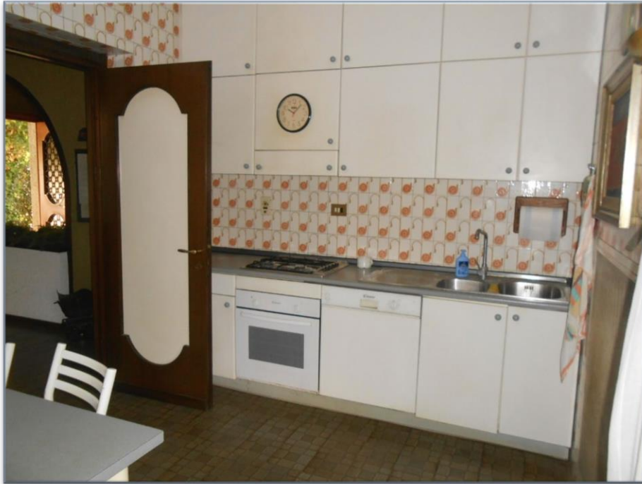
Foto 12 cucina