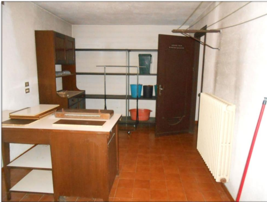
Foto 25 piano interrato