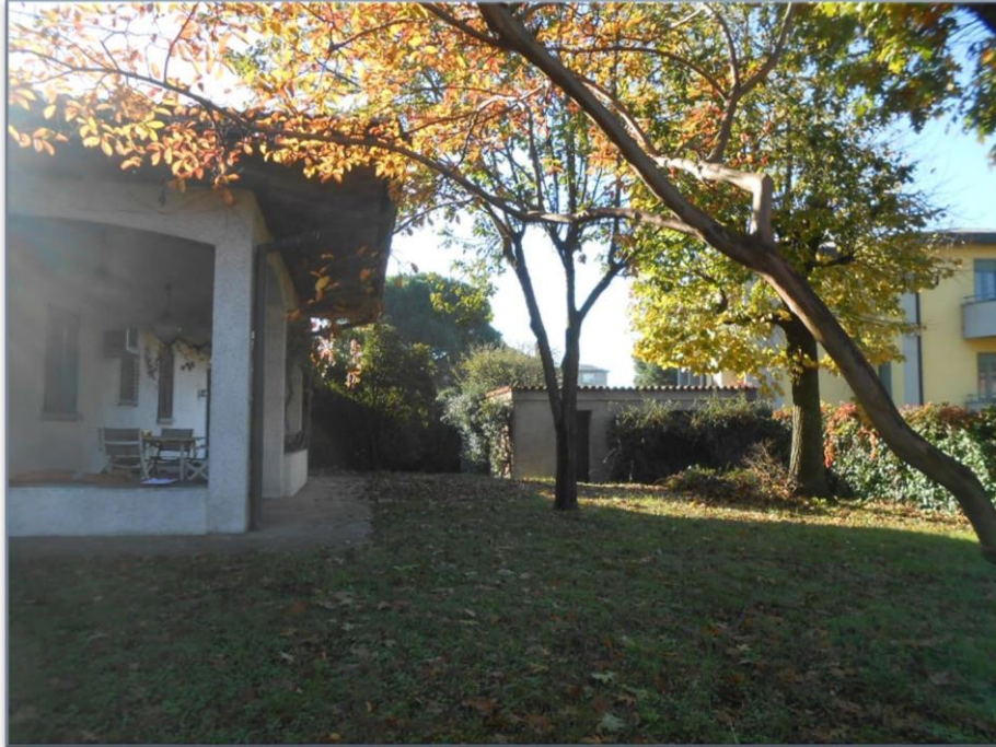
Foto 7 giardino