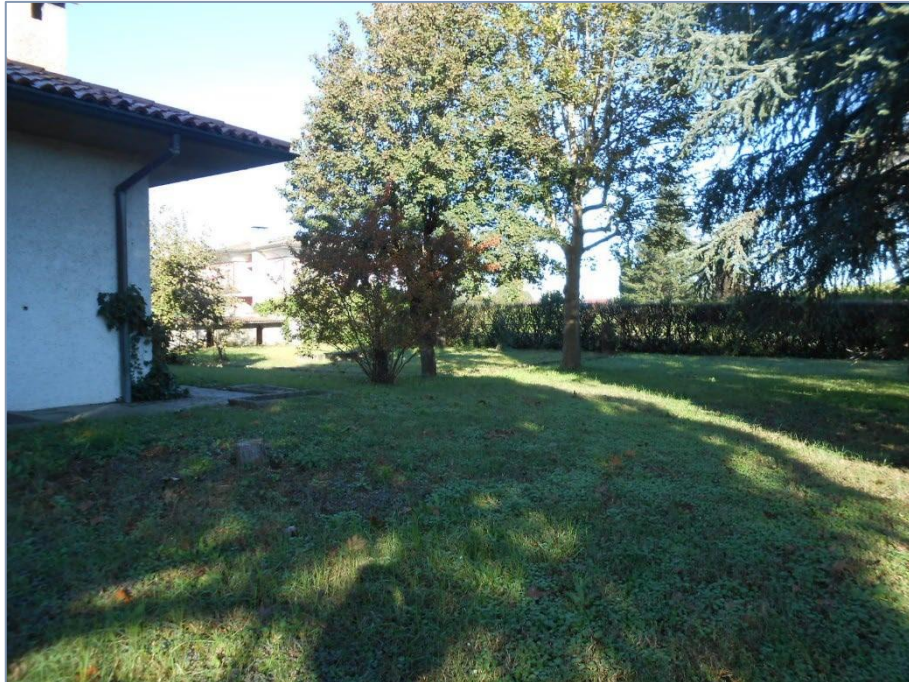
Foto 3 giardino