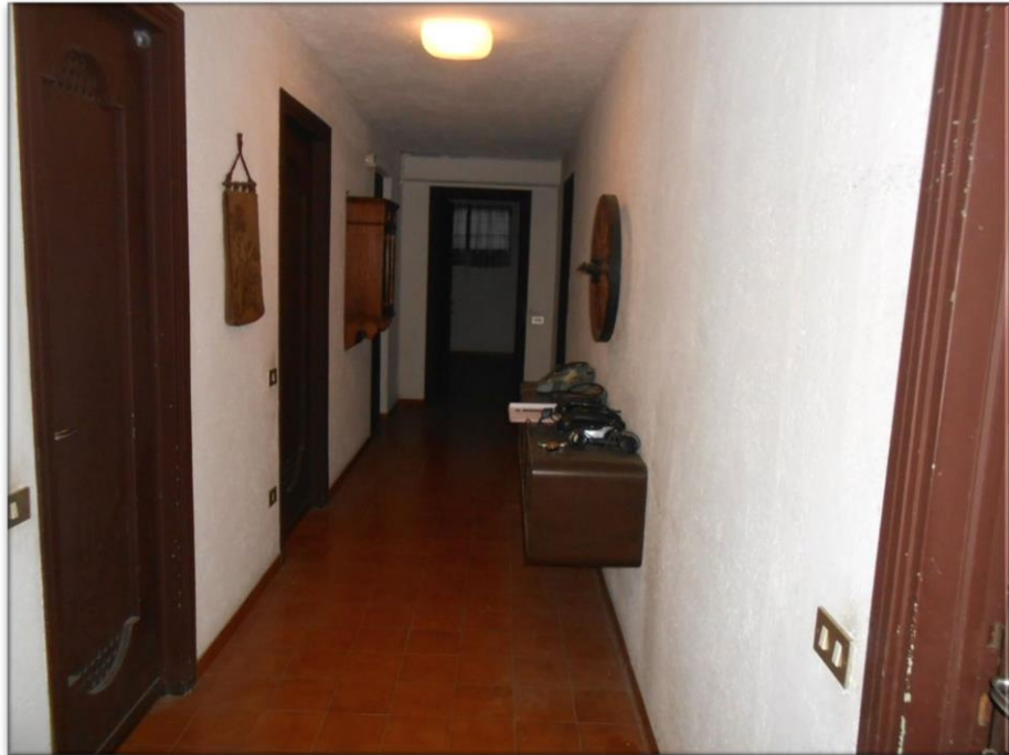
Foto 23 piano interrato