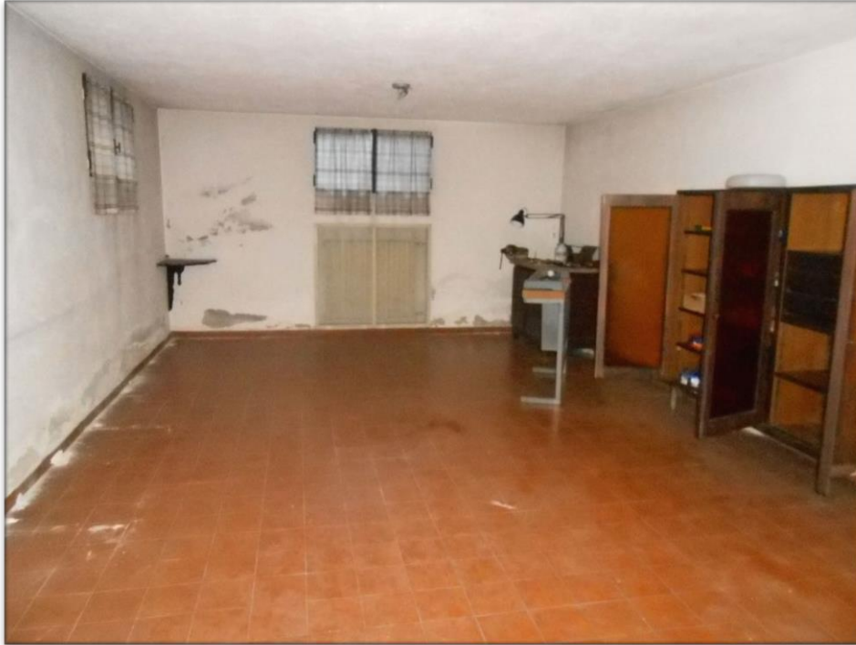
Foto 27 piano interrato