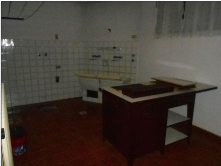
Foto 29 lavanderia