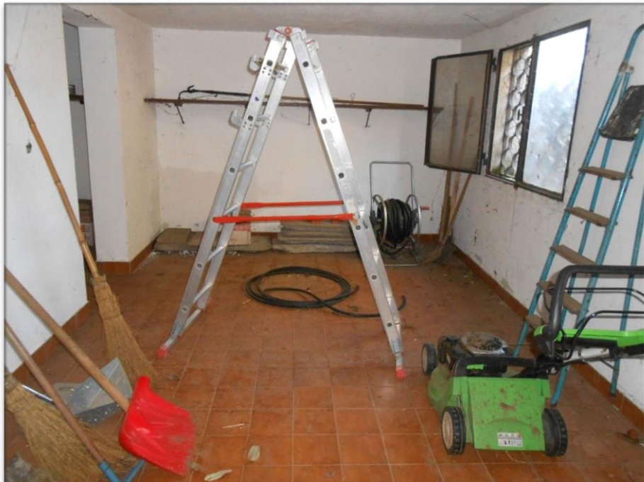
Foto 33 il box