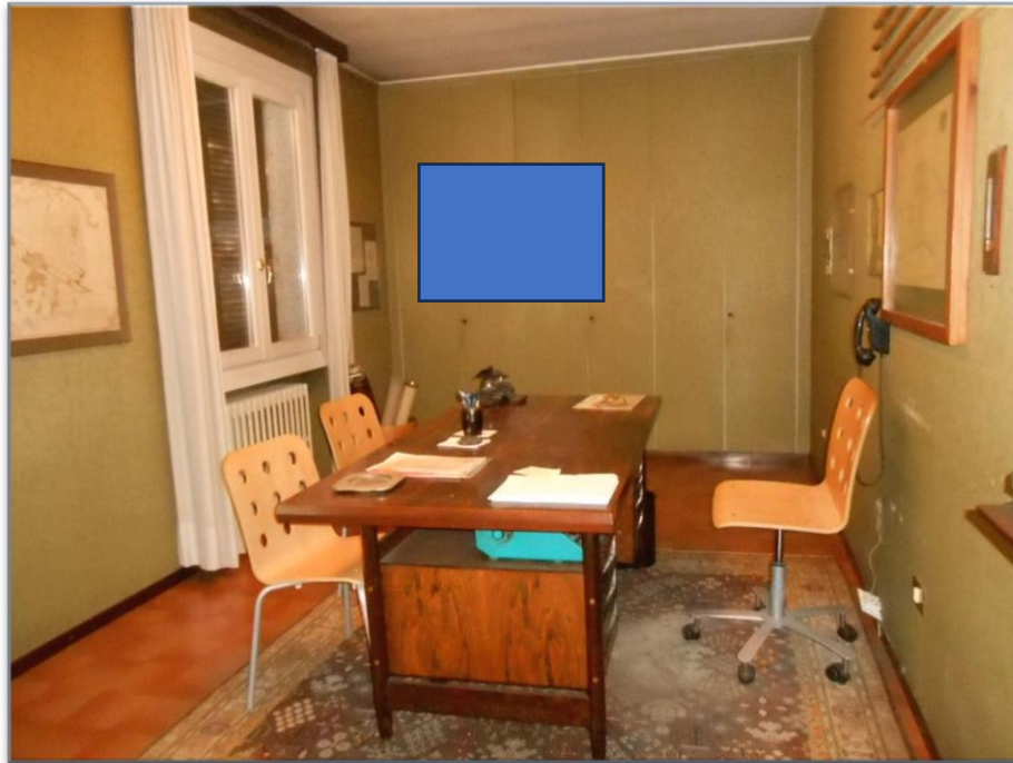
Foto 14 studio