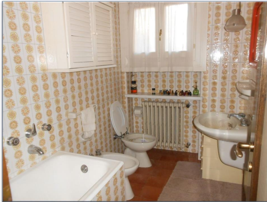
Foto 19 bagno 1