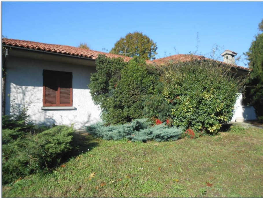
Foto 8 villa