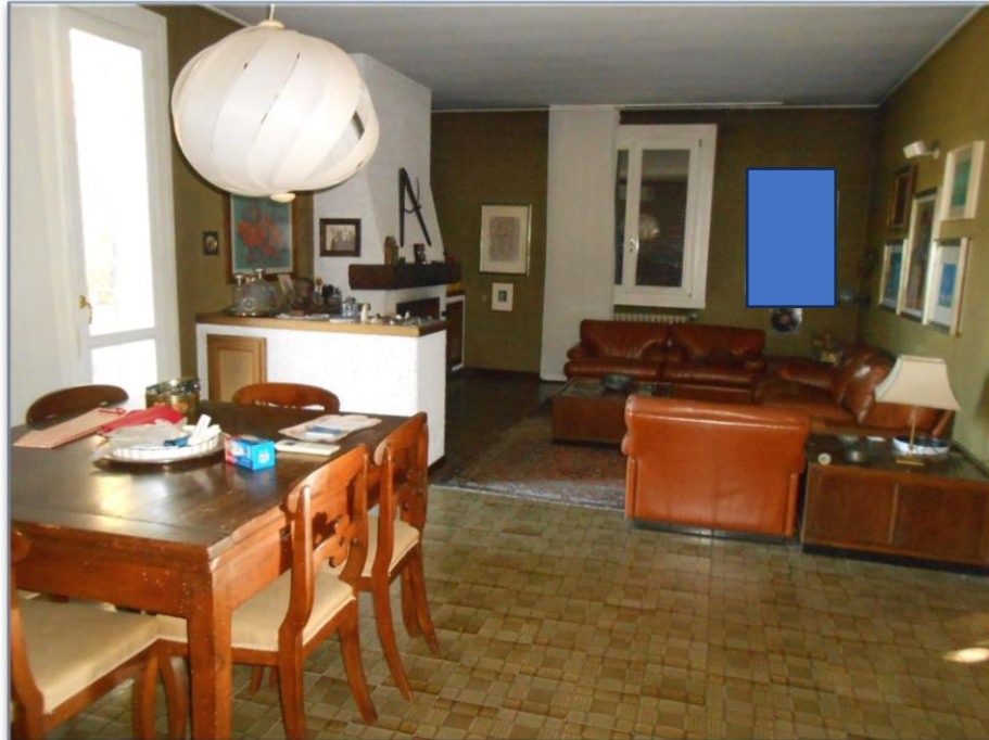
Foto 11 sala