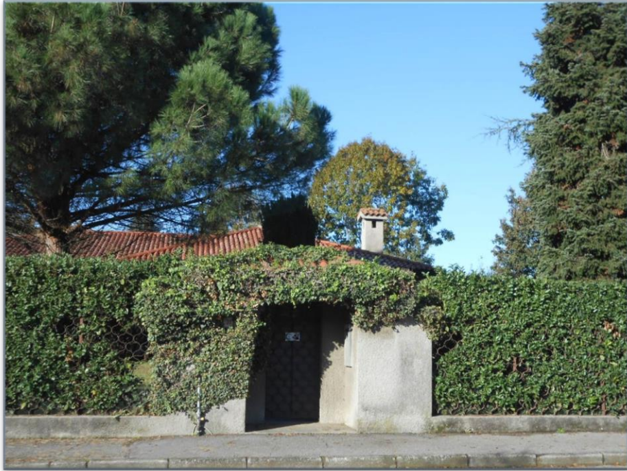
Foto 1 Ingresso alla villa