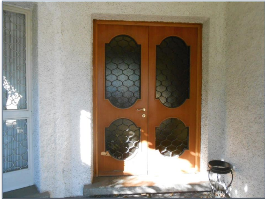
Foto 9 ingresso