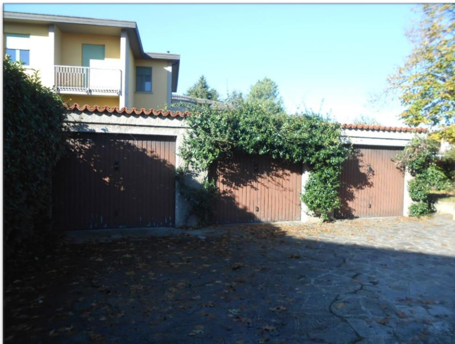
Foto 31 il box