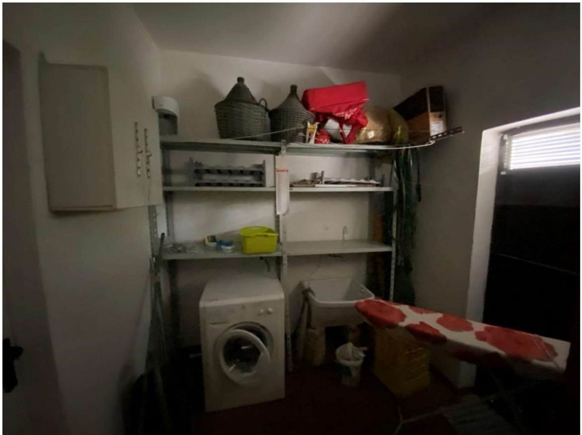
FOTO 14 IL MAGAZZINO RICAVALTO ALL'INTERNO DEL GARAGE