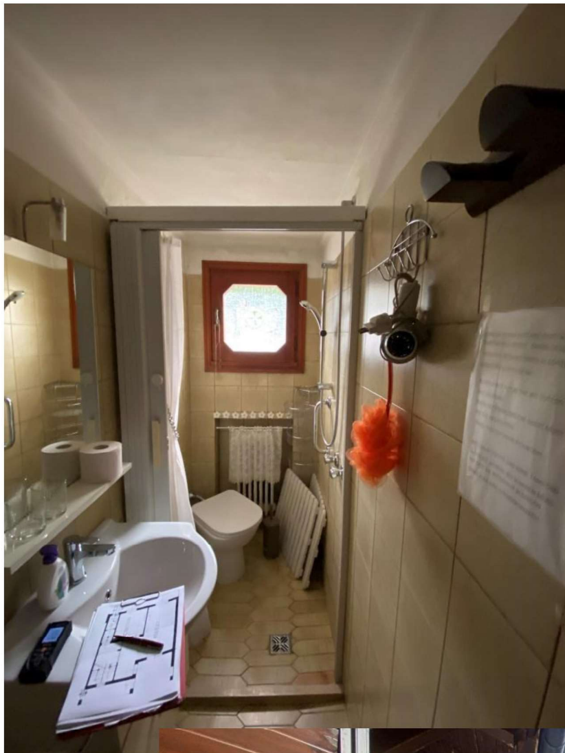
FOTO 7 IL BAGNO AL P. TERRA