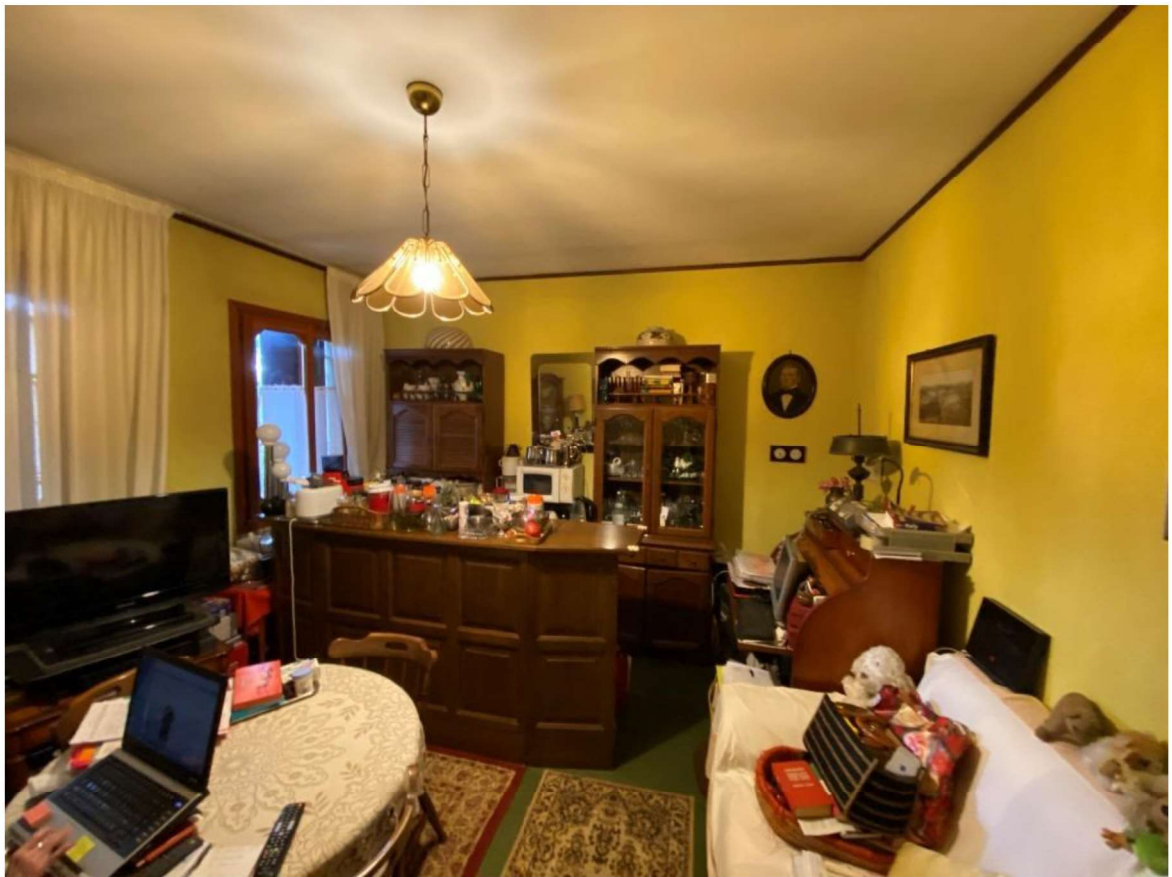
FOTO 12 CAMERA AL PIANO PRIMO