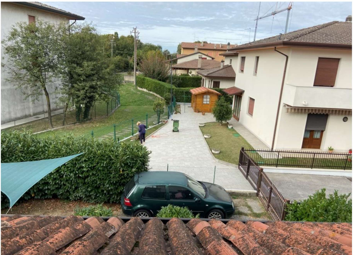
FOTO 11 ESTRENO DAL PRIMO PIANO VERSO L'ACCESSO