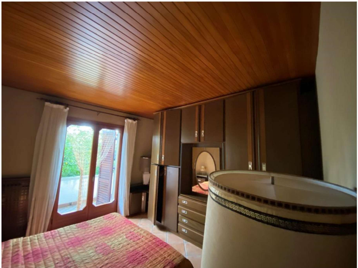
FOTO 5 CAMERA DA LETTO CON USCITA SUL RETRO