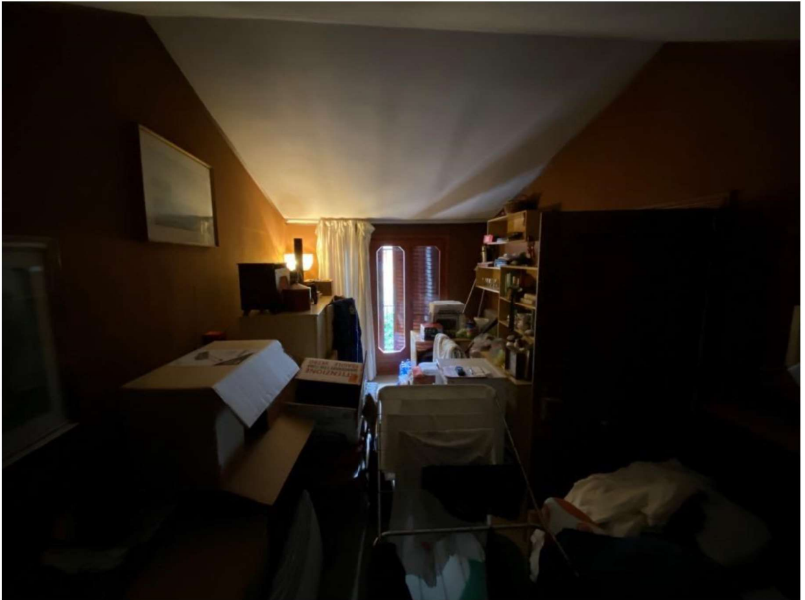
FOTO 10 CAMERA AL PIANO AMMEZZATO