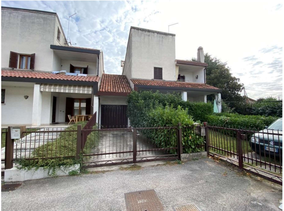
FOTO 1 ESTERNO GARAGE E ABITAZIONE