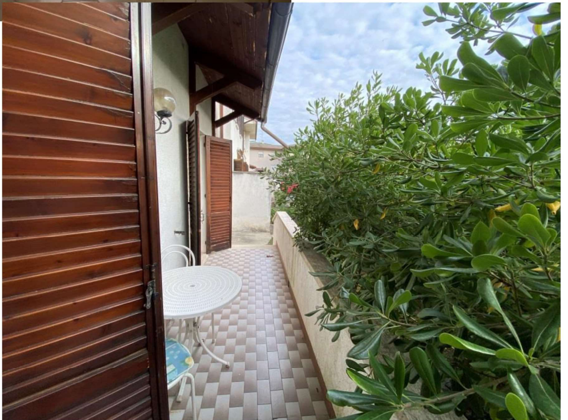
FOTO 8 L'ACCESSO AL RETRO DELLA CASA