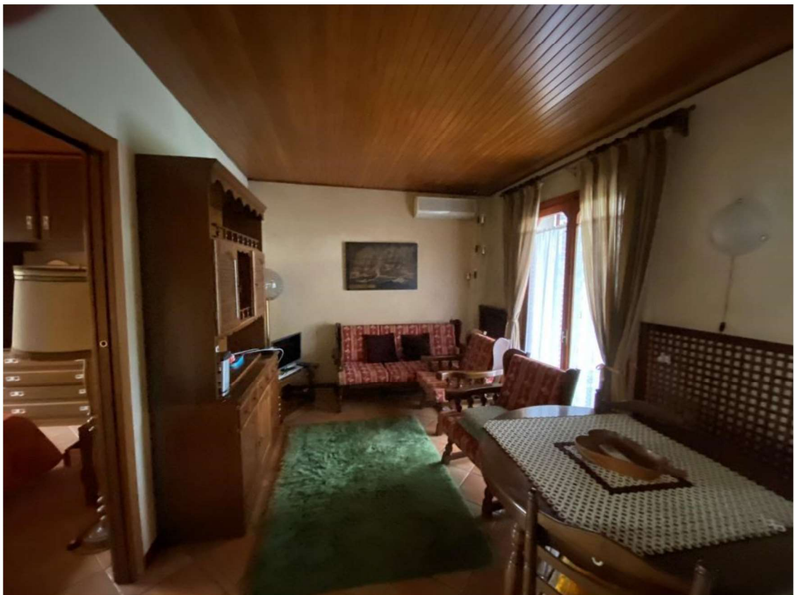
FOTO 4 SOGGIORNO E SULLA SINISTRA IL MURO DIVISORIO (ABUSIVO) CON LA CAMERA DA LETTO