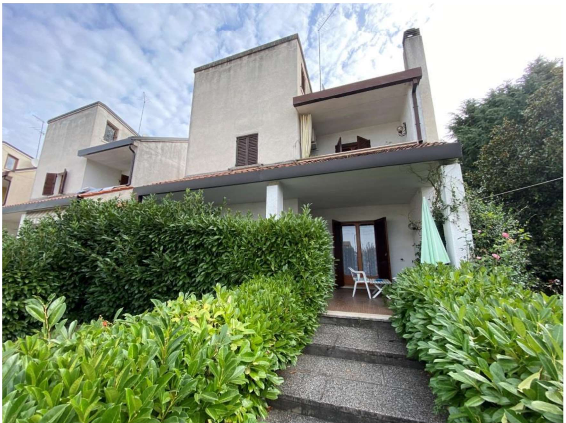
FOTO 2 ESTERNO ACCESSO ABITAZIONE