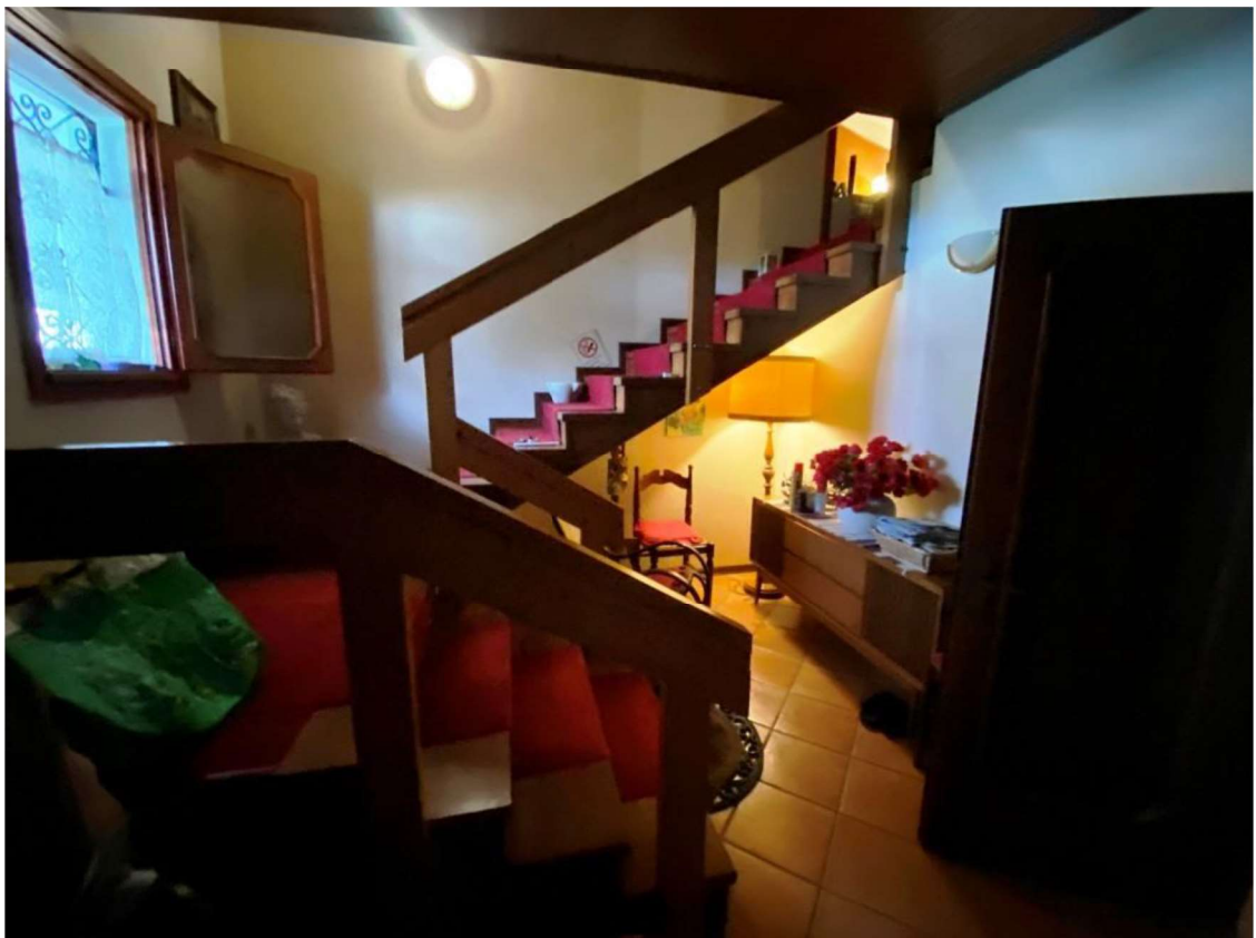
FOTO 6 LA SCALA CHE CONDUCE AL PIANO 1