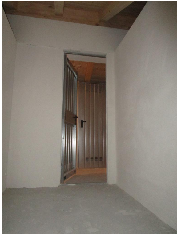
SOLAIO DI PERTINENZA DELL'APPARTAMENTO