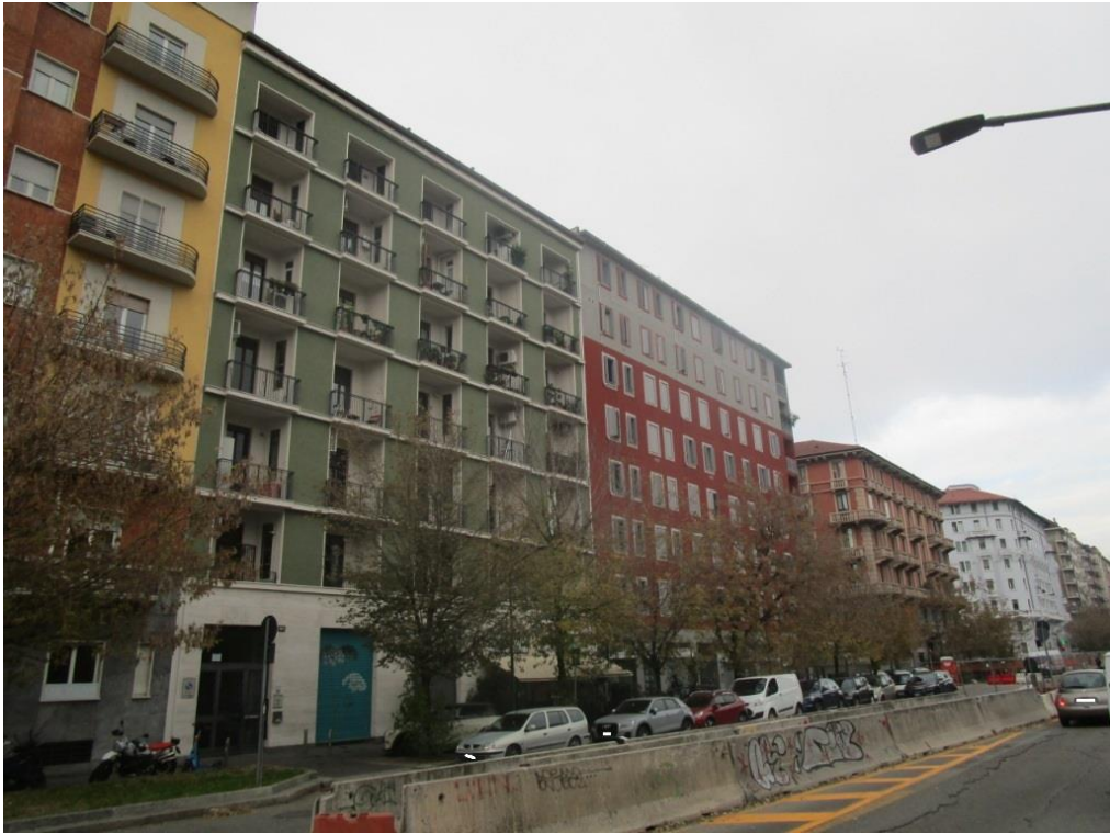
COMPLESSO CONDOMINIALE DI VIA WASHINGTON 106