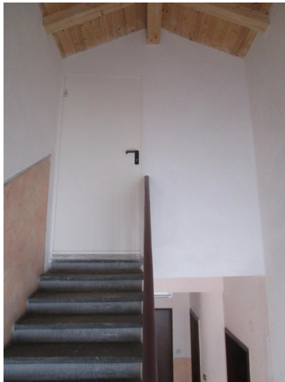
VANO SCALA E PORTA DI ACCESSO AI SOLAI