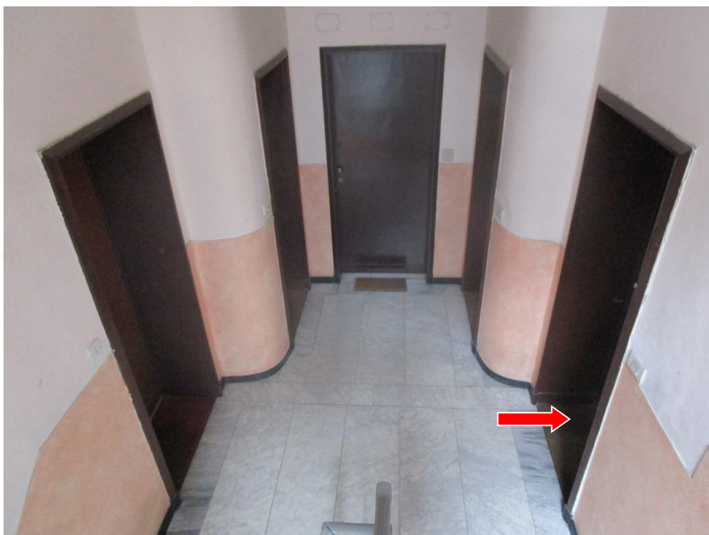
PIANEROTTOLO DI SBARCO AL PIANO PRIMO E INDICAZIONE INGRESSO