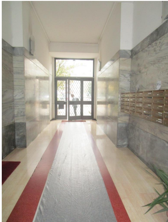
INGRESSO AL CONDOMINIO DI VIA WASHINGTON 106