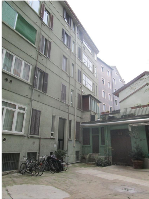
CORPO DI FABBRICA INTERNO