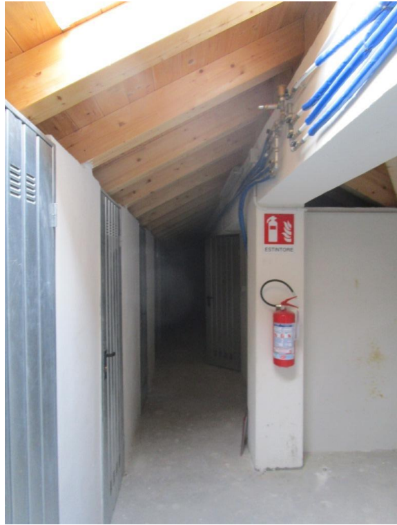
CORRIDOIO COMUNE SOLAI