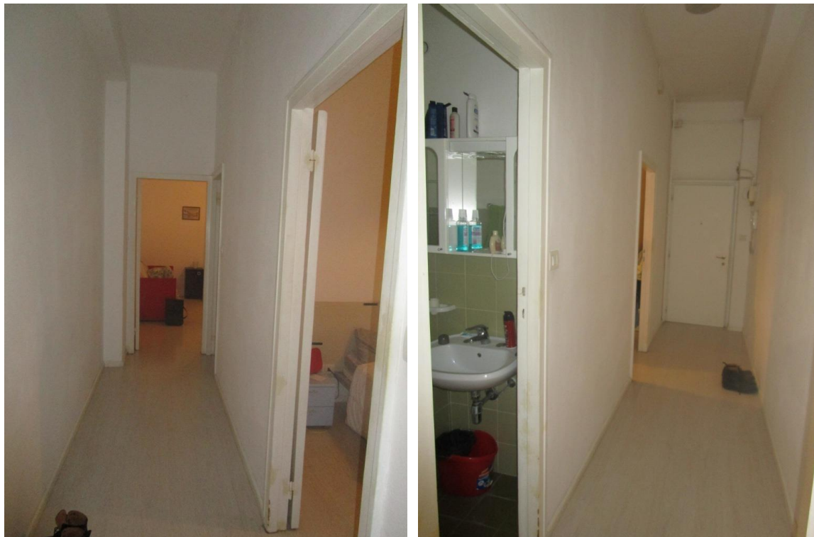
CORRIDOIO DI DISTRIBUZIONE DEI LOCALI