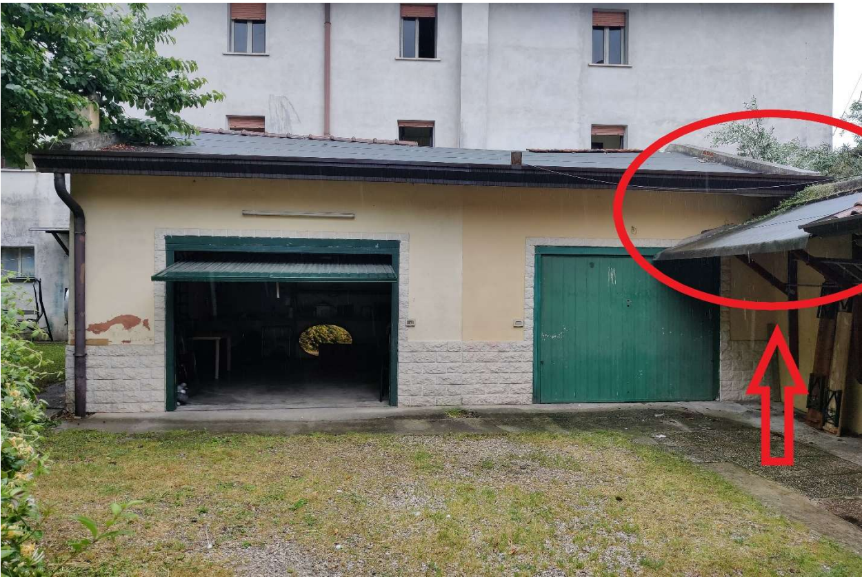
Foto n. 28 – Pensilina comune per la quale non sono stati rinvenuti titoli autorizzativi.