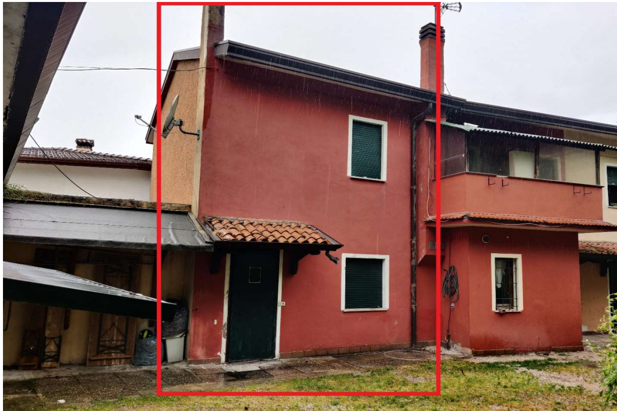
Foto n. 2 – Abitazione vista da scoperto comune (facciata rivolta ad Est) – Porzione evidenziata in rosso).