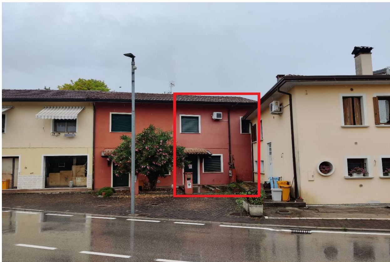
Foto n. 1 – Abitazione vista da via Garibaldi (facciata rivolta ad Ovest) – Porzione evidenziata in rosso.

DOC. FOTOGRAFICA – Beni in Pasiano di Pordenone (PN) – via Garibaldi n. 70.