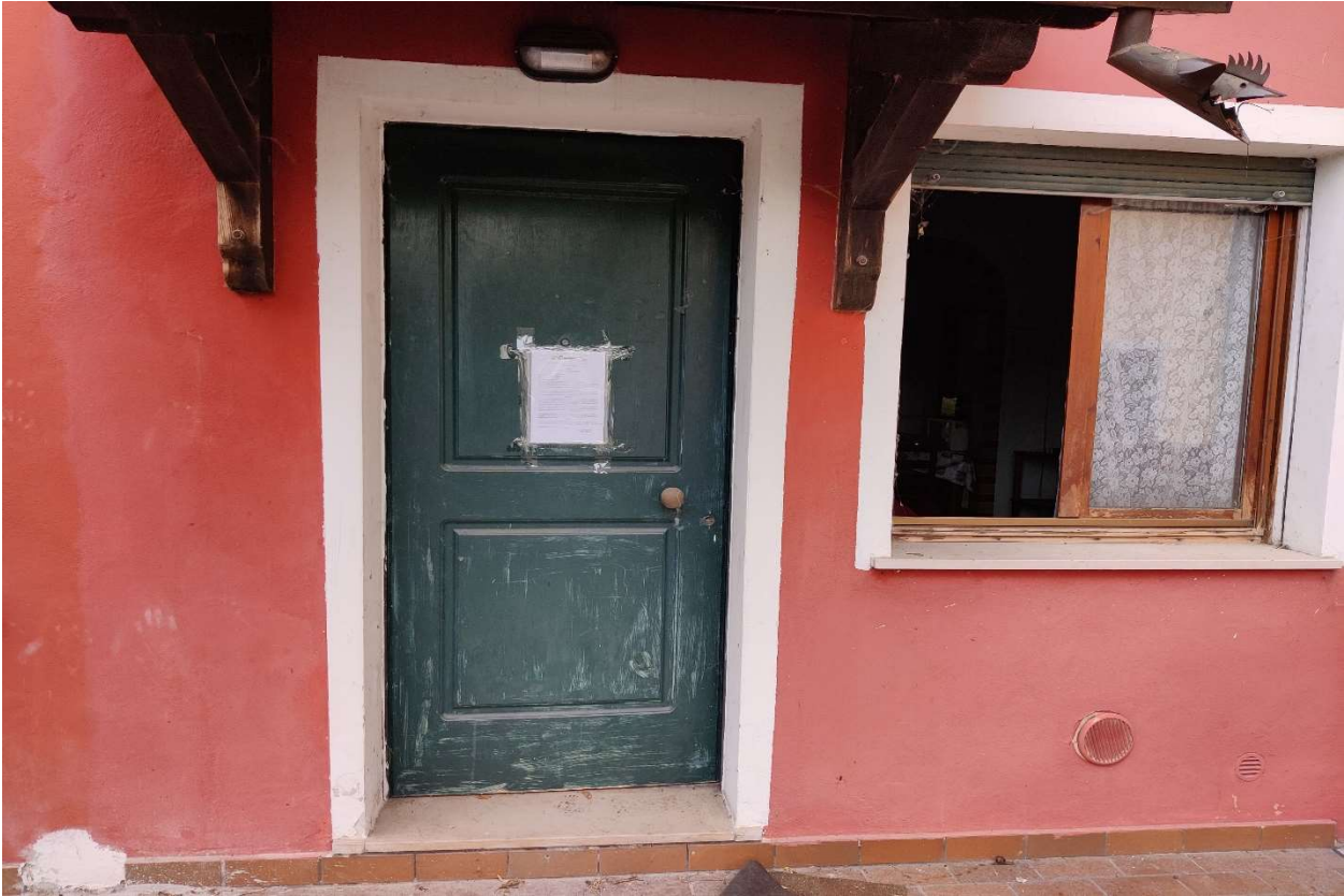
Foto n. 5 – Accesso da via Garibaldi; in evidenza lo stato di degrado dei serramenti.

DOC. FOTOGRAFICA – Beni in Pasiano di Pordenone (PN) – via Garibaldi n. 70.