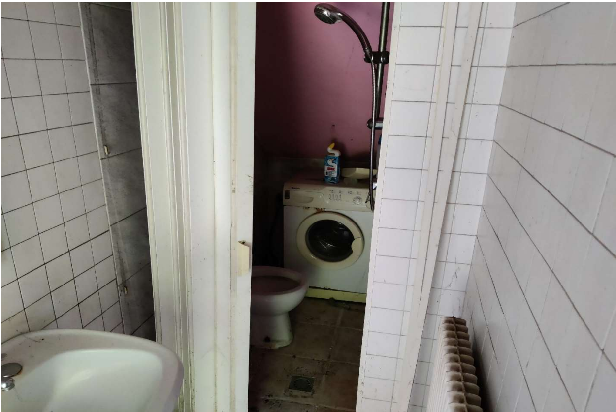
Foto n. 10 – Disimpegno e ripostiglio adibito a servizio igienico.