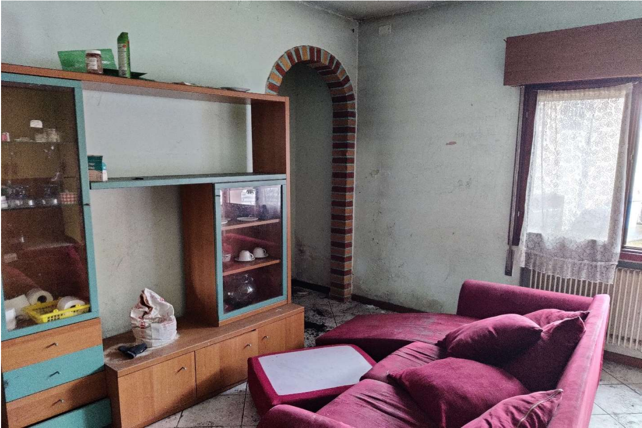
Foto n. 7 – Ingresso - soggiorno, con in evidenza rifiniture in mattoni colorati.

DOC. FOTOGRAFICA – Beni in Pasiano di Pordenone (PN) – via Garibaldi n. 70.