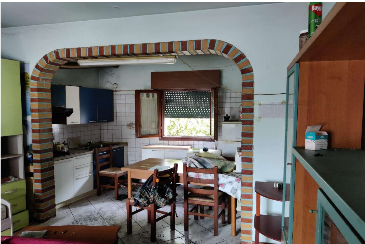
Foto n. 8 – Ingresso - soggiorno - cucinino, con in evidenza rifiniture in mattoni colorati.