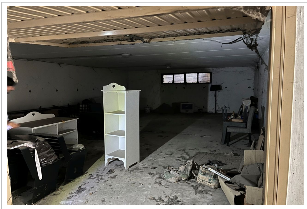
Fotogramma 3/5 – Particolare del garage.