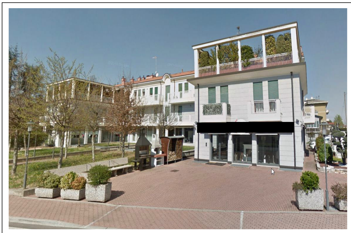
Fotogramma 1/5 – Particolare prospetto sud-est dell'intero edificio.