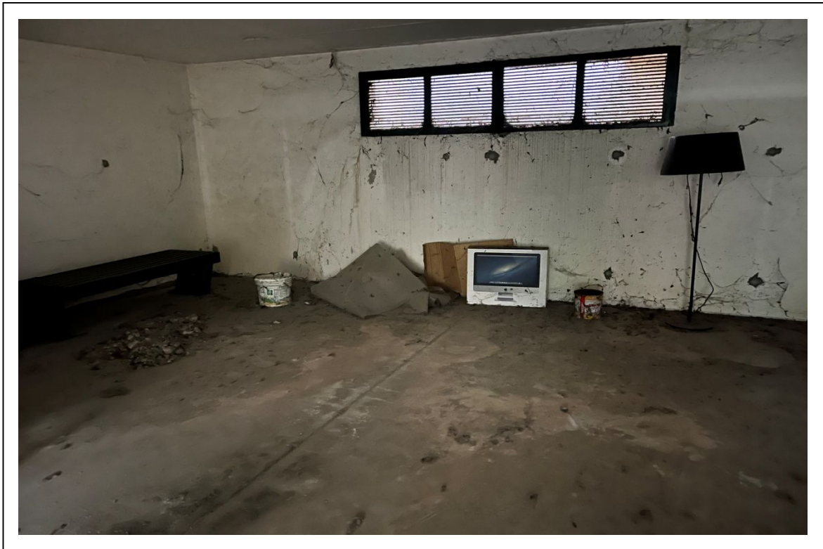
Fotogramma 5/5 – Particolare del garage.