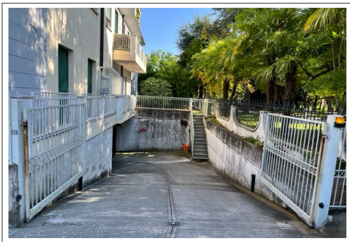
Fotogramma 2/5– Particolare dell'accesso carraio e della rampa.