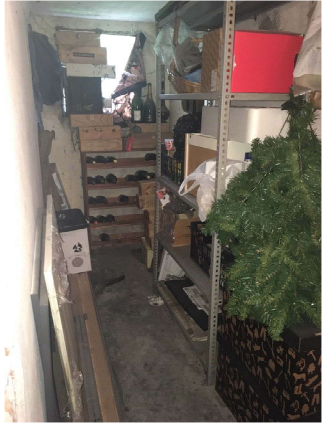
Foto n. 19 -20- 21: ingresso e interno del magazzino al P.T.