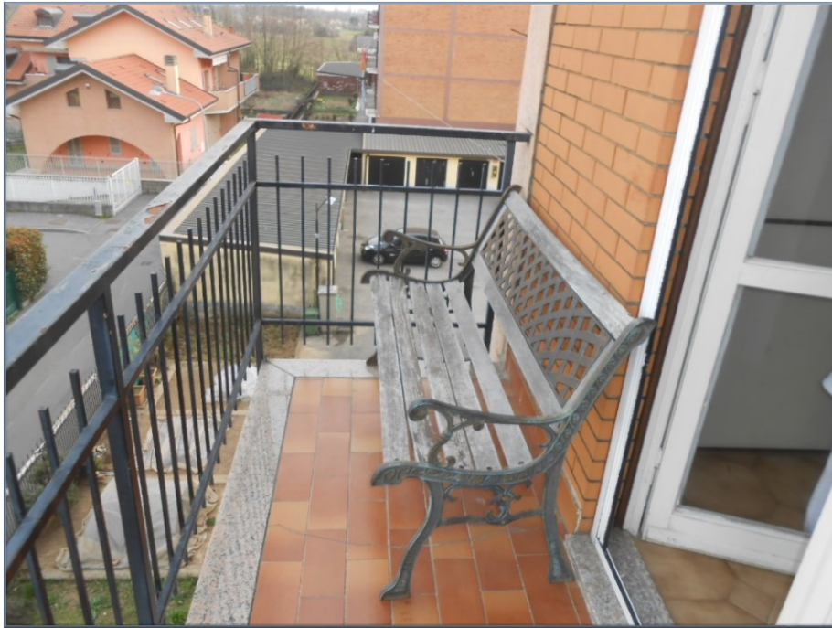
Foto 15 balcone 2