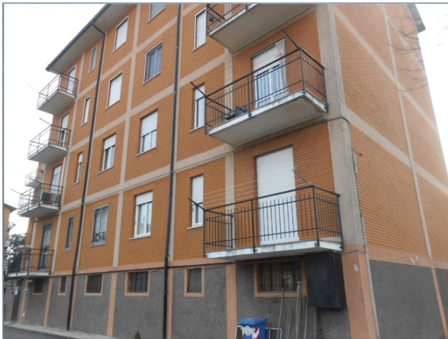
Foto 2 vista dell'edificio