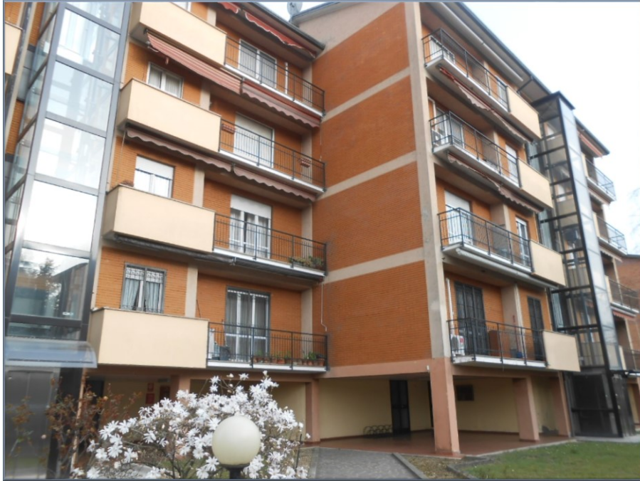
Foto 1 vista dell'edificio