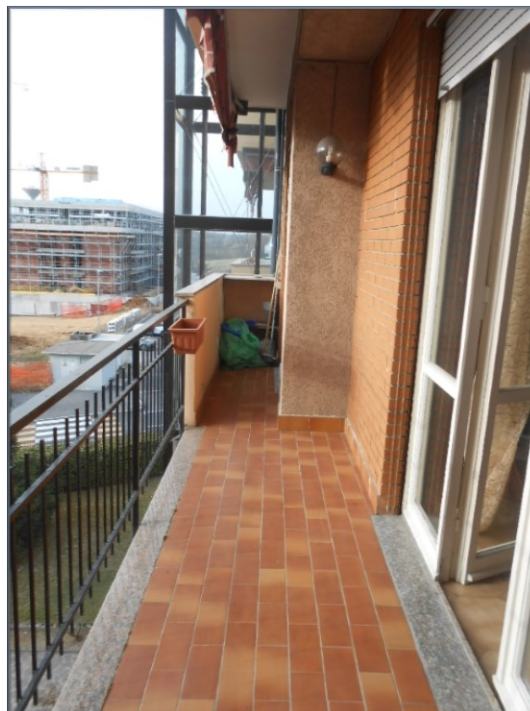
Foto 8 balcone 1