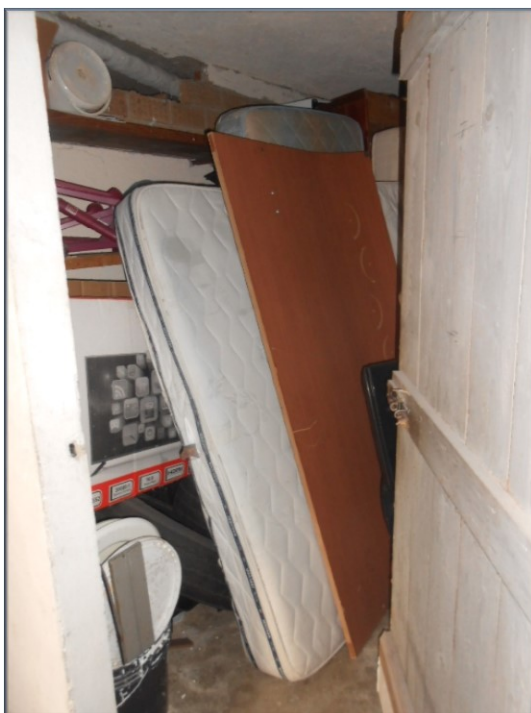
Foto 18 cantina