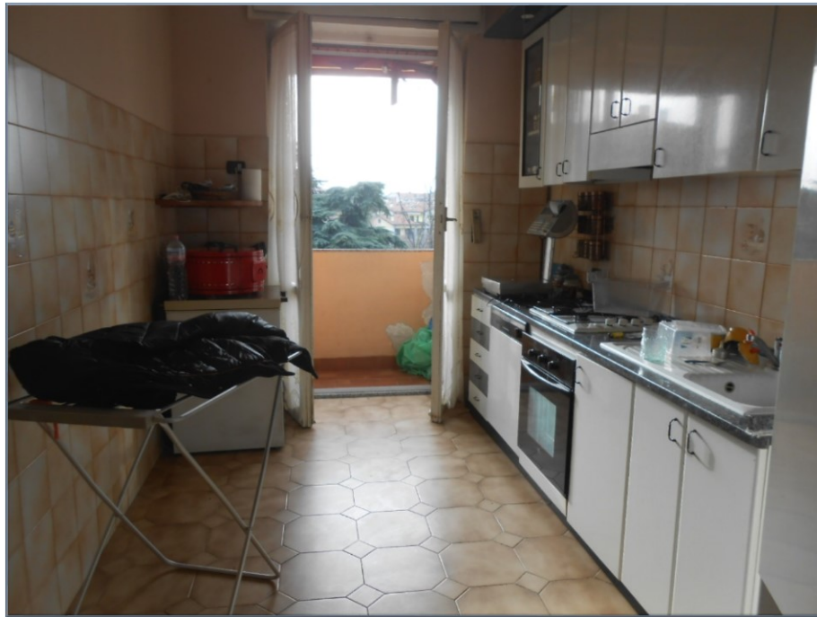
Foto 7 cucina abitabile