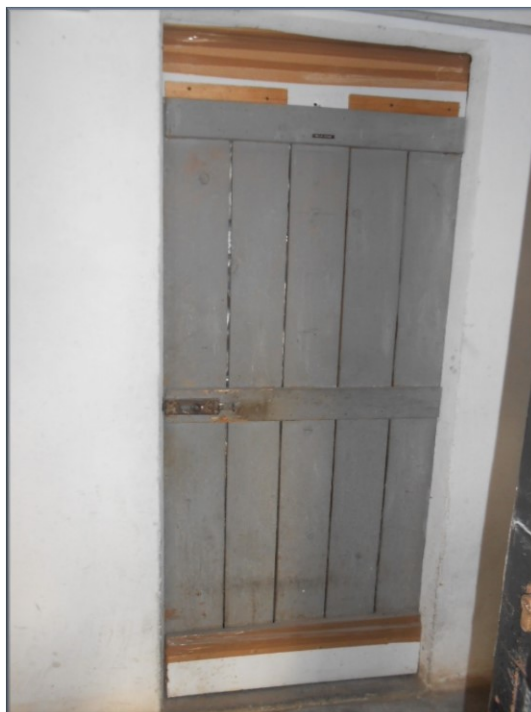
Foto 17 porta ingresso alla cantina