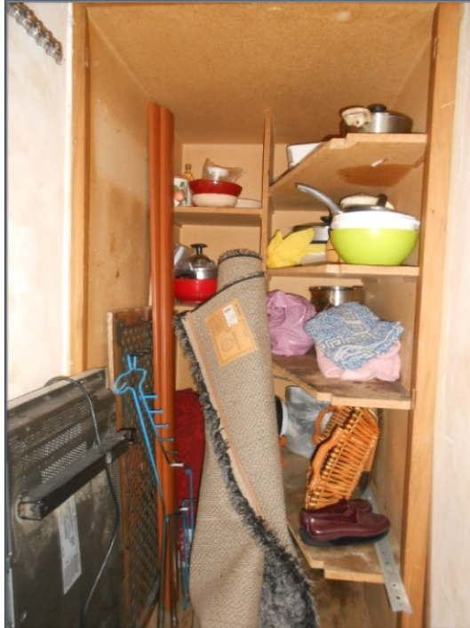
Foto 12 ripostiglio