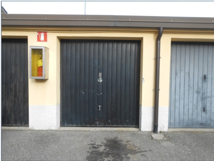
Foto 20 box