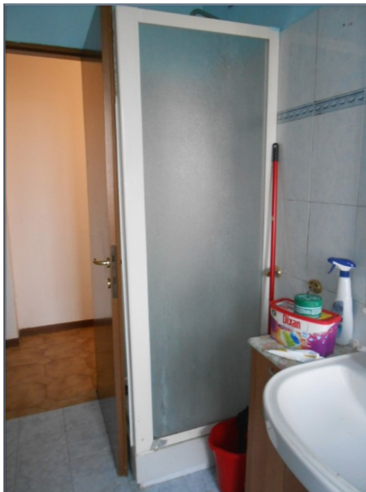
Foto 14 bagno