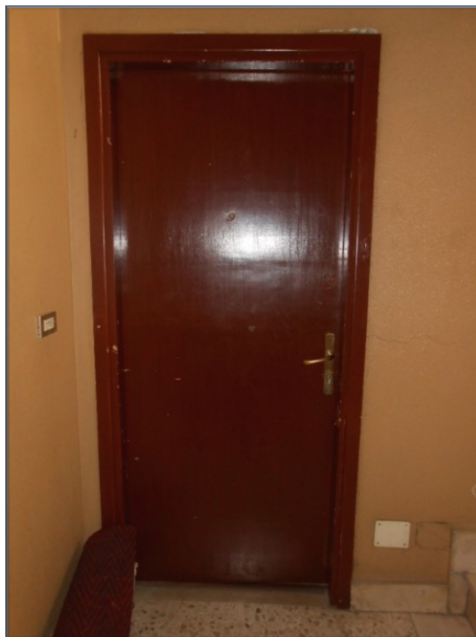
Foto 4 porta ingresso all'immobile