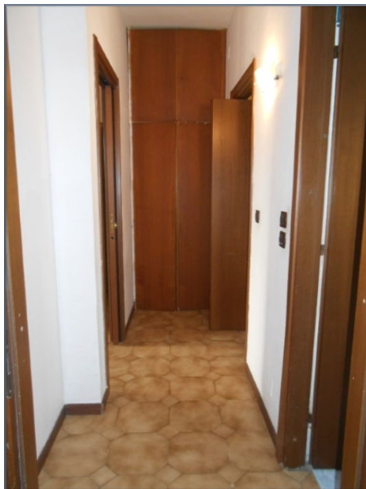
Foto 09 disimpegno