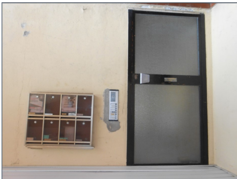
Foto 2 parti comuni