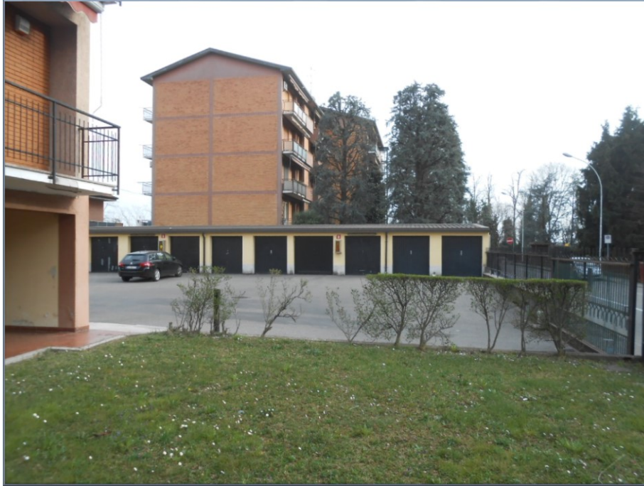
Foto 19 porti comuni box