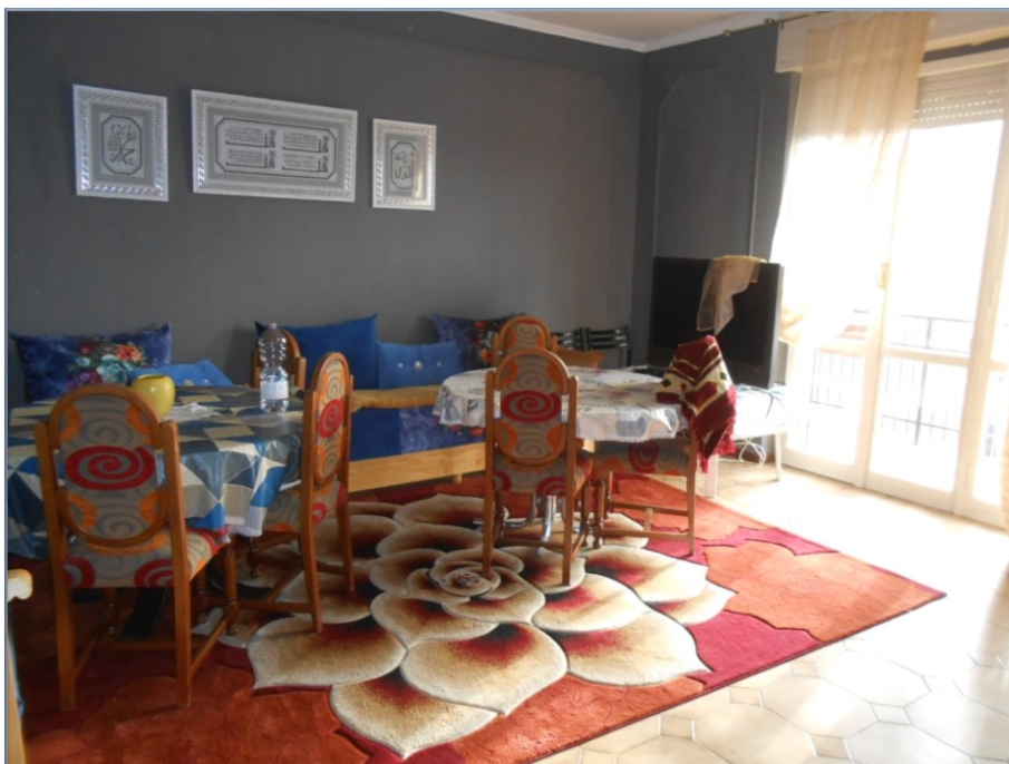
Foto 6 Soggiorno