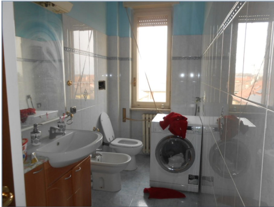
Foto 13 bagno