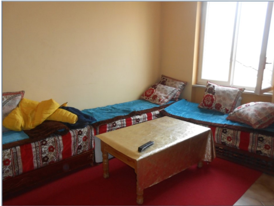
Foto 11 camera