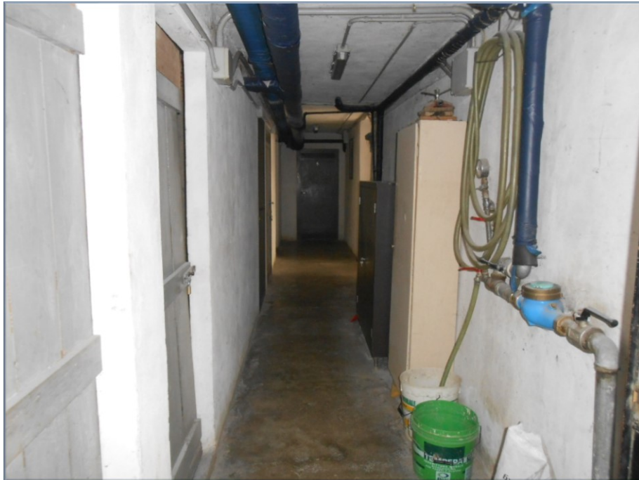
Foto 16 parti comuni cantine