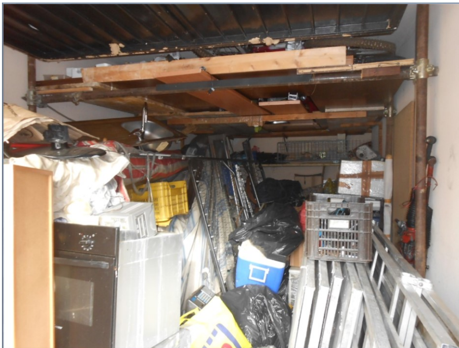
Foto 21 box