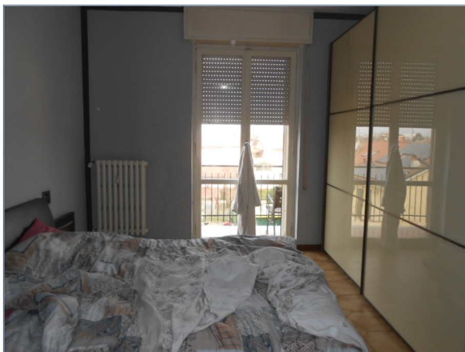
Foto 10 camera matrimoniale