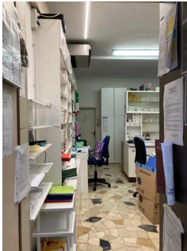
FOTO 5 - Il retro.