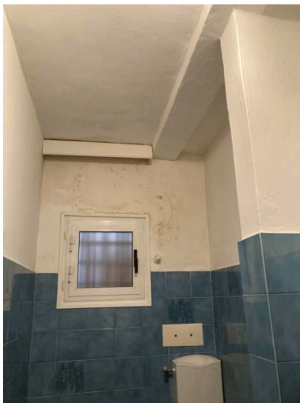
FOTO 6 - Il bagno. Si notano i segni infiltrativi.