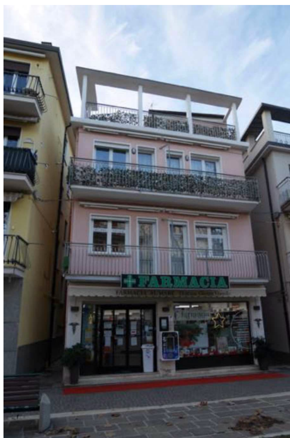
FOTO 1 - Il fabbricato in Via San Marco 629.