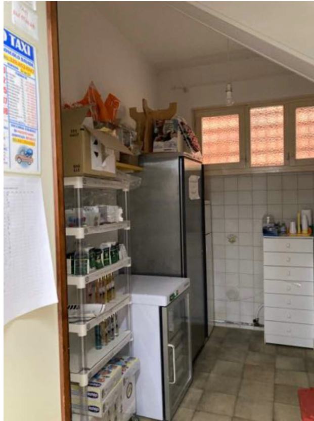
FOTO 4 - Il locale preparazione farmaci.