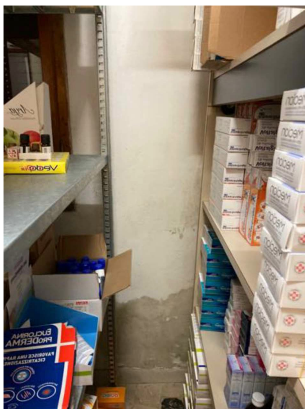
FOTO 7 - Il deposito-magazzino. Si notano i segni infiltrativi di risalita.