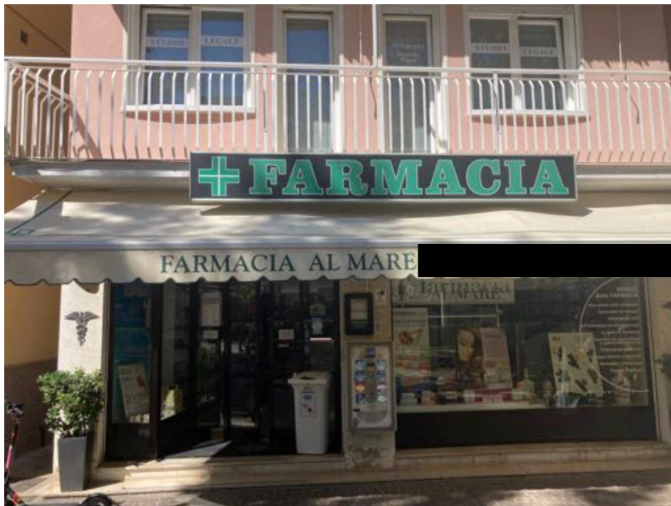
FOTO 2 - L'ingresso.