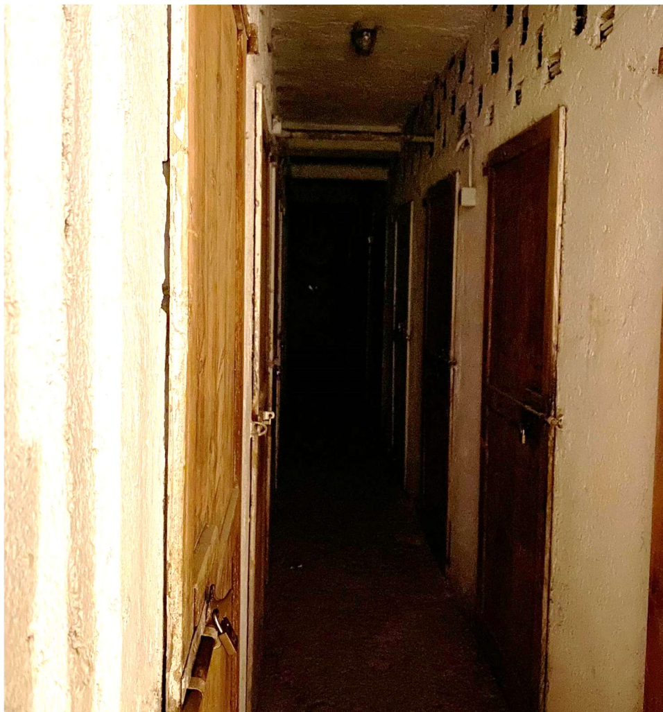
Foto n. 10 – Ingresso alla cantina (penultima in fondo a sinistra)