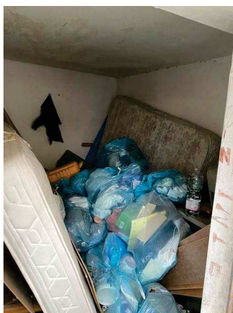
viste interne ripostiglio al piano terra nell'adiacenza