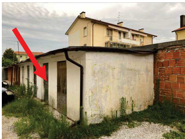
viste esterne ripostiglio al piano terra nell'adiacenza