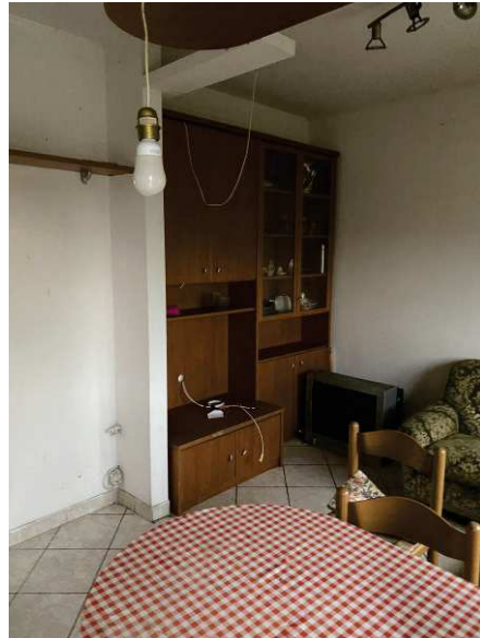
viste interne soggiorno