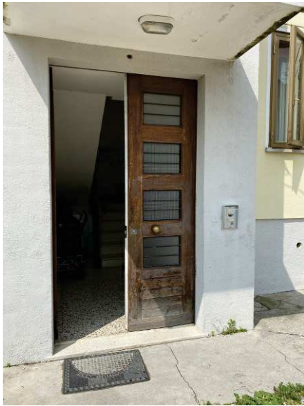
vista porta d'ingresso condominiale con stato di conservazione scadente