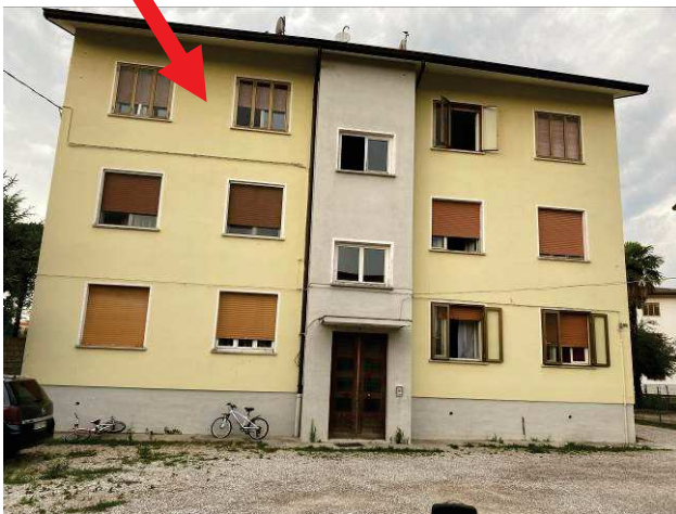
particolare prospetto lato est