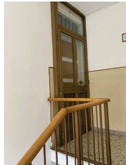
vista porte d'ingresso all'appartamento al 2° piano