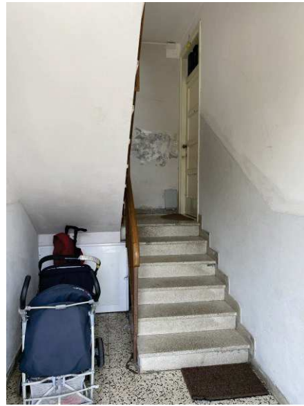
vista interna vano scala condominiale con stato di conservazione scadente