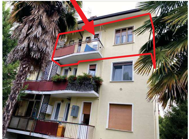
particolare prospetto principale lato ovest