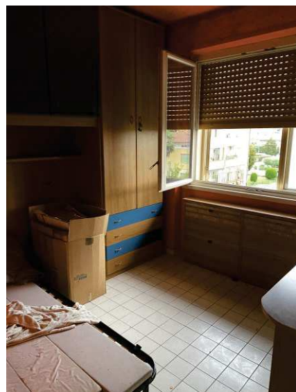
vista interna cameretta