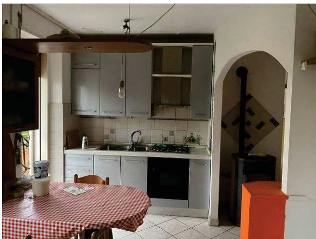
vista interna cucina