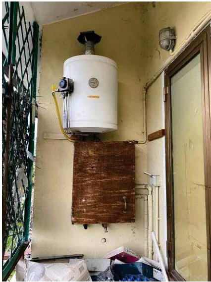
vista esterna boiler a gas in terrazza