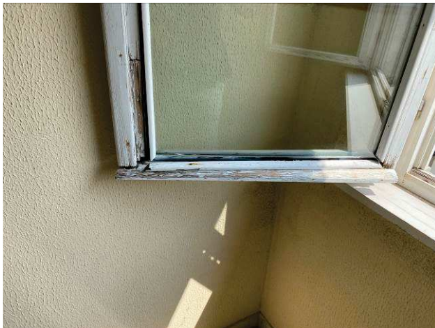
vista finestra nel vano scala condominiale con stato di manutenzione e conservazione scadente