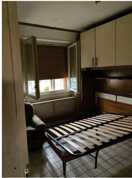
vista interna camera