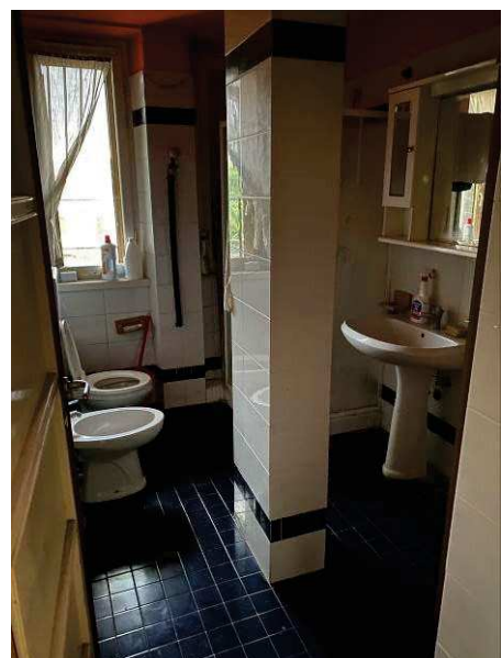
vista interna bagno