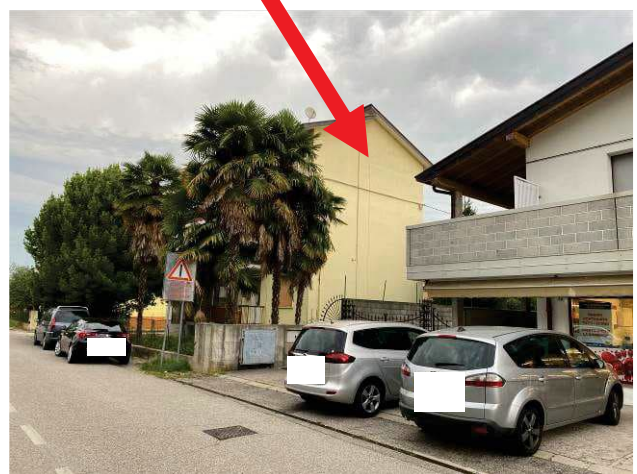
particolare prospetto lato sud