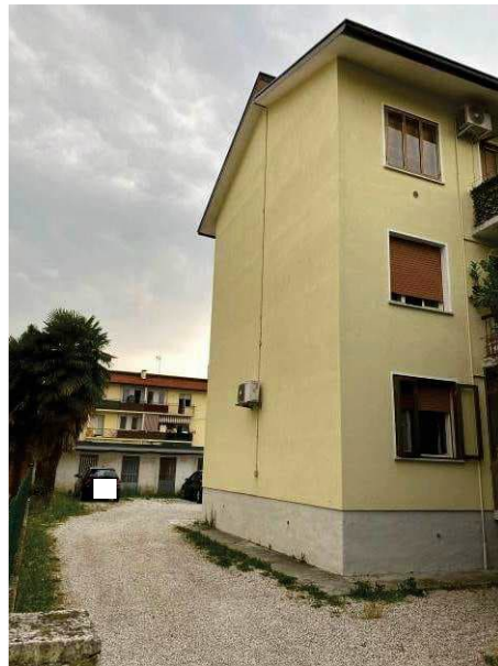
particolare prospetto lato nord