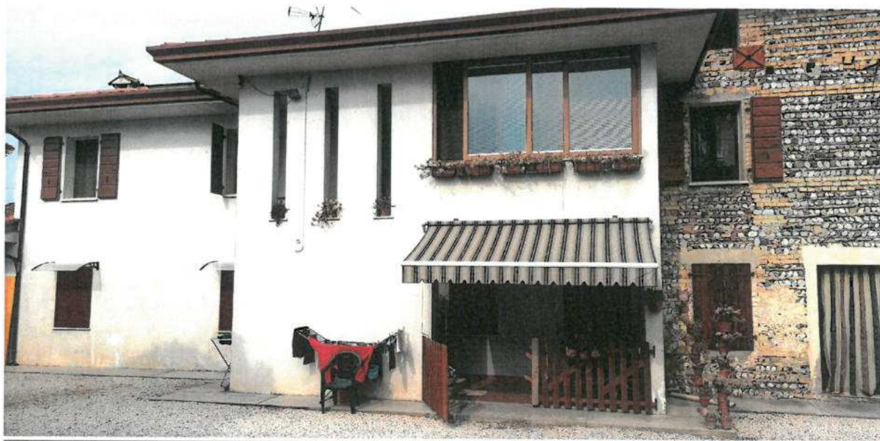
FOTO N.08 FOGLIO 29, MAPPALE 308 BCNC COMUNE DI VALVASONE ARZENE (PN)