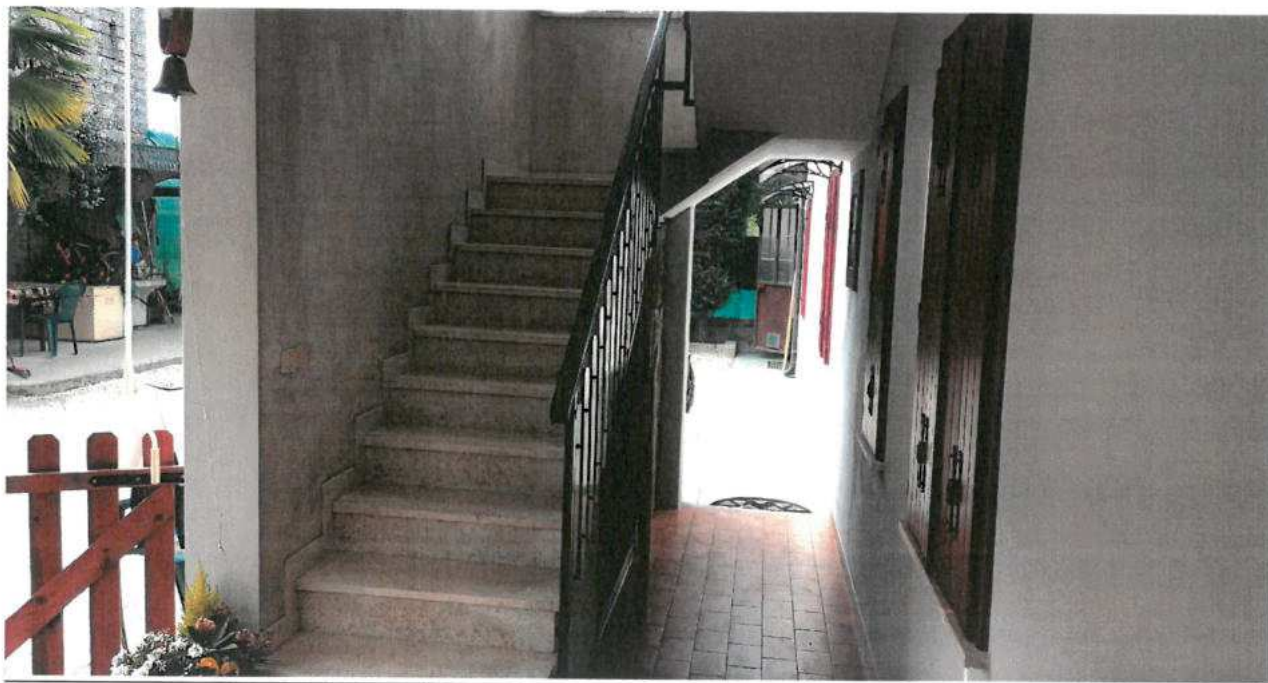
FOTO N.14 FOGLIO 29, MAPPALE 308 BCNC COMUNE DI VALVASONE ARZENE (PN)