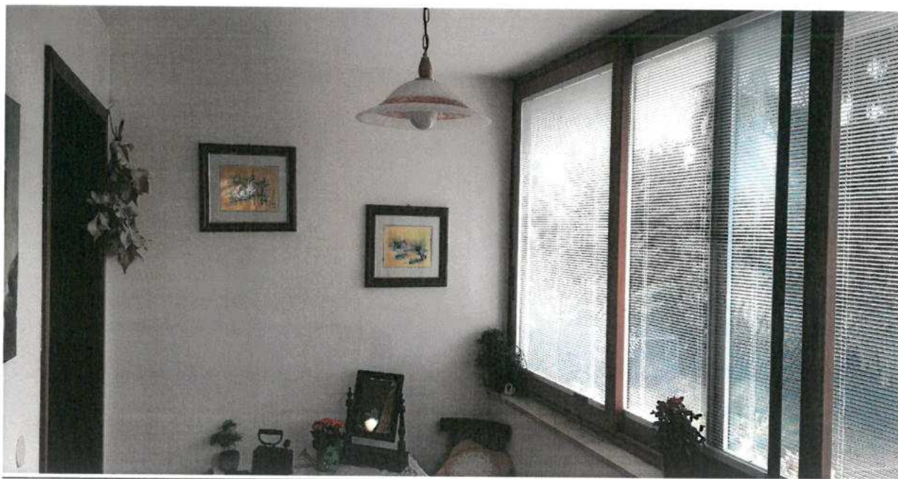
FOTO N.16 FOGLIO 29, MAPPALE 308 BCNC COMUNE DI VALVASONE ARZENE (PN)