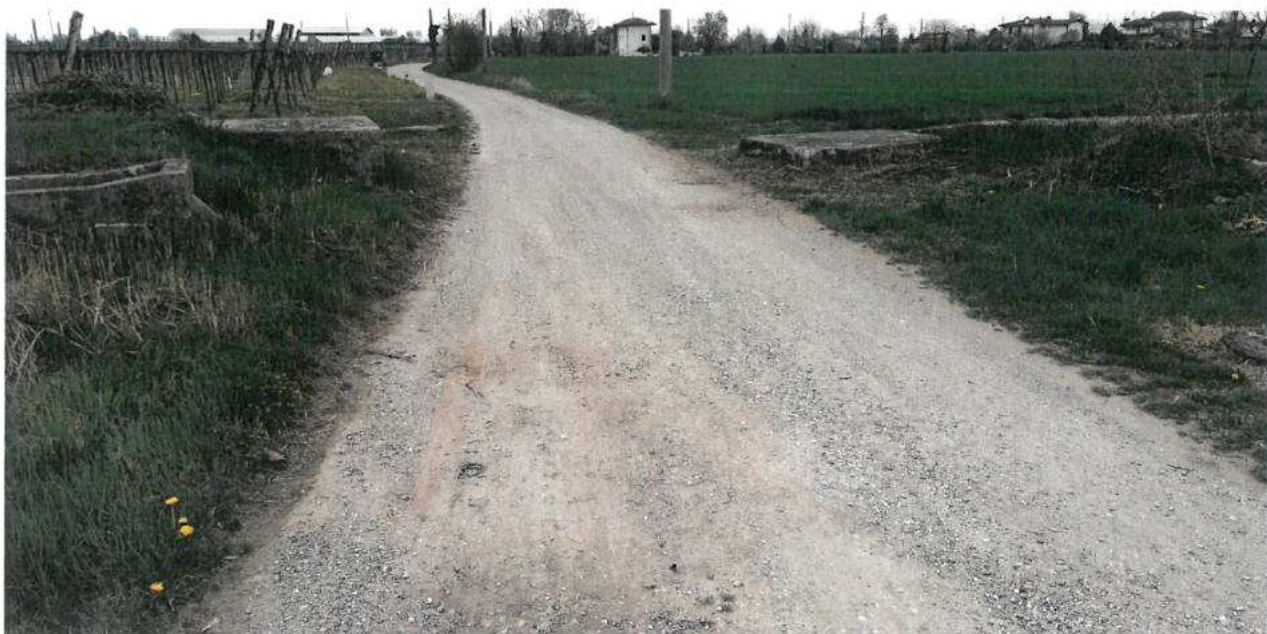
FOTO N.38 FOGLIO 30, MAPPALI 156, 157, 158, 189, 190, 265 COMUNE DI VALVASONE ARZENE (PN)