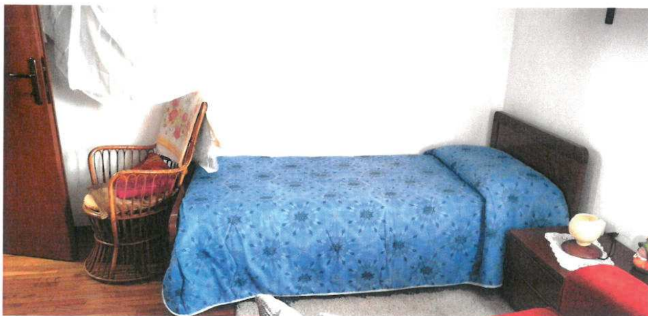
FOTO N.26 FOGLIO 29, MAPPALE 308 SUB.2 COMUNE DI VALVASONE ARZENE (PN)