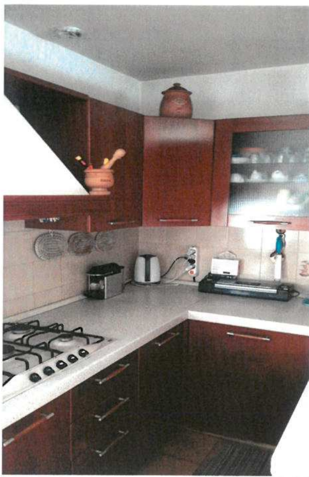
FOTO N.20 FOGLIO 29, MAPPALE 308 SUB.2 COMUNE DI VALVASONE ARZENE (PN)