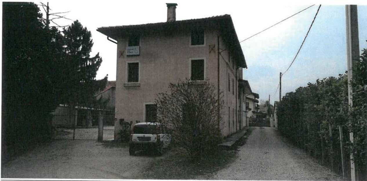
FOTO N.04 FOGLIO 29, MAPPALE 308 SUB.2 COMUNE DI VALVASONE ARZENE (PN)