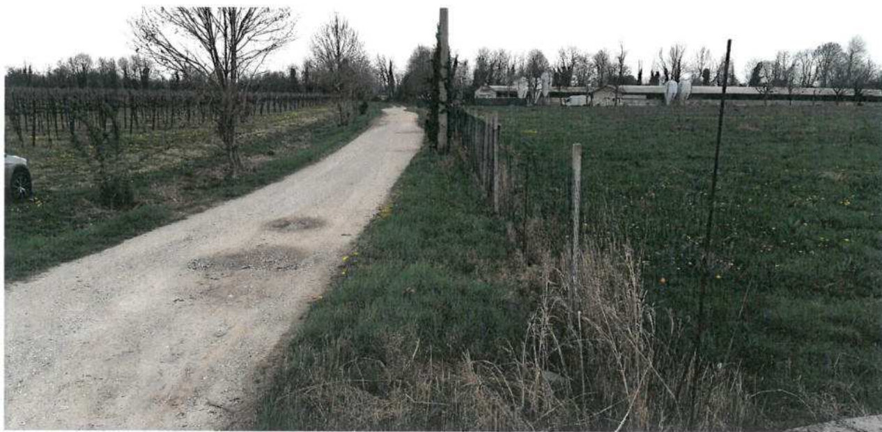
FOTO N.40 FOGLIO 30, MAPPALI 156, 157, 158, 189, 190, 265 COMUNE DI VALVASONE ARZENE (PN)