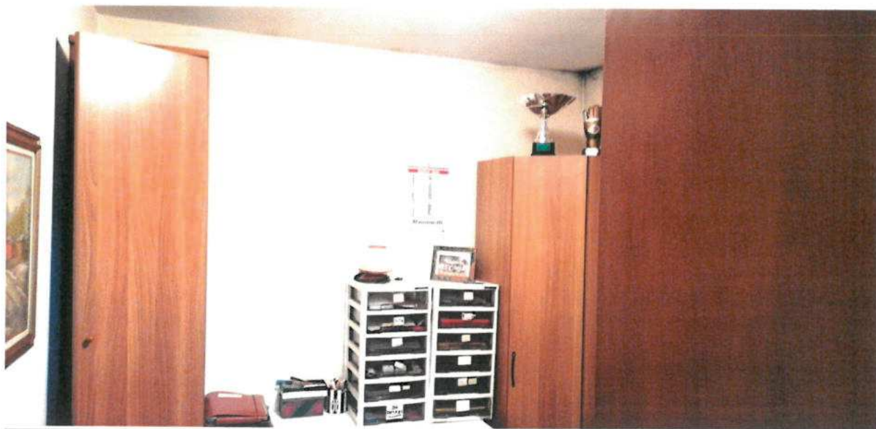
FOTO N.24 FOGLIO 29, MAPPALE 308 SUB.2 COMUNE DI VALVASONE ARZENE (PN)