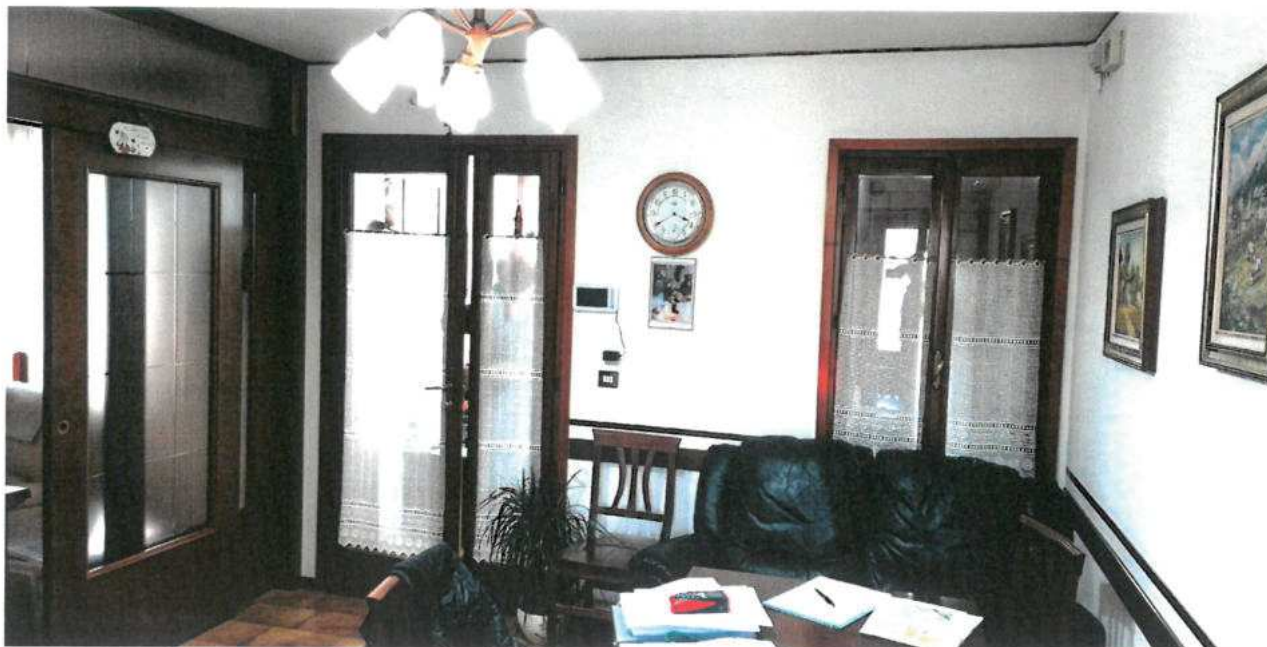
FOTO N.18 FOGLIO 29, MAPPALE 308 SUB.2 COMUNE DI VALVASONE ARZENE (PN)