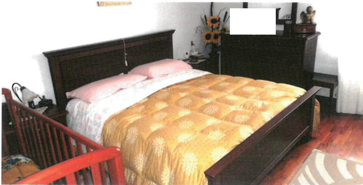
FOTO N.30 FOGLIO 29, MAPPALE 308 SUB.2 COMUNE DI VALVASONE ARZENE (PN)