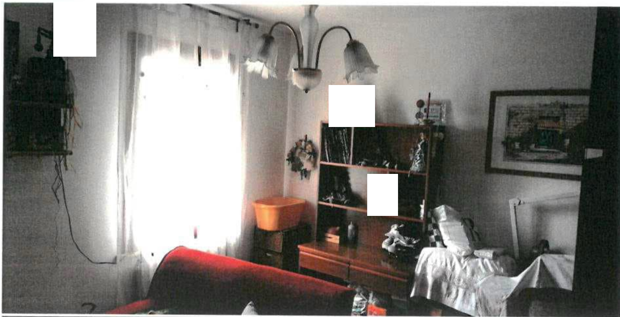
FOTO N.28 FOGLIO 29, MAPPALE 308 SUB.2 COMUNE DI VALVASONE ARZENE (PN)