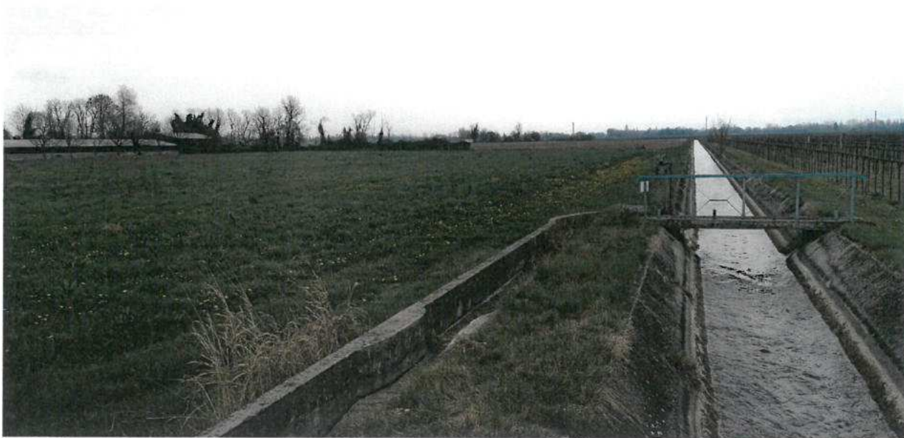
FOTO N.42 FOGLIO 30, MAPPALI 156, 157, 158, 189, 190, 265 COMUNE DI VALVASONE ARZENE (PN)