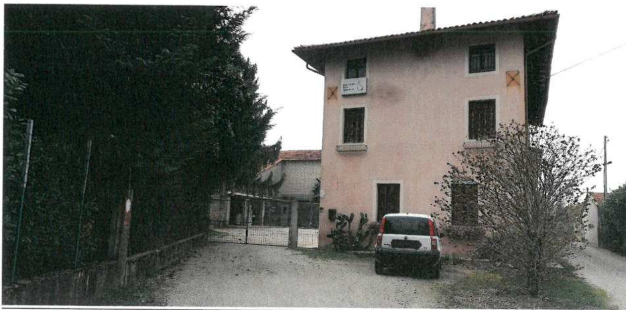
FOTO N.02 FOGLIO 29, MAPPALE 308 SUB.2 COMUNE DI VALVASONE ARZENE (PN)