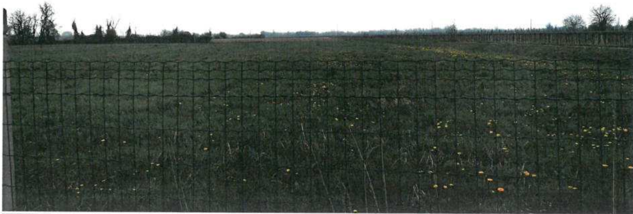
FOTO N.44 FOGLIO 30, MAPPALI 156, 157, 158, 189, 190, 265 COMUNE DI VALVASONE ARZENE (PN)

FOTO N.43 FOGLIO 30, MAPPALI 156, 157, 158, 189, 190, 265 COMUNE DI VALVASONE ARZENE (PN)