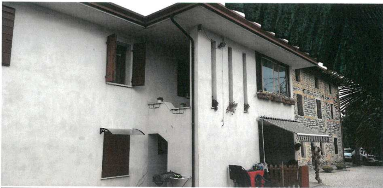
FOTO N.06 FOGLIO 29, MAPPALE 308 SUB.2 COMUNE DI VALVASONE ARZENE (PN)