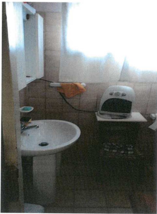
FOTO N.12 FOGLIO 29, MAPPALE 308 BCNC COMUNE DI VALVASONE ARZENE (PN)