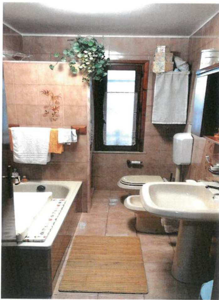
FOTO N.22 FOGLIO 29, MAPPALE 308 SUB.2 COMUNE DI VALVASONE ARZENE (PN)