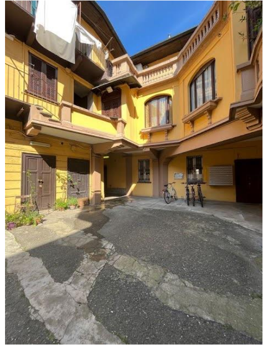
Immagini 3 e 4. Dall'androne di accesso si arriva nel primo cortile. Il contesto di casa a corte.