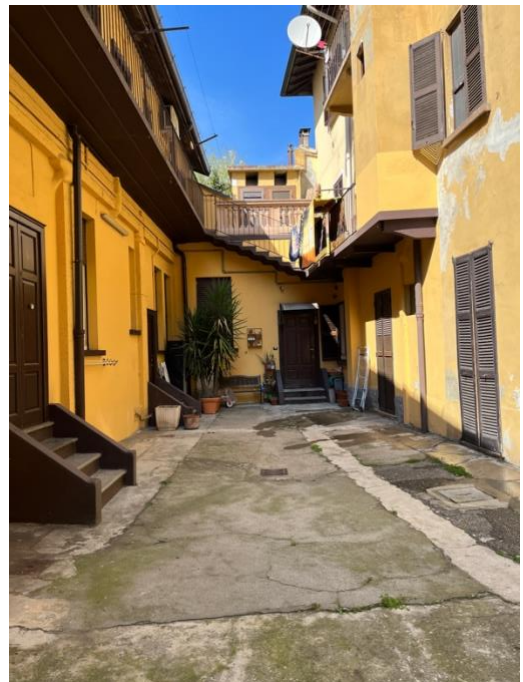
Immagini 8 e 9. L'unità oggetto di valutazione, a piano terra, vista dal cortile e il secondo cortile.