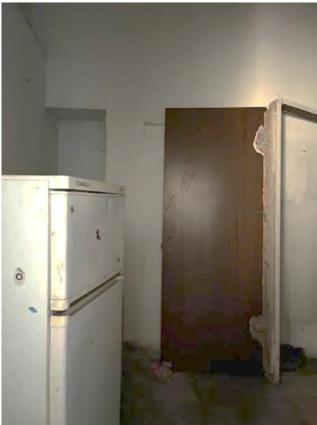
Immagine 11. Dal locale principale si accede a due altri locali, uno piccolo (entrando a sinistra, in cui è ricavato il bagno e che in precedenza metteva in contatto con il bagno comune esterno all'unità immobiliare).