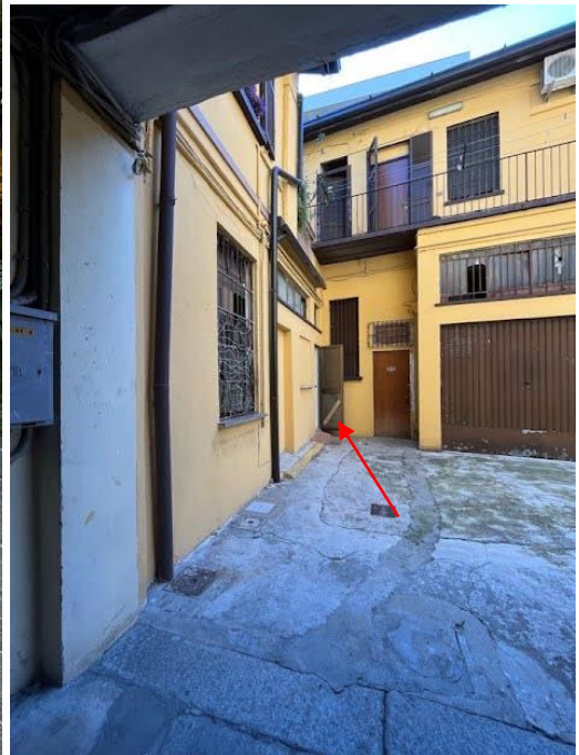
Immagine 5. Il primo cortile. Sullo sfondo, il passaggio verso il secondo cortile. Immagine 6. Il secondo cortile su cui affaccia l'unità oggetto di valutazione.