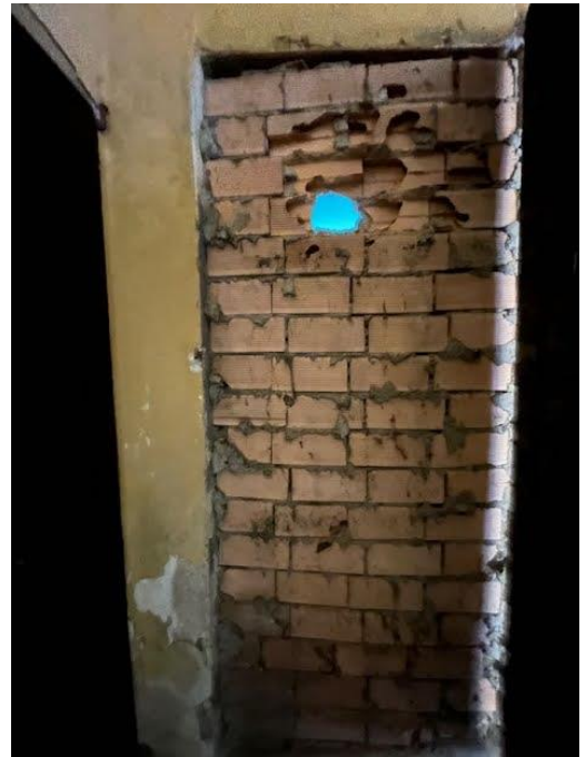
Immagini 13 e 14. Vista dall'esterno della porta che collegava l'unità immobiliare ai servizi comuni.