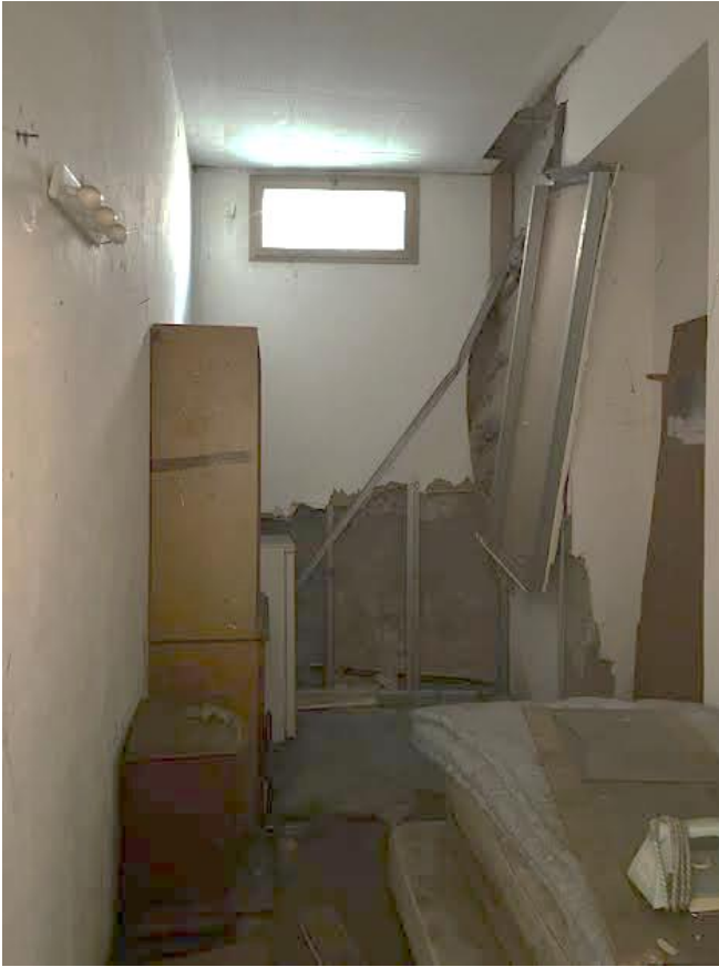
Immagine 12. Un secondo locale (a destra di chi entra), accessibile dal locale di ingresso è aerato e illuminato da finestre alte che prospettano sul giardino condominiale del condominio di via Oroboni 5.