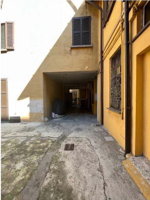
Immagine 7. Il secondo cortile su cui affaccia l'unità oggetto di valutazione.