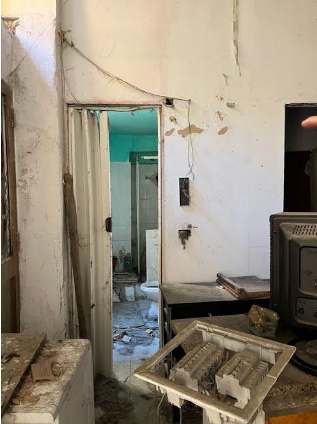
Immagine 10. Il locale principale.