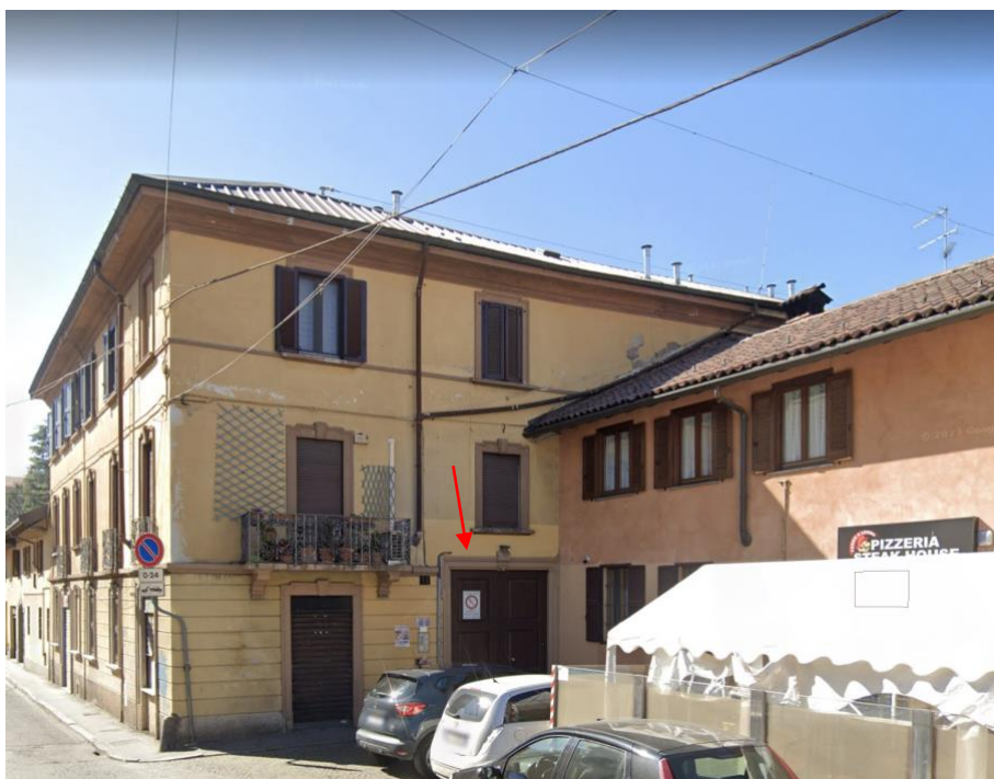
Immagine 2. Il fabbricato. Fronte di accesso.