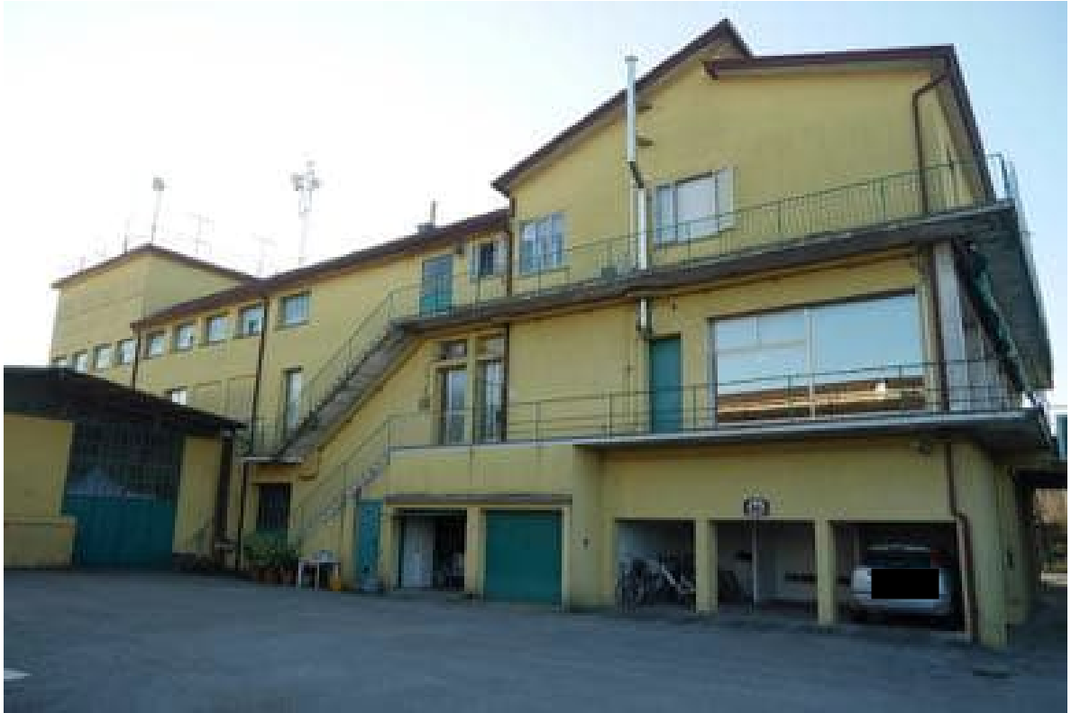
FOTO 5 - Il complesso dallo scoperto comune anche a terzi. In primo piano i cinque garage di proprietà di terzi.