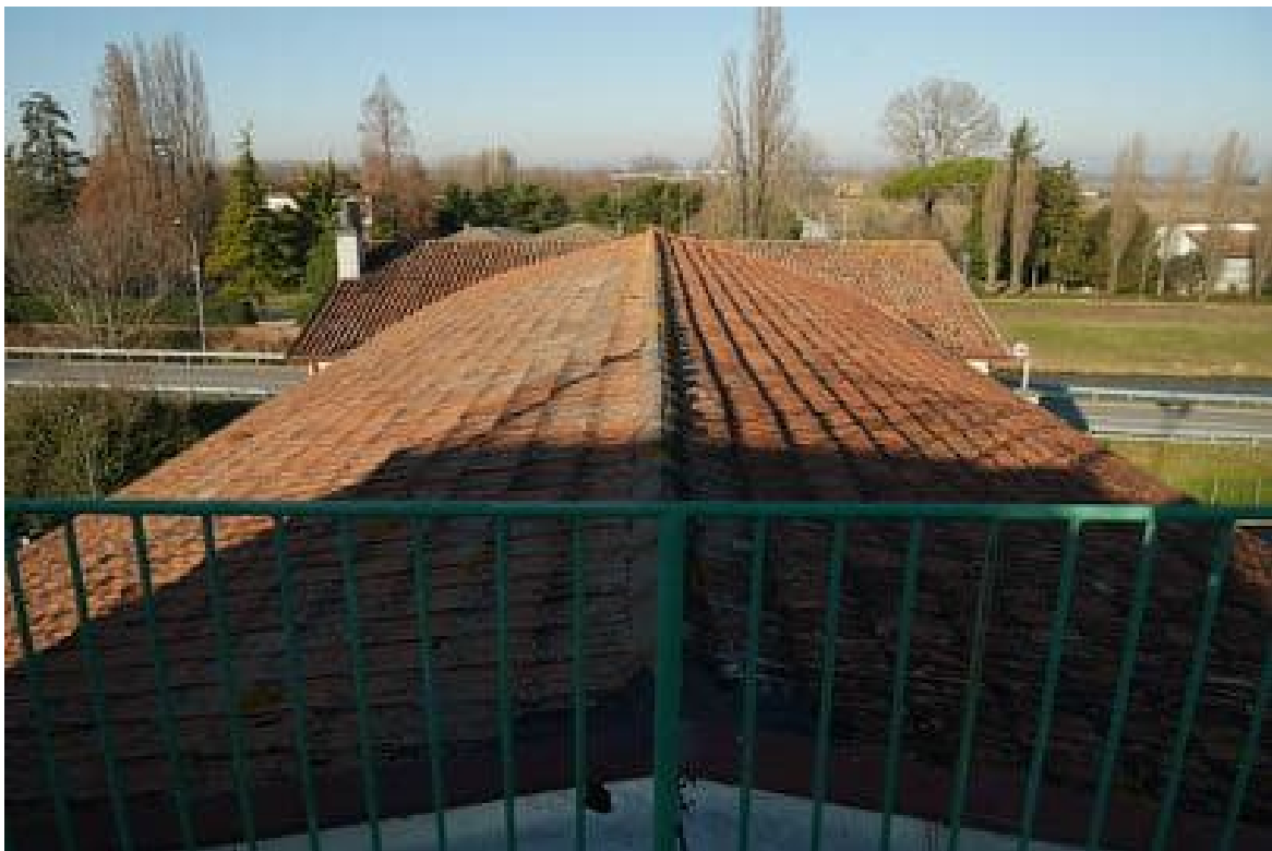
FOTO 8 - Le coperture curve e a falde del corpo principale viste dalla copertura piana dello stesso corpo.