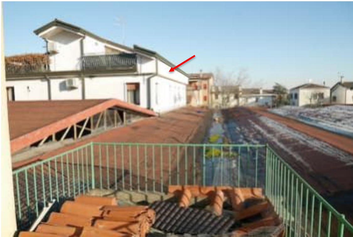
FOTO 18 - Corpo principale. Piano primo. Vista da una delle terrazze della copertura del corpo capannone e di una delle proprietà di terzi (con freccia rossa).