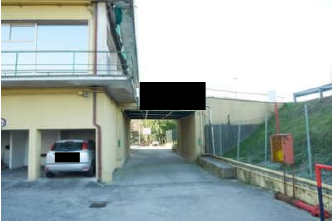
FOTO 7 - Il sottopasso che consente il passaggio dallo scoperto comune allo scoperto esclusivo.