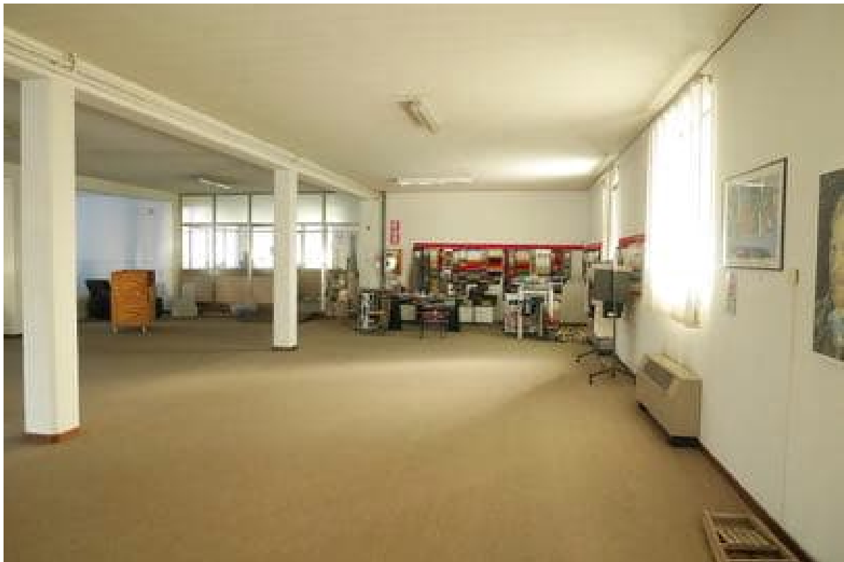
FOTO 20 - Corpo principale. Piano primo. Il negozio esposizione e gli uffici.