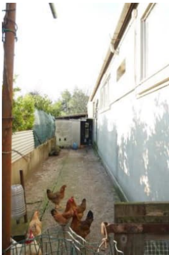
FOTO 14 - Lo scoperto a est del corpo capannone.