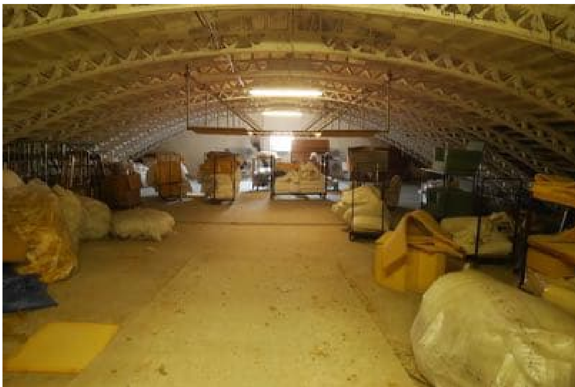
FOTO 25 - Corpo principale. Piano terzo. Il magazzino sotto la copertura curva.