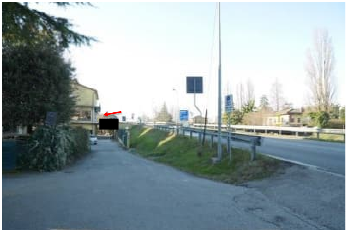
FOTO 4 - La strada di accesso al complesso. Con freccia rossa l'accesso al negozio esposizione di cui alla foto 2.