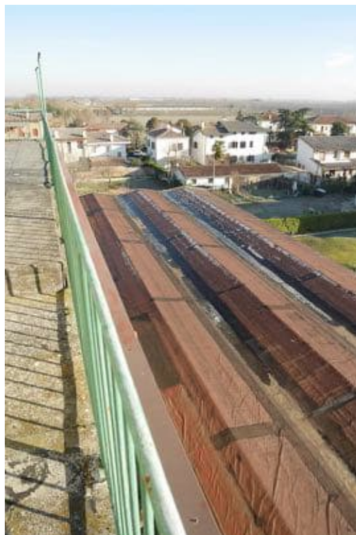
FOTO 10 - Vista della copertura del corpo capannone con manto in eternit rivestito da guaina impermeabile.