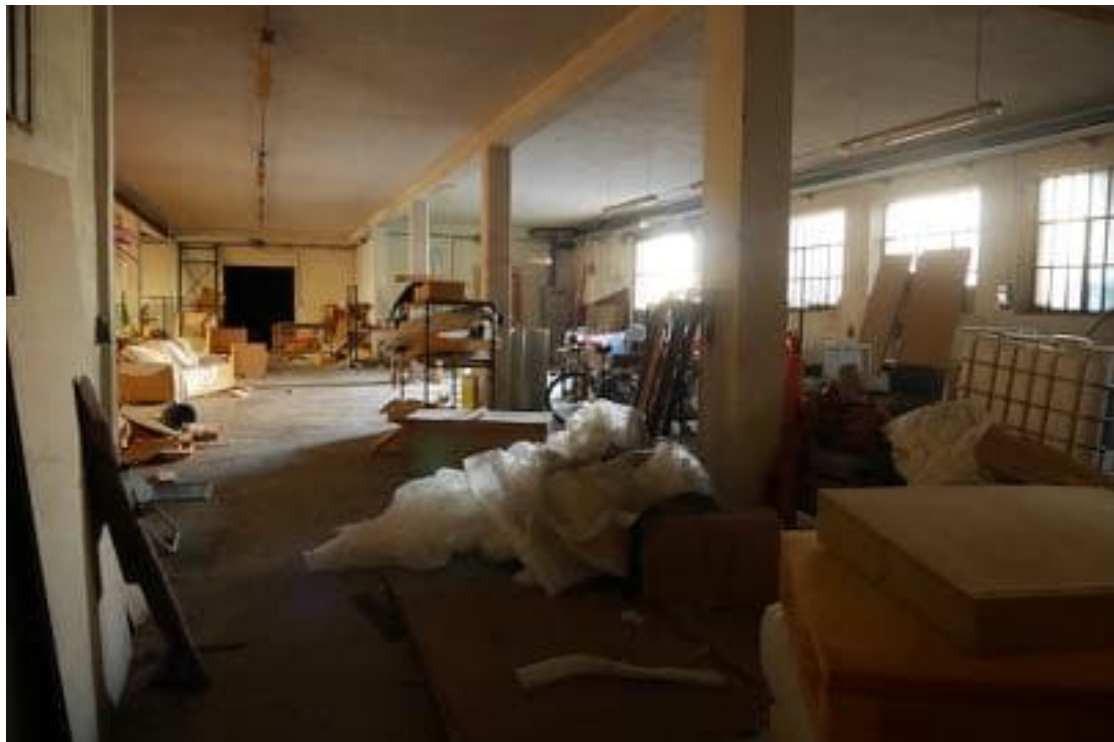
FOTO 16 - Corpo principale. Piano terra. Il laboratorio.