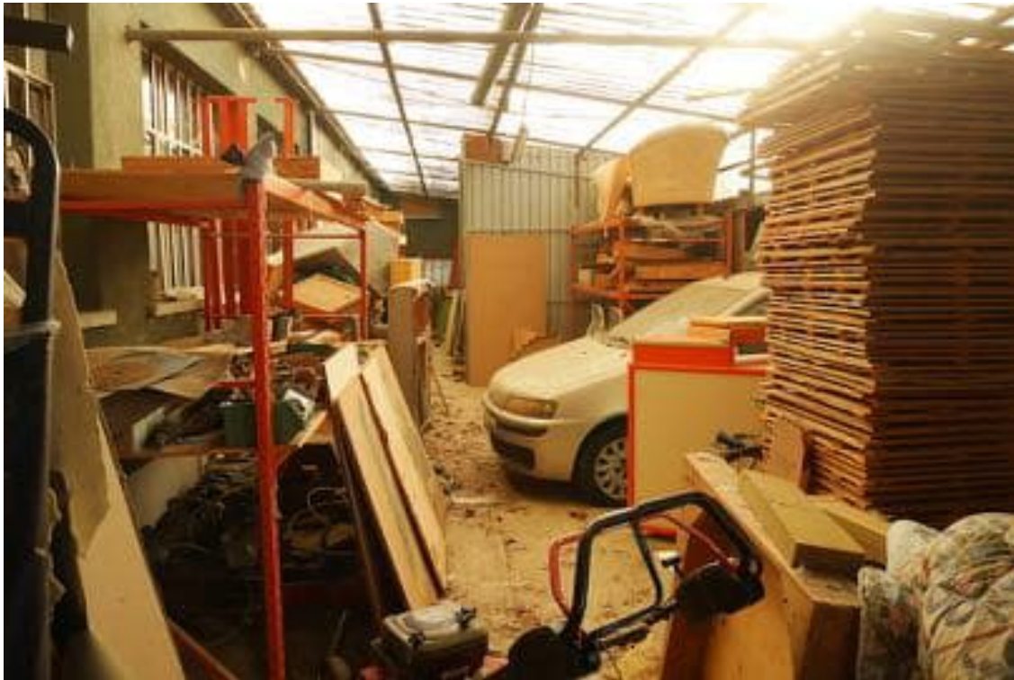
FOTO 17 - Corpo principale. Piano terra. Uno dei locali realizzati senza autorizzazione, in aderenza al lato sud, accessibili sia dall'interno del corpo principale che dallo scoperto esclusivo.