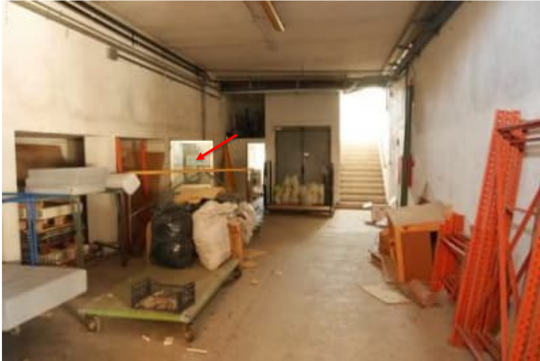
FOTO 15 - Corpo principale. Piano terra. Il locale disbrigo. Si notano il vano scala e la porta del montacarichi. Con freccia rossa il passaggio tra il corpo capannone e il disbrigo del corpo principale.