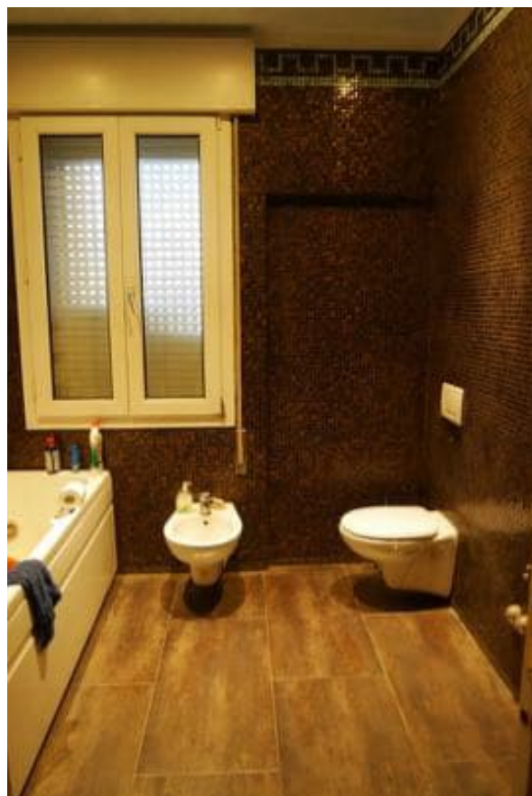
FOTO 23 - Corpo principale. Piano secondo. L'abitazione. Il bagno.