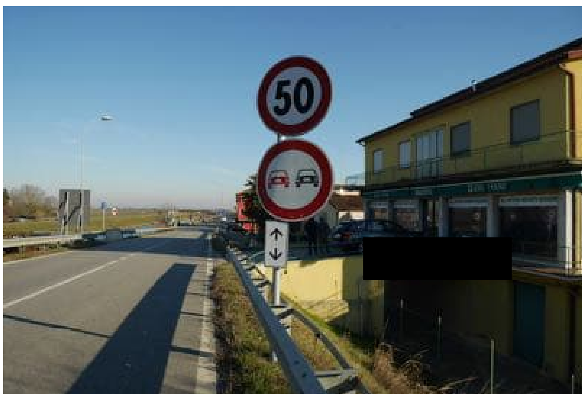
FOTO 2 - La Via Trieste in direzione San Donà di Piave. Sulla destra il complesso con l'accesso ponte al negozio esposizione.