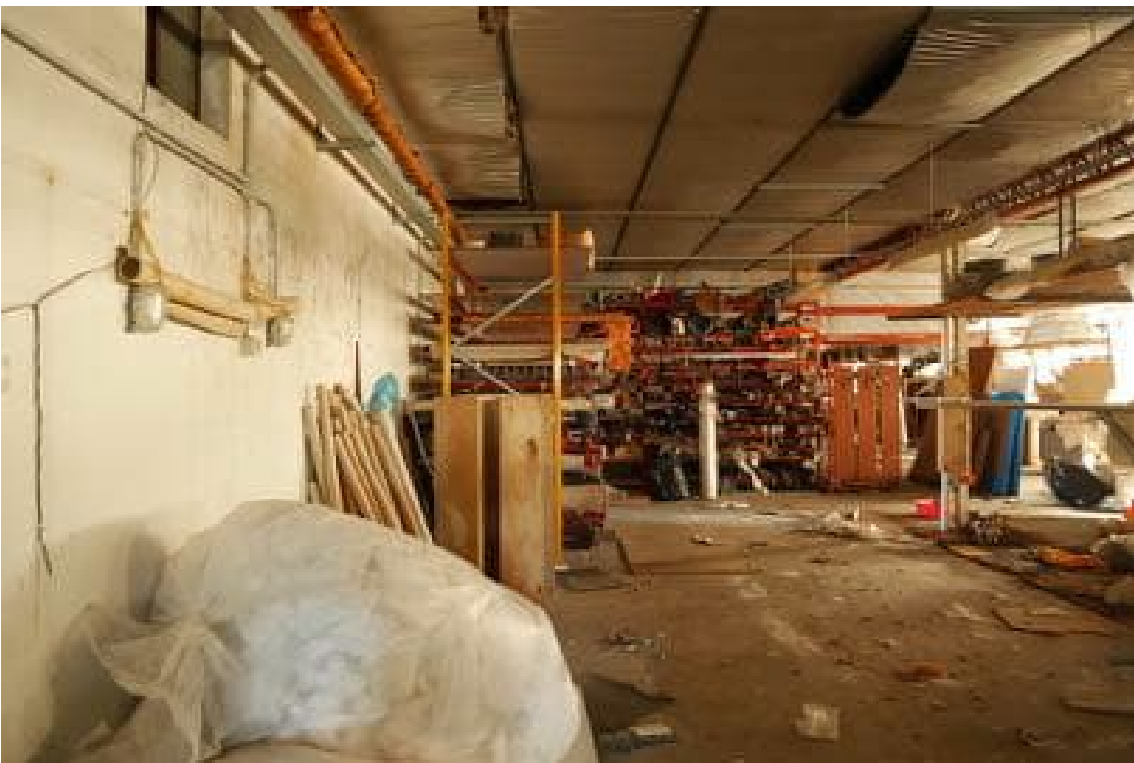
FOTO 12 - L'interno del corpo capannone formato da struttura e copertura in metallo.