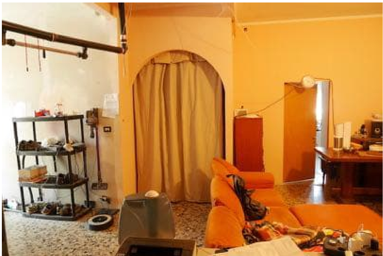
FOTO 22 - Corpo principale. Piano secondo. L'abitazione. Uno dei locali.