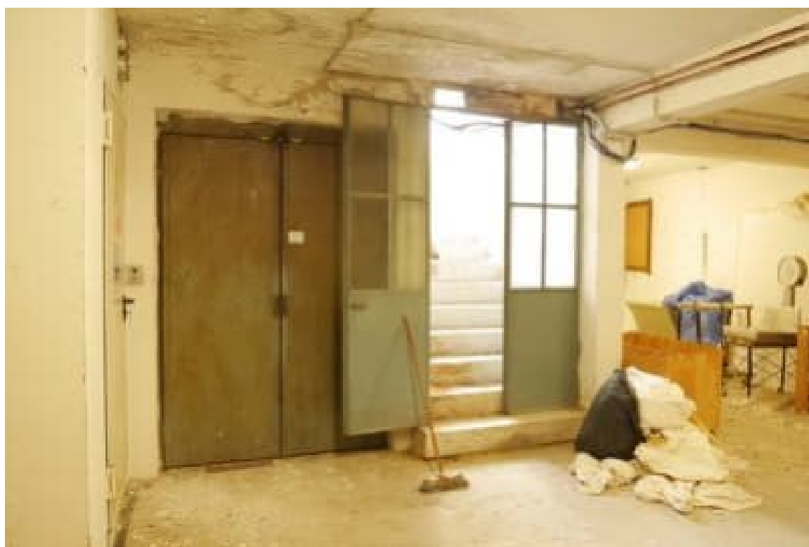
FOTO 26 - Corpo principale. Piano terzo. L'accesso alla terrazza ove sono allocate le antenne Ascom.