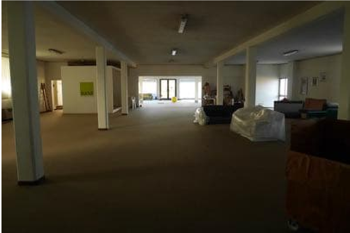
FOTO 19 - Corpo principale. Piano primo. Il negozio esposizione.