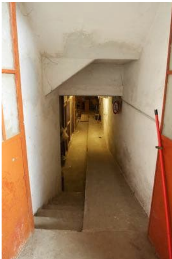
FOTO 13 - Il locale seminterrato accessibile dal corpo capannone. Detto locale si trova sotto la proprietà di terzi.