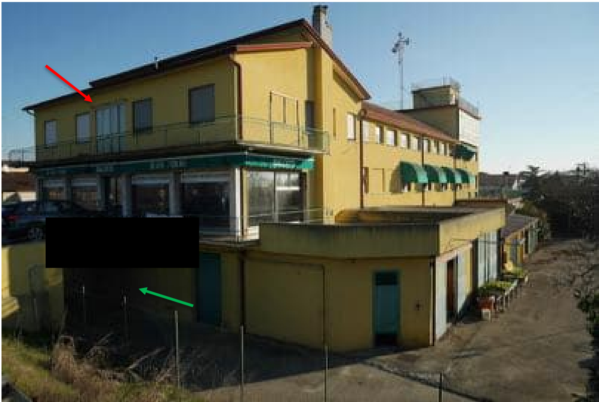
FOTO 3 - Il corpo principale del complesso. Con freccia rossa l'unità ad uso abitativo. Sulla destra, parte dello scoperto esclusivo accessibile dal sotto passo indicato con freccia verde.