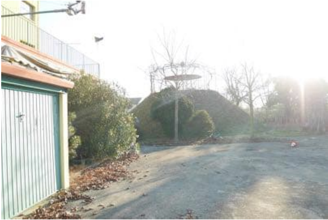
FOTO 29 - Lo scoperto esclusivo. Il cumulo di terra.