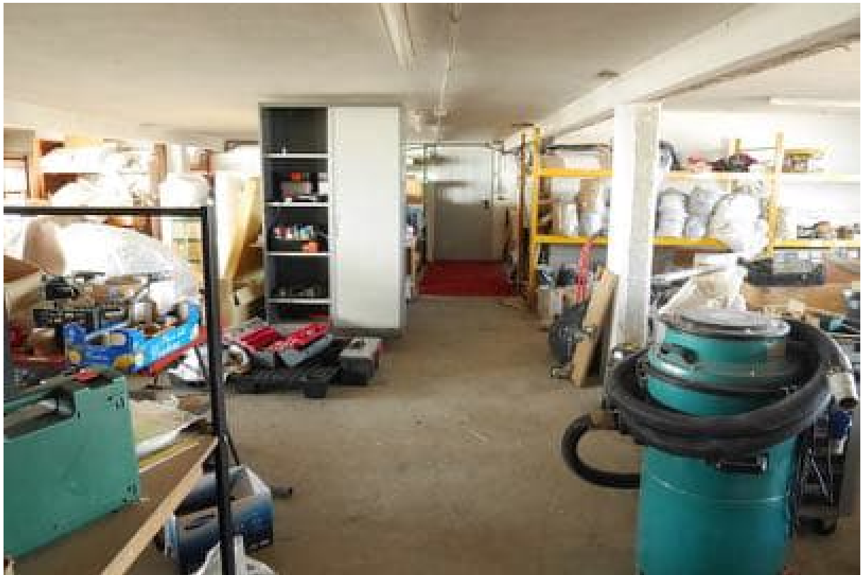
FOTO 21 - Corpo principale. Piano secondo. Magazzino. Al centro, in fondo, la porta di accesso all'abitazione.