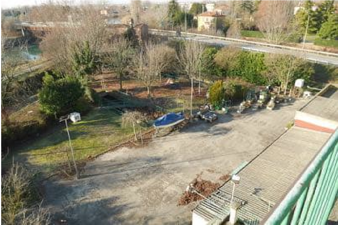
FOTO 27 - Lo scoperto esclusivo dalla terrazza al piano quarto. Si notano le vasche.