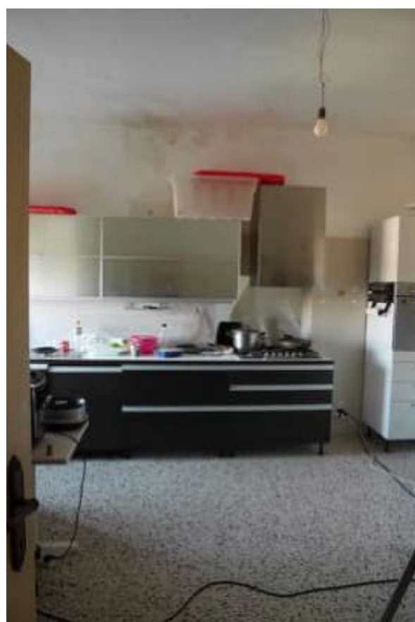
FOTO 24 - Corpo principale. Piano secondo. L'abitazione. La cucina.