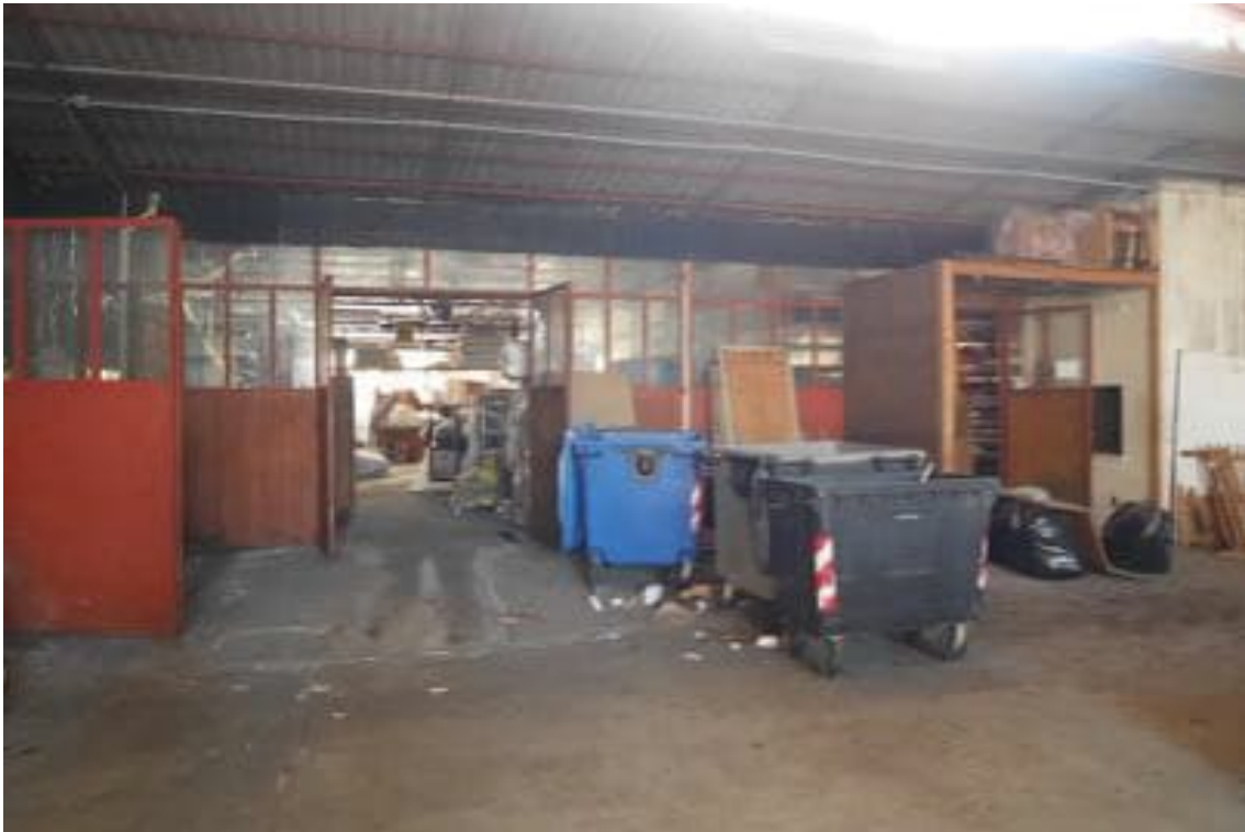
FOTO 11 - L'interno del corpo capannone formato da struttura e copertura in metallo.