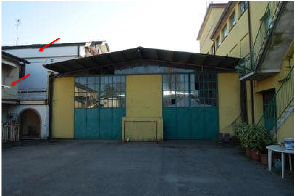
FOTO 6 - Il corpo capannone di un piano fuori terra, ripreso dallo scoperto comune. Sulla sinistra, con frecce rosse, i fabbricati di proprietà di terzi.