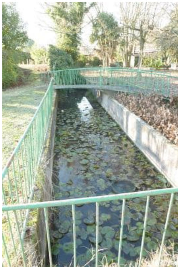
FOTO 28 - Particolare delle vasche.