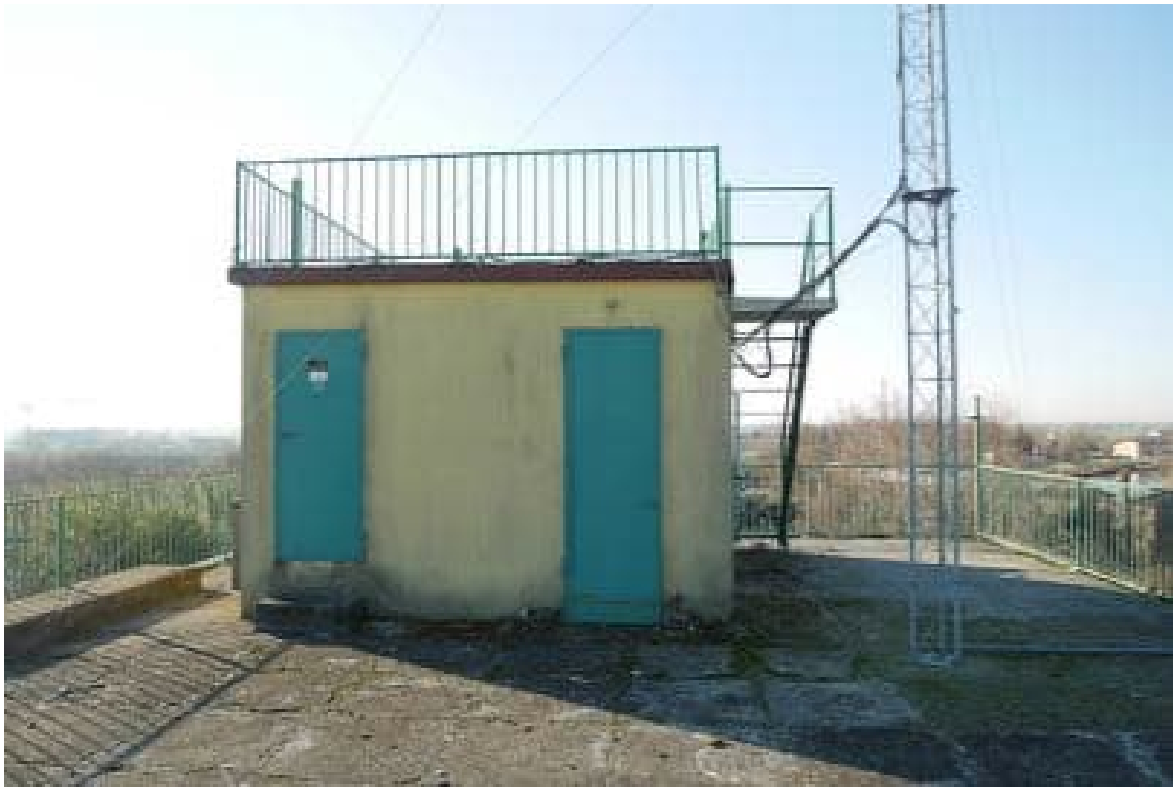
FOTO 9 - La copertura piana del corpo principale. Si nota il traliccio per le antenne Ascom. In primo piano la cabina del montacarichi.