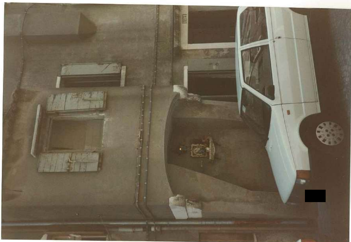
CONO FOTOGRAFICO N. 5