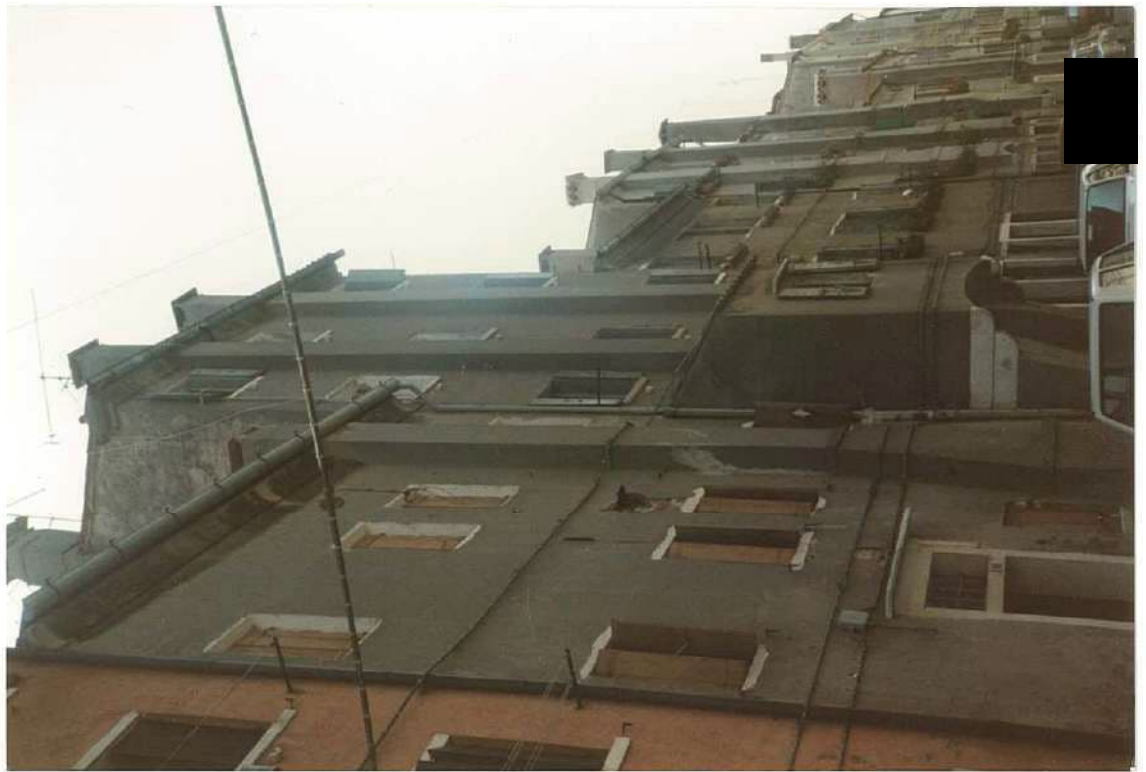
CONO FOTOGRAFICO N. 1