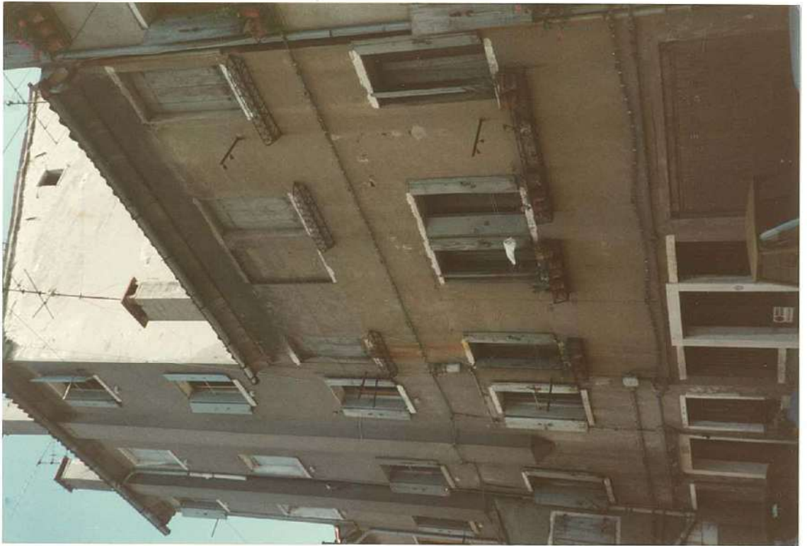
CONO FOTOGRAFICO N. 3