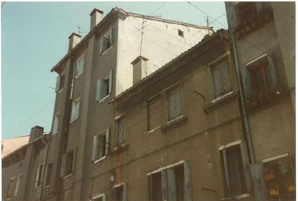
CONO FOTOGRAFICO N. 4