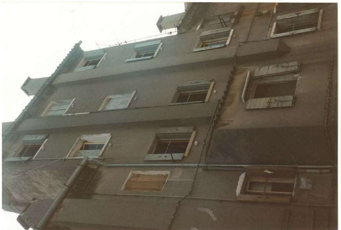
CONO FOTOGRAFICO N. 2