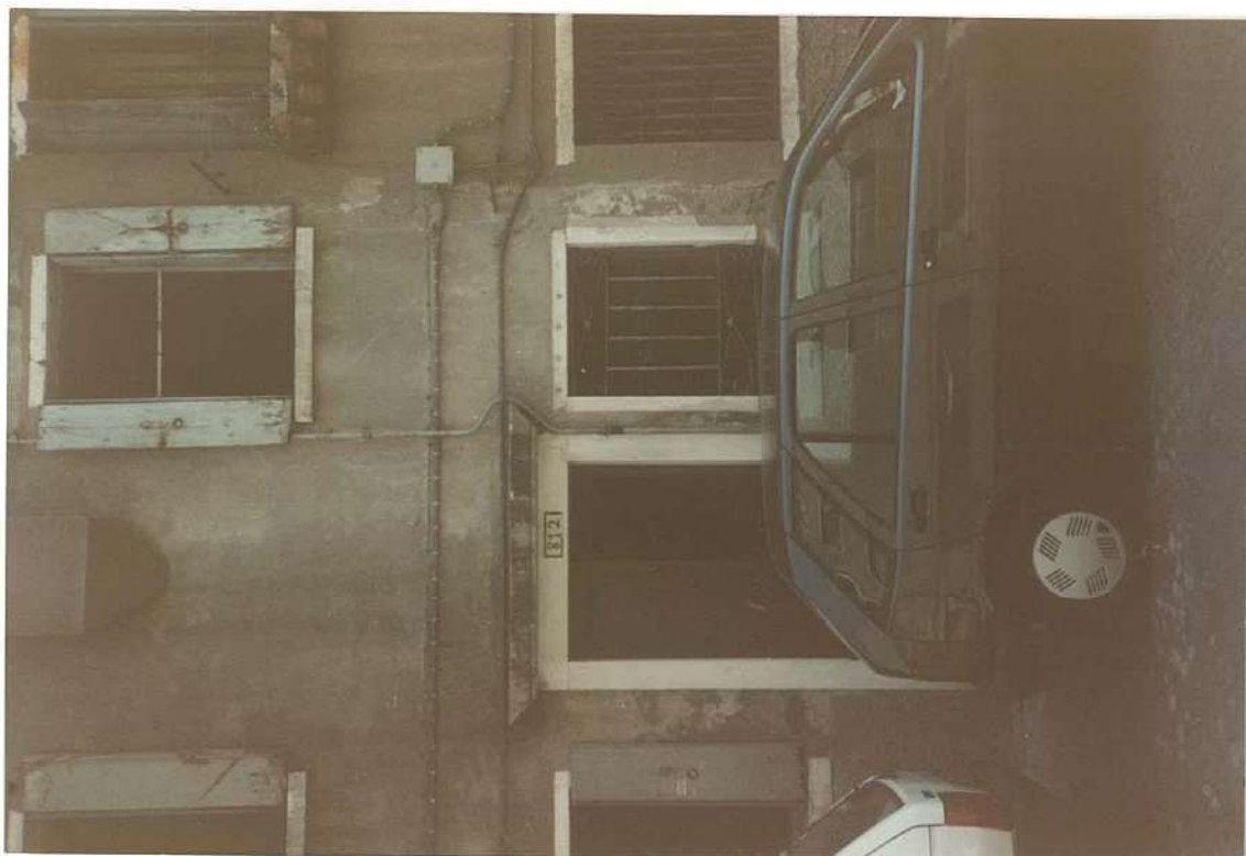
CONO FOTOGRAFICO N. 6