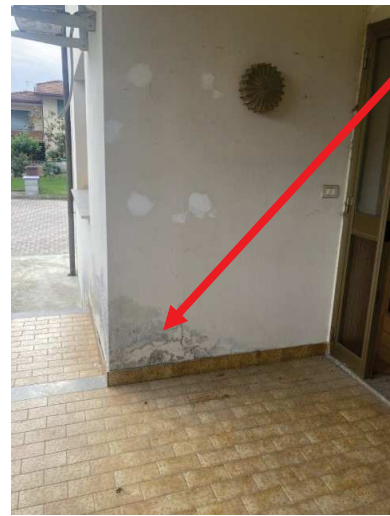
particolare prospetti esterni con degrado delle pitture