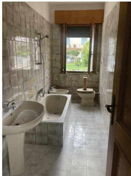
vista interna bagno