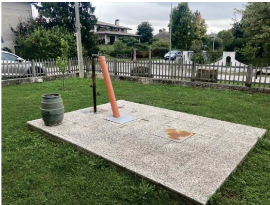
particolare giardino comune con pozzo artesiano