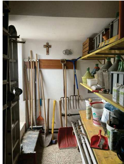
viste interne del locale centrale termica