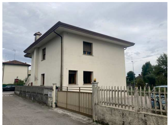
prospetto lato Nord/Ovest