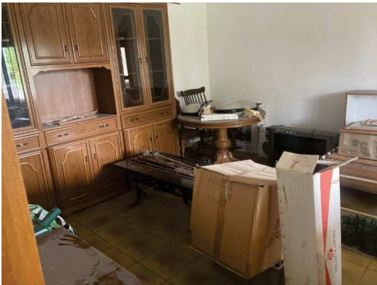
vista interna soggiorno