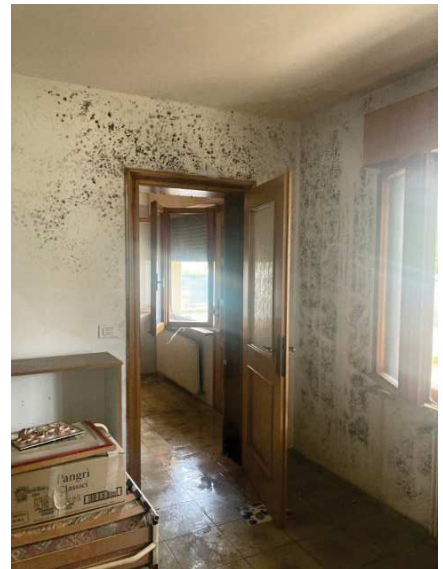
vista interna soggiorno con danni causati da infiltrazioni d'acqua provenienti dal solaio