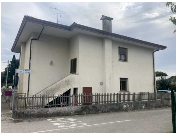
prospetto lato Nord