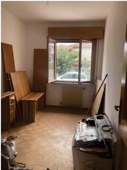
vista interna ulteriore camera