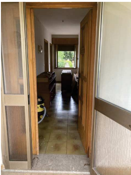
vista porta d'ingresso nel corridoio