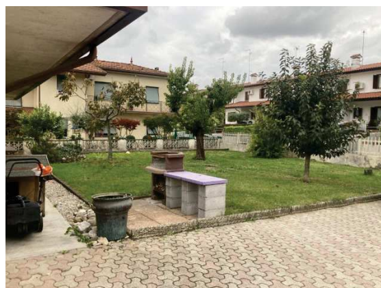
ulteriore particolare del giardino comune