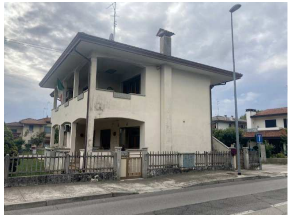
prospetto lato Est