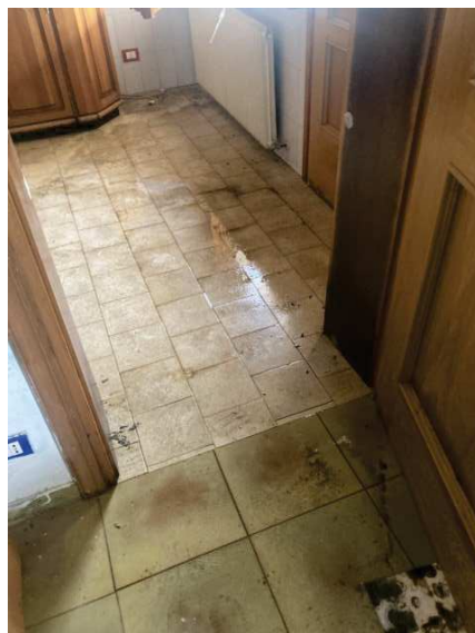
Vista presenza d'acqua sul pavimento del locale soggiorno e cucina