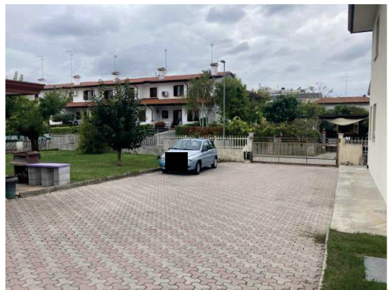
particolare cortile comune