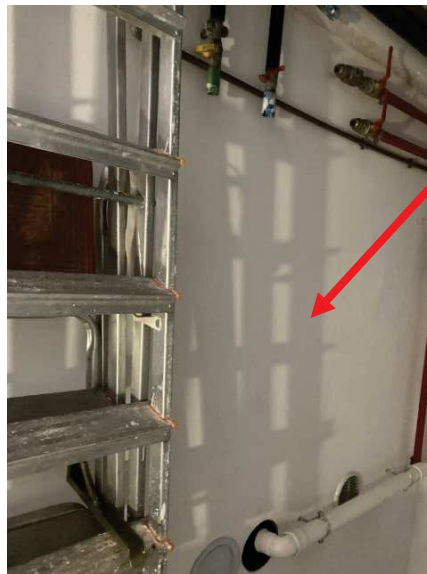
particolare luogo della caldaia rimossa nel locale centrale termica