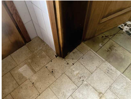
viste porte interne danneggiate