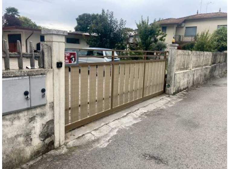
particolare accesso pedonale e carraio