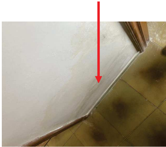
particolare degrado della muratura con umidità di risalita