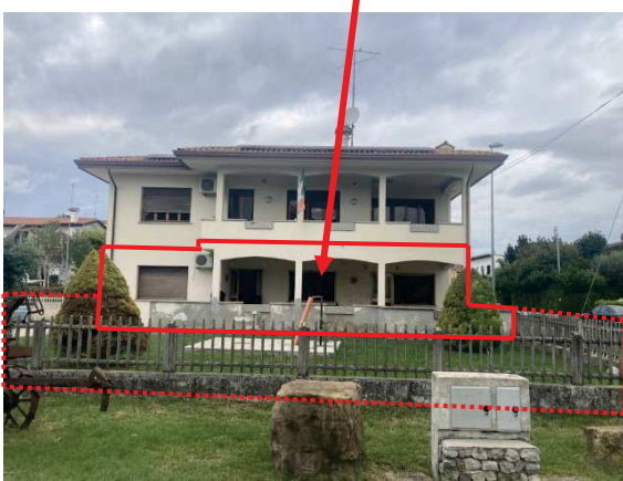
prospetto principale lato Sud con particolare porticato

fabbricato d'abitazione oggetto di esecuzione immobiliare