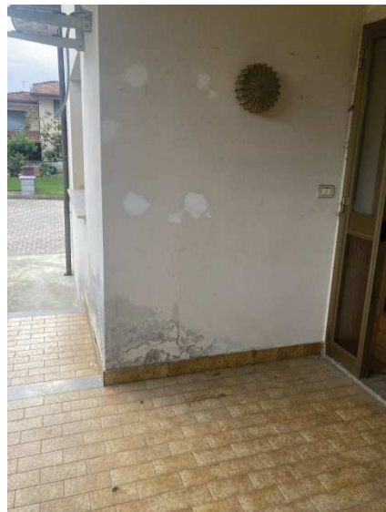
particolare viste porticato