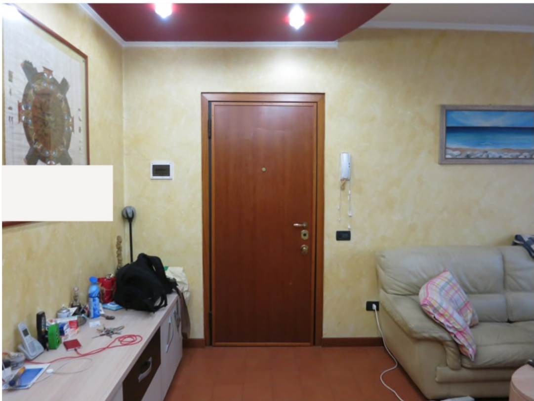
Soggiorno (vista verso l'ingresso)