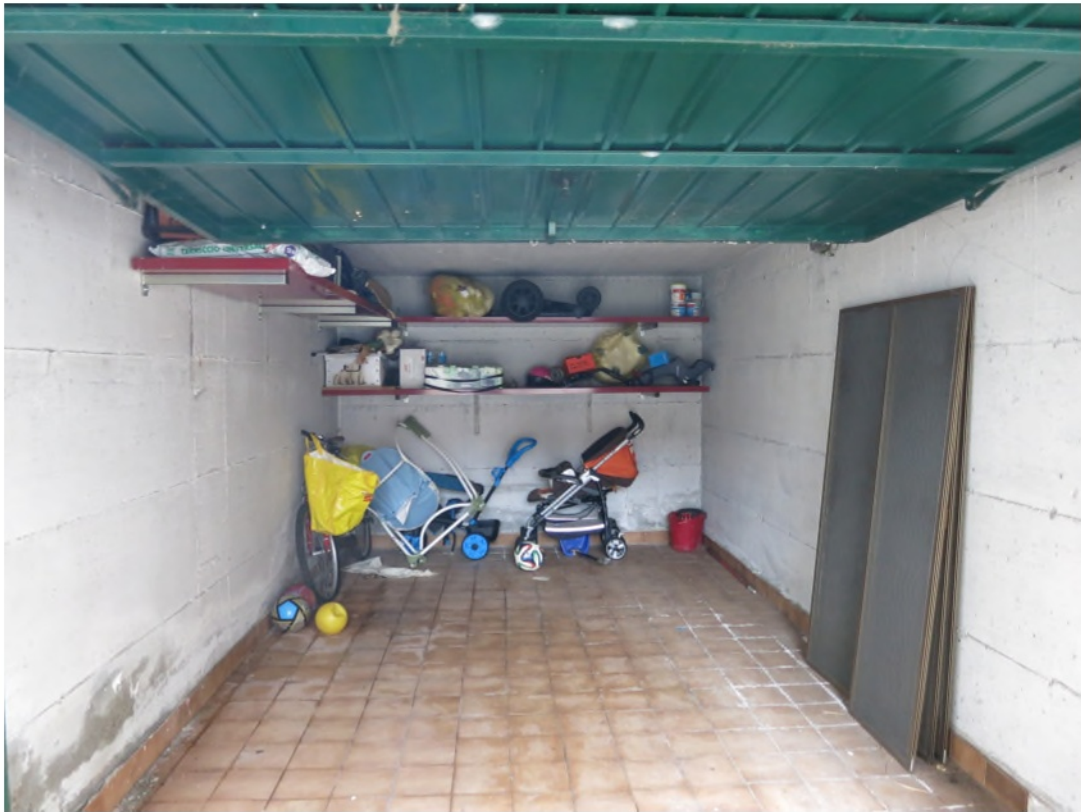
Vista interna del box