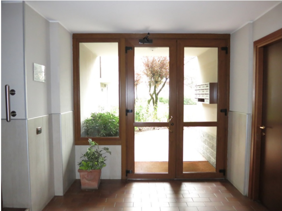
Androne di ingresso