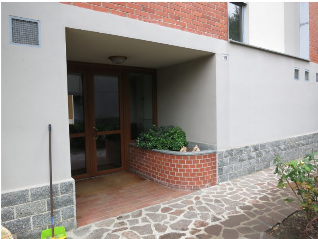
Ingresso al fabbricato