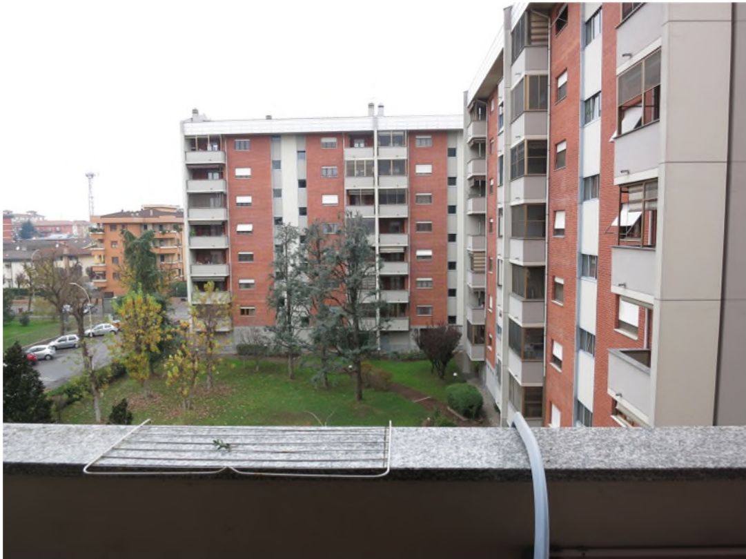
Vista dal balcone