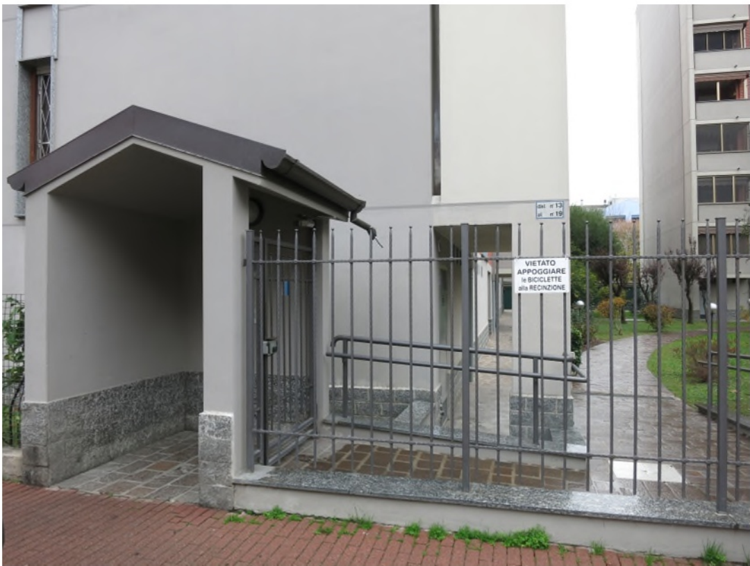
Viste esterne del complesso immobiliare