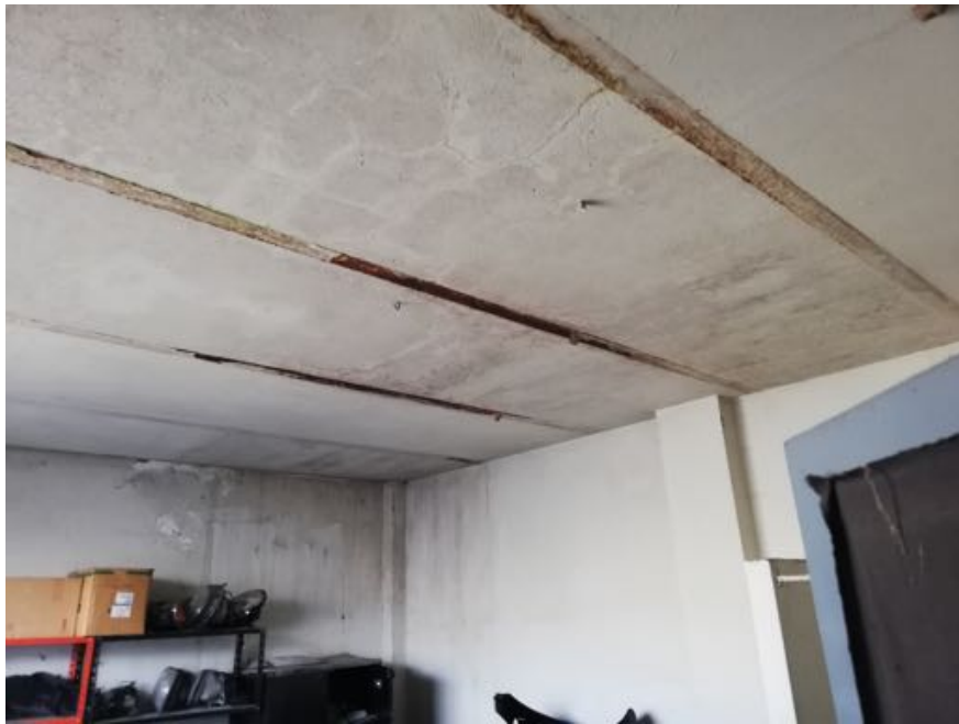
LOCALI LABORATORIO (infiltrazioni dal tetto)