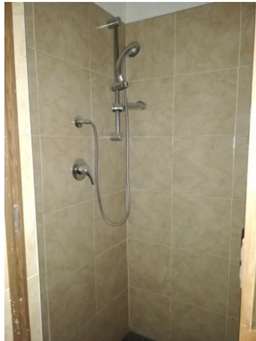
LOCALE CARROZZERIA (bagni)