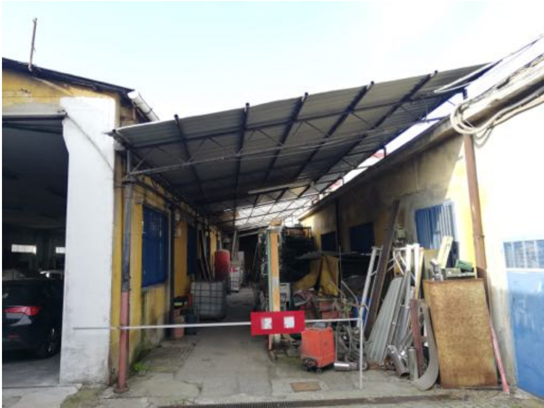
TETTOIA ANNESSA ALLA CARROZZERIA (proprietà esclusiva solo della metà verso la carrozzeria)