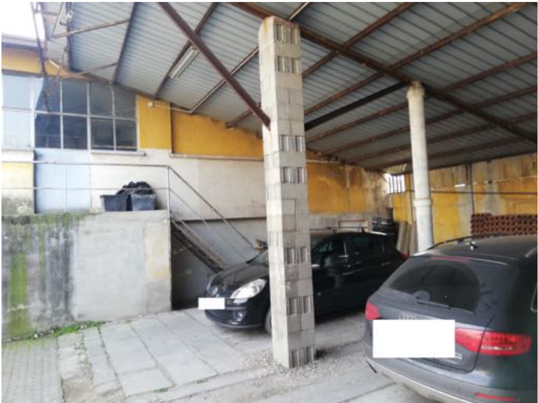
LOCALI LABORATORIO AL PIANO 1° E LOCALI DEPOSITO AL PIANO TERRA (vista dalla tettoia di proprietà esclusiva)