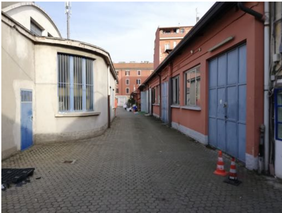
VISTA DEL CORTILE COMUNE DALLA PROPRIETA'