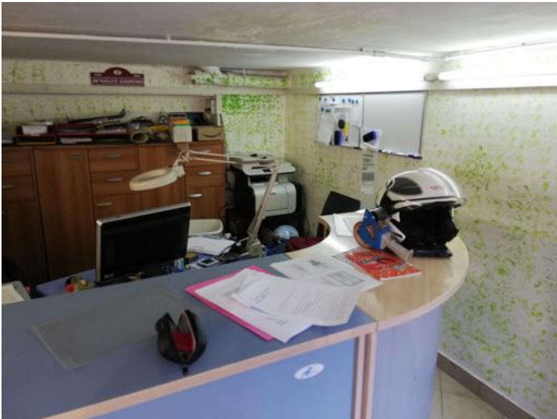
LOCALE DEPOSITO ADIBITO A UFFICIO (piano terra)