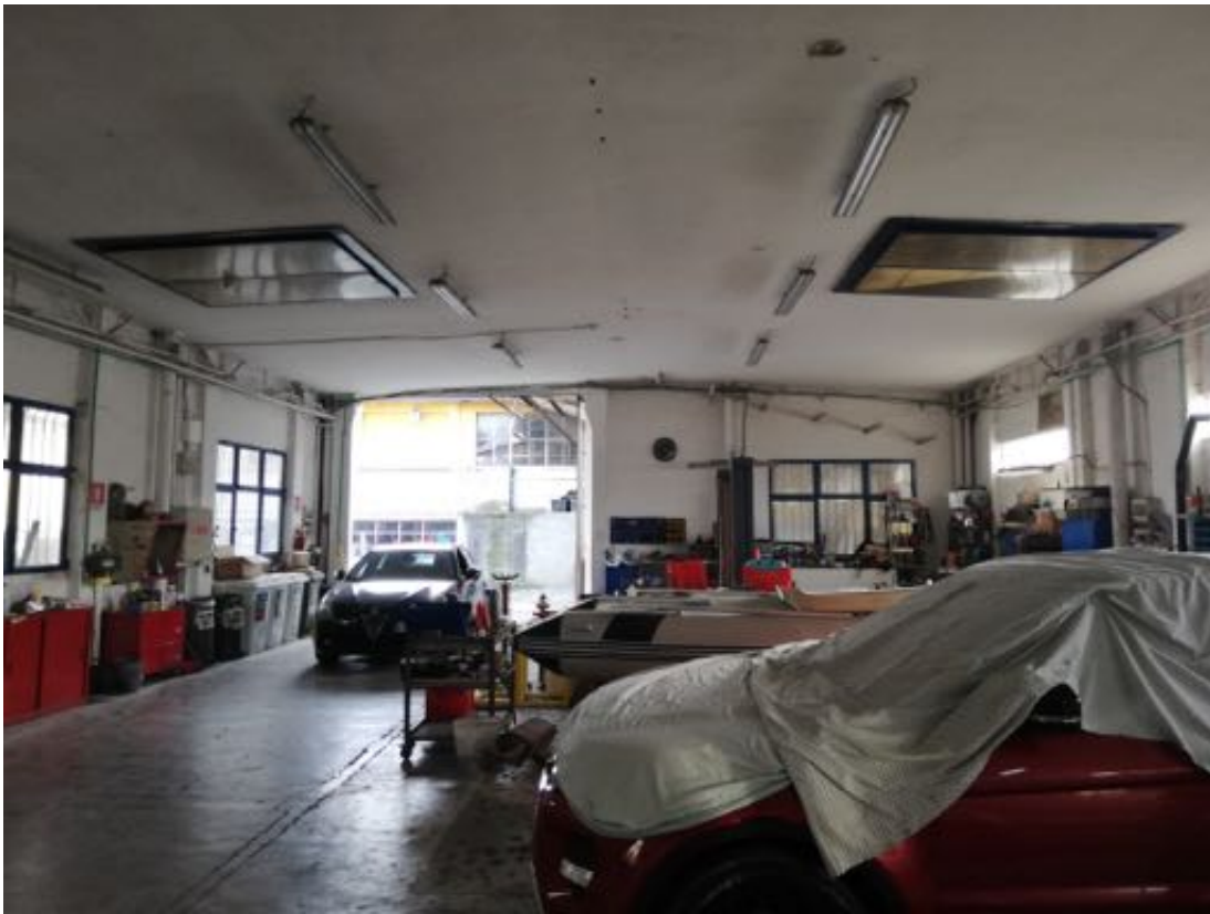
LOCALE CARROZZERIA (interno)