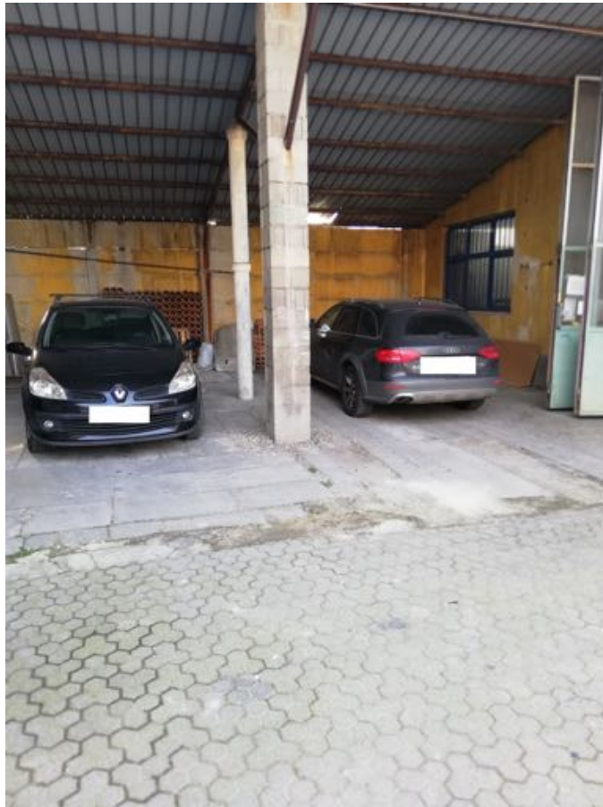
TETTOIA DI PROPRIETA' ESCLUSIVA