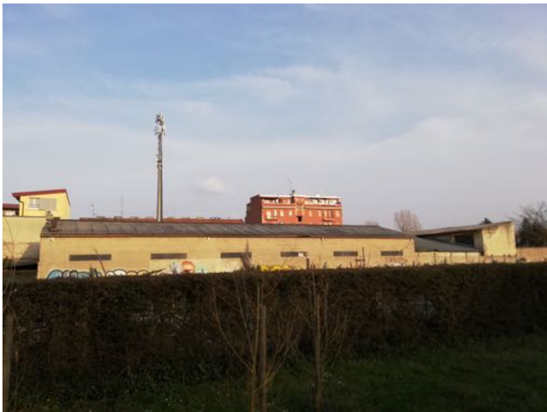
VISTA DELLA PROPRIETA' (fronte ovest, affaccio su area Parco Nord)