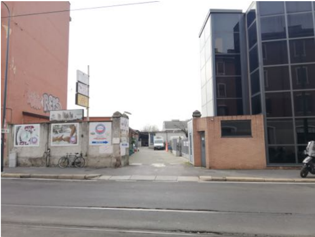
INGRESSO COMUNE DA VIA GRAZIANO IMPERATORE