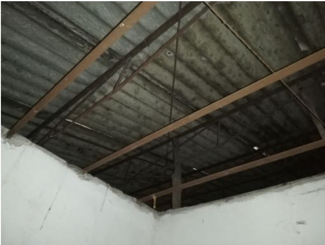
INTRADOSSO COPERTURA CARROZZERIA E TETTOIA ANNESSA