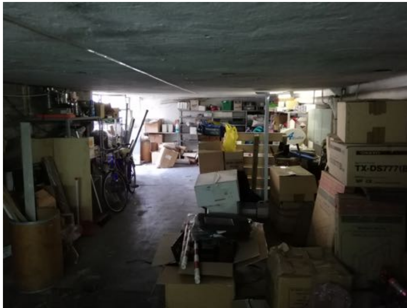
LOCALE DEPOSITO (piano terra)