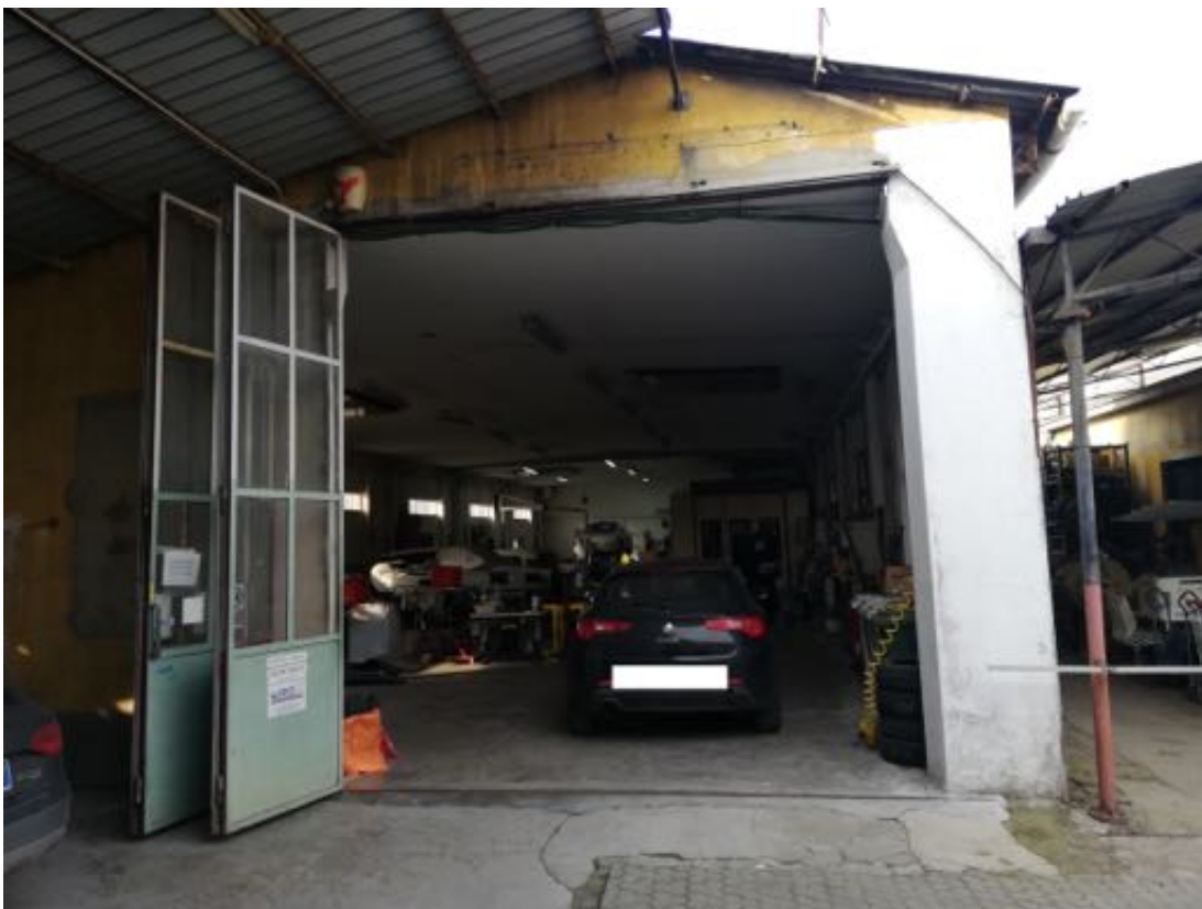
INGRESSO AL LOCALE CARROZZERIA