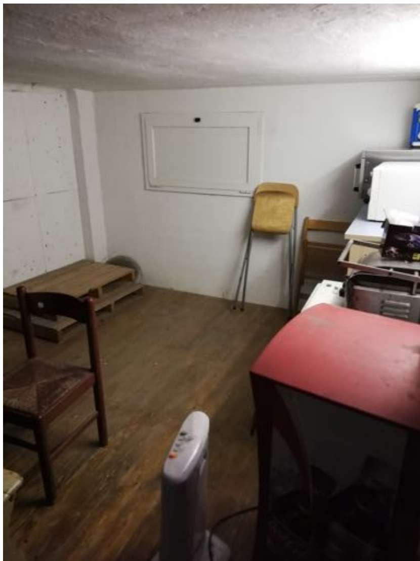
LOCALE DEPOSITO ADIBITO A SPOGLIATOIO (piano terra)