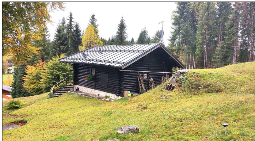
Vista lato nord-est