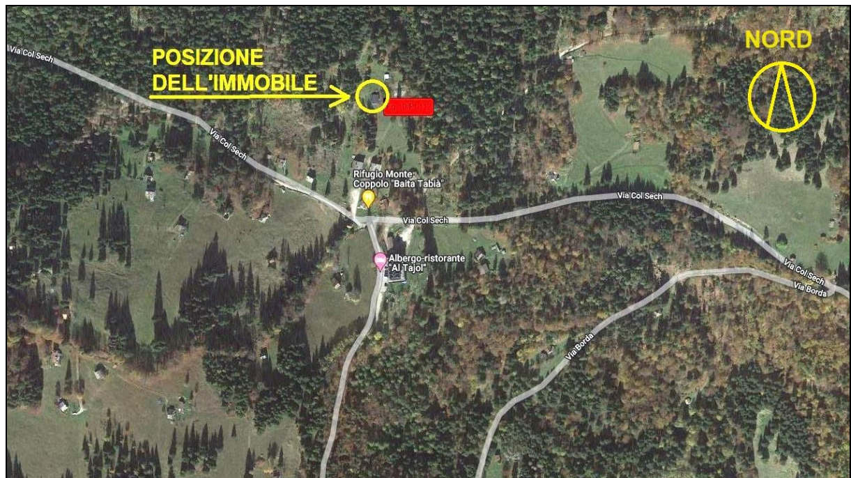
Vista aerea della zona