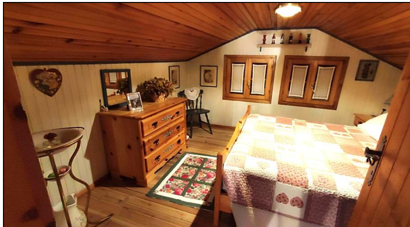
Stanza lato nord – soffitta sottotetto (adibita a camera)