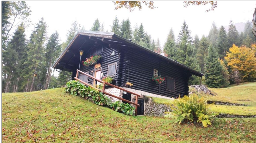
Vista lato sud-est