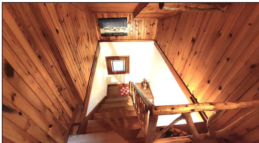
Scala di collegamento p. terra – sottotetto