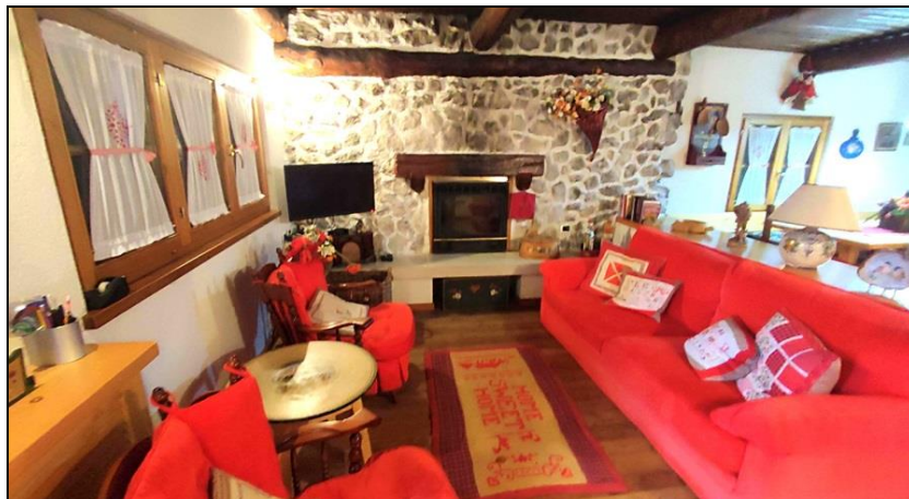
Soggiorno con vista camino e zona salotto