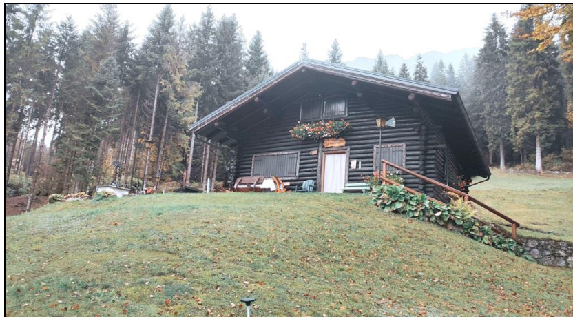
Facciata principale lato sud