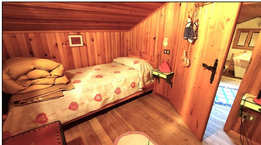
Stanza lato sud – soffitta sottotetto (adibita a camera)