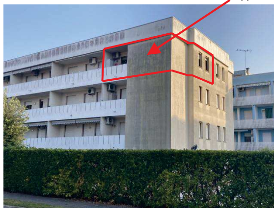
vista esterna fabbricato lato Sud/Ovest