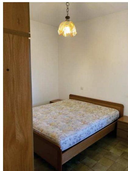
viste interne camera matrimoniale