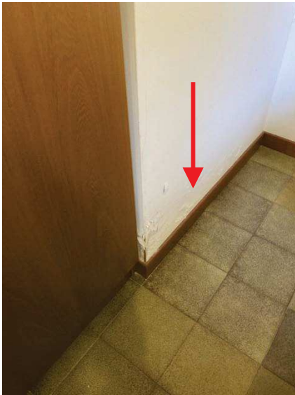
vista di una infiltrazione in camera proveniente dal piatto doccia