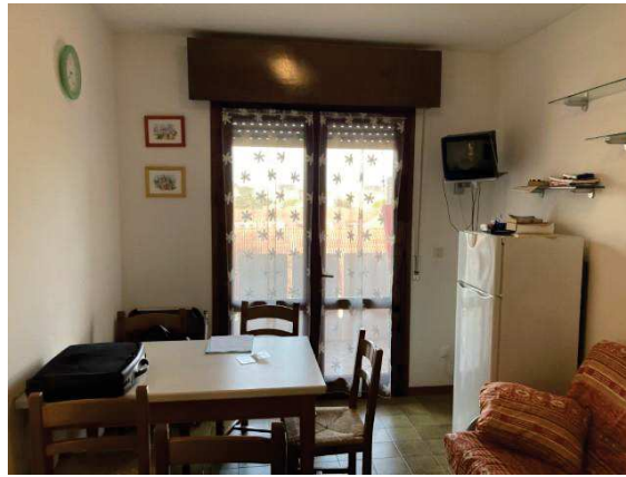
vista interna soggiorno