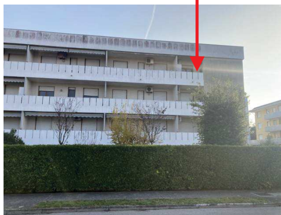
vista esterna fabbricato lato Ovest