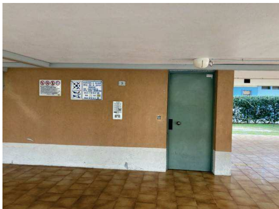
vista ingresso condominiale