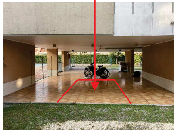
viste posto auto coperto -mappale 2309 sub. 50-