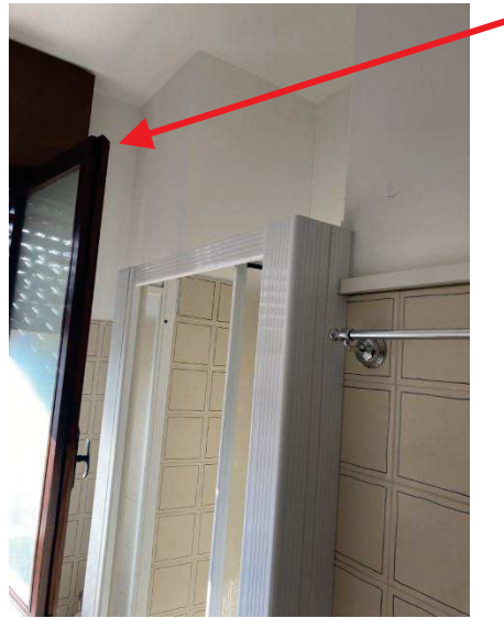
vista bagno difforme al progetto autorizzato con ampliamento da sanare