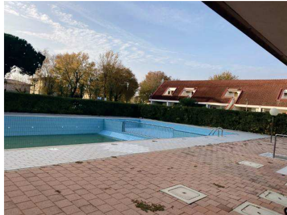
viste piscina con vano tecnico ad uso condominiale -mappale 2309 sub. 73-