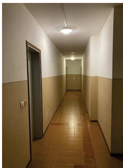
vista corridoio di piano condominiale