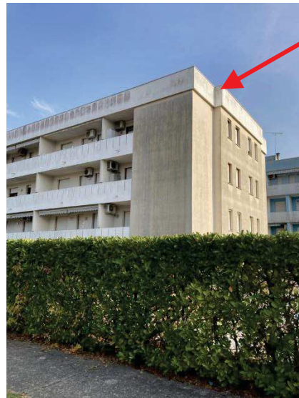
vista dell'angolo Sud/Ovest in corrispondenza dell'ampliamento del bagno da sanare