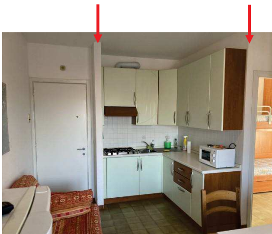
vista difformità della zona cottura nonché eliminazione delle spallette in muratura tra soggiorno e corridoio