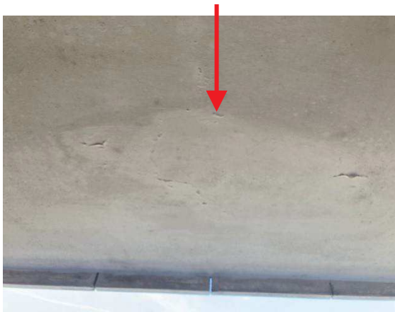
vista nel soffitto soprastante al terrazzo di una infiltrazione d'acqua proveniente dal tetto terrazza