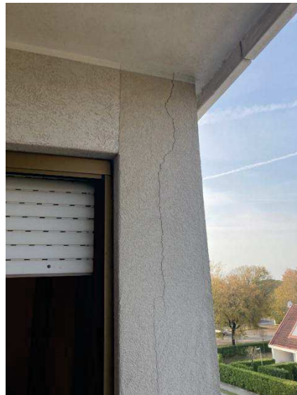
vista dal terrazzo di una microlesione strutturale nella muratura