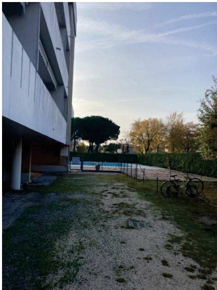
viste cortile lato Ovest