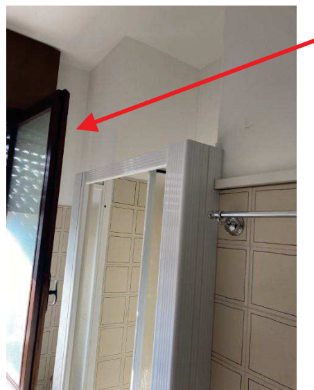
vista interna dell'ampliamento da sanare nel bagno