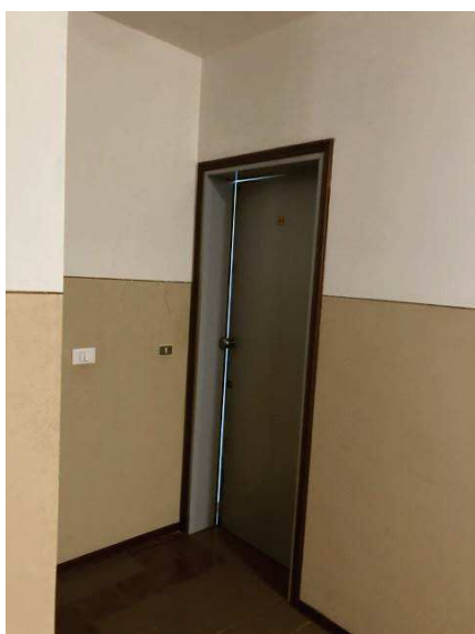
vista porta d'ingresso appartamento