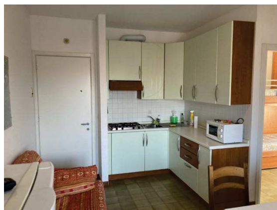
vista interna zona cottura