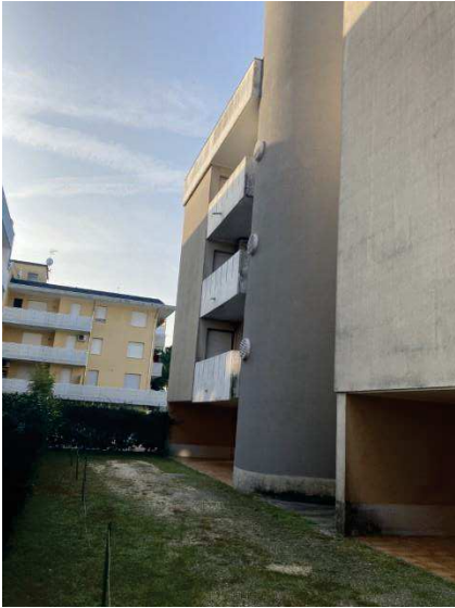
viste cortile lato Est