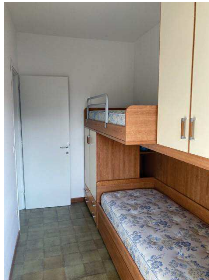
viste interne cameretta