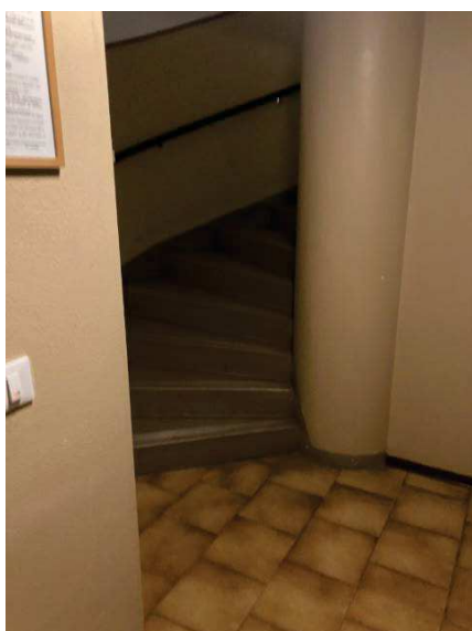
vista scala interna condominiale