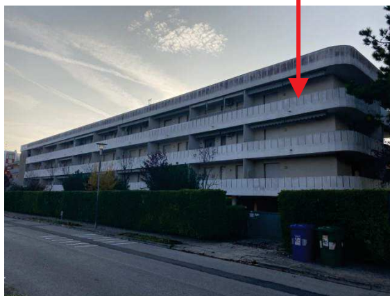
vista generale dalla strada del “Residence Le Azalee”