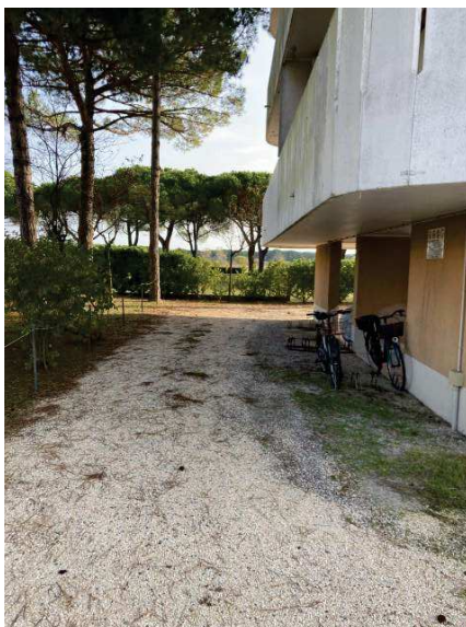
vista cortile lato Nord