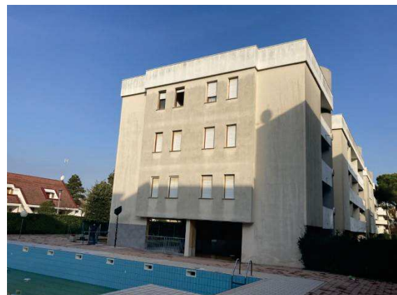
vista esterna fabbricato lato Sud