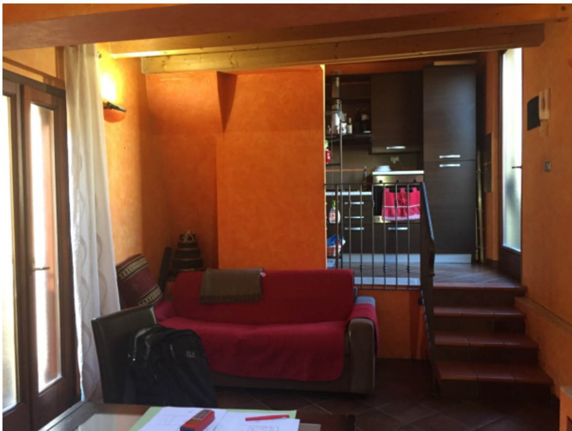
Foto 09 - Soggiorno