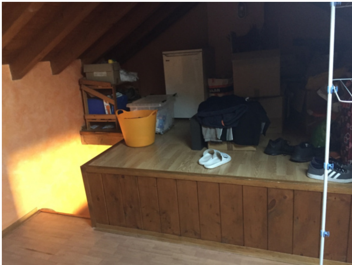
Foto 29 - Soppalco