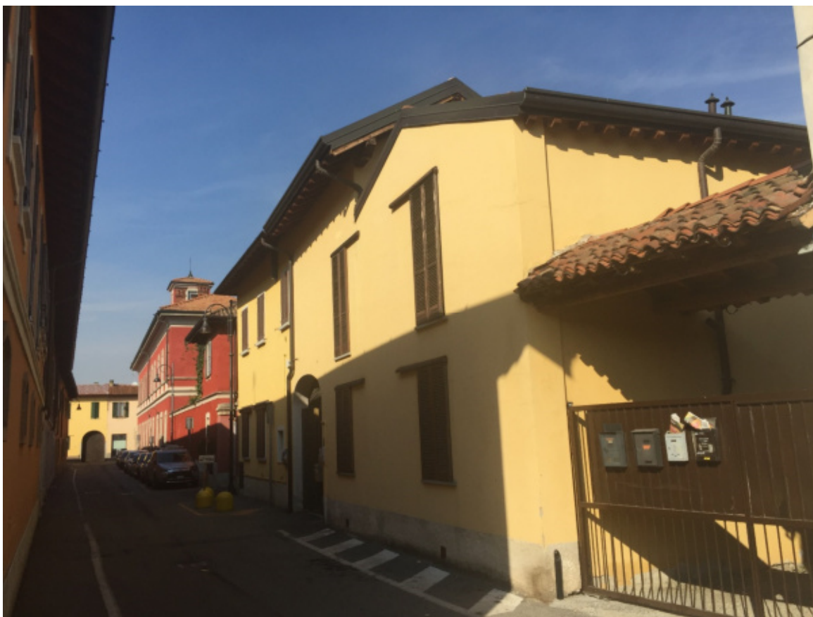
Foto 02 - Il fabbricato su via Garibaldi