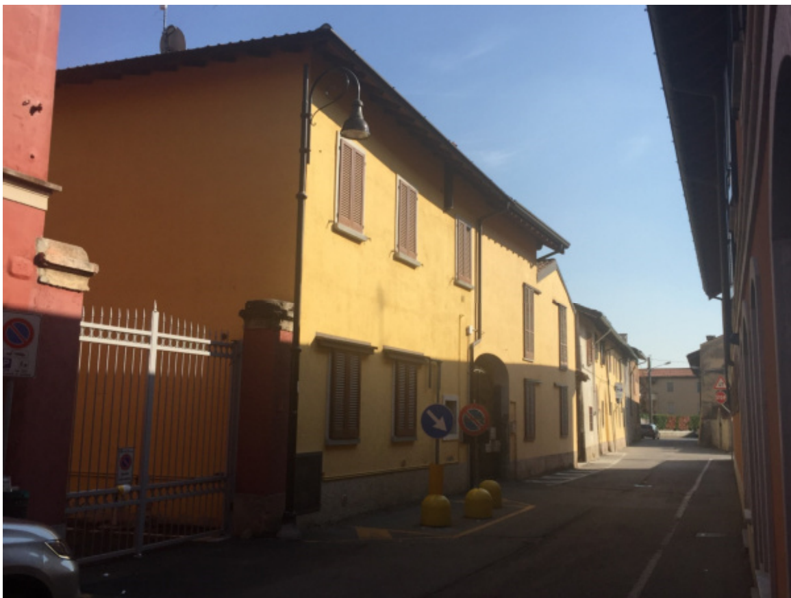
Foto 01 - Il fabbricato su via Garibaldi