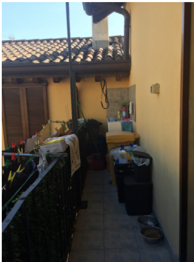
Foto 08 - Ballatoio di accesso all'unità