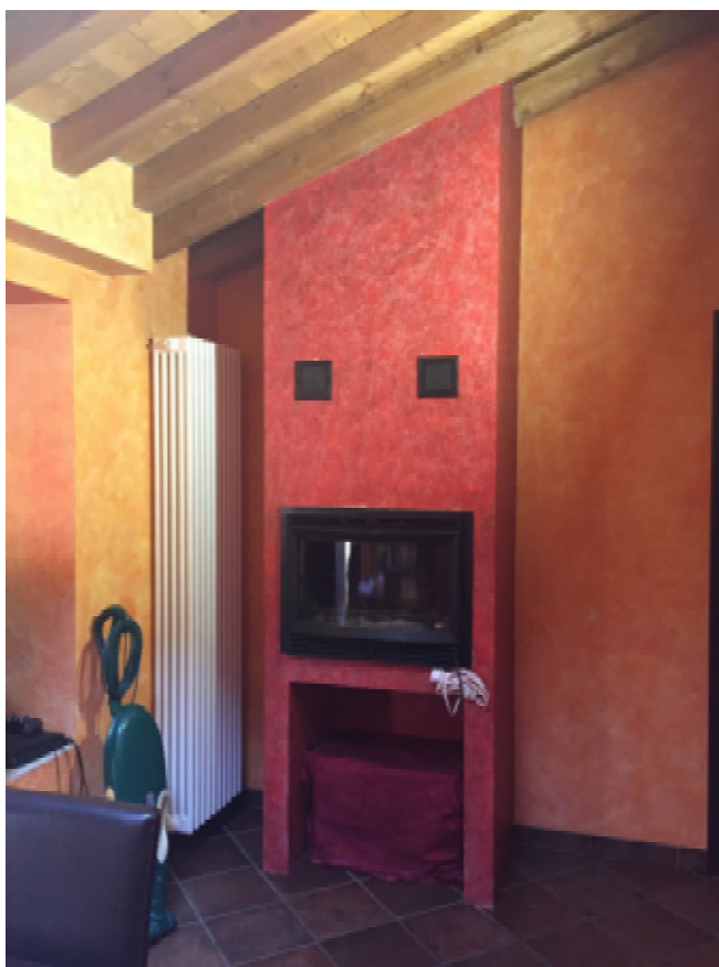
Foto 16 - Soggiorno