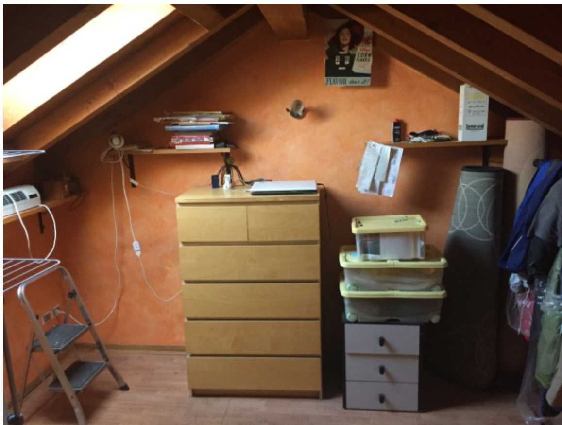
Foto 30 - Soppalco