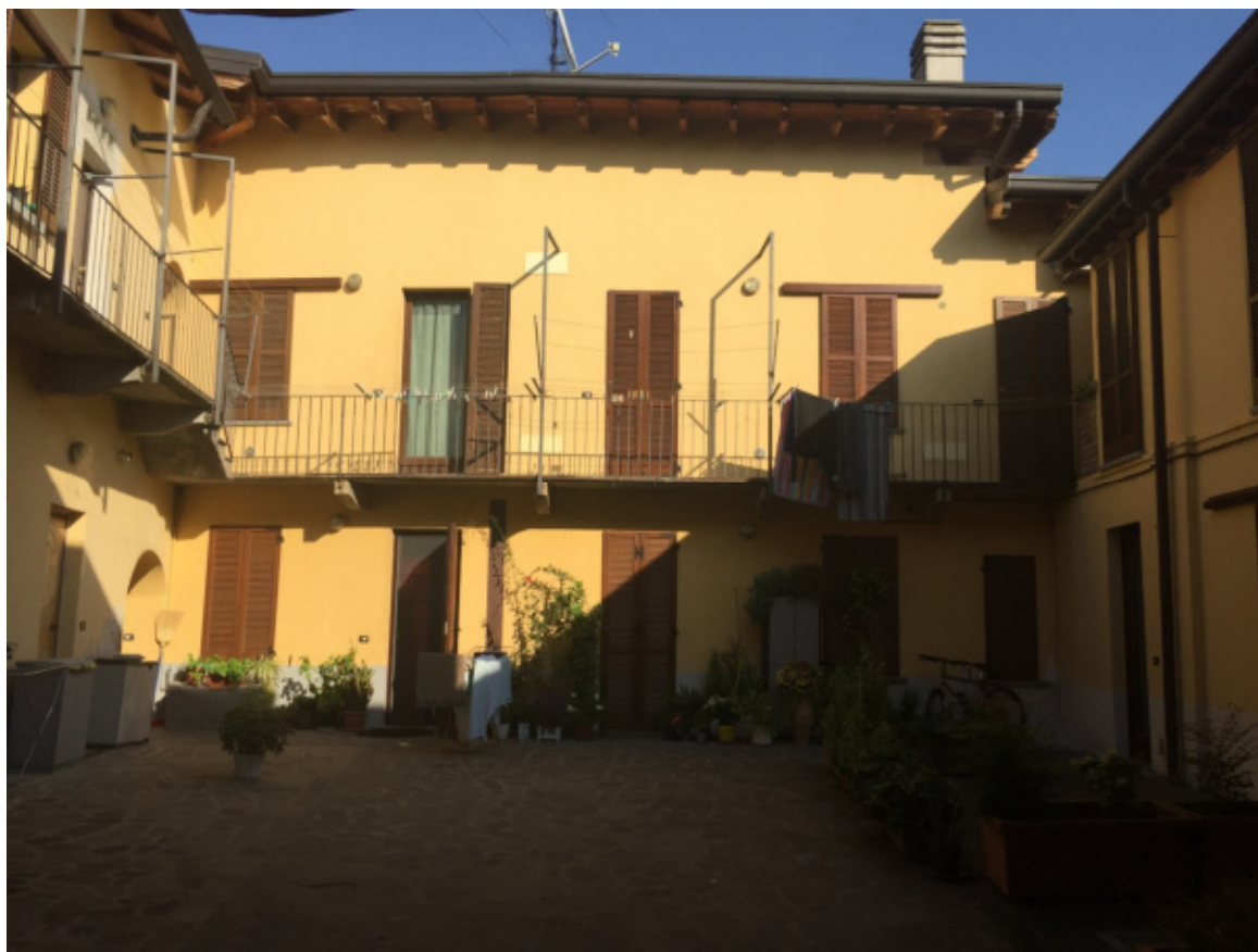
Foto 04 - Corte interna del fabbricato