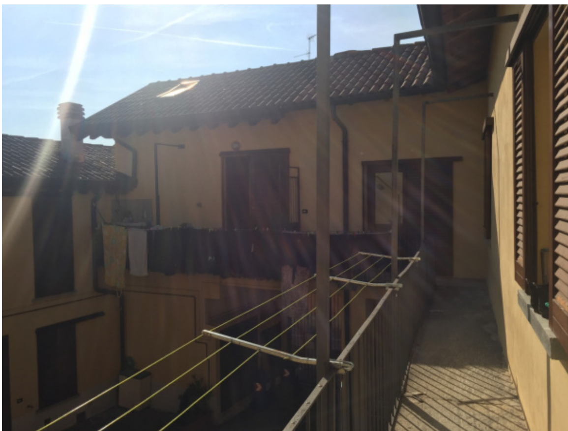
Foto 06 - Accesso all'unità dal ballatoio comune