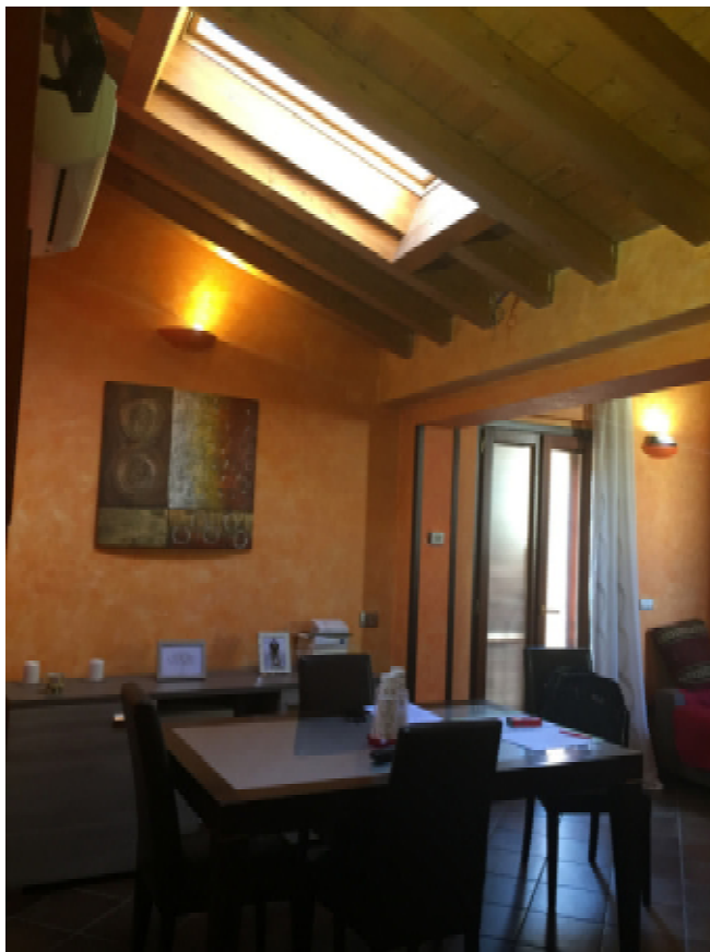
Foto 15 - Soggiorno