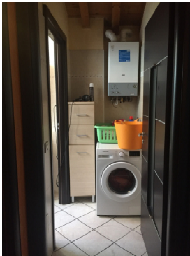
Foto 18 - Disimpegno