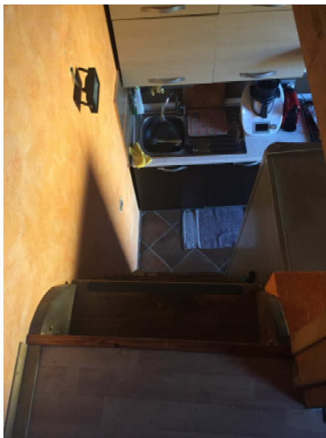
Foto 26 - Scala alla marinara di accesso al soppalco