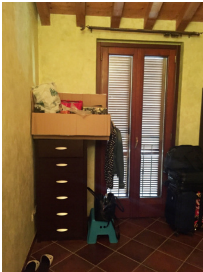
Foto 22 - Camera