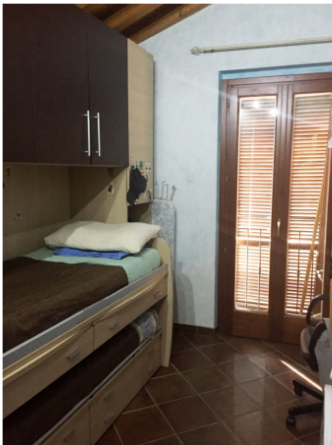
Foto 19 - Camera