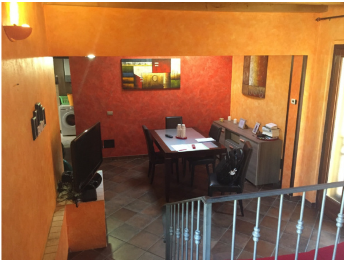
Foto 11 - Soggiorno