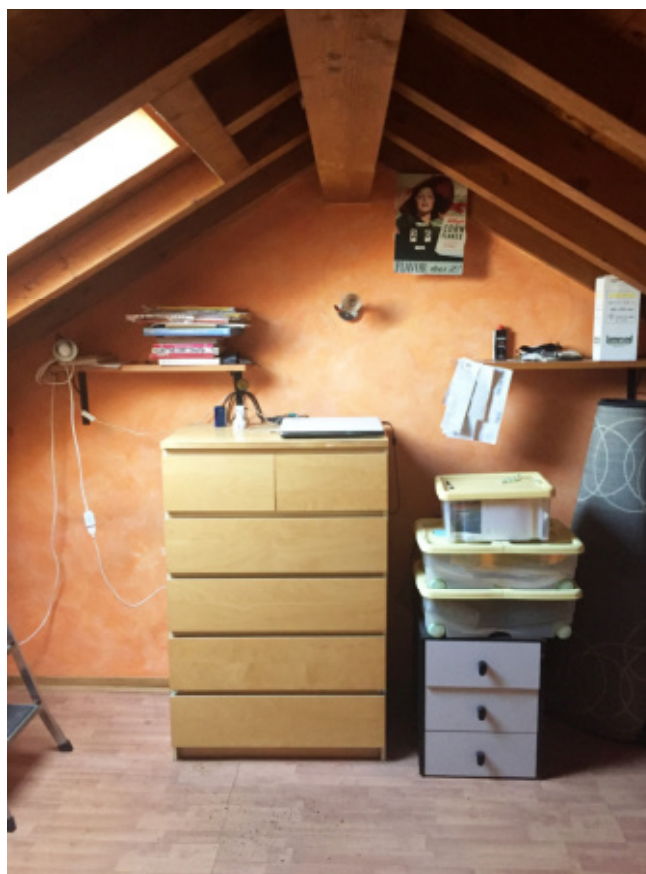
Foto 28 - Soppalco