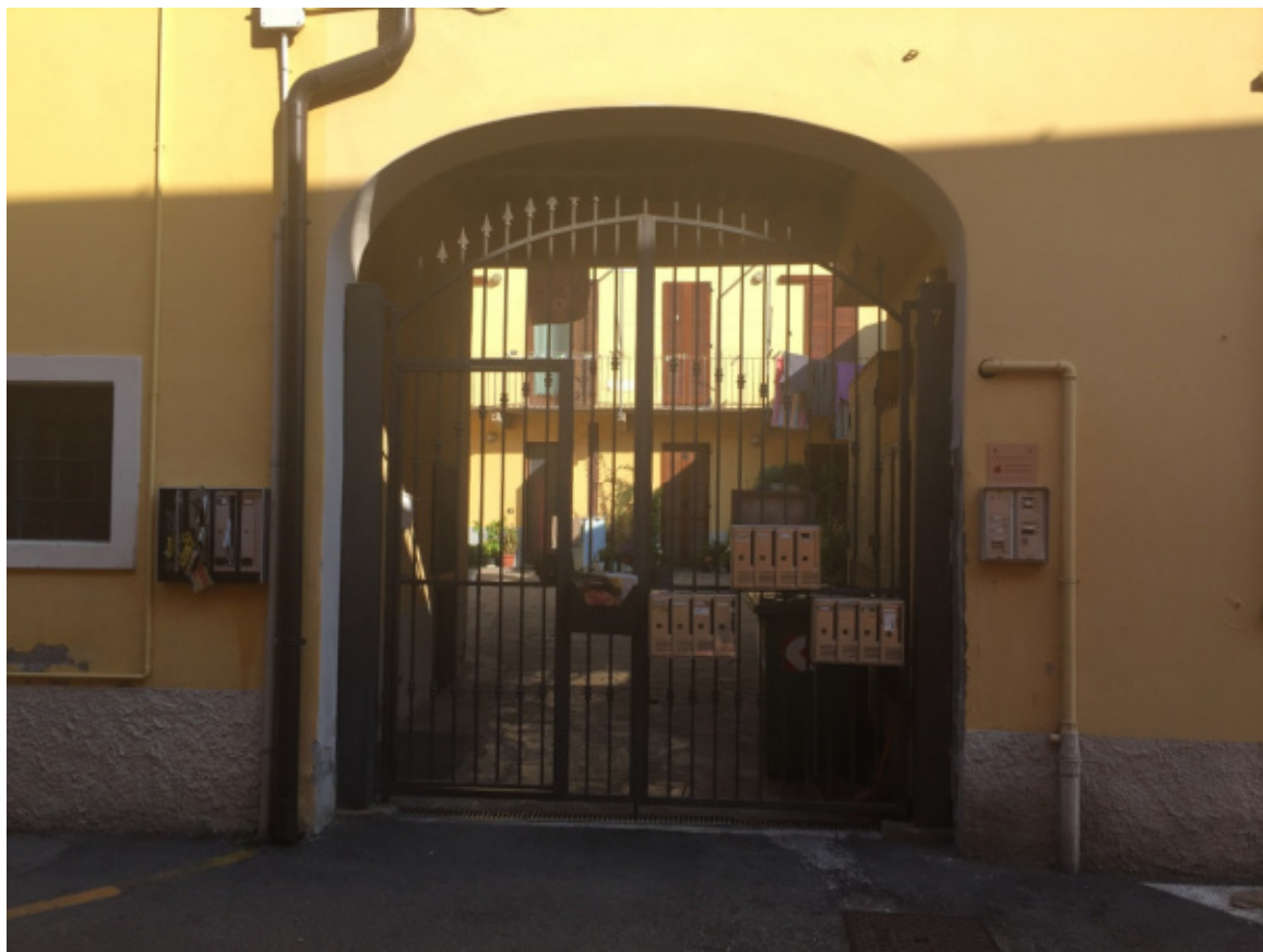
Foto 03 - Accesso al fabbricato in via Garibaldi al civico 7