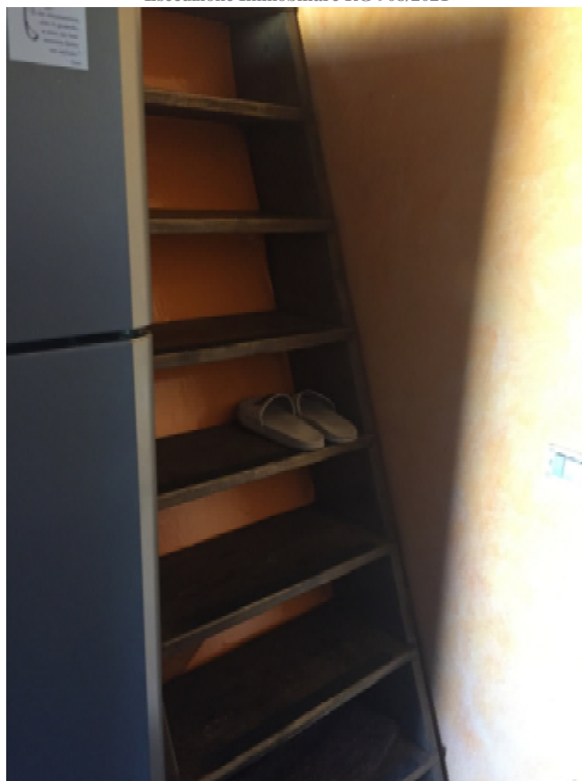
Foto 25 - Scala alla marinara di accesso al soppalco