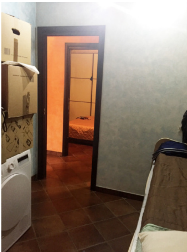
Foto 20 - Camera