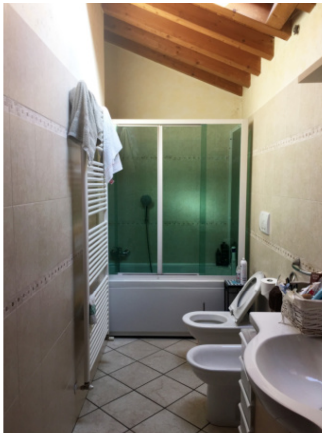
Foto 23 - Bagno