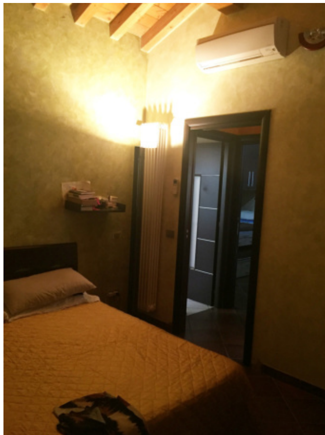
Foto 21 - Camera