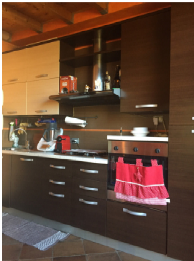
Foto 14 - Cucina