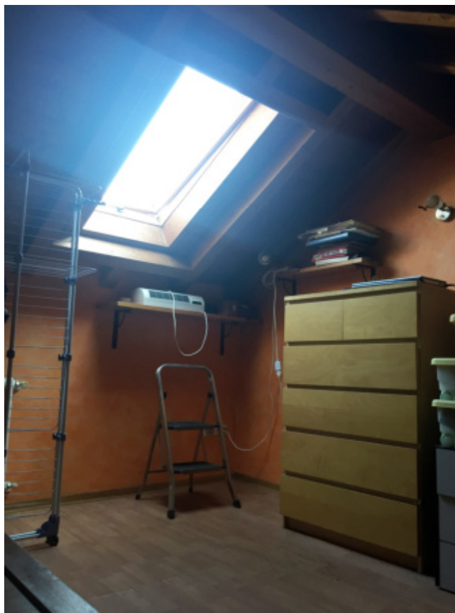
Foto 27 - Soppalco