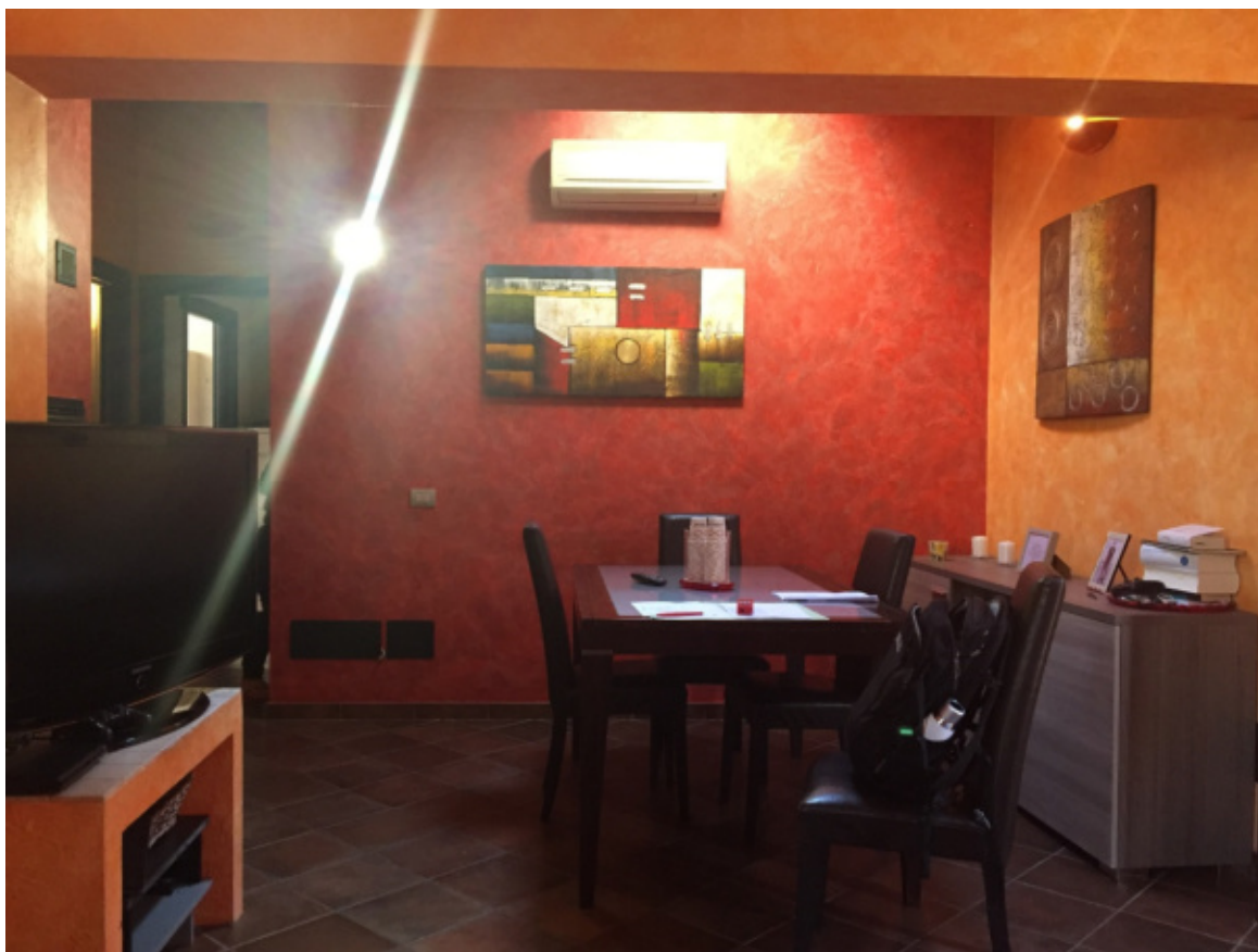
Foto 10 - Soggiorno