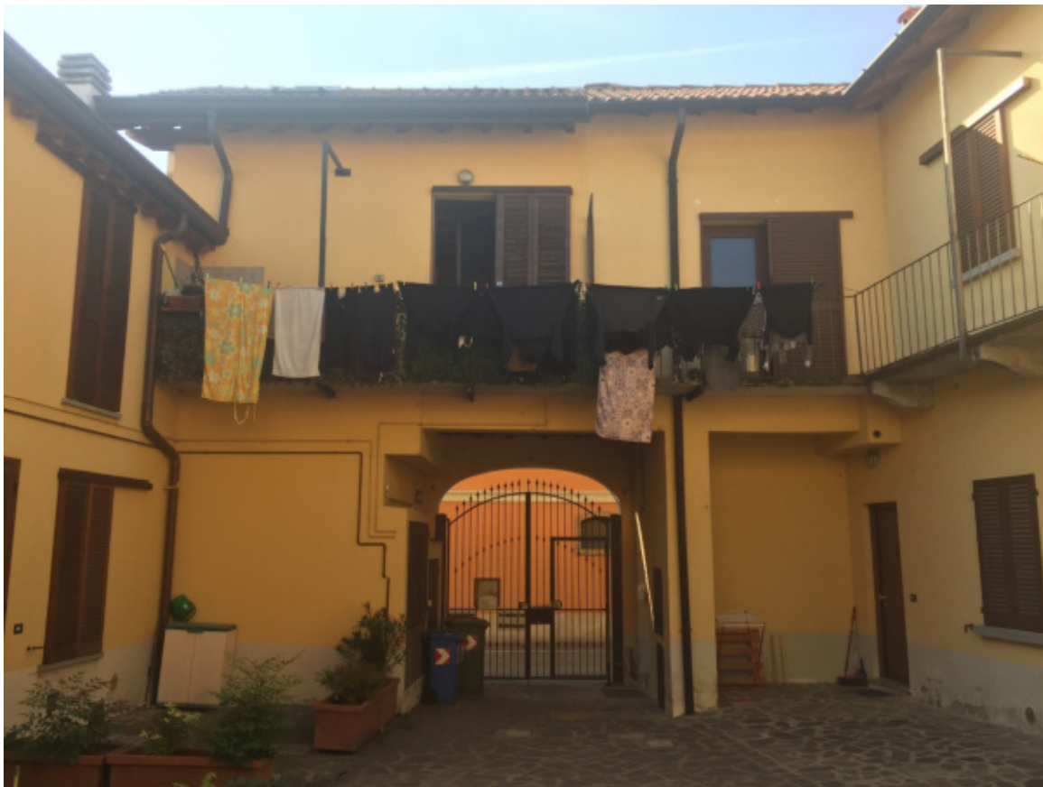
Foto 05 - Corte interna del fabbricato