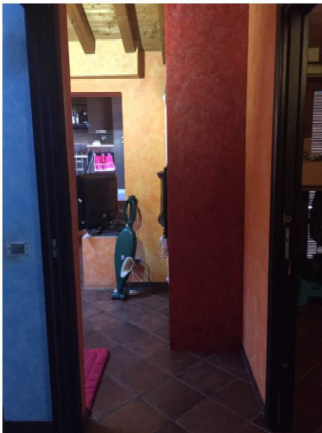
Foto 17 - Disimpegno