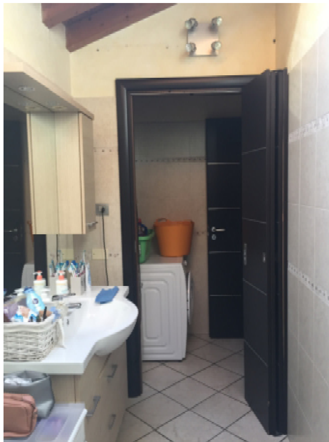
Foto 24 - Bagno