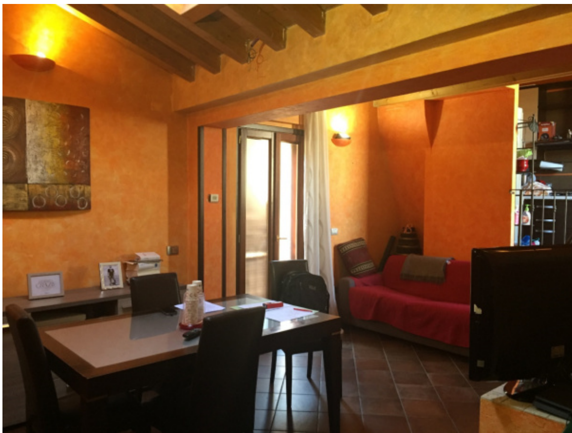
Foto 12 - Soggiorno