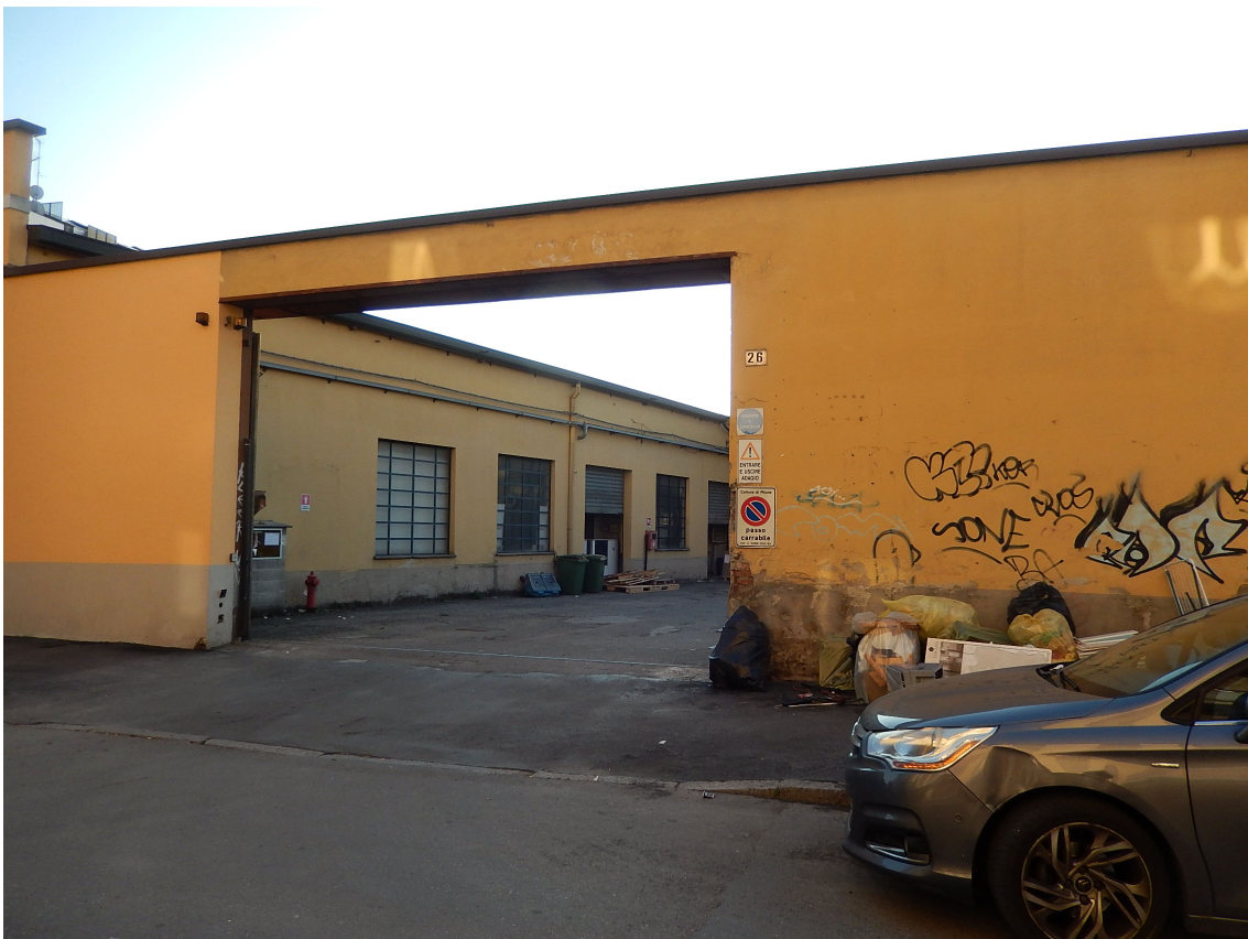
Foto 2 – Vista del passo carraio di accesso al cortile dove si trova l'unità in esame.