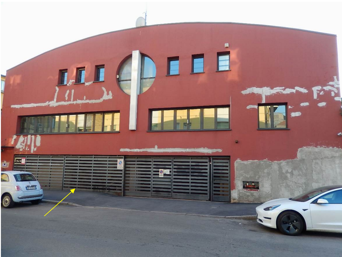
Foto 2 - Indicato dalla freccia il portone di accesso alle autorimesse.