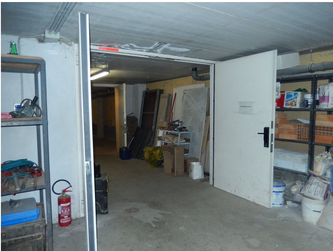
Foto 4 – Vista interna del magazzino in prossimità del portone d'ingresso.