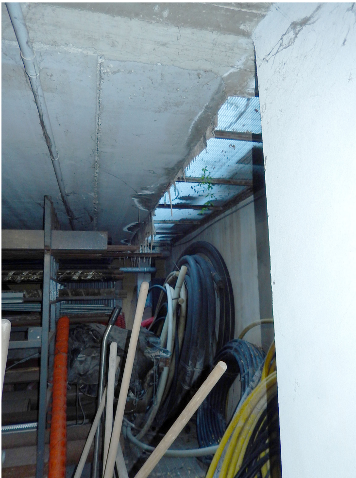
Foto 8 – Particolare della copertura del magazzino in corrispondenza delle griglie d'aerazione.