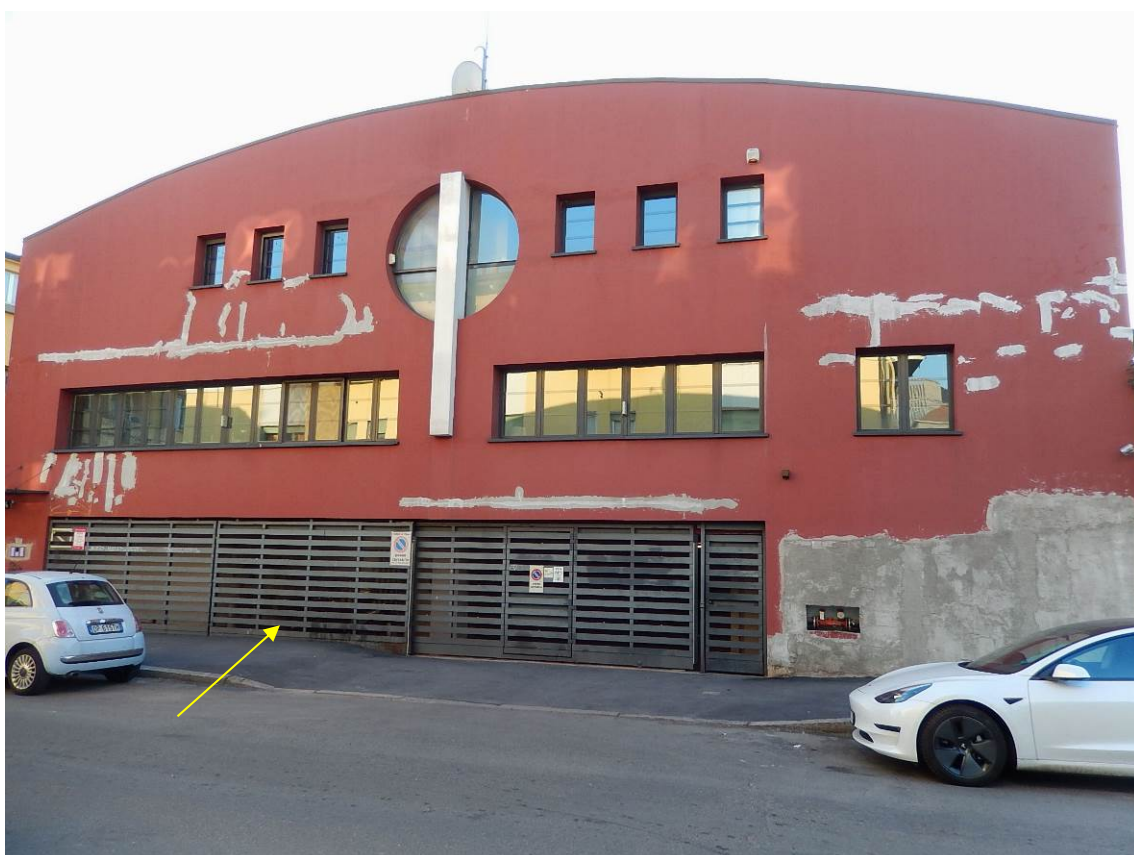
Foto 2 - Indicato dalla freccia il portone di accesso.