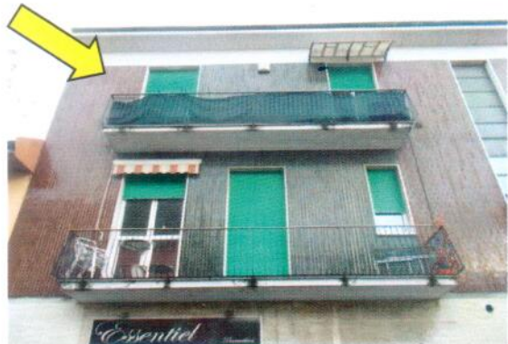
2. Dettaglio del piano secondo