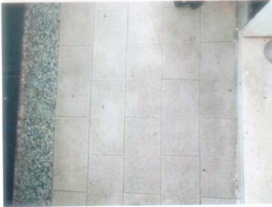
23. Pavimento del balcone