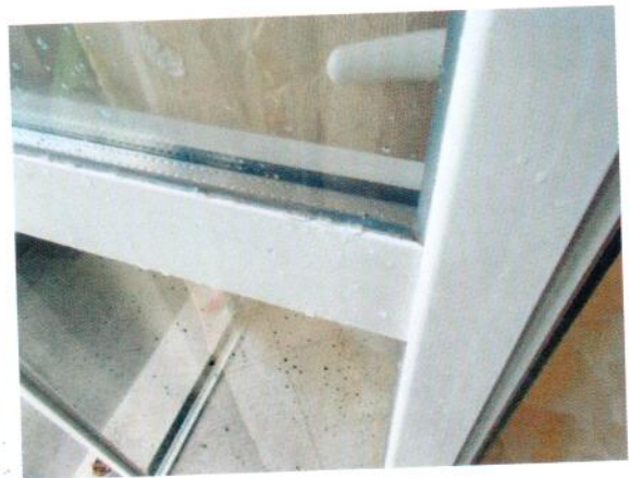
34. Dettaglio serramento esterno