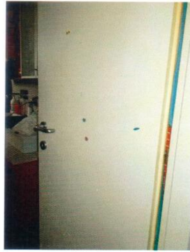
12. Porta di accesso al bagno