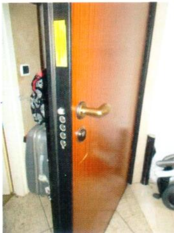
9. Portoncino di ingresso