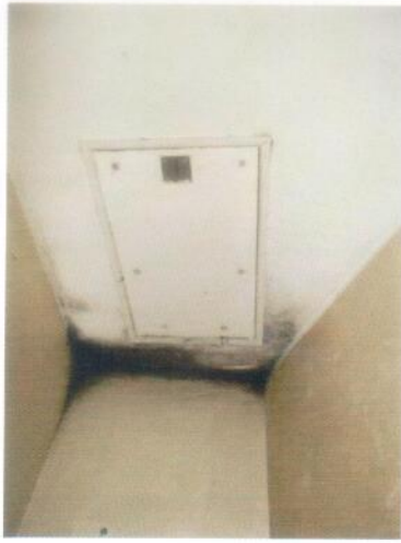
11. Soffitto dell'ingresso