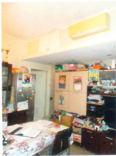
19. Soggiorno/cucina (verso il corridoio)