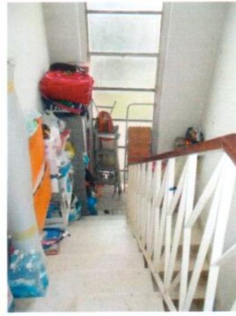
6. Corpo scala