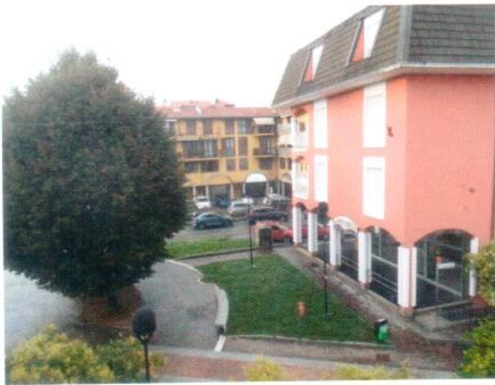
25. Vista dal balcone