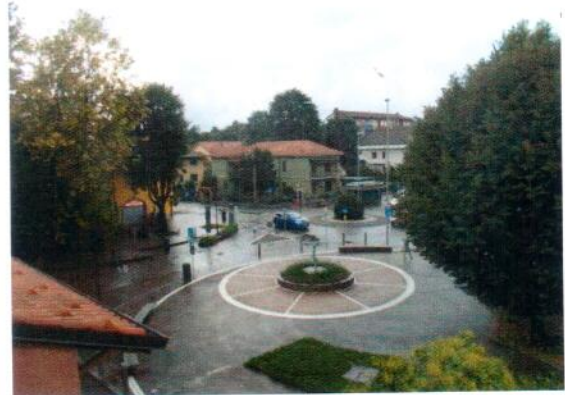
26. Vista dal balcone