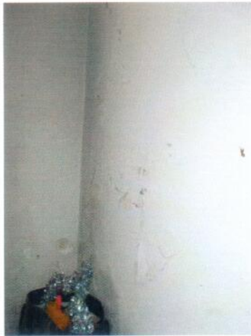
7. Pareti del corpo scala