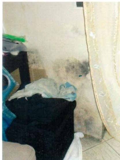
36. Parete del soggiorno/cucina