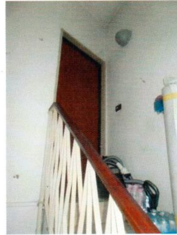
8. Ingresso all'immobile pignorato