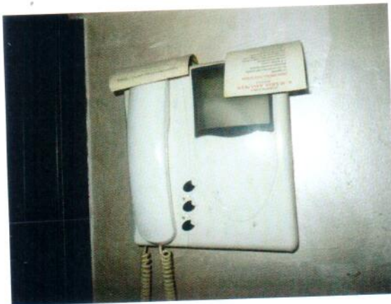
33. Citofono (solo voce)