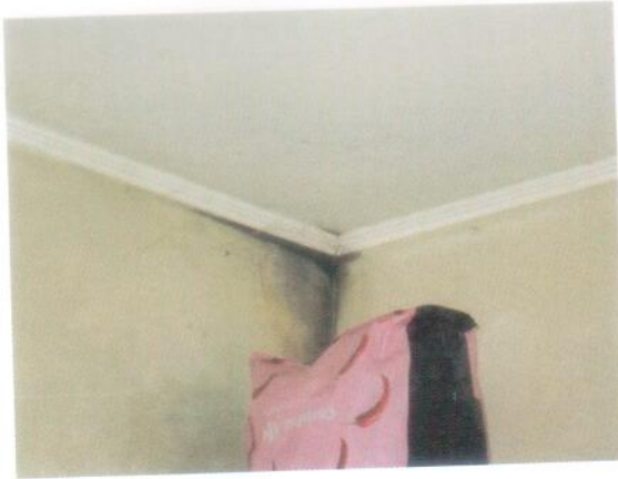
29. Dettaglio pareti della camera