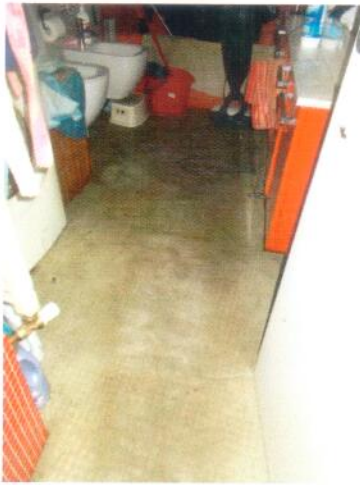
13. Pavimento del bagno