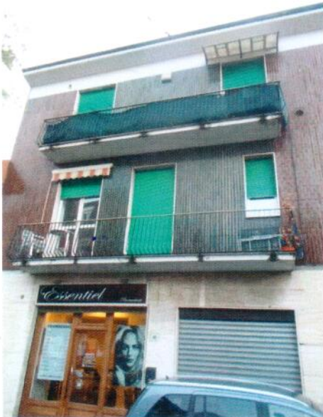
3. Panoramica della facciata principale