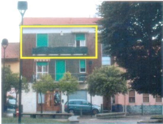
1. Facciata esterna dalla piazza Karl Marx