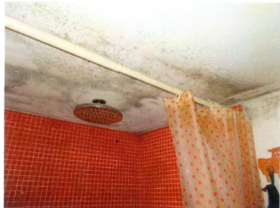
16. Doccia nel bagno