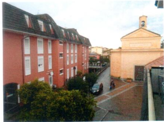
24. Vista dal balcone