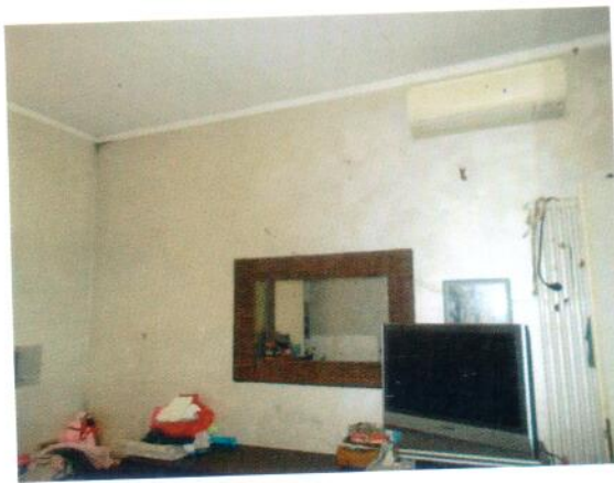
31. Condizionatore in camera