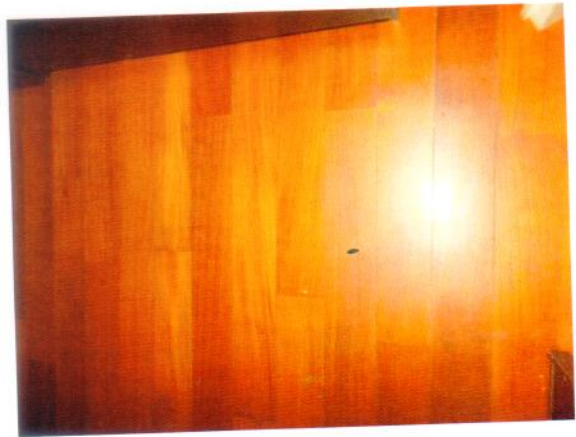
30. Dettaglio pavimento della camera