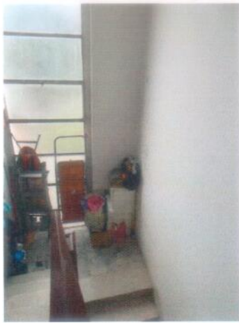
5. Corpo scala