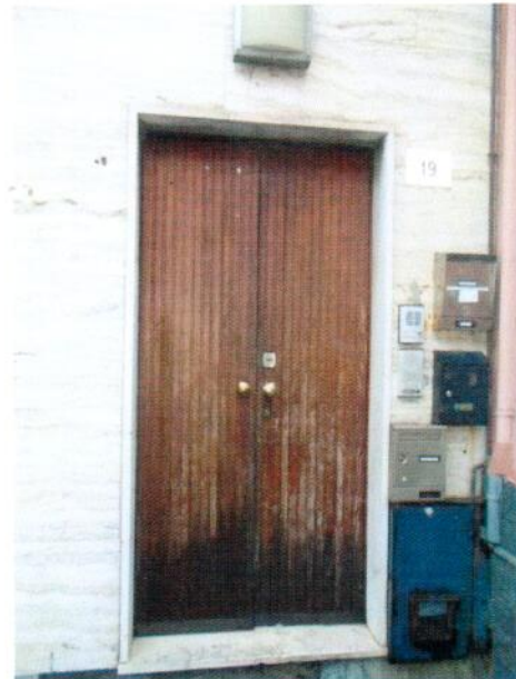
4. Portoncino di ingresso al fabbricato