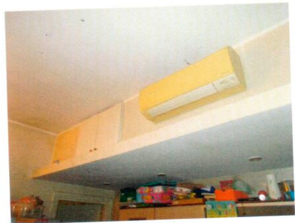
32. Condizionatore nel soggiorno