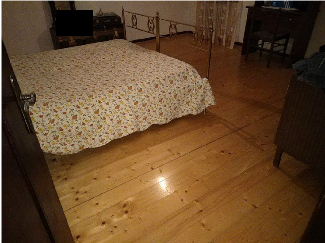
Foto 19 Particolare di una camera.