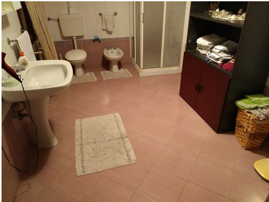
Foto 17 Vista del bagno ricavato al piano primo.