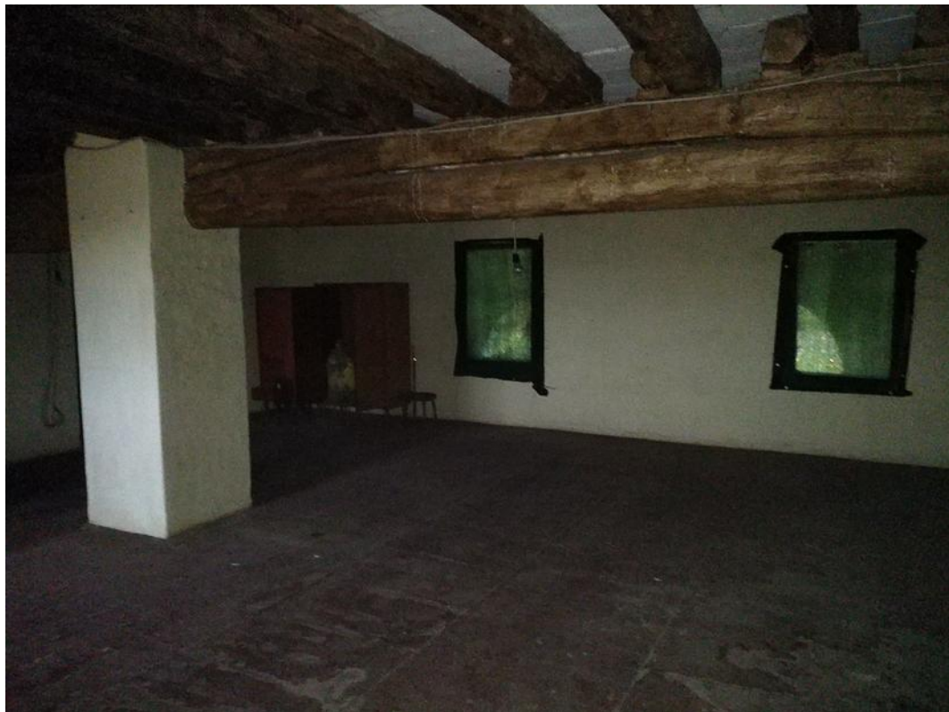
Foto 24 Particolare del magazzino/granaio a P1.