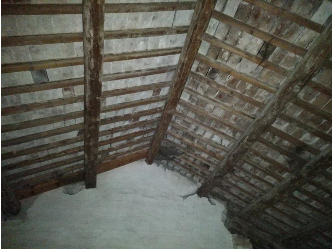
Foto 27 Particolare della struttura di copertura.