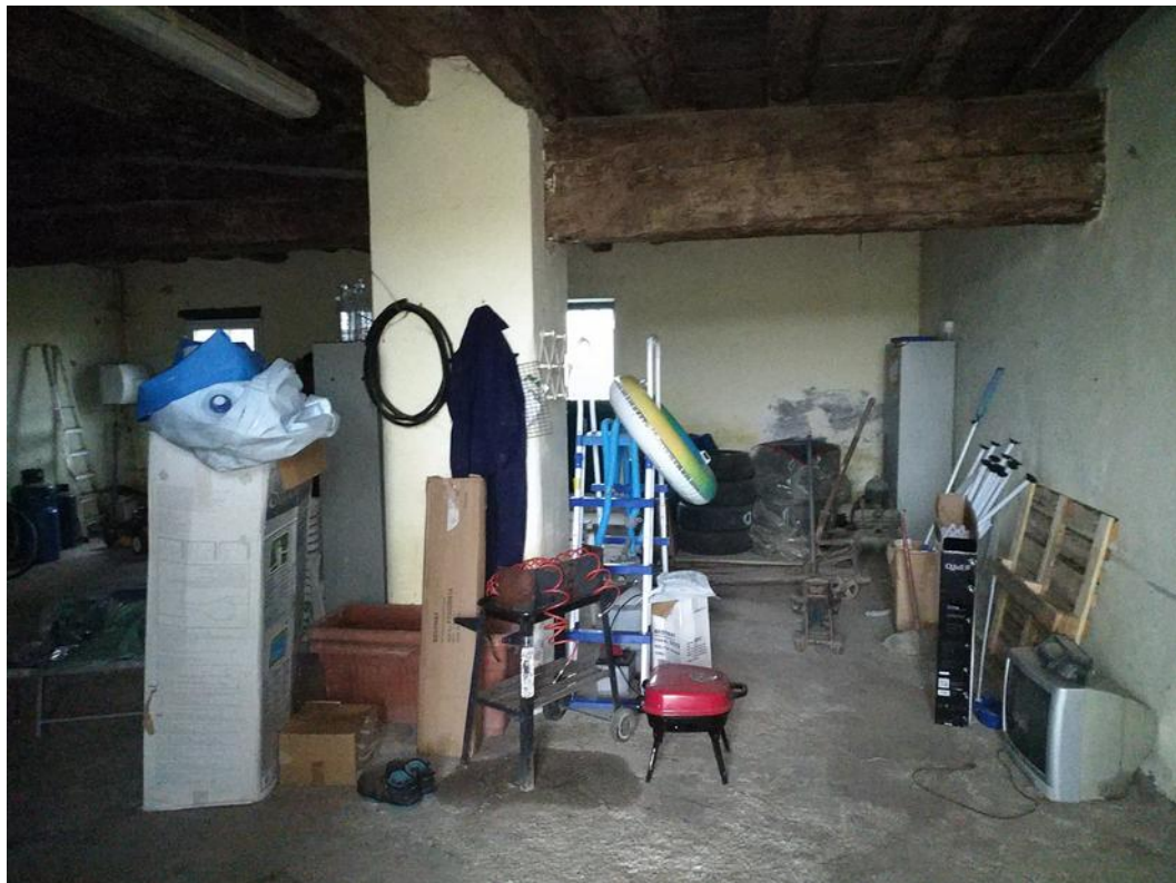
Foto 21 Vista del magazzino a piano terra.