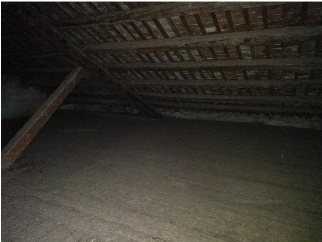
Foto 28 Particolare della struttura di copertura.