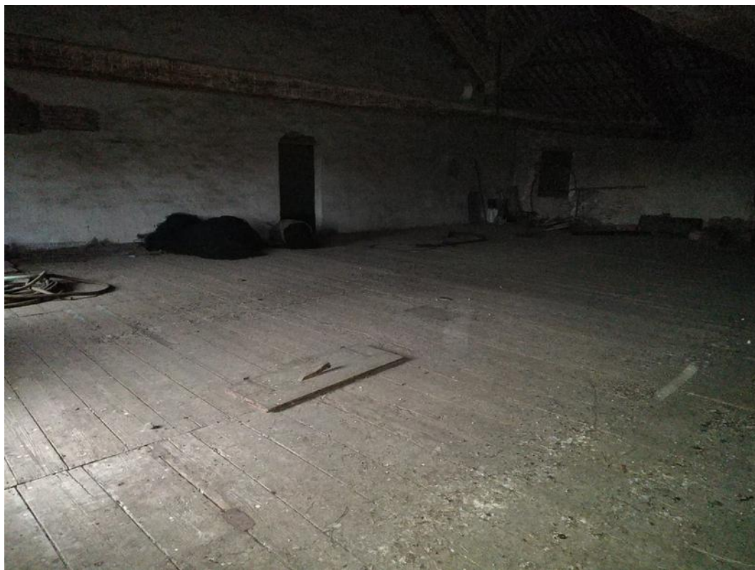
Foto 26 Scorcio del granaio nel sottotetto.