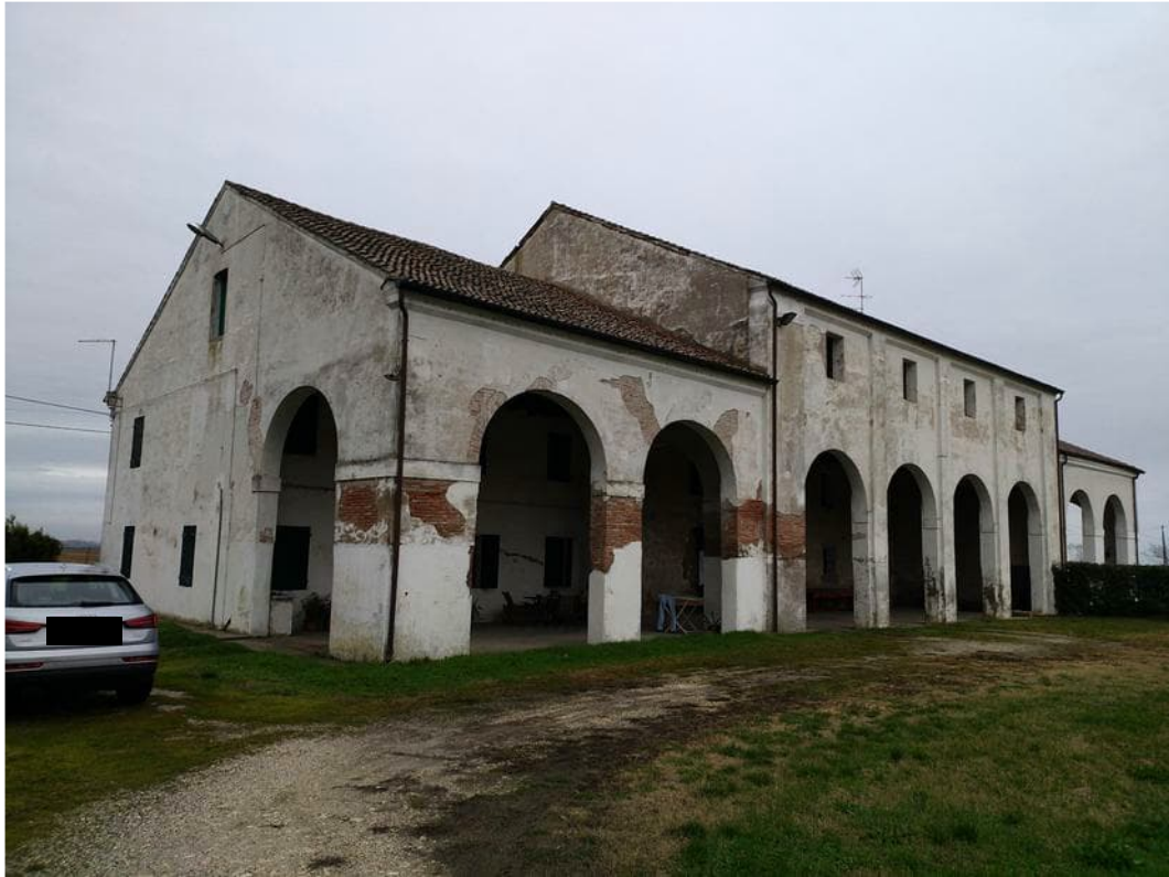
Foto 9 Vista dell'edificio.