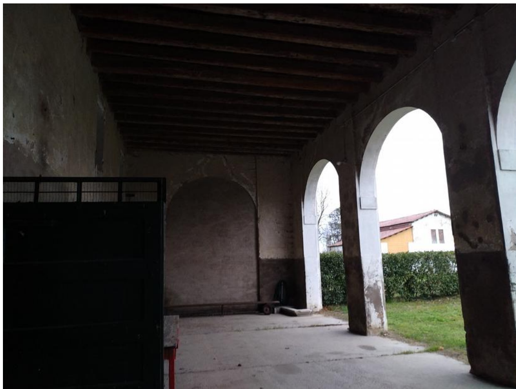
Foto 12 Vista del portico.