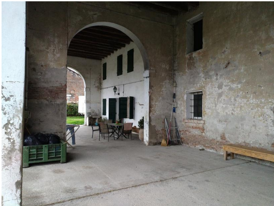
Foto 11 Vista del portico.