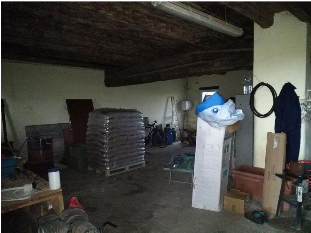
Foto 20 Vista del magazzino a piano terra.