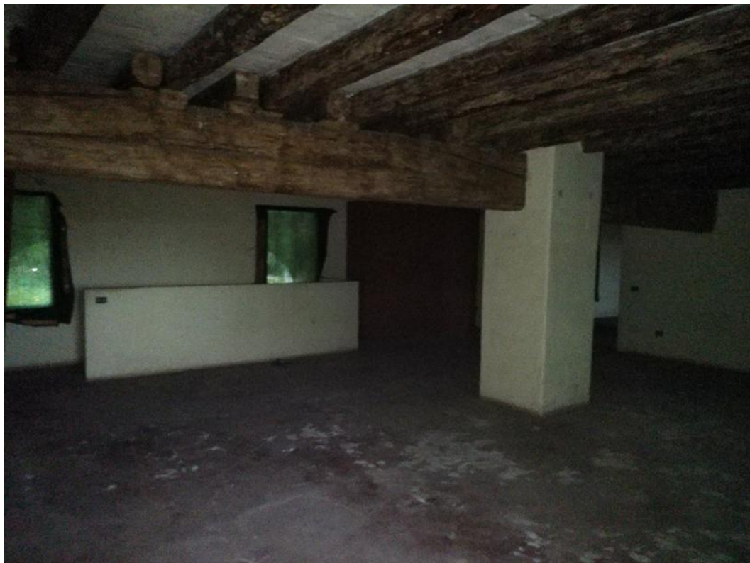
Foto 25 Particolare del magazzino/granaio a P1.