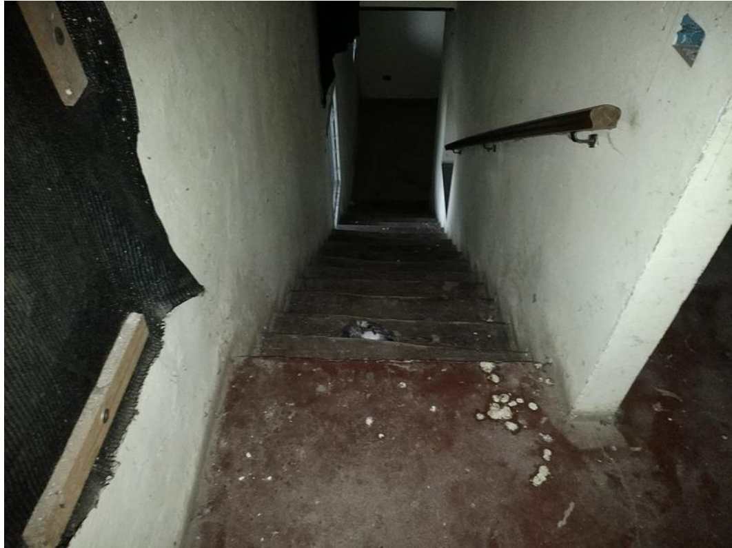
Foto 23 Scorcio della scala di accesso al piano primo.