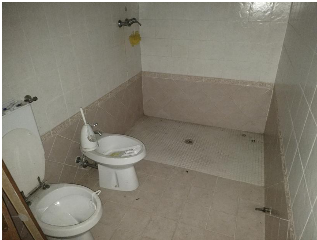
Foto 22 Particolare di un wc ricavato nel magazzino a PT.