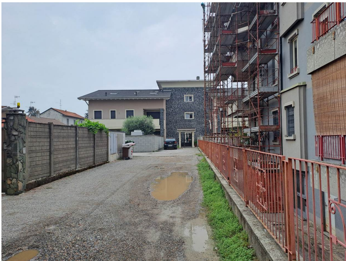
Foto 1 – Vista della strada di accesso. Sullo sfondo la palazzina del civico 21.