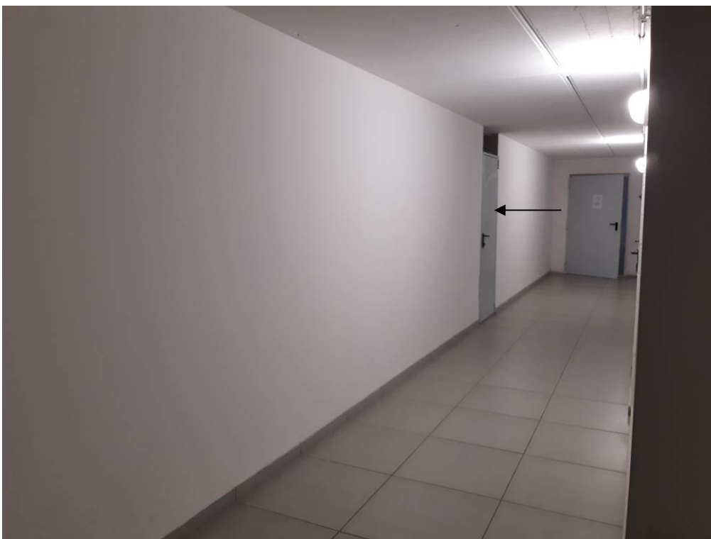
Foto 13 – Il corridoio comune al piano cantine. Indicata dalla freccia la cantina in esame.