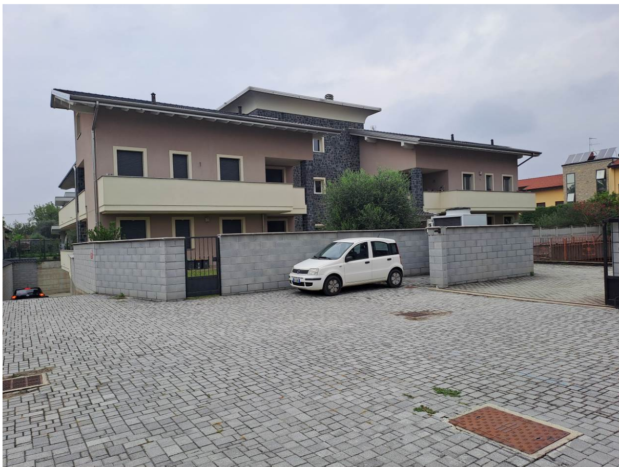
Foto 3 – Altra vista dall'interno del cortile adibito a posti auto.