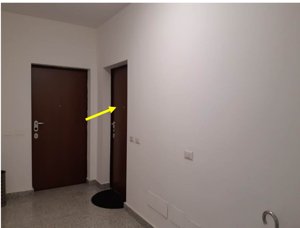
Foto 6 – Il pianerottolo al primo piano. L'appartamento in esame indicato dalla freccia.