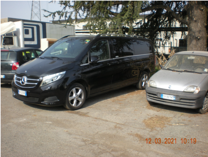
Sub 711 - C/6