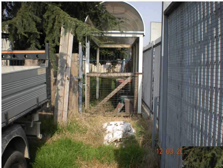
Sub 712 - Area Urbana